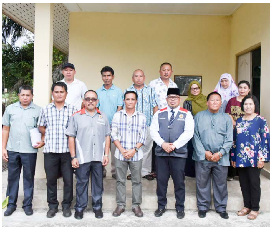
GAMBAR ramai bersama Pemangku Pengarah Penerangan pada Program Sua Muka.

Isu-isu yang disuarakan antaranya berkaitan mengenai penyediaan prasarana, kemudahan awam, aktiviti perekonomian dan hal-hal lain.