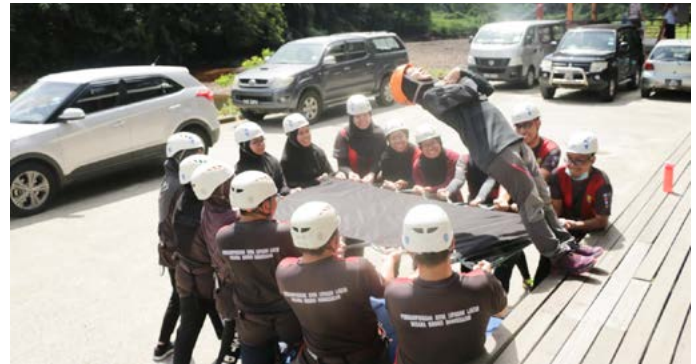
ANTARA aktiviti yang diikuti oleh para peserta program.