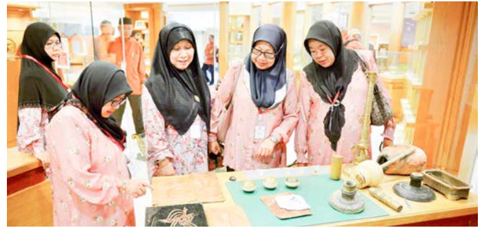
PARA peserta Program Masyarakat Bermaklumat bagi Kampung Pandan 'B', Mukim Kuala Belait semasa membuat lawatan ke Pusat Latihan Kesenian dan Pertukangan Tangan.

maklumat yang jelas untuk diterapkan dalam menangani sebarang permasalahan yang bakal dihadapi oleh anak buah kampung.