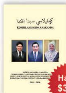
KOMPILASI SABDA ANAKANDA 2011-2016