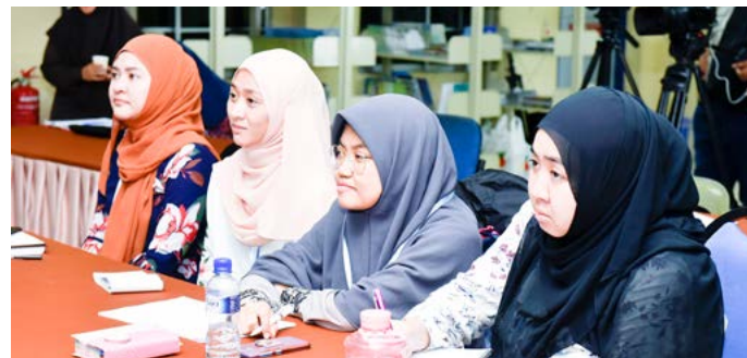
ANTARA peserta Program Perkampungan Sivik Lepas Ijazah semasa hadir mendengarkan taklimat.

TEMBURONG, Isnin, 10 Februari. - Peserta Program Perkampungan Sivik Lepas Ijazah diperingatkan tentang tanggungjawab masing-masing dalam membangunkan Negara Brunei Darussalam dengan sentiasa mematuhi pemerintah dan undang-undang negara, tanpa mengabaikan falsafah Melayu Islam Beraja (MIB) yang menjadi lambang identiti rakyat negara ini.