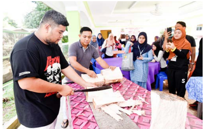
PROSES awal pembuatan ambulung daripada batang pohon rumbia sebagai makanan kegemaran tradisi tempatan hasil keluaran MPK Batu Apoi (atas dan bawah).

Para peserta berkesempatan menyaksikan proses penggaulan bahan-bahan mentah sehingga proses memasak dan pembungkusan di lokasi pembuatan mi yang dilengkapi dengan mesin-mesin bantuan dari kerajaan.