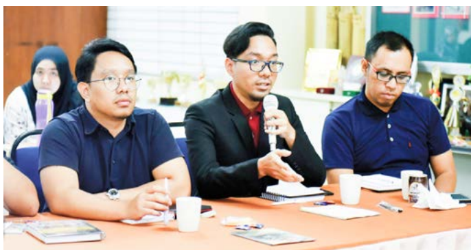
PESERTA Perkampungan Sivik Lepas Ijazah berpeluang mengajukan pertanyaan kepada wakil-wakil agensi yang diundang menyampaikan taklimat pada program tersebut.

Namun, juga diingatkan dalam mengejar wawasan tersebut supaya kita tidak lupa dengan nilai-nilai teras Melayu Islam Beraja yang menjadi pegangan kita selaku rakyat Negara Brunei Darussalam.