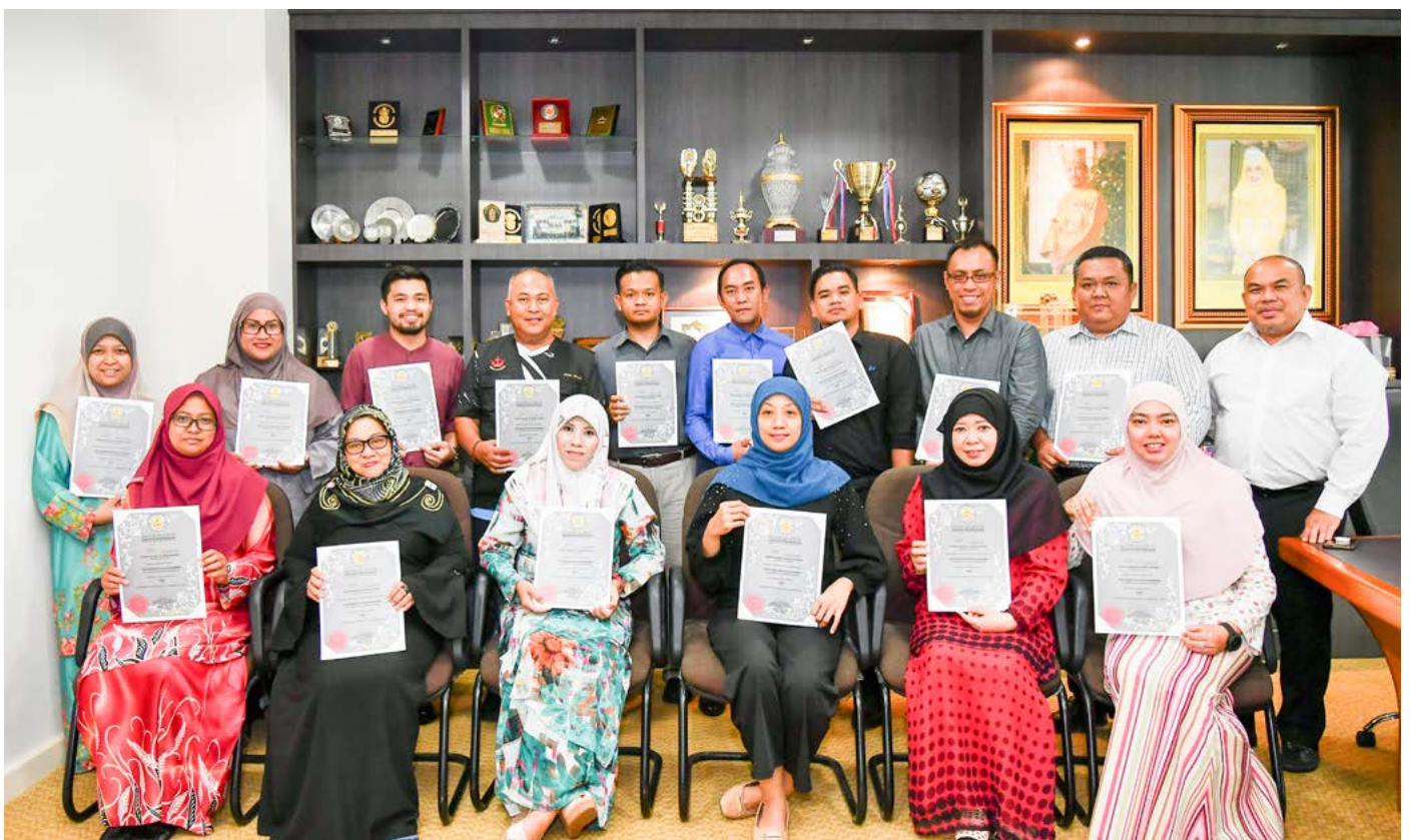
GAMBAR ramai Pemangku Pengarah Penerangan, Awang Mawardi bin Haji Mohammad bersama para peserta yang mengikuti Bengkel Penterjemahan.

Dengan adanya Bengkel Penterjemahan ini, para peserta diharap dapat mengaplikasi ilmu yang diperolehi ke dalam tugas seharian.