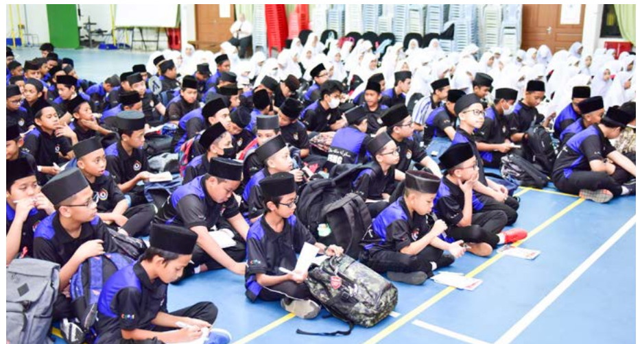
PELAJAR-PELAJAR Sekolah Menengah Menglait semasa menghadiri Jerayawara Kenali ASEAN.

membuat pendedahan meluas mengenai maklumat asas berkaitan ASEAN kepada penuntut-penuntut sekolah menengah di negara ini kerana mereka adalah golongan belia yang bakal mewarisi kesinambungan bangsa dan seterusnya berperanan penting dalam memangkin hala tuju negara ini.