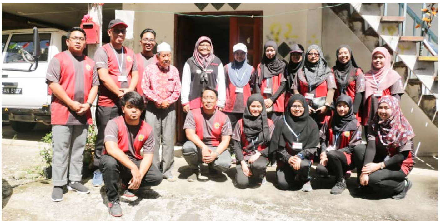
GAMBAR ramai peserta Program Perkampungan Sivik semasa mengendalikan Majlis Penyerahan Sumbangan Derma kepada golongan yang memerlukan bantuan.

Para peserta seterusnya melakukan aktiviti membersihkan tanah perkuburan bertempat di Tanah Perkuburan Islam Semamang, Pekan Bangar, Daerah Temburong dan seterusnya membaca tahlil beramai-ramai.