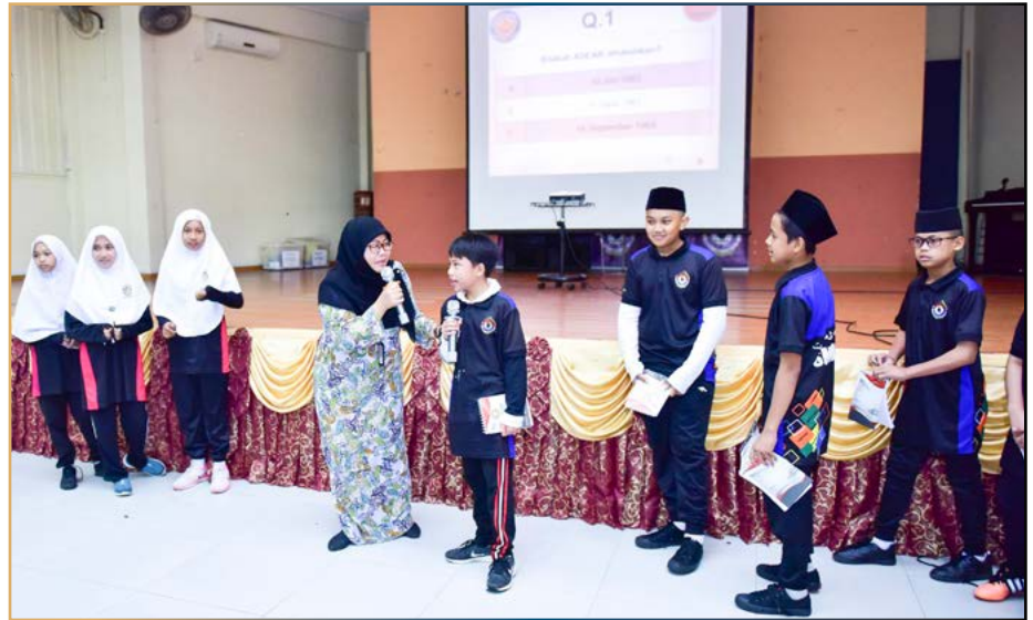
PARA penuntut menjawab soalan kuiz ASEAN yang diajukan.

Ini merupakan salah satu usaha untuk membarigakan serta