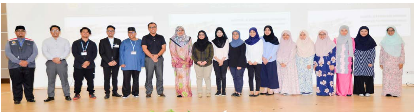
GAMBAR ramai peserta yang mengikuti Program Perkampungan Sivik Lepasan Ijazah Kali Pertama bagi tahun 2020.