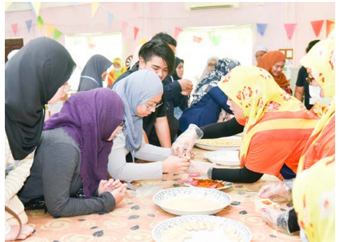
INI pula ialah proses pembuatan karipap mini yang dihasilkan oleh MPK Menengah bertempat di balai raya kampung berkenaan.