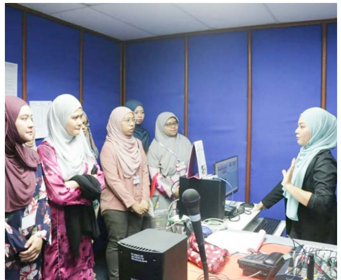
PARA peserta program mendengarkan penerangan semasa melawat ke salah sebuah studio di cawangan RTB di daerah ini.

Di sini, peserta program mendengarkan penerangan daripada pihak Jabatan Radio Televisyen Brunei dan berkesempatan berkunjung ke Studio Radio dan Studio Rampai Pagi sebelum melawat Jambatan Daerah Temburong menuju ke Daerah Brunei dan Muara yang terletak di Kampung Labu Estate, Temburong.