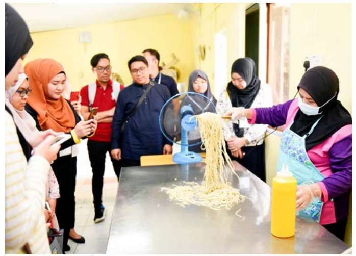
AHLI Biro Wanita MPK Senukoh menunjukkan cara-cara pemprosesan mi kuning.

Melalui pendedahan-pendedahan begini, setiap peserta sentiasa berperanan dalam mendukung matlamat dan aspirasi dengan cara memberikan sumbangan-sumbangan positif dan melibatkan diri secara langsung apatah lagi sebagai seorang yang lebih intelektual, berfikiran matang dan menjadi model insan dalam menjalani kehidupan seharian.