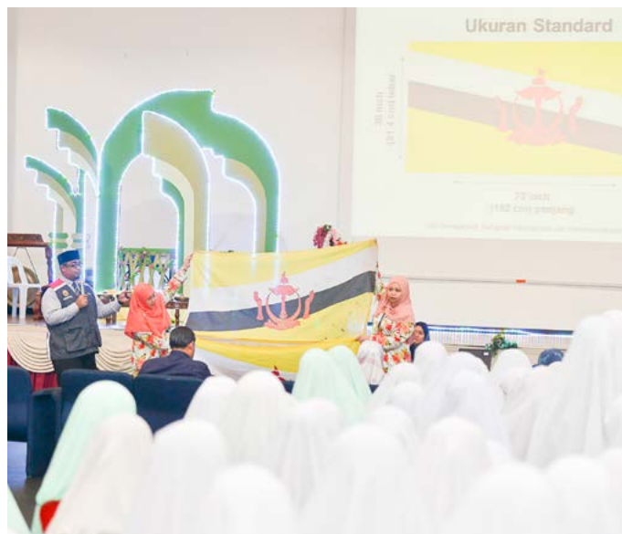
PROGRAM diisikan dengan Taklimat Kenegaraan bertajuk 'Raja Kita, Menghayati Bendera dan Lagu Kebangsaan Negara Brunei Darussalam'.

Program bertujuan untuk memberikan kesedaran sivik dan semangat kenegaraan terutama kepada golongan remaja ke arah pembentukan minda dan moral positif selain sebagai usaha mendekati golongan belia dan remaja di sekolah-sekolah melalui seni hiburan yang terarah dan terpimpin.