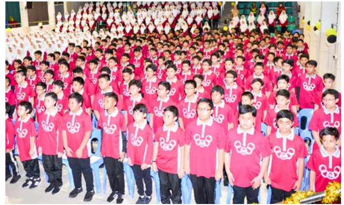
PELAJAR-PELAJAR Maktab Sains Paduka Seri Begawan Sultan yang menghadiri Jerayawara Kenali ASEAN.

Program ini merupakan salah satu usaha berterusan Jabatan Penerangan dalam menyuntik semangat patriotisme dan sifat perpaduan (ASEAN-ness) dalam kalangan penuntut-penuntut dalam sama-sama menghayati fungsi dan tujuan ASEAN ditubuhkan, dalam masa yang sama, ia juga berperanan dalam mengukuhkan hubungan antara Jabatan Penerangan dengan masyarakat khususnya untuk pelajar-pelajar di Negara Brunei Darussalam.