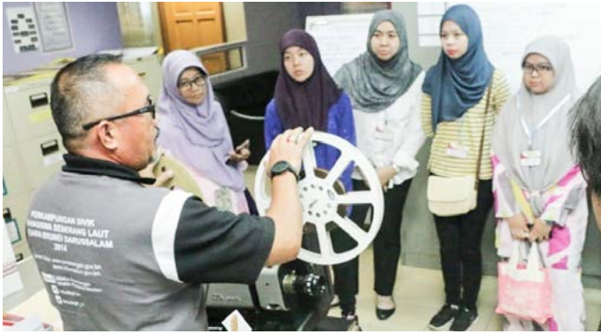
SEMASA lawatan ke cawangan Jabatan Penerangan, para peserta diberikan penerangan mengenai projector, alat yang pernah digunakan sekitar tahun 80-an untuk menayangkan filem-filem lama.