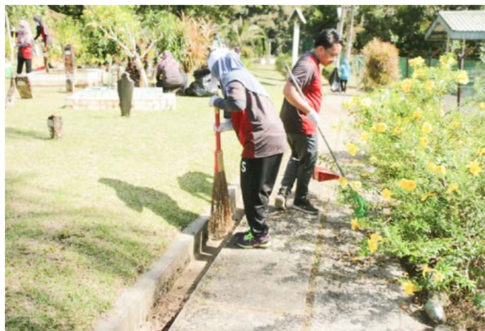
MELAKUKAN kerja amal membersihkan Tanah Perkuburan Islam Semamang, Pekan Bangar antara aktiviti yang dikendalikan.

Sumbangan berbentuk kewangan, barangan keperluan asasi dan juga barang-barang bantuan tersebut dilakukan oleh para peserta program perkampungan.