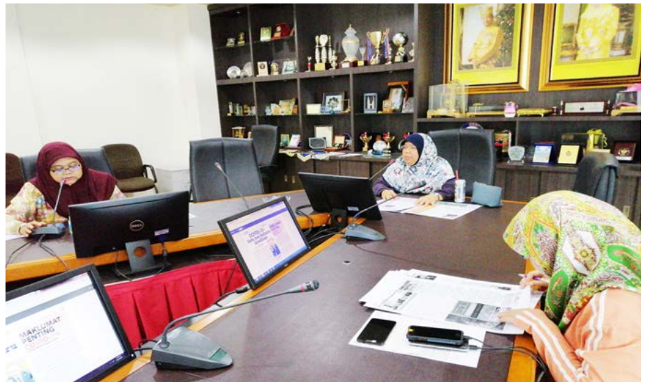
PARA pegawai dari Bahagian Pelita Brunei semasa mengadakan Mesyuarat Penyuntingan (Editorial) bagi mengemas kini gerak kerja di bahagian tersebut (atas dan bawah).

Di Jabatan Penerangan sahaja, langkah waspada sentiasa ditekankan di kalangan warga jabatan di seluruh daerah dengan menjaga kesihatan, kebersihan dan penjarakan sosial semasa mengadakan pelbagai mesyuarat seperti dalam Mesyuarat Jawatankuasa Kecil Penerangan, Jawatankuasa Kerja Media dan Publisiti