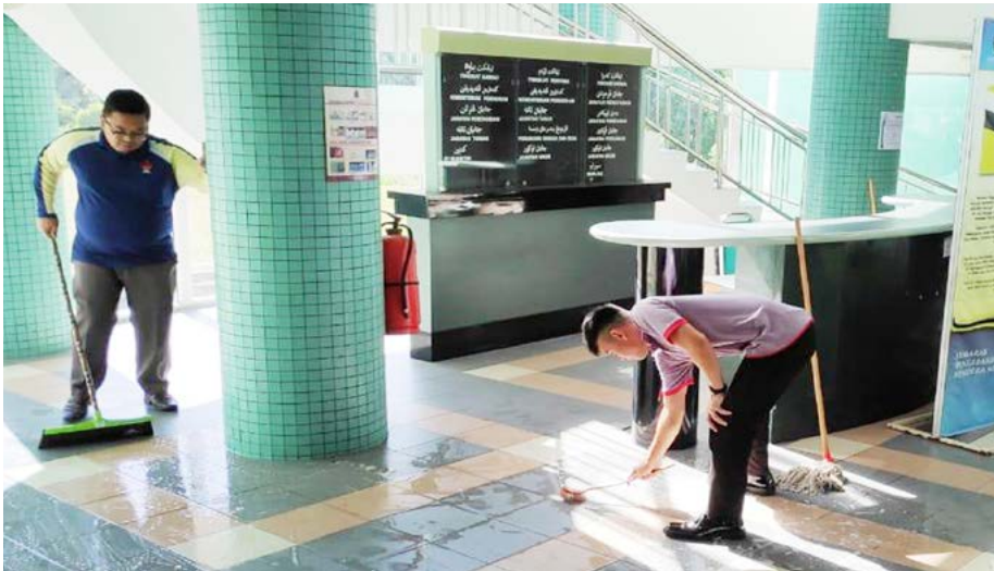
ANTARA langkah yang diambil oleh Cawangan Penerangan Daerah Tutong ialah melaksanakan kempen kebersihan secara intensif dengan membersihkan ruangan pejabat.

Berita dan Foto Ihsan: Cawangan Penerangan Daerah Tutong