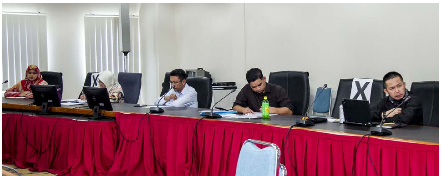
MESYUARAT Jawatankuasa Kecil Penerangan, Jawatankuasa Kerja Media dan Publisiti Sidang Kemuncak ASEAN dan Mesyuarat-mesyuarat Berkaitan Tahun 2021 diadakan seperti biasa dengan mengutamakan kebersihan dan penjarakan sosial.

rawatan antiviral tertentu untuk merawat virus ini selain usaha mengurangkan simptom dan terapi sokongan. Langkah-langkah pencegahan yang disyorkan termasuk membasuh tangan, menutup mulut apabila batuk, mengekalkan jarak dari orang lain (terutamanya mereka yang tidak sihat) serta pemantauan dan pengasingan diri selama 14 hari untuk orang yang mengesyaki mereka dijangkiti.