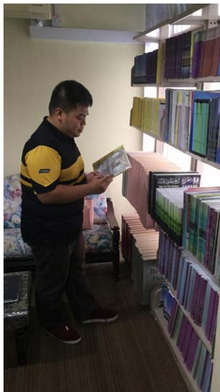
KEMUDAHAN yang disediakan ini memudahkan orang ramai khususnya para pelajar membuat rujukan daripada pelbagai buku kompilasi terbitan Jabatan Penerangan.