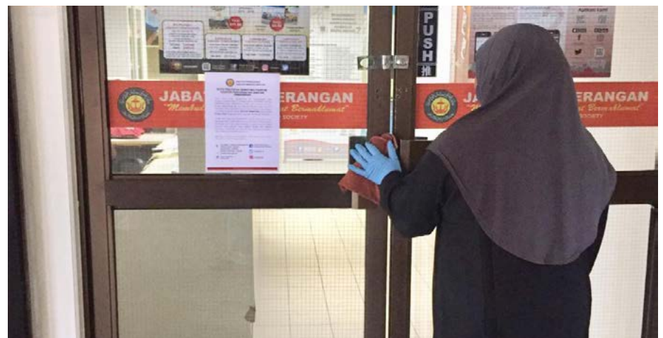
CAWANGAN Penerangan Daerah Belait turut mengambil langkah waspada bagi menangani jangkitan COVID-19 dengan membersihkan pintu-pintu masuk.

Di antara langkah-langkah yang diambil termasuklah memaklumkan kepada pengetua sekolah, penghulu dan ketua kampung mengenai dengan penangguhan program-program dalam perancangan, terutama sekali program-program yang dirancang pada bulan Mac dan April 2020, menyediakan thermometer dan hand sanitizer di kaunter Cawangan Penerangan Daerah Belait, membersihkan dan menyuci tangan dengan menggunakan pencuci anti-bacterial pada kaunter, ruang kerja, tombol-tombol pintu,