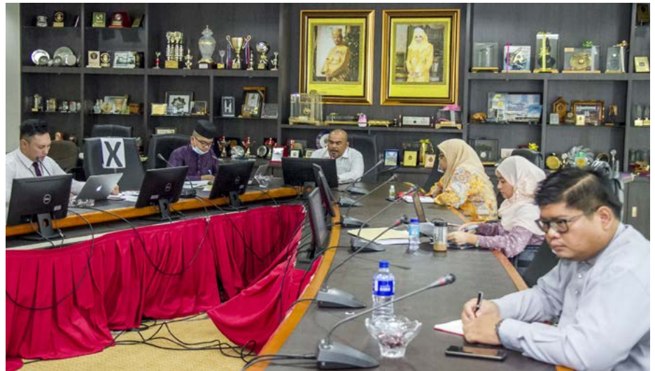
DI Jabatan Penerangan, langkah waspada sentiasa ditekankan dalam kalangan warga jabatan seluruh cawangan dengan mengamalkan kebersihan dan penjarakan sosial termasuk semasa mengadakan pelbagai mesyuarat.

Berita: Unit Penerbitan Melayu