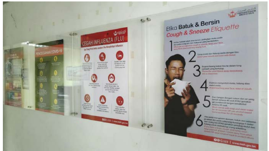
GAGANG pintu di tempat laluan utama orang ramai yang berurusan juga sentiasa dibersihkan bagi mengelakkan risiko jangkitan selain poster-poster maklumat berkaitan COVID-19 bagi membarigakan maklumat-maklumat berkaitan.

kesejahteraan orang awam, memelihara pekerjaan yang ada dan memberi sokongan kepada setiap individu serta mendukung dan membantu perniagaan.