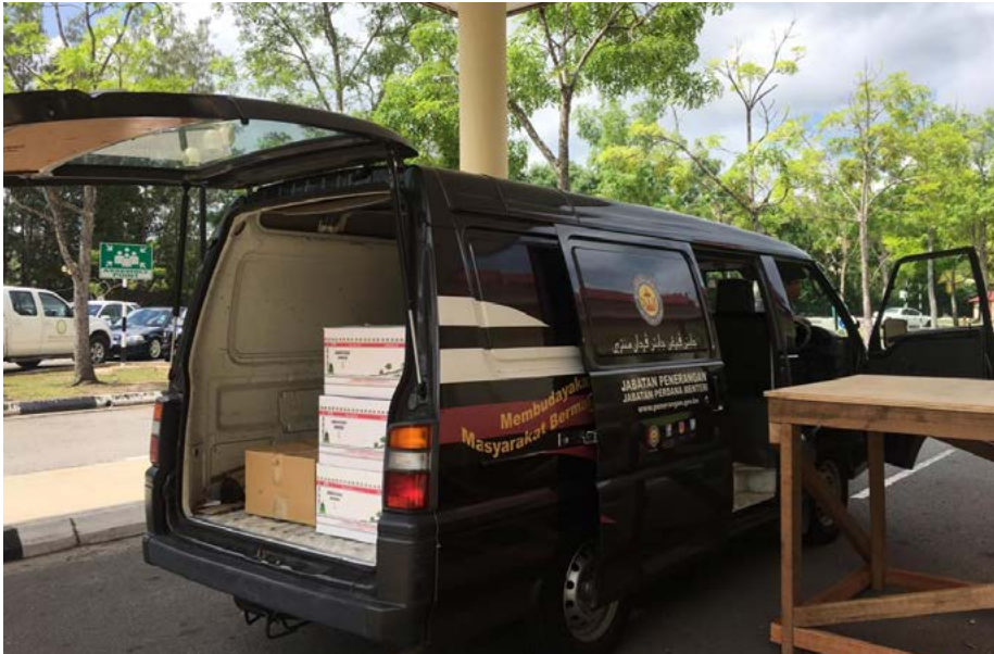
JABATAN Penerangan mula menerima Kurma Kurnia Peribadi Kebawah Duli Yang Maha Mulia daripada pihak YSHHB yang berpusat di Pusat Persidangan Antarabangsa Berakas pada 22 April 2020.

Sementara itu orang ramai dan penduduk kampung yang tidak mendaftar melalui aplikasi dalam talian atau tidak mempunyai akses kepada internet, YSHHB juga menyediakan borang khas yang diedarkan melalui ketua-ketua kampung di seluruh negara untuk