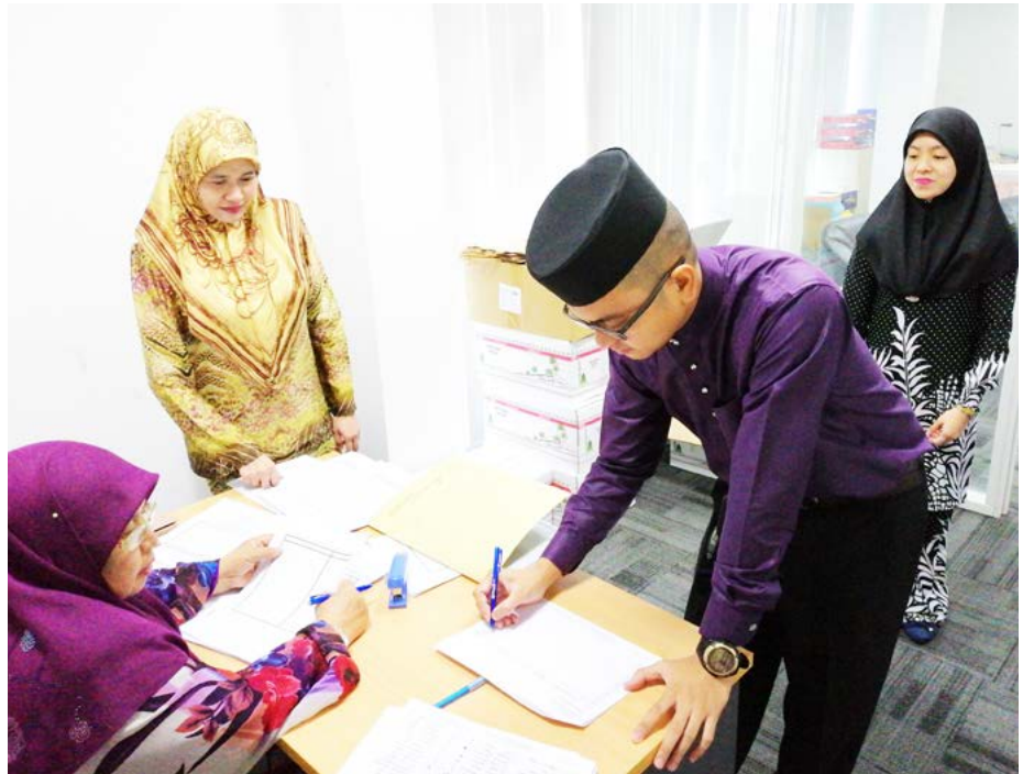
ANTARA warga Jabatan Penerangan semasa menerima Kurma Kurnia Peribadi Kebawah Duli Yang Maha Maha Mulia Paduka Seri Baginda Sultan dan Yang Di-Pertuan Negara Brunei Darussalam dengan mematuhi saranan penjarakan sosial bagi mengelak jangkitan COVID-19 (atas dan bawah).

Melalui pengagihan mudah alih ini ia diharap dapat bertindak sebagai platform untuk pendaftaran secara dalam talian ( online ) dan memberikan kemudahan kepada rakyat dan penduduk beragama Islam untuk menerima agihan buah kurma, membolehkan YSHHB menentukan jumlah pembelian kurma, mengelakkan duplikasi di kalangan para penerima yang berhak, memberikan kemudahan pendaftaran dengan menggunakan telefon atau komputer melalui laman sesawang yang disediakan masing-masing bagi pengguna IOS dan Android untuk dua jenis