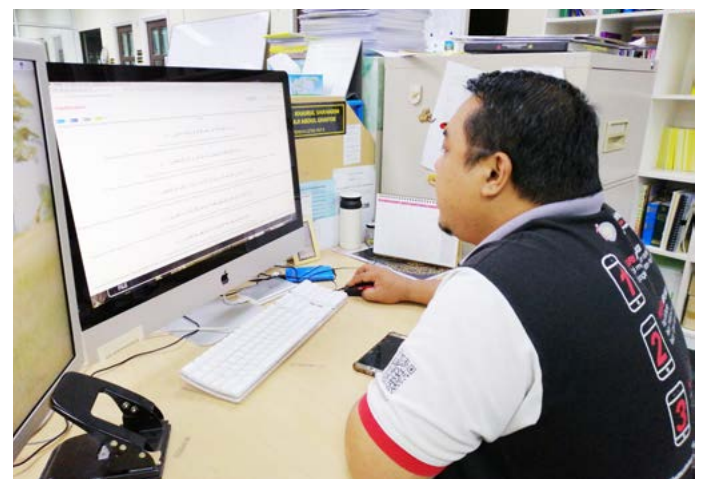
BAGI mengelakkan daripada perkumpulan secara beramai-ramai bacaan Al-Quran juga dilakukan di bahagian atau unit masing-masing melalui bacaan dalam talian atau 'online'.

Dalam apa jua keadaan, bacaan Al-Quran akan terus dipraktikkan dan menjadi amalan yang amat berharga bagi setiap umat Islam di bulan yang penuh rahmat ini.