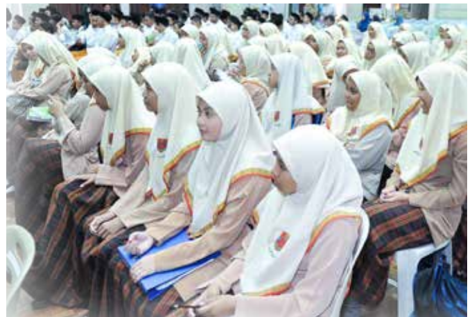
ANTARA penuntut perempuan yang menghadiri taklimat berkenaan.