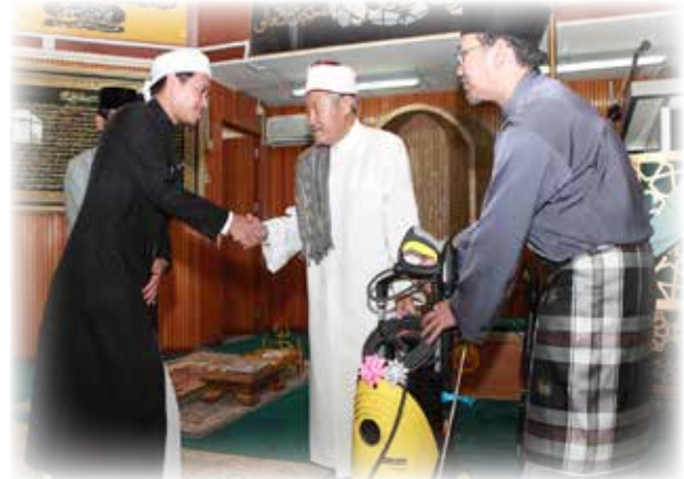
YANG Berhormat Mufti Kerajaan menyampaikan sumbangan wakaf berupa alat pembersih tekanan tinggi jet air kepada Imam Masjid Kampung Pulaie.

Dari Masjid Kampung Pulaie, majlis seumpamanya akan diteruskan ke beberapa buah masjid di bulan Ramadan ini dan akan terus disemarakkan bagi sama-sama mendapatkan ganjaran pahala dan keberkatan daripada Allah Subhanahu Wata'ala.