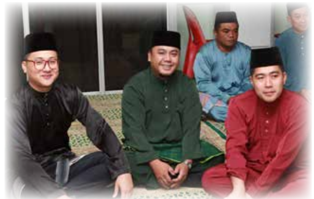
ANTARA pegawai dan kakitangan Jabatan Penerangan yang hadir menyertai Majlis Tadarus Jabatan Perdana Menteri, berlangsung di Masjid Kampung Pulaie.