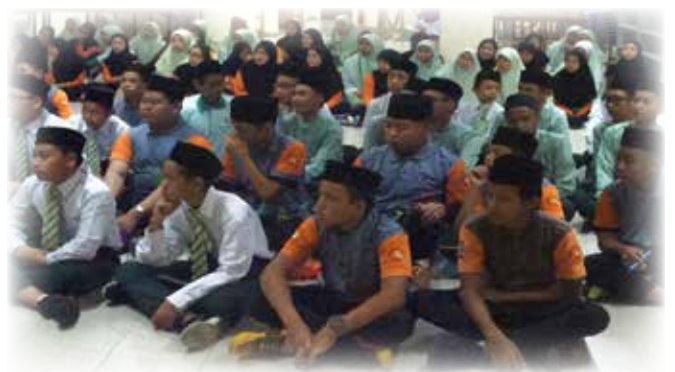
ANTARA pelajar Tahun 8 dari Sekolah Menengah Rimba II yang mendengarkan taklimat tersebut.