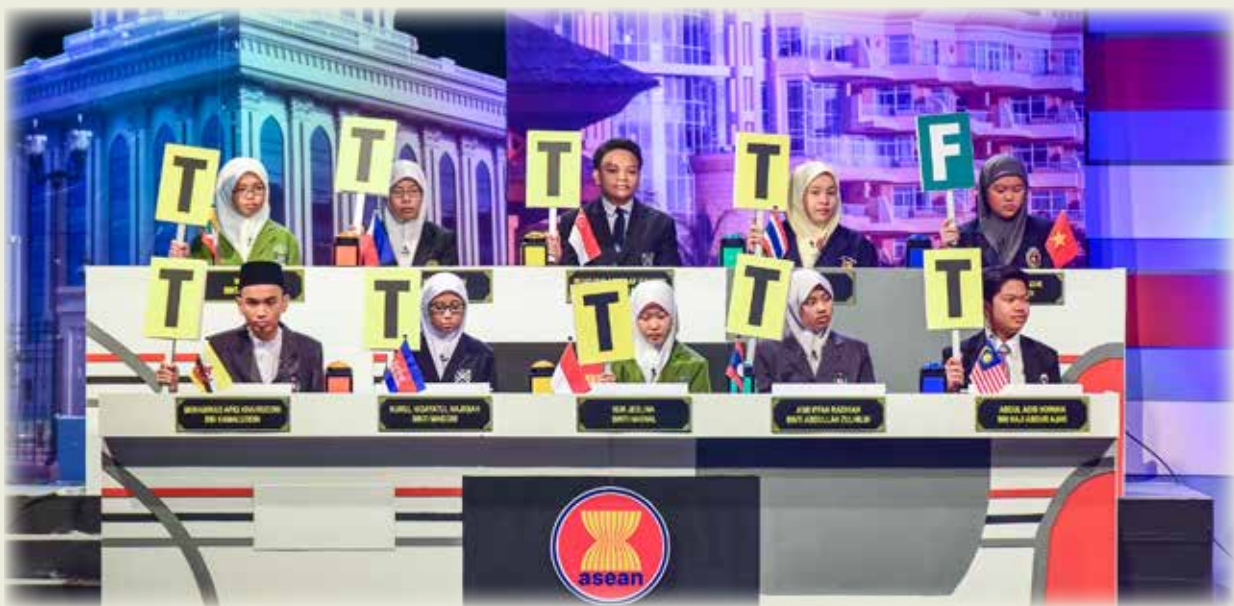
SEBAHAGIAN dari peserta dalam Pertandingan Kuiz ASEAN Peringkat Negara Kali Ke-7, 2016.

Kuiz ASEAN Peringkat Serantau buat pertama kalinya diadakan pada tahun 2002 di Thailand.