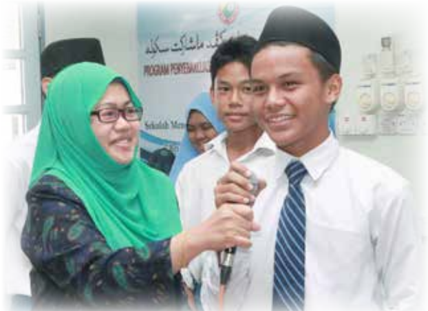
ANTARA penuntut yang mengikuti Kuiz Kenegaraan.