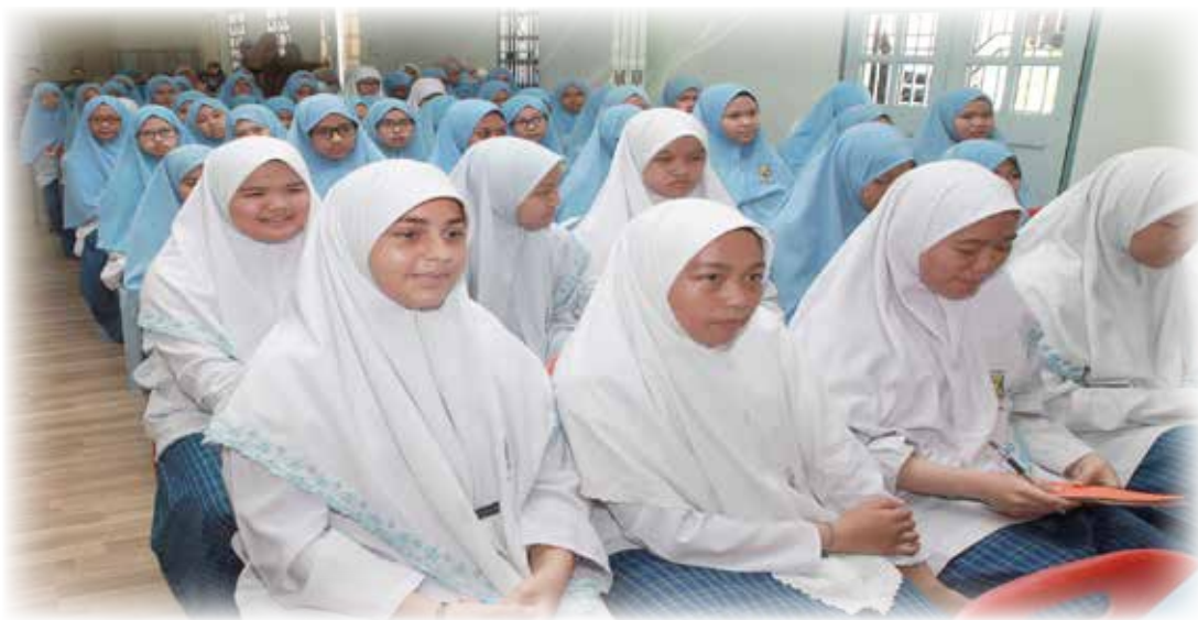
SEBAHAGIAN daripada penuntut yang hadir pada taklimat tersebut.