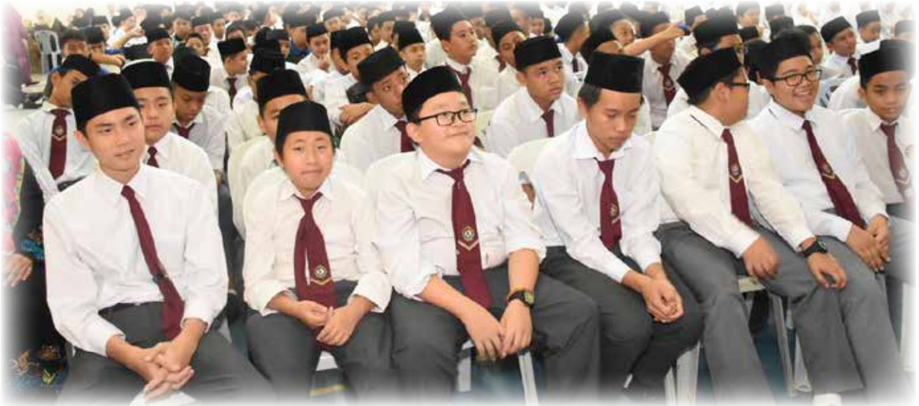
DI ANTARA yang hadir menyaksikan pelajar dari Tahun 8, 9 dan 10.