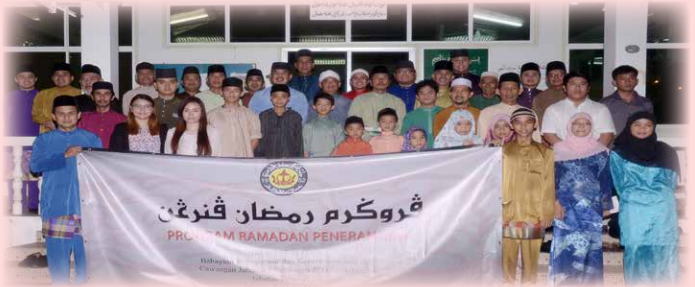
PROGRAM Ramadan Penerangan merupakan aktiviti tahunan Jabatan Penerangan yang dilaratkan hingga ke empat-empat daerah sempena bulan Ramadan yang مبارak.

Oleh: Aimi Sani