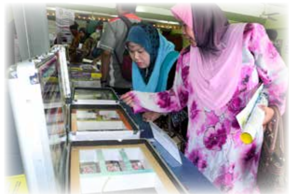
PAMERAN mengenai penyalahgunaan dadah juga turut diketengahkan.