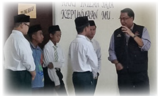
ANTARA pelajar yang mengikuti kuiz pada sesi taklimat tersebut.

Antara objektif Program Taklimat Kenegaraan ini diadakan bagi mengoptimumkan penghayatan dan pemahaman khususnya dalam kalangan para penuntut terhadap lagu kebangsaan dan bendera negara ke arah kesedaran hidup berbangsa, bernegara dan beragama yang berdasarkan falsafah negara Melayu Islam Beraja (MIB).