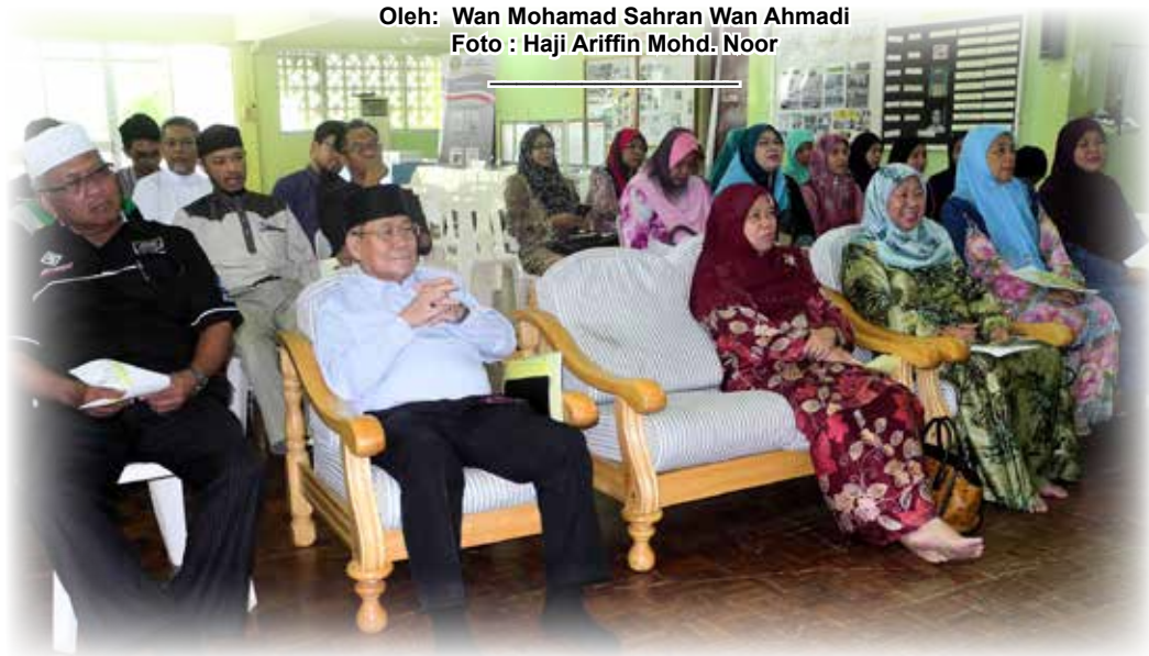
PROGRAM Awasi Anak Kitani anjuran Jabatan Penerangan dengan kerjasama Biro Kawalan Narkotik diadakan di Madrasah Masjid Setia Ali, Kampung Sabun, Pekan Muara.

Oleh: Wan Mohamad Sahran Wan Ahmadi