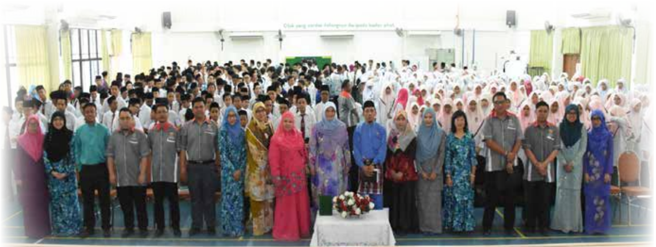
WARGA Sekolah Menengah Menglait Gadong bersama-sama para pegawai dari Jabatan Penerangan dalam sesi bergambar ramai seurus selepas Program Rakan Remaja (RRP).