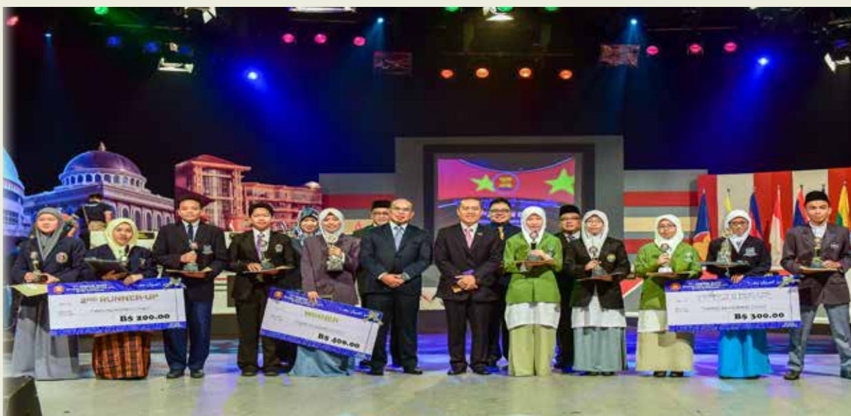
DI ANTARA pemenang dalam Pertandingan Kuiz ASEAN Peringkat Negara Kali Ke -7, 2016 bersama Pengerusi acara dan tetamu-tetamu kehormat yang hadir.