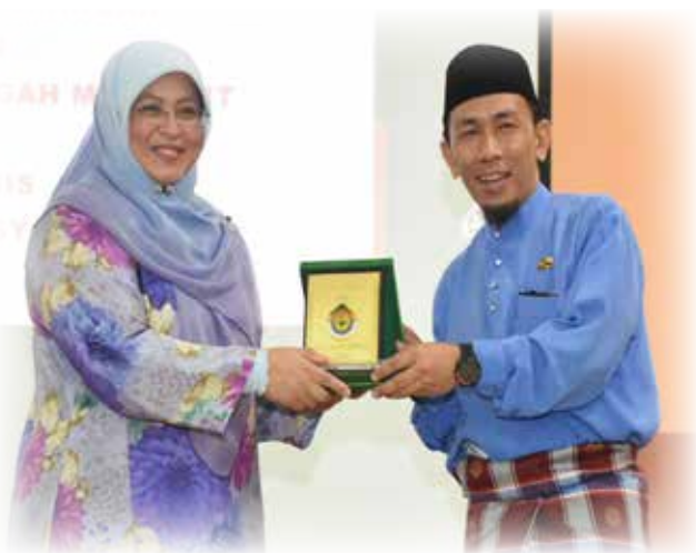
PENYAMPAIAN cenderahati kepada tetamu kehormat majlis.

Tetamu kehormat seterusnya dijemput untuk menyampaikan hadiah kepada lima penuntut yang berjaya menjawab kuiz berkenaan, diikuti dengan penyampaian cenderahati kepada tetamu kehormat dan pengetua sekolah tersebut.