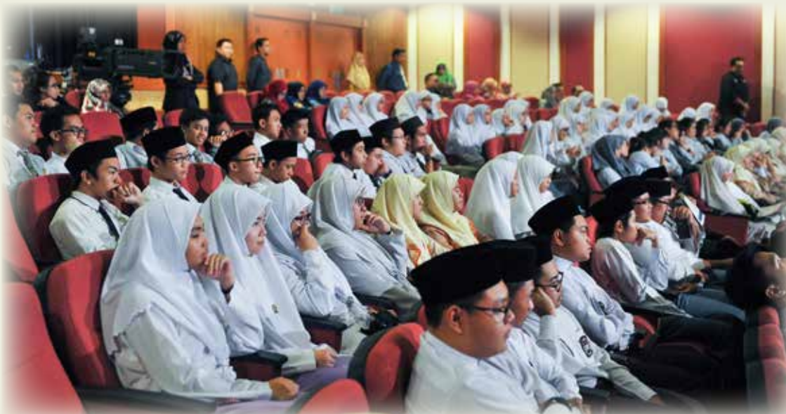
ANTARA penonton yang hadir menyaksikan Pertandingan Kuiz ASEAN termasuk pelajar-pelajar dari sekolah-sekolah dan maktab-maktab di negara ini.