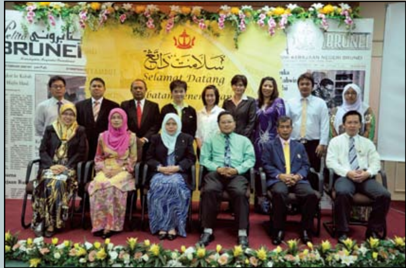
Rombongan pegawai-pegawai Malaysia dan Thailand bergambar ramai bersama pegawai-pegawai Jabatan Penerangan.

Antara atur cara lawatan kerja delegasi tersebut ialah menyaksikan persembahan Pentarama di Daerah Belait, menyaksikan Majlis Bersama Rakyat Daerah Brunei-Muara sempena Hari Keputeraan