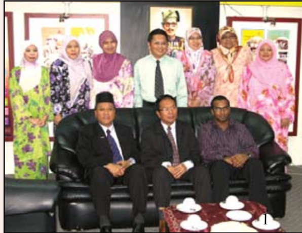
Bergambar kenangan bersama Pengarah Penerangan ketika berkunjung ke Jabatan Penerangan.

Semasa berada di sini rombongan juga dibawa melawat ke Balai Pameran Islam Sultan Haji Hassanal Bolkhiah di Jabatan Mufti Kerajaan, ke Pusat Promosi Kesihatan di Jalan Commonwealth Drive, Bangunan Alat-alat Kebesaran Diraja dan dibawa bersiar di sekeliling Kampung Ayer dan sekitar Bandar Seri Begawan.