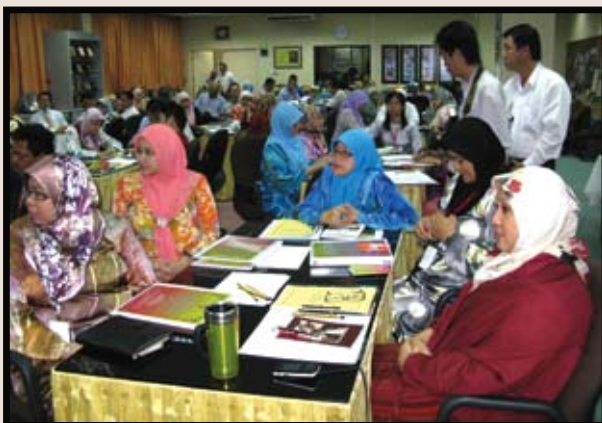
Sebahagian daripada peserta yang mengikuti Bengkel Adat Istiadat sedang mendengar ceramah yang disampaikan oleh penceramah Jabatan Adat Istiadat.