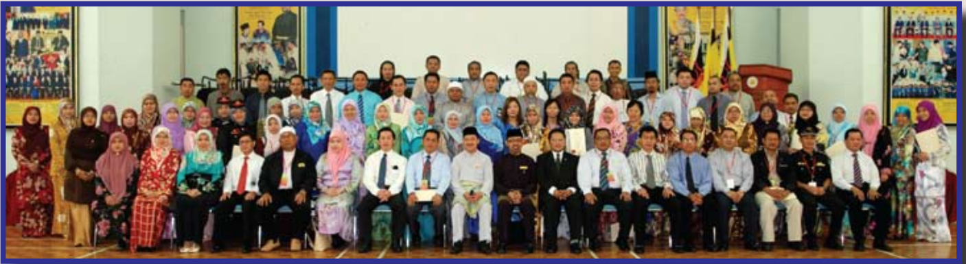
Para peserta bergambar ramai bersama penceramah-penceramah jemputan Bengkel Adat Istiadat dan Pengarah Penerangan.

Seramai 48 orang Pengamal-pengamal Media Tempatan dan Pegawai Perhubungan Awam Kementerian-kementerian dan Jabatan-jabatan Kerajaan telah mengikuti Bengkel Adat Istiadat bagi Pegawai Perhubungan Awam (PRO), Pegawai Penghubung Media (MRO), Pengamal Media Tempatan dan pegawai serta kakitangan Jabatan Penerangan anjuran Jabatan Penerangan.