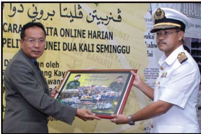
Pengarah Penerangan, Dr. Haji Muhammad Hadi bin Muhammad Melayong menyempurnakan penyerahan poster kepada wakil anggota beruniform (atas kiri dan kanan) dan kepada wakil kementerian dan jabatan kerajaan (kiri).

Pada tahun ini, pihak Jabatan Penerangan telah mencetak sebanyak 1,000 keping poster yang akan diagih-agihkan di keempat-empat daerah melalui kementerian-kementerian dan jabatan-jabatan kerajaan.