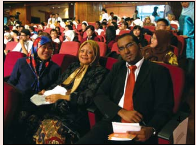
Rombongan wakil dari Malaysia ketika menghadiri Peraduan Pidato yang berlangsung di Dewan Raya, Radio Televisyen Brunei.