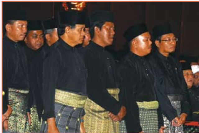
Sebahagian daripada pegawai dan kakitangan Jabatan Penerangan yang dikurniakan Pingat-pingat Kehormatan Negara Brunei Darussalam yang disempurnakan oleh Duli Yang Teramat Mulia Paduka Seri Pengiran Muda Mahkota Pengiran Muda Haji Al-Muhtadee Billah, Menteri Kanan di Jabatan Perdana Menteri.

Istiadat Pengurniaan Pingat-pingat Kehormatan Negara Brunei Darussalam sempena ulang tahun Hari Keputeraan Kebawah Duli Yang Maha Mulia Paduka Seri Baginda Sultan dan Yang Di-Pertuan Negara Brunei Darussalam Ke -62 telah berlangsung pada 23 Mac di Balai Singgahsana Indera Kencana, Istana Nurul Iman.