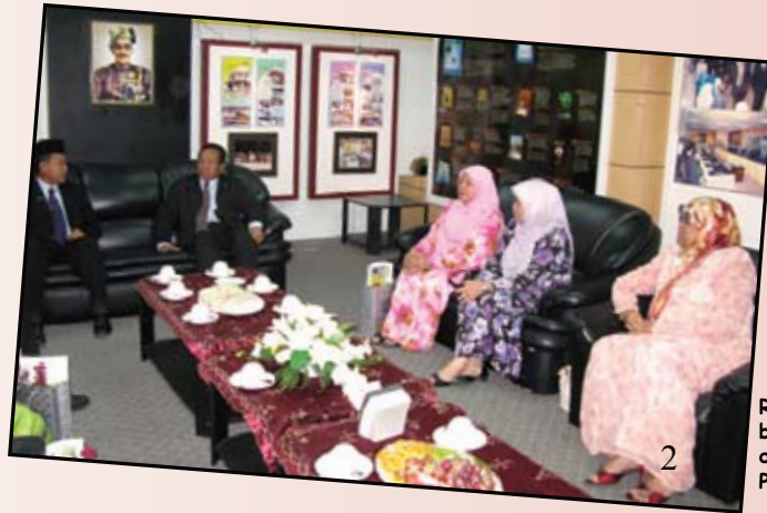
Rombongan beramah mesra bersama Pengarah Penerangan dan pegawai-pegawai Jabatan Penerangan.