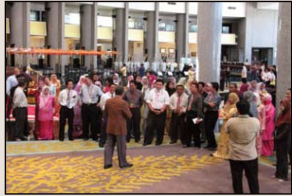
Para peserta bengkel diberi taklimat semasa melawat ke Bangunan Alat-alat Kebesaran Diraja.