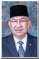
Yang Berhormat Pehin Orang Kaya Laila Setia Datu Seri Setia Awang Haji Abdul Rahman bin Haji Ibrahim, MENTERI DI JABATAN PERDANA MENTERI DAN MENTERI KEWANGAN II (KEDUA).