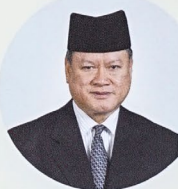
Yang Berhormat Pehin Orang Kaya Pekerma Dewa Dato Seri Setia Awang Lim Jock Seng, Menteri Hal Ehwal Luar Negeri dan Perdagangan II (Kedua)