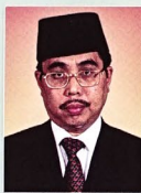
Yang Berhormat Pehin Orang Kaya Johan Pahlawan Dato Seri Setia Awang Haji Adanan bin Begawan Pehin Siraja Khatib Dato Seri Setia Awang Haji Mohd Yusof, MENTERI KESIHATAN