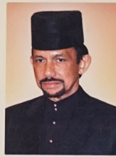
Kebawah Duli Yang Maha Mulla Paduka Seri Baginda Sultan Haji Hassanal Bolkiah Mu'izzaddin Waddaulah, Sultan dan Yang Di-Pertuan Negara Brunei Darussalam, Perdana Menteri, Menteri Pertahanan dan Menteri Kewangan