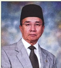
YANG Berhormat Pehin Orang Kaya Seri Leto Dato Seri Setia Haji Awang Abdul Rahman bin Dato Setia Haji Mohamed Taib, Menteri Pendidikan