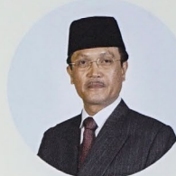
Yang Berhormat Pehin Orang Kaya Seri Kerna Dato Seri Setia Haji Awang Abu Bakar bin Haji Apong, Menteri Perhubungan