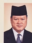
Yang Berhormat Pehin Orang Kaya Perkerma Dewa Dato Seri Setia Awang Lim Jock Seng, Menteri Hal Ehwal Luar Negeri dan Perdagangan II (Kedua)