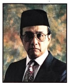
Yang Berhormat Pehin Orang Kaya Setia Pahlawan Dato Seri Setia Awang Haji Abdul Rahman bin Dato Setia Haji Muhammad Taib, Menteri Perindustrian dan Sumber-Sumber Utama