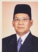
Yang Berhormat Pehin Orang Kaya Indera Pahlawan Dato Seri Setia Awang Haji Suyoi bin Haji Osman, Menteri Kesihatan