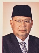
Yang Berhormat Pehin Orang Kaya Hamzah Pahlawan Dato Seri Setia Awang Haji Abdullah bin Begawan Mudim Dato Paduka Haji Abu Bakar, Menteri Pembangunan