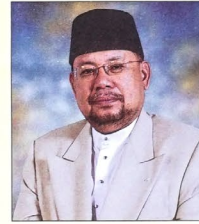
YANG Berhormat Pehin Orang Kaya Hamzah Pahlawan Dato Paduka Haji Awang Abdullah bin Begawan Mudim Dato Paduka Haji Bakar, Menteri Pembangunan