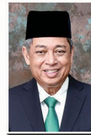
Yang Berhormat Pehin Datu Singamanteri Kolonel (Bersara) Datu Seri Setia (Dr.) Awang Haji Mohammed Yamin bin Haji Umar, MENTERI TENAGA (ENERGY) DAN PERINDUSTRIAN DI JABATAN PERDANA MENTERI.