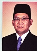
Yang Berhormat Pehin Orang Kaya Indera Pahlawan Dato Seri Setia Awang Haji Suyoi bin Haji Osman, MENTERI PEMBANGUNAN