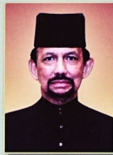
Kebawah Duli Yang Maha Mulia Paduka Seri Baginda Sultan Haji Hassanal Bolkiah Mu'izzaddin Waddaulah Ibni Al-Marhum Sultan Haji Omar 'Ali Saifuddien Sa'adul Khairi Waddien, Sultan dan Yang Di-Pertuan Negara Brunei Darussalam, PERDANA MENTERI, MENTERI PERTAHANAN DAN MENTERI KEWANGAN