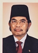
Yang Berhormat Pehin Orang Kaya Setia Pahlawan Dato Seri Setia Dr. Awang Haji Ahmad bin Haji Jumat, Menteri Kebudayaan Belia dan Sukan