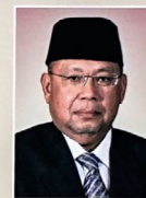
Yang Berhormat Pehin Orang Kaya Hamzah Pahlawan Dato Seri Setia Awang Haji Abdullah bin Begawan Mudim Dato Paduka Haji Bakar, MENTERI PERHUBUNGAN