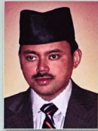
Duli Yang Teramat Mulia Paduka Seri Pengiran Muda Mahkota Pengiran Muda Haji Al-Muhtadee Billah Ibni Kebawah Duli Yang Maha Mulia Paduka Seri Baginda Sultan Haji Hassanal Bolkiah Mu'izzaddin Waddaulah, MENTERI KANAN DI JABATAN PERDANA MENTERI