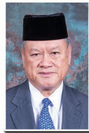
Yang Berhormat Pehin Orang Kaya Pekerna Dowa Datu Seri Setia Lim Jock Seng, MENTERI DI JABATAN PERDANA MENTERI DAN MENTERI HAL EHWAL LUAR NEGERI DAN PERDAGANGAN II (KEDUA).