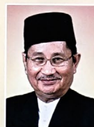
Yang Berhormat Pehin Udana Khatib Dato Paduka Seri Setia Ustaz Haji Awang Badaruddin bin Pengarah Dato Paduka Haji Othman, MENTERI HAL EHWAL DALAM NEGERI