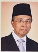
Yang Berhormat Pehin Orang Kaya Seri Lela Dato Seri Setia Awang Haji Abdul Rahman bin Dato Setia Haji Mohamed Taib, Menteri Pendidikan