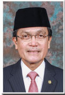
Yang Berhormat Pehin Orang Kaya Seri Kerna Datu Seri Setia (Dr.) Haji Awang Abu Bakar bin Haji Apong, MENTERI HAL EHWAL DALAM NEGERI.