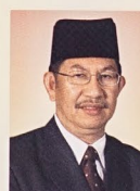
Yang Berhormat Pehin Orang Kaya Laila Setia Dato Seri Setia Awang Haji Abdul Rahman bin Haji Ibrahim, Menteri Kewangan II (Kedua)