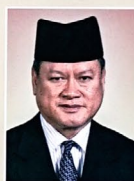
Yang Berhormat Pehin Orang Kaya Pekerma Dewa Dato Seri Setia Lim Jock Seng, MENTERI HAL EHWAL LUAR NEGERI DAN PERDAGANGAN II (KEDUA)