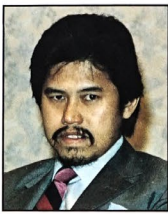
Duli Yang Teramat Mulia Paduka Seri Pengiran Perdana Wazir Sahibul Himmah Wal Waqar Pengiran Muda Haji Mohamed Bolkiah bin Almarhum Sultan Haji Omar 'Ali Saifuddin Sa'adul Khairi Waddien, Menteri Hal Ehwal Luar Negeri