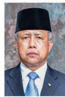
Yang Berhormat Pehin Datu Lallaraja Mejar Jeneral (Bersara) Datu Paduka Seri Haji Awang Helbi bin Haji Mohd Yusoff, MENTERI KEBUDAYAAN, BELIA DAN SUKAN.