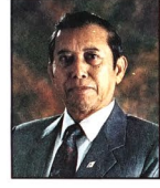
Yang Berhormat Pehin Jawatan Luar Pekerna Raja Dato Seri Paduka Haji Awang Hussain bin Pehin Orang Kaya Di-Gadong Seri Diraja Dato Laila Utama Haji Awang Muhammad Yusof, Menteri Kebudayaan, Belia dan Sukan