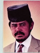
Duli Yang Teramat Mulia Paduka Seri Pengiran Perdana Wazir Sahibul Himmah Wal-Waqar Pengiran Muda Mohamed Bolkiah Ibni Al-Marhum Sultan Haji Omar 'Ali Saifuddien Sa'adul Khairi Waddien, MENTERI HAL EHWAL LUAR NEGERI DAN PERDAGANGAN