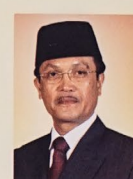
Yang Berhormat Pehin Orang Kaya Seri Kerna Dato Seri Setia Dr. Haji Awang Abu Bakar bin Haji Apong, Menteri Perhubungan