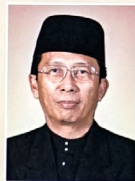
Yang Berhormat Pengiran Dato Seri Setia Dr. Haji Mohammad bin Pengiran Haji Abdul Rahman, MENTERI HAL EHWAL UGAMA