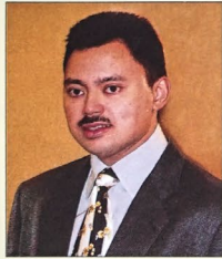
DULI Yang Teramat Mulia Paduka Seri Pengiran Muda Mahkota Pengiran Muda Haji Al-Muhtadee Billah, Menteri Kanan di Jabatan Perdana Menteri