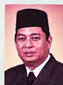
Yang Berhormat Pehin Datu Singamanteri Kolonel (Bersara) Dato Seri Paduka Awang Haji Mohammad Yasmin bin Haji Umar, MENTERI TENAGA (MINISTER OF ENERGY) DI JABATAN PERDANA MENTERI