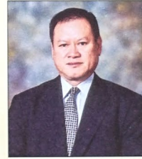
YANG Berhormat Pehin Orang Kaya Pekerma Dewa Dato Seri Paduka Lim Jock Seng, Menteri Hal Ehwal Luar Negeri II (Kedua)