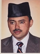
Duli Yang Teramat Mulla Paduka Seri Pengiran Muda Mahkota Pengiran Muda Haji Al-Muhtadee Billah, Menteri Kanan di Jabatan Perdana Menteri