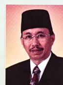
Yang Berhormat Pehin Orang Kaya Pekerma Laila Diraja Dato Paduka Awang Haji Hazair bin Haji Abdullah, MENTERI KEBUDAYAAN, BELIA DAN SUKAN