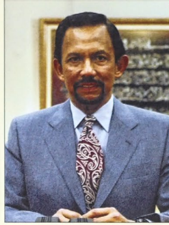
KEBAWAH Duli Yang Maha Mulia Paduka Seri Beginda Sultan Haji Hassanal Bolkiah Mu'izzaddin Waddaulah, Sultan dan Yang Di-Pertuan Negara Brunei Darussalam, Perdana Menteri, Menteri Pertahanan dan Menteri Kewangan