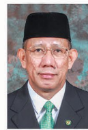
Yang Berhormat Datu Seri Setia Awang Haji Mustappa bin Haji Sirat, MENTERI PERHUBUNGAN.