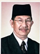
Yang Berhormat Pehin Orang Kaya Laila Setia Dato Seri Setia Awang Haji Abdul Rahman bin Haji Ibrahim, MENTERI KEWANGAN II (KEDUA) DI JABATAN PERDANA MENTERI