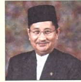
YANG Berhormat Pehin Udana Khatib Dato Paduka Seri Setia Ustaz Haji Awang Badaruddin bin Pengarah Dato Paduka Haji Othman, Timbalan Menteri Hal Ehwal Ugama