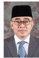
Yang Berhormat Datu Seri Setia Dr. Awang Haji Zulkarnain bin Haji Hamat, MENTERI KESIHATAN.