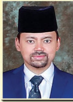
Duli Yang Teramat Mulia Paduka Seri Pengiran Muda Mahkota Pengiran Muda Haji Al-Muhtadee Billah ibni Kebawah Duli Yang Maha Mulia Paduka Seri Baginda Sultan Haji Hassanal Bolkiah Mu'izzaddin Waddaulah, MENTERI KANAN DI JABATAN PERDANA MENTERI.