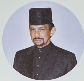
Kebawah Duli Yang Maha Mulia Paduka Seri Baginda Sultan Haji Hassanal Bolkiah Mu'izzaddin Waddaulah, Sultan dan Yang Di-Pertuan Negara Brunei Darussalam, Perdana Menteri, Menteri Pertahanan dan Menteri Kewangan