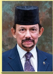
Kebawah Duli Yang Maha Mulia Paduka Seri Baginda Sultan Haji Hassanal Bolkiah Mu'izzaddin Waddaulah ibni Al-Marhum Sultan Haji Omar 'Ali Saifuddin Sa'adul Khairi Waddien, Sultan dan Yang Di-Pertuan Negara Brunei Darussalam, PERDANA MENTERI, MENTERI PERTAHANAN, MENTERI KEWANGAN DAN MENTERI HAL EHWAL LUAR NEGERI DAN PERDAGANGAN.