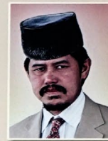
Duli Yang Teramat Mulia Paduka Seri Pengiran Perdana Wazir Sahibul Himmah Wal-Waqar Pengiran Muda Mohamed Bolkiah ibni Al-Marhum Sultan Haji Omar 'Ali Saifuddien Sa'adul Khairi Waddien, MENTERI HAL EHWAL LUAR NEGERI DAN PERDAGANGAN