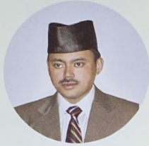
Duli Yang Teramat Mulia Paduka Seri Pengiran Muda Mahkota Pengiran Muda Haji Al-Muhtadee Billah, Menteri Kanan di Jabatan Perdana Menteri