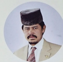
Duli Yang Teramat Mulia Paduka Seri Pengiran Perdana Wazir Sahibul Himmah Wal-Waqar Pengiran Muda Mohamed Bolkiah, Menteri Hal Ehwal Luar Negeri dan Perdagangan