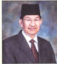
YANG Berhormat Pehin Orang Kaya Lalla Setia Dato Paduka Haji Awang Abdul Rahman bin Haji Ibrahim, Menteri Kewangan II (Kedua)