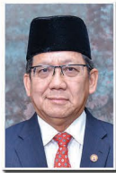
Yang Berhormat Pehin Orang Kaya Indra Pakhlawan Datu Seri Setia Awang Haji Suyoi bin Haji Osman, MENTERI PENDIDIKAN.