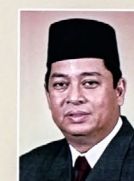
Yang Berhormat Pehin Datu Singamanteri Kolonel (Bersara) Dato Seri Paduka Awang Haji Mohammad Yasmin bin Haji Umar, MENTERI TENAGA (MINISTER OF ENERGY) DI JABATAN PERDANA MENTERI