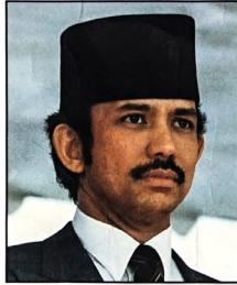
Kebawah Duli Yang Maha Mulia Paduka Seri Baginda Sultan Haji Hassanal Bolkiah Mu'izzaddin Waddaulah bin Almarhum Sultan Haji Omar 'Ali Saifuddin Sa'adul Khairi Waddien, Sultan dan Yang Di Pertuan Negara Brunei Darussalam Perdana Menteri dan Menteri Pertahanan