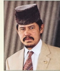
DULI Yang Teramat Mulia Paduka Seri Pengiran Perdana Wazir Sahibul Himmah Wal-Waqar Pengiran Muda Mohamed Bolkiah, Menteri Hal Ehwal Luar Negeri