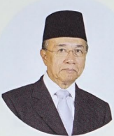
Yang Berhormat Pehin Orang Kaya Seri Lela Dato Seri Setia Awang Haji Abdul Rahman bin Dato Setia Haji Mohamed Taib, Menteri Pendidikan