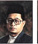
Yang Dimuliakan Pehin Siraja Khatib Dato Paduka Seri Setia Ustaz Awang Haji Yahya bin Haji Ibrahim, Timbalan Menteri Hal Ehwal Ugama