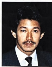
Duli Yang Teramat Mulia Paduka Seri Pengiran Di-Gadong Sahibul Mal Pengiran Muda Haji Jefri Bolkiah bin Almarhum Sultan Haji Omar 'Ali Saifuddin Sa'adul Khairi Waddien, Menteri Kewangan