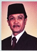
Yang Berhormat Pehin Orang Kaya Seri Kerna Dato Seri Setia (Dr.) Haji Awang Abu Bakar bin Haji Apong, MENTERI PENDIDIKAN