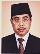
Yang Berhormat Pehin Orang Kaya Johan Pahlawan Dato Seri Setia Awang Haji Adanan bin Begawan Pehin Siraja Khatib Dato Seri Setia Awang Haji Mohd. Yusof, Menteri Hal Ehwal Dalam Negeri