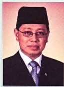
Yang Berhormat Pehin Orang Kaya Seri Utama Dato Seri Setia Awang Haji Yahya bin Begawan Mudim Dato Paduka Haji Bakar, MENTERI PERINDUSTRIAN DAN SUMBER-SUMBER UTAMA