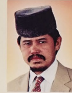
Duli Yang Teramat Mulla Paduka Seri Pengiran Perdana Wazir Sahibul Himmah Wai-Waqar Pengiran Muda Mohamed Bolkiah, Menteri Hal Ehwal Luar Negeri dan Perdagangan