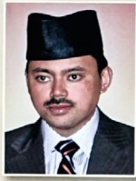
Duli Yang Teramat Mulia Paduka Seri Pengiran Muda Mahkota Pengiran Muda Haji Al-Muhtadee Billah ibni Kebawah Duli Yang Maha Mulia Paduka Seri Baginda Sultan Haji Hassanal Bolkiah Mu'azzaddin Waddaulah, MENTERI KANAN DI JABATAN PERDANA MENTERI