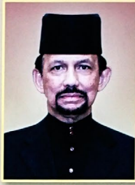
Kebawah Duli Yang Maha Mulia Paduka Seri Baginda Sultan Haji Hassanal Bolkiah Mu'azzaddin Waddaulah ibni Al-Martum Sultan Haji Omar 'Ali Saifuddien Sa'adul Khairi Waddien, Sultan dan Yang Di-Pertuan Negara Brunei Darussalam, PERDANA MENTERI, MENTERI PERTAHANAN DAN MENTERI KEWANGAN