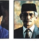
Yang Mulia Dato Paduka Awang Saiekh bin Yahya, Setiausaha Tetap Kementerian Hal Ehwal Ugama