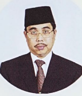
Yang Berhormat Pehin Orang Kaya Johan Pahlawan Dato Seri Setia Awang Haji Adanan bin Begawan Pehin Siraja Khatib Dato Seri Setia Awang Haji Mohd. Yusof, Menteri Hal Ehwal Dalam Negeri