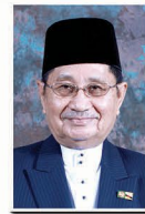
Yang Berhormat Pehin Udana Khatib Datu Paduka Seri Setia Ustaz Haji Awang Badaruddin bin Pengarah Datu Paduka Haji Othman, MENTERI HAL EHWAL UGAMA.