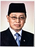
Yang Berhormat Pehin Orang Kaya Seri Utama Dato Seri Setia Awang Haji Yahya bin Begawan Mudim Dato Paduka Haji Bakar, MENTERI PERINDUSTRIAN DAN SUMBER-SUMBER UTAMA