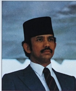
Kebawah Duli Yang Maha Mulia Paduka Seri Baginda Sultan Haji Hassanal Bolkiah Mu'izzaddin Waddaulah, Sultan dan Yang Di-Pertuan Negara Brunei Darussalam.