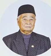
Yang Berhormat Pehin Jawatan Luar Pekerma Raja Dato Seri Utama Dr. Ustaz Haji Awang Mohd. Zain bin Haji Serudin, Menteri Hal Ehwal Ugama