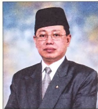
YANG Berhormat Pehin Orang Kaya Seri Utama Dato Seri Paduka Haji Awang Yahya bin Begawan Mudim Dato Paduka Haji Bakar, Menteri Tenaga (Minister of Energy) di Jabatan Perdana Menteri