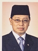
Yang Berhormat Pehin Orang Kaya Seri Utama Dato Seri Setia Awang Haji Yahya bin Begawan Mudim Dato Paduka Haji Abu Bakar, Menteri Perindustrian dan Sumber-Sumber Utama