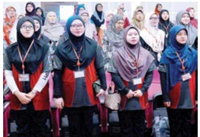
SEBAHAGIAN daripada peserta yang menyertai program tersebut.

PARA peserta Program Perkampungan Sivik semasa mendengarkan taklimat mengenai Melayu Islam Beraja: Sejarah dan Kelangsungan (kanan).