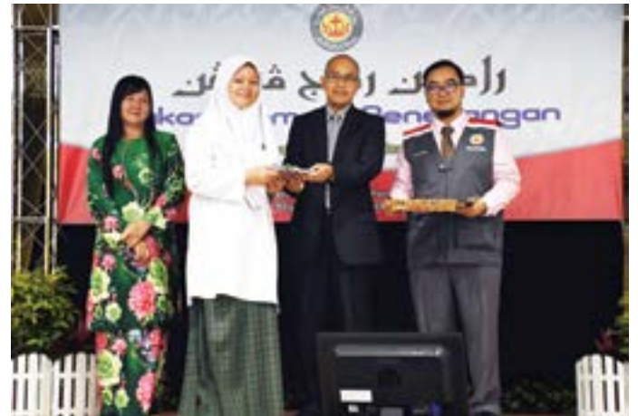
PEMANGKU Pegawai Daerah Tutong, Awang Haji Haizul bin Haji Yahya semasa hadir selaku tetamu kehormat majlis Program Rakan Remaja Penerangan yang diadakan di Sekolah Menengah Sufri Bolkiah (atas kanan) pada 24 Januari 2019 dan seterusnya menyampaikan hadiah kepada salah seorang pelajar yang berjaya menjawab soalan kuiz (atas kanan).