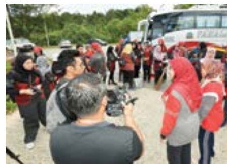
PESERTA Program Perkampungan Sivik semasa melakukan kempen kebersihan di Pantai Maragang.

Perkampungan sivik merupakan satu projek yang dilaksanakan melalui strategi kerja jabatan iaitu 'Komunikasi Bersemuka' selaras dengan visi jabatan, sebagai salah sebuah agensi peneraju kerajaan dalam menyampaikan dan membarigakan maklumat rasmi kerajaan.