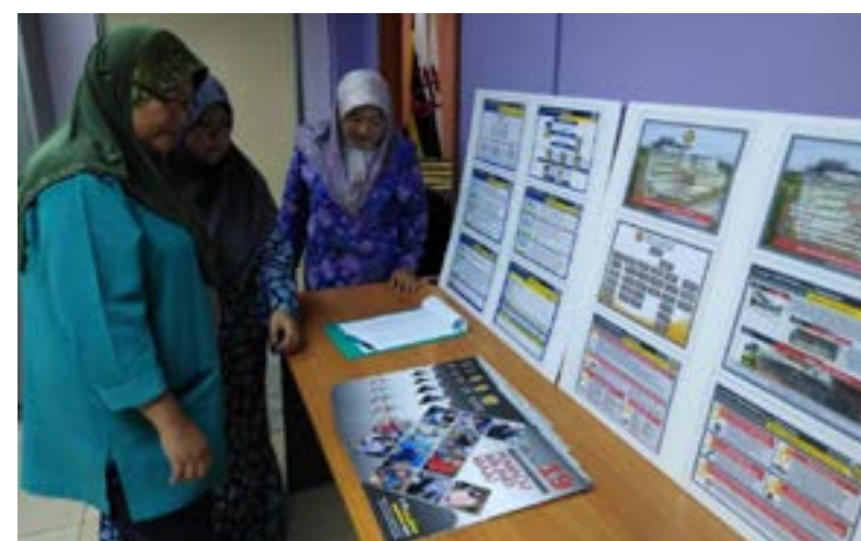
ORANG ramai mengambil kalendar 2019 di Cawangan Penerangan Daerah Belait.