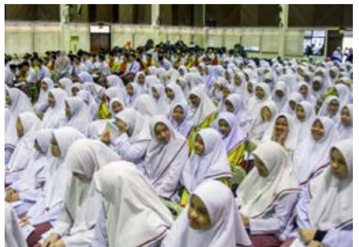
SEBAHAGIAN daripada pelajar Sekolah Menengah Sultan Hassan, Bangar ketika membuat persembahan pentas pada Program Rakan Remaja Penerangan pada 29 Januari 2019 di sekolah tersebut.