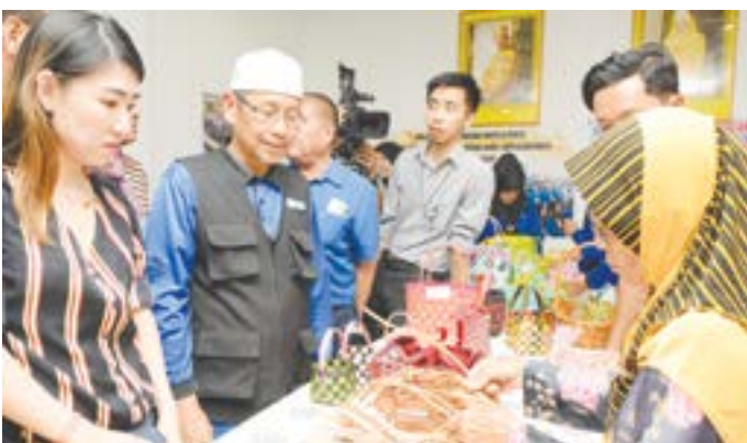
PARA delegasi ASEAN semasa menyaksikan aktiviti pembuatan kerja-kerja tangan di Pusat Kegiatan Warga Emas Tutong (atas kiri) sementara salah seorang peserta ASEAN mencuba memakan ambuyat (atas kanan).