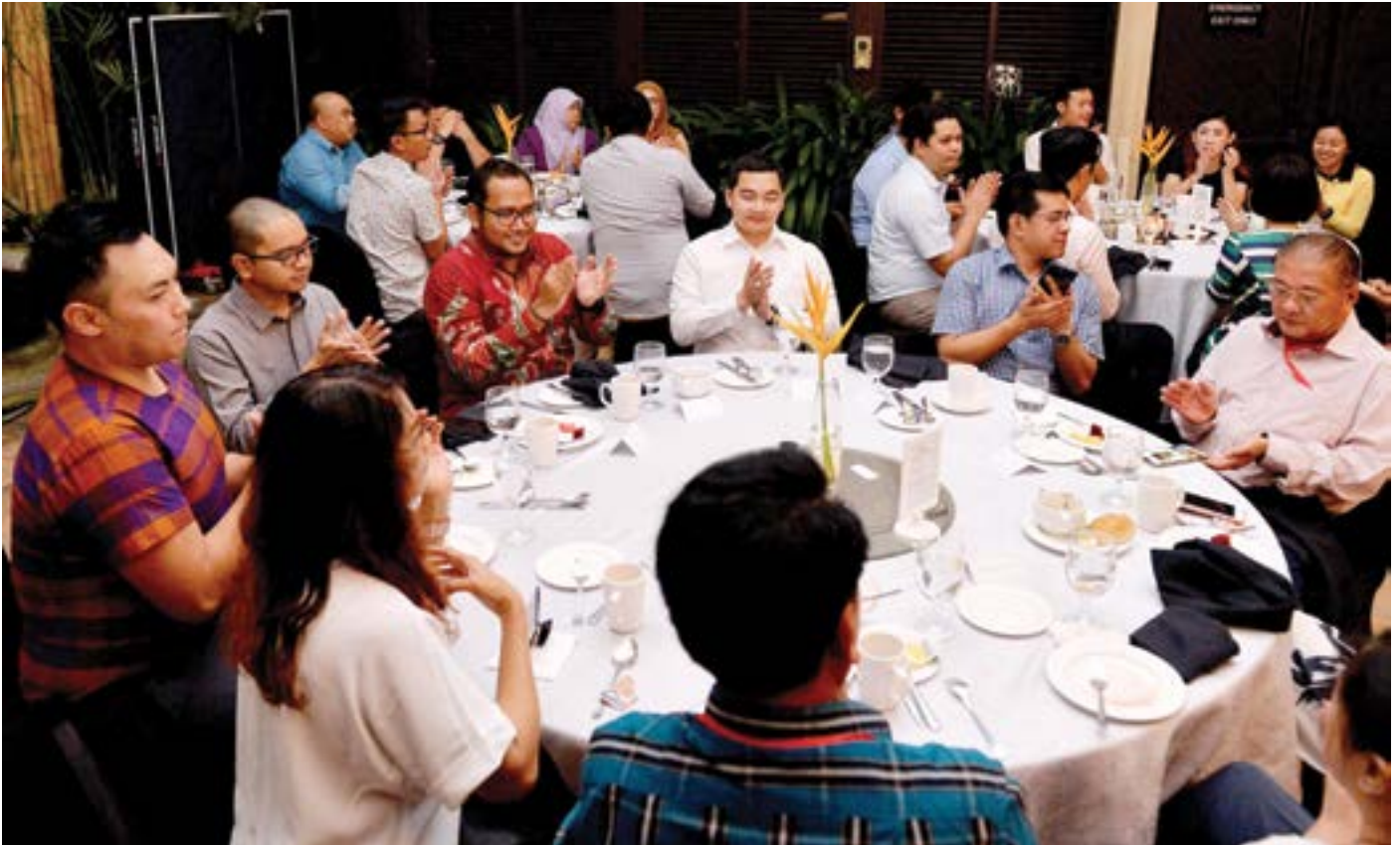
PARA delegasi yang menghadiri Mesyuarat Kumpulan Kerja Pegawai-Pegawai Kanan ASEAN Yang Bertanggungjawab Mengenai Penerangan, Media dan Latihan Kali Ke-4 dalam Majlis Makan Malam.