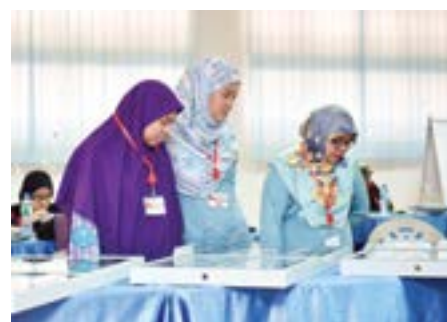
PARA peserta Program Perkampungan Sivik semasa dibawa melawat ke perusahaan-perusahaan tempatan selain ke sektor kerajaan yang lain.

Dengan adanya program seumpama ini diharap akan menjadi salah satu landasan bagi lepasan-lepasan ijazah mengharungi pelbagai cabaran masa depan dan seterusnya mampu mempersiapkan diri sebagai generasi berwawasan, berkualiti, memiliki kemahiran yang tinggi serta mampu berdikari tanpa mengharap bantuan orang lain dan pada masa yang sama mampu berfikir secara kreatif dan kritis khususnya untuk mencapai Wawasan Brunei 2035, sekali gus mampu merebut peluang-peluang pekerjaan bukan saja di sektor kerajaan tetapi juga di sektor swasta.