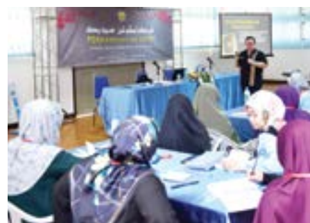
ANTARA taklimat yang disampaikan pada program tersebut termasuklah dari pegawai dari Jabatan Penerangan dan para jemputan dari luar.

Selama menjalani perkampungan para peserta telah didedahkan dengan berbagai taklimat dari agensi-agensi kerajaan dan bukan kerajaan selain dibawa melawat termasuk ke perusahaan-perusahaan tempatan di samping melakukan berbagai aktiviti-aktiviti sihat.