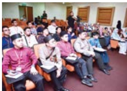
PESERTA Program Perkampungan Sivik semasa dibawa melawat ke Jabatan Adat Istiadat Negara.

Dengan adanya program seumpama ini diharap akan menjadi salah satu landasan bagi lepasan-lepasan ijazah mengharungi pelbagai cabaran masa depan dan seterusnya mampu mempersiapkan diri sebagai generasi berwawasan, berkualiti, memiliki kemahiran yang tinggi serta mampu berdikari tanpa mengharap bantuan orang lain dan pada masa yang sama mampu berfikir secara kreatif dan kritis khususnya untuk mencapai Wawasan Brunei 2035, sekali gus mampu merebut peluang-peluang pekerjaan bukan saja di sektor kerajaan tetapi juga di sektor swasta.