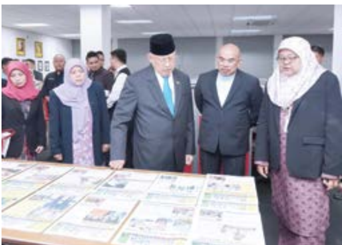
MENTERI di Jabatan Perdana Menteri (JPM) , Yang Berhormat Dato Seri Setia Awang Haji Abdul Mokti bin Haji Mohd. Daud semasa mengadakan lawatan ke Unit Pelita Brunei (atas kiri) manakala (atas kanan) ketika melawat ke Unit Fotografi .

Pada lawatan tersebut, Yang Berhormat juga telah merasmikan Pusat Rujukan Penerangan yang menyimpan bahan-bahan terbitan sama ada buku-buku terbitan Jabatan Penerangan sendiri mahupun bahan-bahahn terbitan dari luar termasuk terbitan Pelita Brunei yang lama.