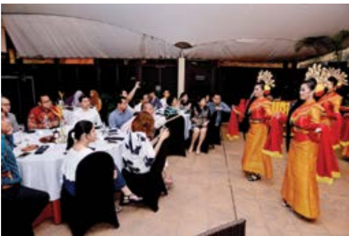
ANTARA persembahan kebudayaan pada Majlis Makan Malam tersebut.