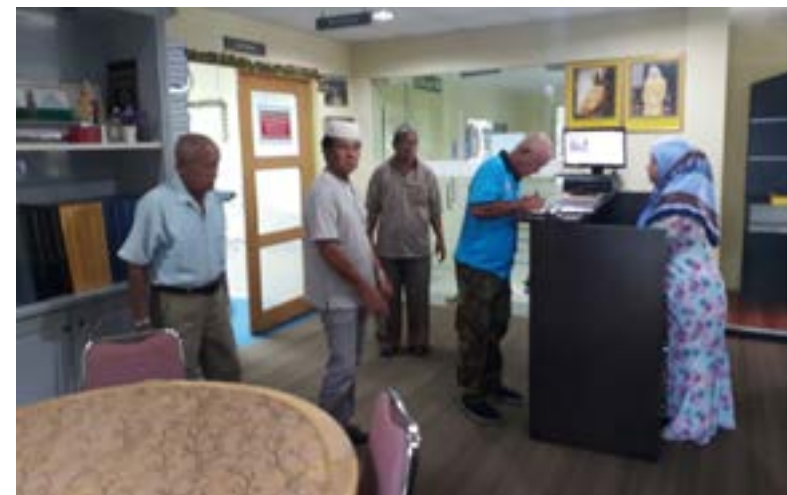
ORANG ramai mendapatkan kalendar 2019 di Jabatan Penerangan.