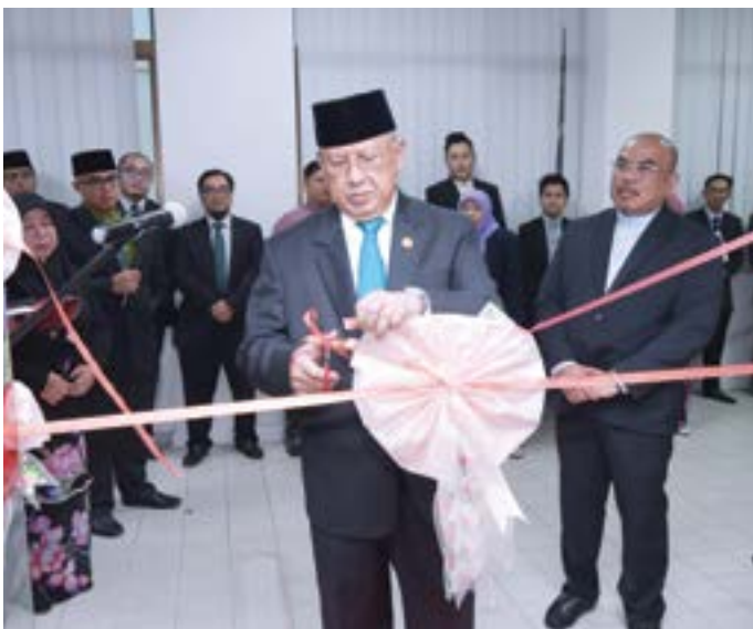
Yang Berhormat Dato Seri Setia Awang Haji Abdul Mokti semasa merasmikan Pusat Rujukan Penerangan .

Dalam lawatan tersebut Yang Berhormat juga berkesempatan mengadakan lawatan ke beberapa bahagian di Jabatan Penerangan untuk mengetahui lebih dekat lagi gerak kerja yang dilaksanakan.