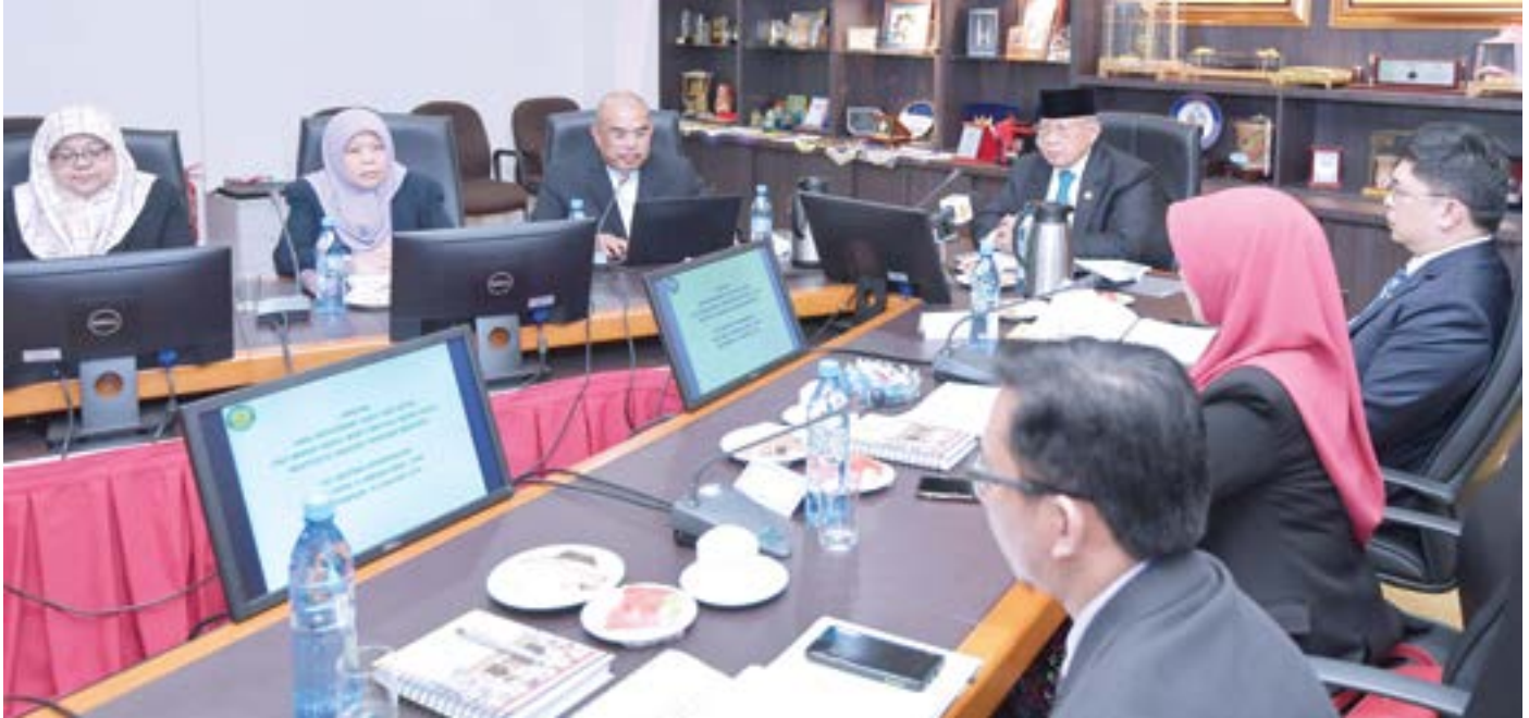
MENTERI di Jabatan Perdana Menteri (JPM), Yang Berhormat Dato Seri Setia Awang Haji Abdul Mokti bin Haji Mohd. Daud ketika mendengarkan taklimat mengenai peranan dan fungsi Jabatan Penerangan.

Siaran Akhbar: Jabatan penerangan