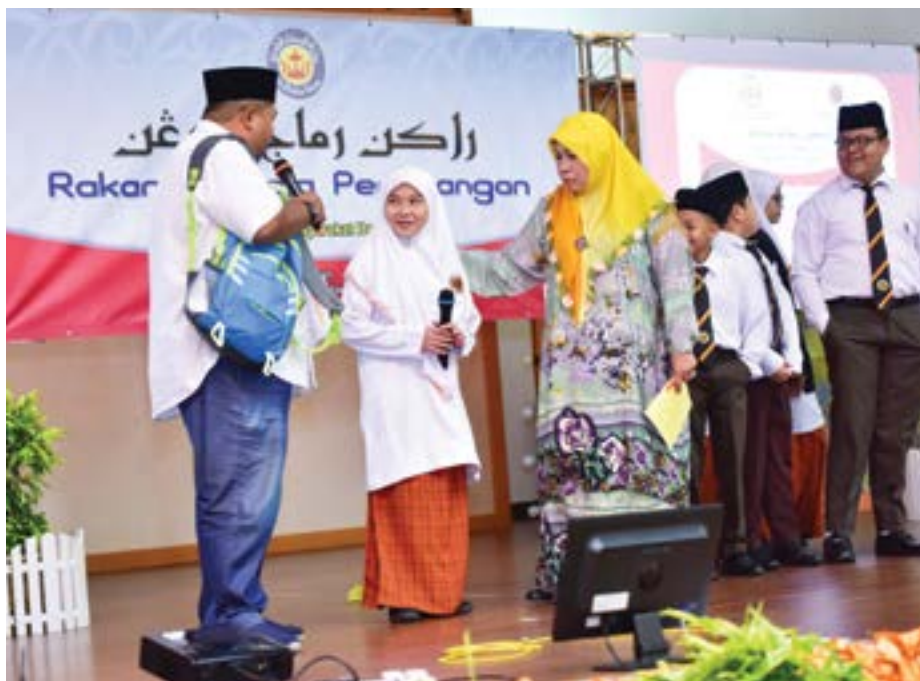
SALAH satu adegan lawak jenaka yang dipersembahkan oleh artis-artis tempatan pada program tersebut yang diadakan di Sekolah Menengah Tanjong Maya.