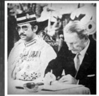
Kebawah Duli Yang Maha Mulia menandatangani Perjanjian Persahabatan dan Kerjasama di antara Negeri Brunei dengan Great Britain di Lapau, Bandar Seri Begawan pada 7 Januari 1979.