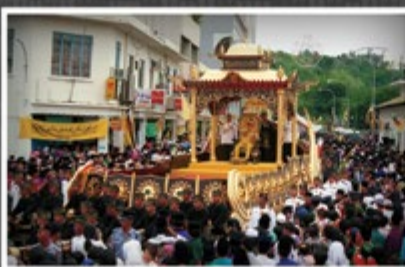
Kebawah Duli Yang Maha Mulia bersemayam di atas Pataratna, Usungan Diraja semasa Istiadat Perarakan Mengelilingi Bandar Seri Begawan Sempena Jubli Perak Baginda Menakhi Takhta pada 5 Oktober 1992.