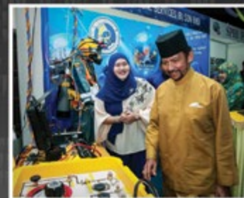
Para profesional muda dan usahawan bela merupakan tonggak kekuatan negara sebagai pewaris kepimpinan masa depan bagi mencapai Wawasan Negara 2035 adalah antara hasrat KDYMM dalam Majlis Sambutan Hari Raya Adifiti anjuran Yayasan Sultan Haji Hassanal Bolkiah (YSHHB) pada 30 Julai 2016.