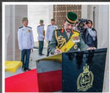
Kebawah Duli Yang Maha Mulia semasa berkenan menandatangani plak sejour keberangkatan tiba baginda di Ceremonial Hall di upacara Perbarisan Pentauliahlan berlangsung di Akademi Pertahanan ABDB yang baharu di Kampung Tanah Jambu pada 29 April 2014.