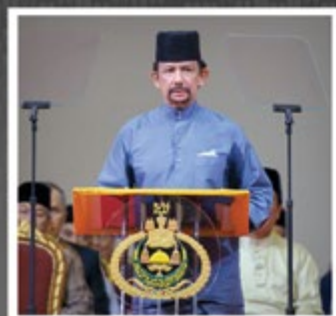
Negara Brunei Darussalam menempa satu lagi sejarah dalam Perundangan Islam apabila Kebawah Duli Yang Maha Mulia berkenan mengisytiharkan penguatkuasaan Perintah Kanun Hukuman Jenayah Syariah pada 30 April 2014 berlandung di Pusat Persidangan Antarabangsa (IOC).

Petikan titah Kebawah Duli Yang Maha Mulia Paduka Seri Baginda Sultan Haji Hassanal Bolkiah Mu'izzaddin Waddaulah ibni Al-Marhum Sultan Haji Omar 'Ali Saifuddin Sa'adul Khairi Waddien, Sultan dan Yang Di-Pertuan Negara Brunei Darussalam sempena Sambutan Hari Ulang Tahun Angkatan Bersenjata Diraja Brunei Ke-55 Tahun pada hari Selasa 24 Syaaban 1437 Hijrah bersamaan 31 Mei 2016 Masihi.