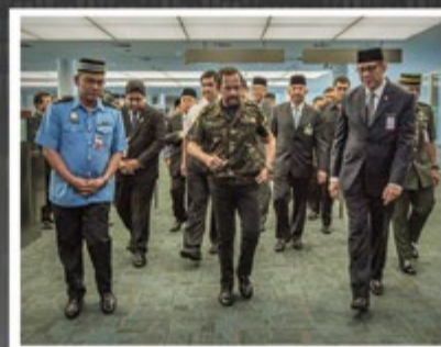
Kebawah Duli Yang Maha Mulia ketika meninjau perkembangan terkini mengenai kemudahan-kemudahan yang terdapat di dalam Lapangan Terbang Antarabangsa Brunei (LTAB) yang berwujud baru dan lebih moden serta canggih dan ia akan dapat membuka mata dunia terutamanya para pelancong yang memasuki negara ini.