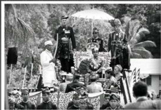
Kenaikan Diraja yang membawa Kebawah Duli Yang Maha Mulia menuju ke Lapau untuk Upacara Perpuspaan pada 1 Ogos 1968.

Titah Duli Yang Maha Mulia Paduka Seri Baginda Sultan dan Yang Di-Pertuan Negeri Brunei sebelum merasmikan Kilang LNG. (Petikan Titah pada 4 April 1973)