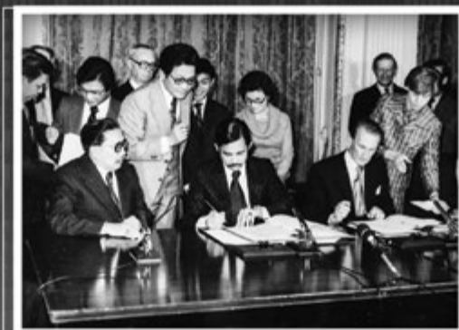
Kebawah Duli Yang Maha Mulia menandatangani Perjanjian Persahabatan dan kerjasama Brunei-Great Britain di London pada 29 September 1978.