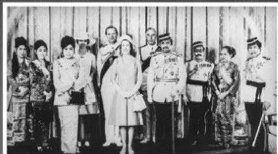
Kebawah Duli Yang Maha Mulia dan Kebawah Duli Yang Maha Mulia Baginda Raja Isteri dan Yang Maha Mulia Baginda Queen Elizabeth II dan kerabat-kerabat diraja ketika bergambar ramai di Istana Darul Hana sempena lawatan baginda Queen Elizabeth II ke Brunei Darussalam pada 29 Februari 1972.