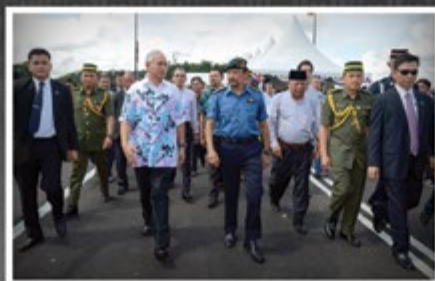
Jambatan Pensahabatan antara Negara Brunei Darussalam dan Malaysia yang menghubungkan Daerah Temburong dan Negeri Sarawak dirasmikan pada 8 September 2013 sekali gus menjadi pemangkin kepada pembangunan dan pertumbuhan antara dua negara, memudahkan hubungan jalan darat dan mengubah landskap pembangunan dan memacu ekonomi masyarakat setempat.