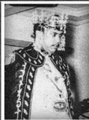
Kebawah Duli Yang Maha Mulia ketika disyitiharkan menjadi Yang Teramat Mulia Paduka Seri Duli Pengiran Muda Mahkota di Istana Darul Hana, Bandar Brunei, pada 14 Ogos 1961.