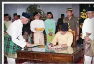
Kebawah Duli Yang Maha Mulia ketika berangkat ke Majlis Perasmian Pelancaran Bank Islam Brunei Berhad (IBB) dan bangunan IBB pada 13 Januari 1993.