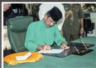
Kebawah Duli Yang Maha Mulia Paduka Seri Baginda Sultan Haji Hassanal Bolkiah Mu'izzaddin Waddaulah, Sultan dan Yang Di-Pertuan Negara Brunei Darussalam ketika berkenan berangkat ke Majlis Perasmian Pelancaran Tabung Amanah Islam Brunei (TAIB) pada 29 September 1992.

Titah dalam Majlis Perasmian Pelancaran Tabung Amanah Islam Brunei (TAIB), di Bangunan Perdagangan Bumiputra, Jalan Cator, Bandar Seri Begawan, Negara Brunei Darussalam, pada hari Ahad 29 September 1991 bersamaan 21 Rabiulawal 1412.