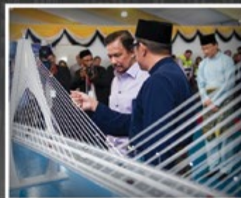
Kebawah Duli Yang Maha Mulia berkenan menyaksikan pameran mengenai keseluruhan pembinaan jambatan Temburong setelah Upacara Peletakan Batu Asas Projek Jambatan Penghubung di antara Daerah Brunei dan Muara dengan Daerah Temburong sepanjang lebih 30 kilometer pada 16 Januari 2016.