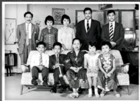
Yang Teramat Mulia Paduka Seri Duli Pengiran Muda Hassanal Bolkhiah bersama dengan paduka ayahanda dan bonda serta adinda-adinda baginda

Titah Pertama Duli Yang Maha Mulia Paduka Seri Sultan Hassanal Bolkhiah Mu'izzaddin Waddaulah pada hari perlantekan baginda sebagai Sultan di Istana Darul Hana. (Petikan Titah pada 5 Oktober 1967)