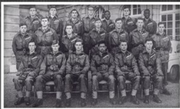
Yang Teramat Mulia Paduka Seri Duli Pengiran Muda Hassanal Bolkhiah ketika mengikuti Kursus Ketenteraan di Akademi Tentera Diraja, Sandhurst, United Kingdom dalam tahun 1966.