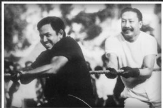
Sultan Haji Omar Ali Saifuddin III dan Kebawah Duli Yang Maha Mulia Paduka Seri Baginda Sultan Hassanali Bolkiah Mu'izzaddin Waddaulah, Sultan dan Yang Di-Pertuan Negara Brunei Darussalam menyertai acara Sukan Tarik Kalat yang diadakan di Padang Besar, Bandar Brunei pada 22 Februari 1973.