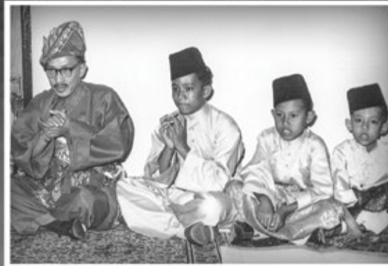
Yang Teramat Mulia Paduka Seri Duli Pengiran Muda Hassanal Bolkiah bersama paduka ayahanda baginda Sultan Haji Omar 'Ali Saifuddien Sa'adul Khairi Waddien dan adinda-adinda baginda ketika Istiadat Mengadap dalam tahun 1950-an.