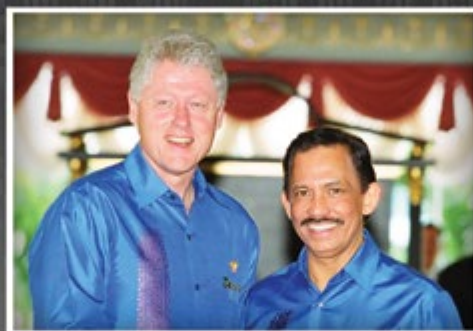
Kebawah Duli Yang Maha Mulia berkenan bergambar bersama Presiden Amerika Syarikat, Tuan Yang Terutama Presiden Bill Clinton di Persidangan APEC 2000 pada 26 November 2000.