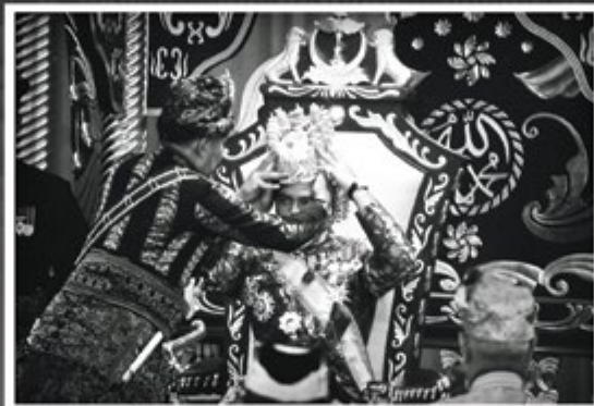
Sultan Haji Omar Ali Saifuddien Sa'adul Khairi Waddien memahkotakan Kebawah Duli Yang Maha Mulia Paduka Seri Baginda Sultan Hassanah Bolkhiah Mu'izzaddin Waddaulah di Hari Perpuspaan pada 1 Ogos 1968, bilamana baginda juga dikenali sebagai "Sultan dan Yang Di-Pertuan".