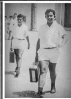
Yang Teramat Mulia Paduka Seri Duli Pengiran Muda Hassanal Bolkiah bersama adinda baginda di halaman Institut Victoria, Kuala Lumpur, ketika menerima pendudukan pelajaran menengah rendah dalam tahun 1961.

Kebawah Duli Yang Maha Mulia Paduka Seri Baginda Sultan Haji Hassanal Bolkiah Mu'izzaddin Waddaulah ibni Al-Marhum Sultan Haji Omar 'Ali Saifuddien Sa'adul Khairi Waddien, Sultan dan Yang Di-Pertuan Negara Brunei Darussalam bertitah buat pertama kalinya setelah menjadi Sultan Brunei yang ke-29 di Istana Darul Hana, pada 5 Oktober 1967.