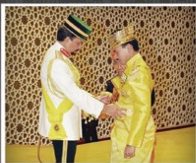
Kebawah Duli Yang Maha Mulia di Istiadat Pemasyhuran Yang Teramat Mulia Paduka Seri Duli Pengiran Muda Haji Al-Muhtadee Billah menjadi Duli Yang Teramat Mulia Paduka Seri Pengiran Muda Mahkota di Istana Nurul Iman pada 10 Ogos 1998.

Titah Kebawah Duli Yang Maha Mulia Paduka Seri Baginda Sultan Haji Hassanal Bolkiah Mu'izzaddin Waddaulah ibni Al-Marhum Sultan Haji Omar 'Ali Saifuddien Sa'adul Khairi Waddien, Sultan dan Yang Di-Pertuan Negara Brunei Darussalam Sempena Sambutan Jubli Perak di Istana Nurul Iman pada 5 Oktober 1992.