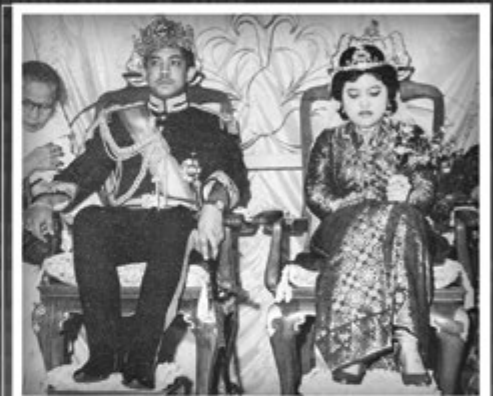
Yang Teramat Mulia Paduka Seri Duli Pengiran Muda Hassanal Bolkiah melangsungkan perkahwinan dengan Yang Amat Mulia Pengiran Anak Saleha binti Al-Marhum Pengiran Pemancha Pengiran Anak Haj Mohamed Alam pada 29 Julai 1965.