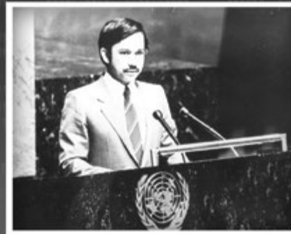
Kebawah Duli Yang Maha Mulia bertitah sempena kemasukan Negara Brunei Darussalam dengan rasminya menjadi ahli Pertubuhan Bangsa-Bangsa Bersatu (PBB) Ke-159 di Majlis Perhimpunan Agung PBB Ke-39 di Ibu Pejabat PBB, New York pada 21 September 1984.

Acceptance Speech by His Majesty The Sultan and Yang Di-Pertuan of Negara Brunei Darussalam on the occasion of The Admission of Brunei Darussalam as The 159 th Member of The United Nations