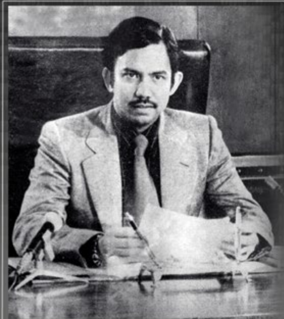
Kebawah Duli Yang Maha Mulia Paduka Seri Baginda Sultan Hassanal Bolkiah Mu'izzaddin Waddaulah ibni Al-Marhum Sultan Haji Omar 'Ali Saifuddin Sa'adul Khan Waddien, Sultan dan Yang Di-Pertuan Negara Brunei Darussalam di awal tahun 1979.

"We genuinely believe in the preservation of world peace through collective security. We endorse the promotion of economic development through mutual help. We will uphold the principle that each country has the inalienable right to establish its own form of government, without any form of outside interference, and always having regard to the prevailing circumstances in each country and the aspirations of its own people for a better standard of livelihood and well-being."