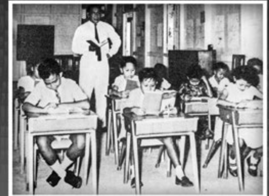
Yang Teramat Mulia Paduka Seri Duli Pengiran Muda Hassanal Bolkiah mengikuti Private Tuition di Surau, Istana Darul Hana, Bandar Brunei, dalam tahun 1950-an.