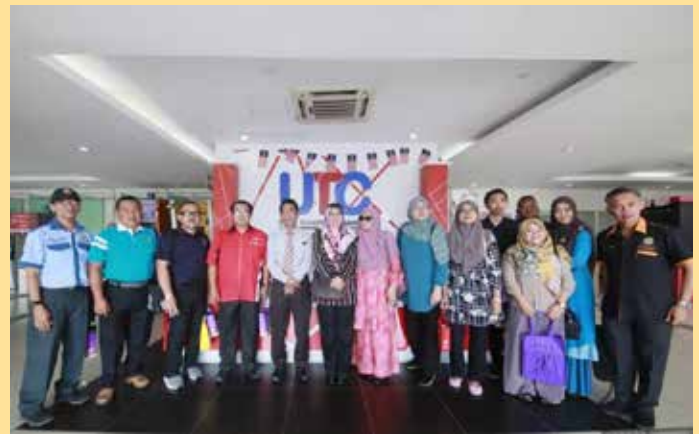
LAWATAN juga diadakan di Pusat Transformasi Bandaraya (UTC) Kuantan, Pahang.