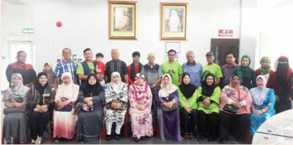
SESI bergambar ramai pada tayang ulang filem Lagenda Puteri Bukit Tempayan Pisang di Auditorium Jabatan Penerangan, Jabatan Perdana Menteri, Lapangan Terbang Lama, Berakas.