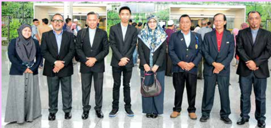
BERGAMBAR ramai sebelum berlepas ke Malaysia.

Rombongan berada di Pahang selama tiga hari dan kemudian meneruskan program di Terengganu selama dua hari. Atur cara Program Pertukaran yang disediakan sangat padat meliputi taklimat, lawatan ke tempat-tempat bersejarah dan tarikan pelancong, Pusat Transformasi Bandaraya (UTC) Pahang, Muzium Sungai Lembing dan Lombong-Lombong Biji Timah Bawah Sungai Lembing, Pahang dan melawat ke Mufakat Komuniti Malaysia (MKM) Kampung Orang Asli Sungai Enggang, Temerloh dan MKM Sungai Lembing, Kuantan, Pahang.