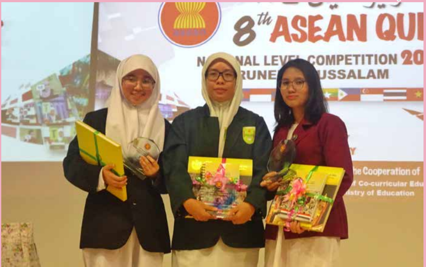
TIGA pelajar yang akan mewakili negara ke Kuiz ASEAN Peringkat Serantau Kali Kelapan yang akan diadakan di Bali, Republik Indonesia pada bulan Disember.