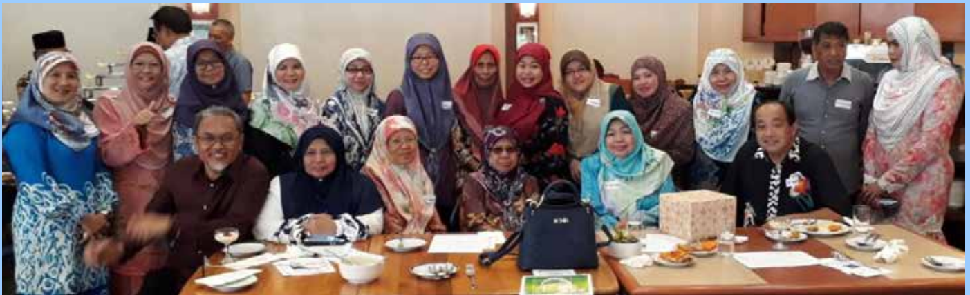
ANTARA warga Penerangan yang hadir mengambil kesempatan untuk mengabadikan gambar kenangan bersama dalam Majlis Reunion Warga Penerangan 2018 di Tarindak D'Seni (atas dan bawah).

Bagi mantan warga Penerangan pula, menzahirkan syukur kerana sebahagian daripada mereka pernah terlibat dalam meraikan Ulang Tahun Penubuhan 50 Tahun Jabatan Penerangan pada tahun 2002, Ulang Tahun Penerbitan 50 Tahun Pelita Brunei serta beberapa kemajuan dan perkembangan lain yang telah dicapai oleh Jabatan Penerangan dalam era sebelum dan selepas merdeka.