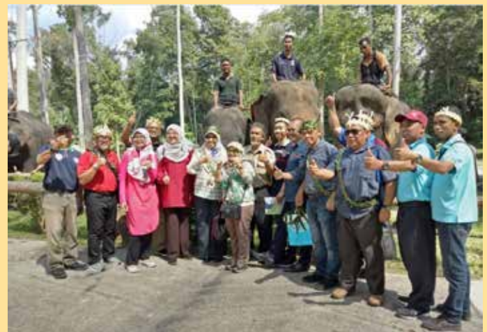
ROMBONGAN mengadakan lawatan di Pusat Konservasi Gajah Kebangsaan Kuala Gandah, Pahang.