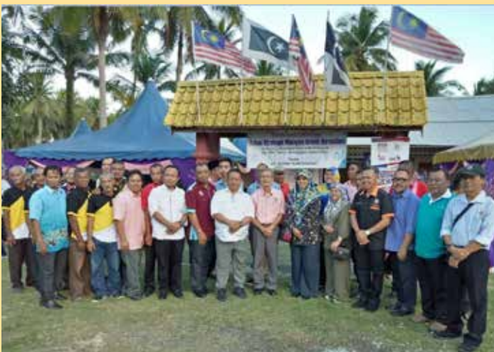
ROMBONGAN bergambar ramai bersama Muafakat Komuniti Kampong Fikri, Terengganu.