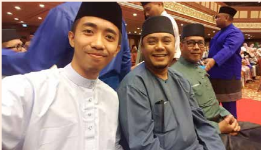
WARGA Jabatan Penerangan juga sama-sama terlibat dalam Sambutan Hari Perkhidmatan Awam Ke-25.

Warga Jabatan Penerangan tidak ketinggalan terlibat dalam majlis kemuncak tersebut bagi sama-sama mendukung dan berfikiran secara proaktif serta menerima perubahan demi kemajuan di masa akan mendatang.