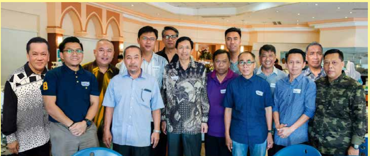
BERKESEMPATAN bergambar ramai semasa Majlis Reunion Warga Penerangan 2018.