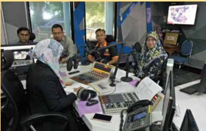
KETERUJUAN lebih terasa apabila rombongan berada di konti Terengganu.fm.

Program pertukaran pegawai hasil daripada Memorandum Persefahaman (MoU) sejak tahun 1992 merupakan program kerjasama berterusan di antara Jabatan Penerangan Malaysia dengan Brunei.