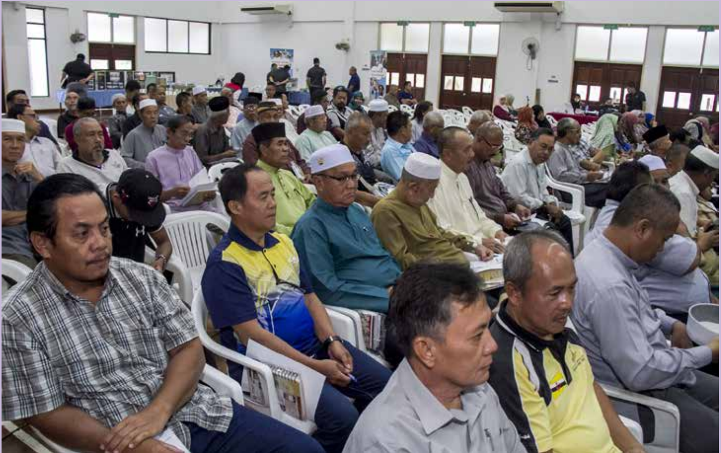
ANTARA yang hadir pada Program Awasi Anak Kitani.