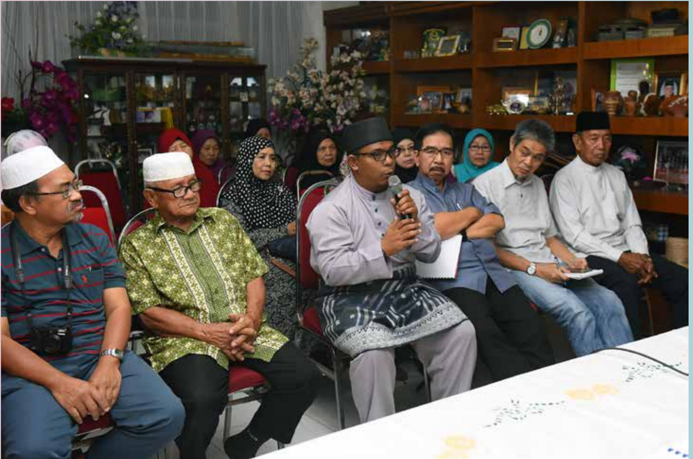
AHLI-AHLI Majlis Perundingan Kampung Mumong 'A' dan Mumong 'B' menyuarakan isu-isu yang perlu diambil perhatian pada Program Sua Muka Jabatan Penerangan bagi Kampung Mumong, Daerah Belait.