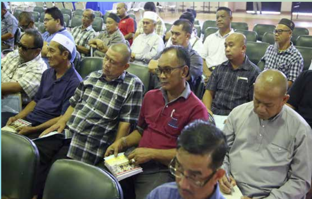
ANTARA penduduk Mukim Pengkalan Batu yang hadir pada Program Awasi Anak Kitani.

Manakala taklimat kedua disampaikan oleh JKDN yang menyentuh mengenai tugas dan tanggungjawab jabatan berkenaan termasuk isu-isu keselamatan dalam negeri di bawah pantauannya.