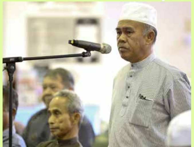
Sesi soal jawab juga diadakan selepas taklimat.

Sesi soal jawab juga diadakan selepas taklimat bagi menguatkan lagi kefahaman 60 peserta program tersebut.