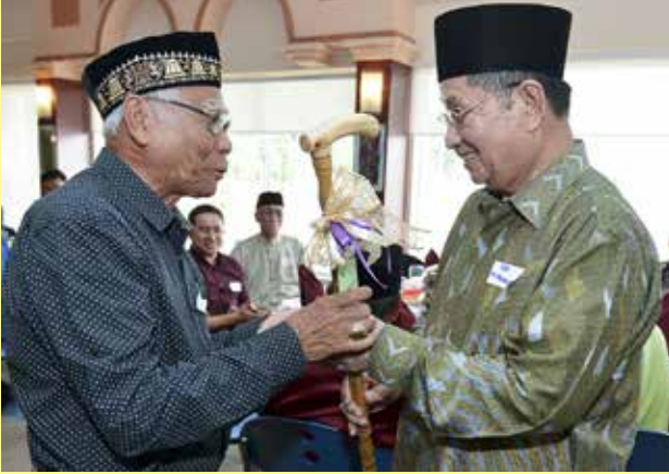
MENTERI Hal Ehwal Ugama, Yang Berhormat Pehin Udana Khatib Dato Paduka Seri Setia Ustaz Haji Awang Badaruddin bin Pengarah Dato Paduka Haji Awang Othman semasa menyampaikan cenderamata kepada salah seorang mantan warga Penerangan.