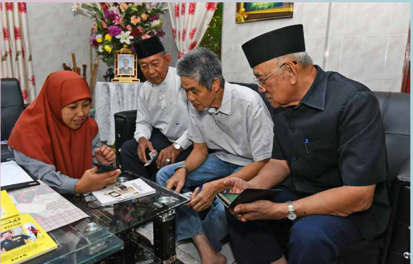
SEORANG kakitangan Jabatan Penerangan membarigakan mengenai aplikasi mudah alih InfoDeptBN kepada Ahli-ahli Majlis Perundingan Kampung Mumong 'A' dan Mumong 'B' yang menghadiri Program Sua Muka tersebut.