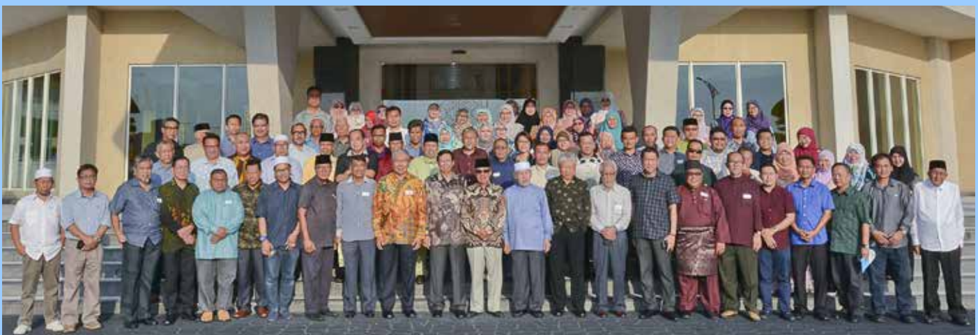
SESI bergambar ramai semasa Majlis Reunion Warga Penerangan 2018 di Tarindak D'Seni.