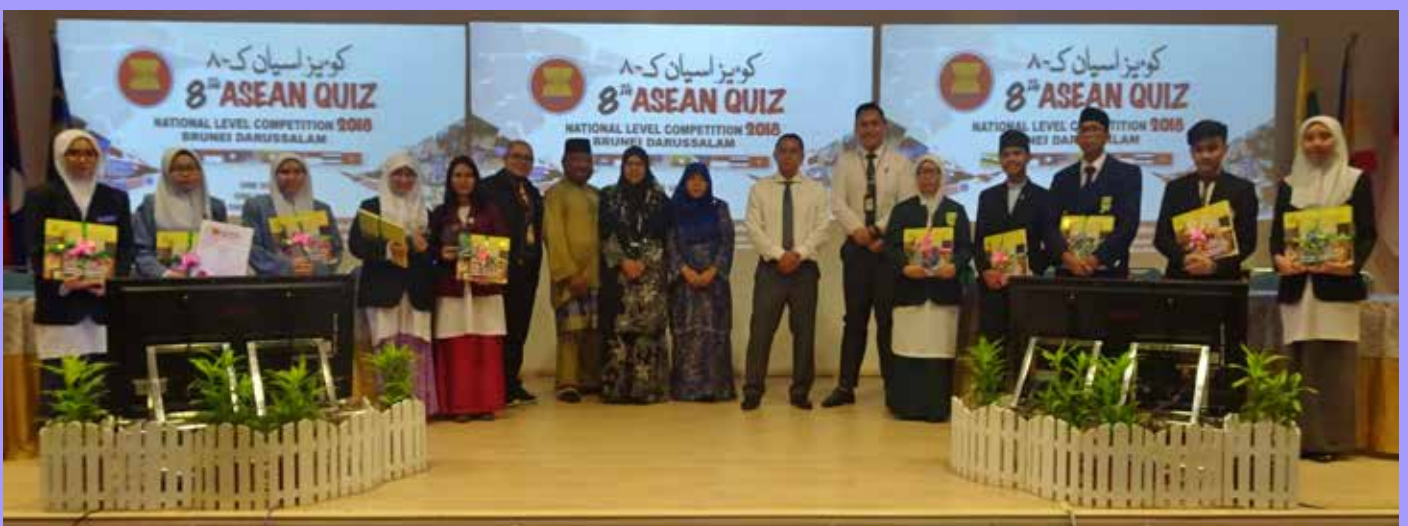
PARA peserta Pertandingan Kuiz ASEAN Peringkat Negara Kali Kelapan 2018 bergambar ramai bersama tetamu kehormat.

Pencapaian terbaik Negara Brunei Darussalam di Kuiz ASEAN Peringkat Serantau ialah ketika meraih tempat ketiga pada tahun 2014 di Vientiane, Viet Nam.