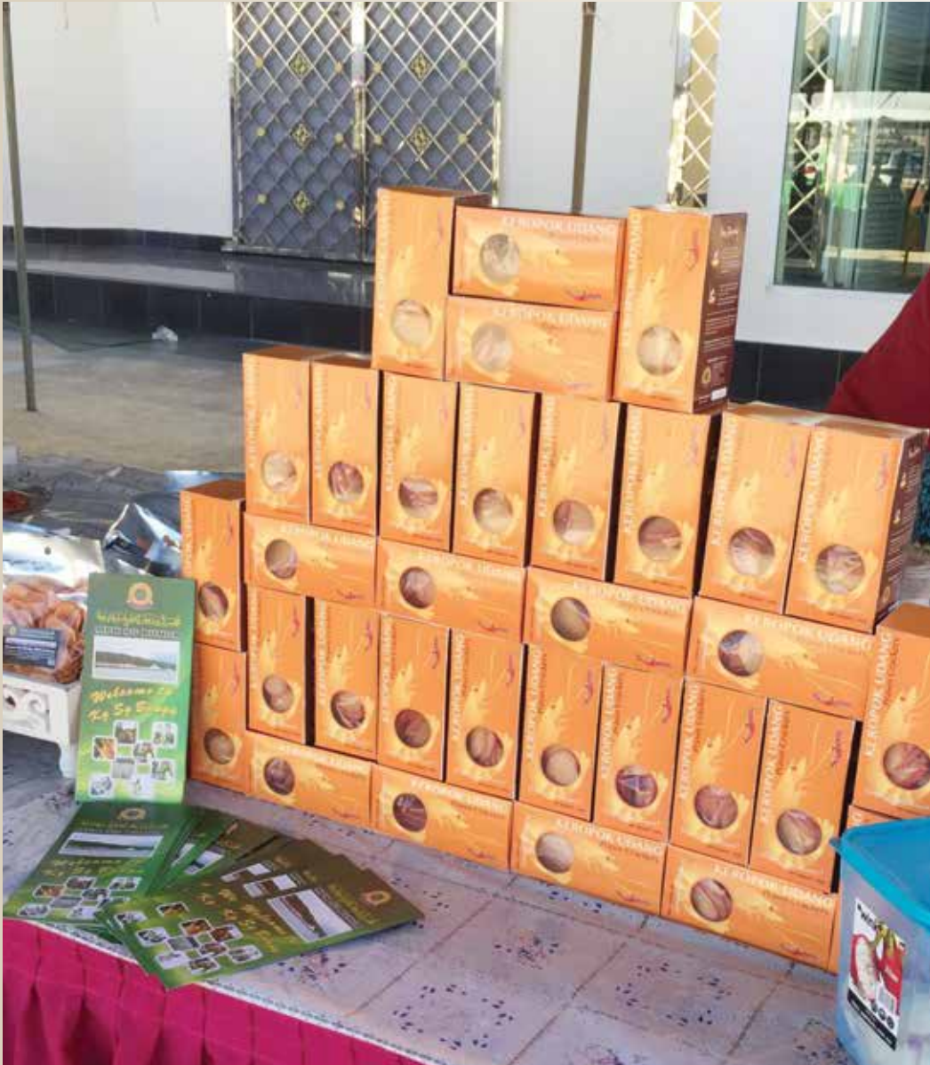
SEBAHAGIAN daripada produk dari Kampung Sungai Matan.

Semoga aktiviti-aktiviti yang dikendalikan oleh Kampung Sungai Matan akan dapat menarik lebih ramai pengunjung dalam negara yang sekali gus menyemai minat melancong di negara sendiri dan dapat menarik lebih ramai pelancong dari luar negara yang setentunya akan dapat meningkatkan jumlah hasil dalam negeri kasar melalui sektor pelancongan di negara ini.