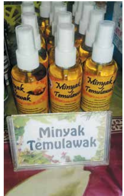
MINYAK Tamu Lawak (Minyak Temulawak) merupakan produk 'Satu Kampung Satu Produk' (IKIP) di STKRJ Lambak Kiri dan sekitarnya.

Selain Minyak Tamu Lawak, pengusaha juga telah mempelbagaikan produk keluaran syarikatnya, iaitu pembuatan ubat-ubatan tradisional bagi wanita lepas bersalin.