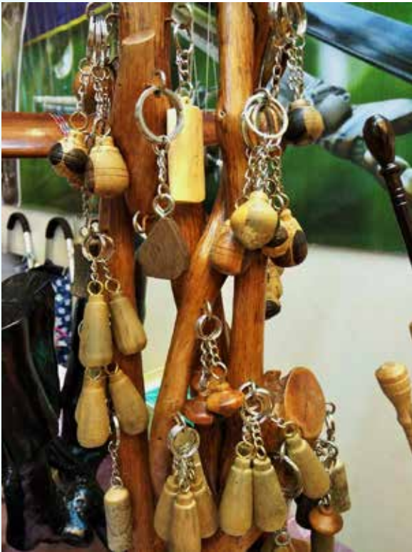
KRAF tangan berupa keychain rekaan beliau dari pelbagai jenis kayu yang mempunyai khasiatnya tersendiri.