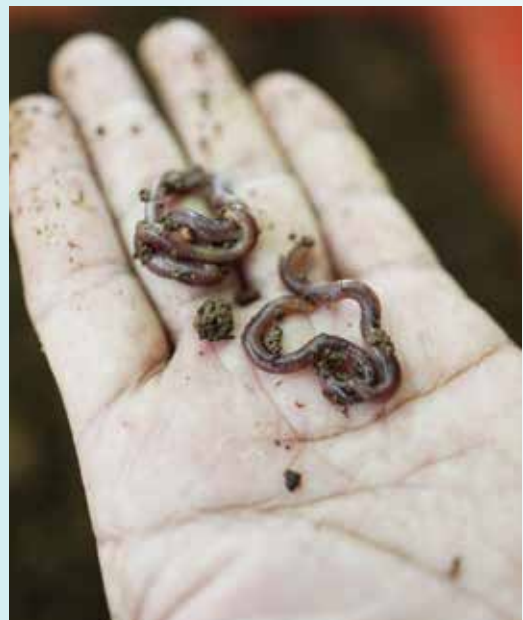
MEMELIHARA cacing-cacing untuk menghasilkan baja Vermi Kompos memerlukan kerajinan dan tidak boleh dilakukan dengan hanya sambil lewa.