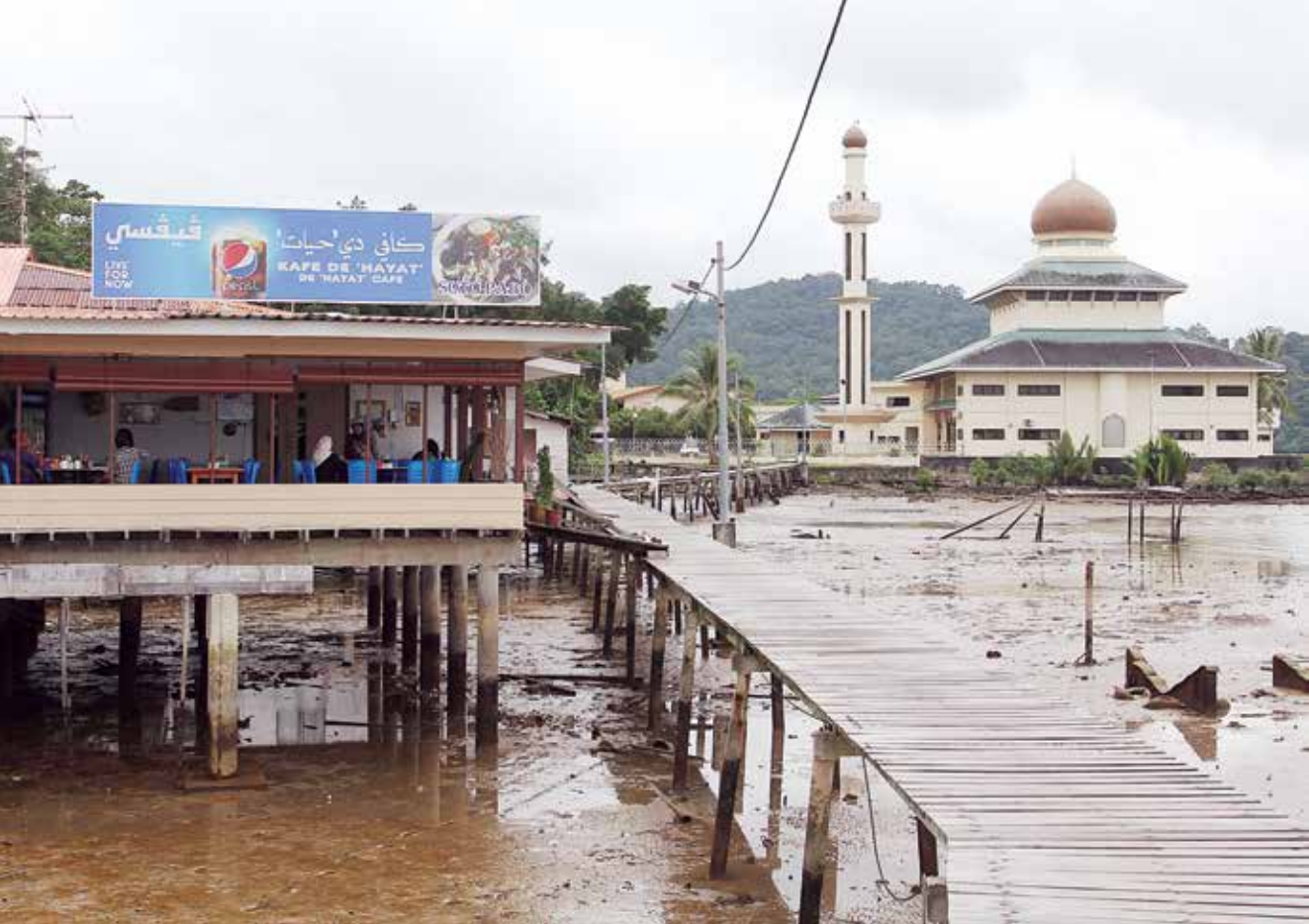
KAFE De Hayat yang terletak di Kampung Pintu Malim.