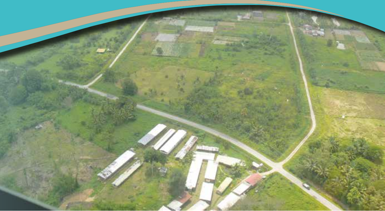
PEMANDANGAN Kampung Supon Besar dari udara.

TIDAK siapa menyangka hasil kerja tangan seperti anyaman yang dahulunya cuma untuk mengisi masa lapang dan digunakan untuk keperluan sendiri, kini menjadi satu sumber pendapatan yang lumayan. Ia setentunya boleh dikembangkan ke tahap komersial memandangkan permintaan yang begitu tinggi dari negara ini.