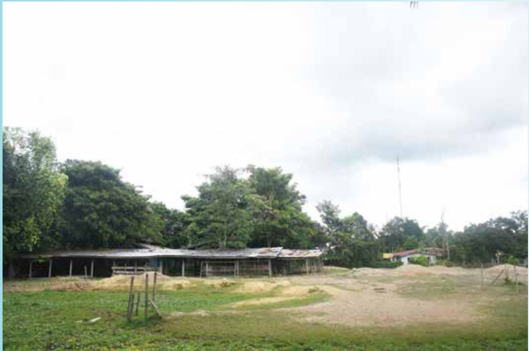
KEADAAN kandang binatang ternakan kepunyaan seorang penduduk di Kampung Rambai.

Sebahagian hasil binatang ternakan turut dijual secara persendirian. Tidak kurang juga sebahagian penduduk giat berkebun buah-buahan dan menanam pohon gaharu di sekitar rumah masing-masing.