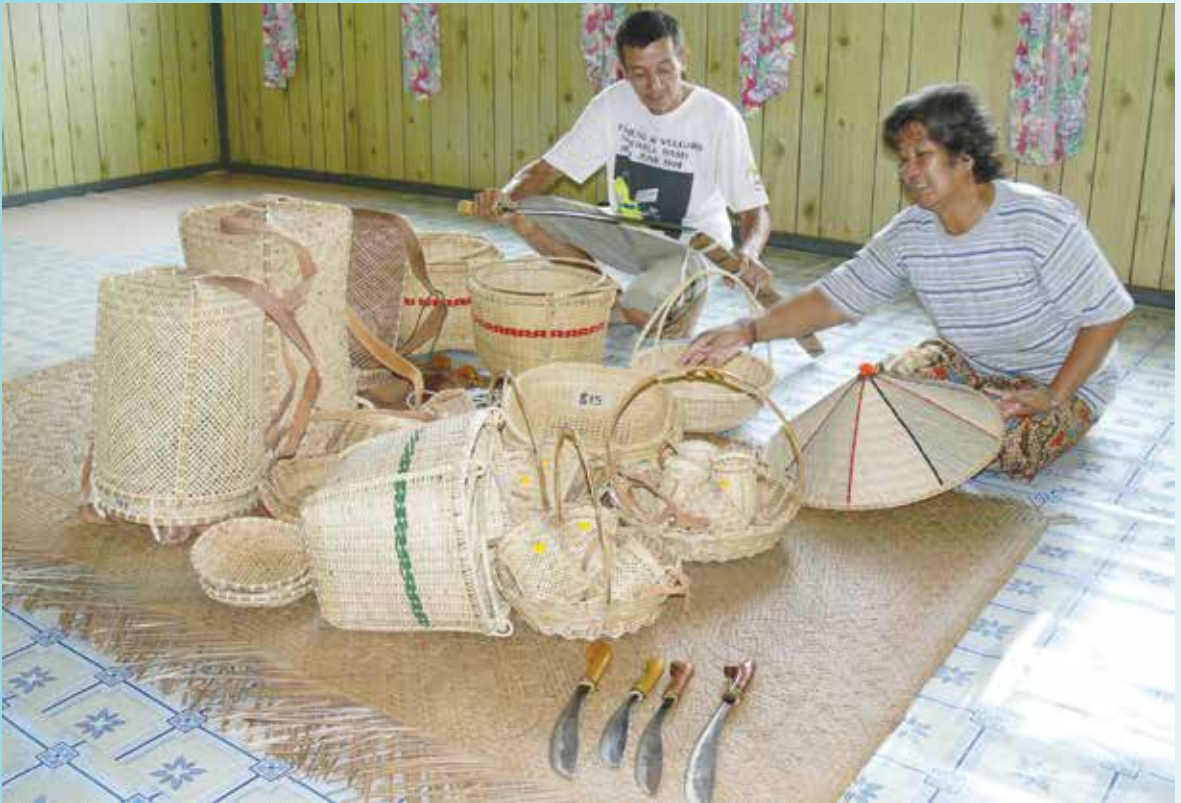
SENI anyaman Kampung Supon Besar dikagumi dan menjadi warisan turun-temurun.