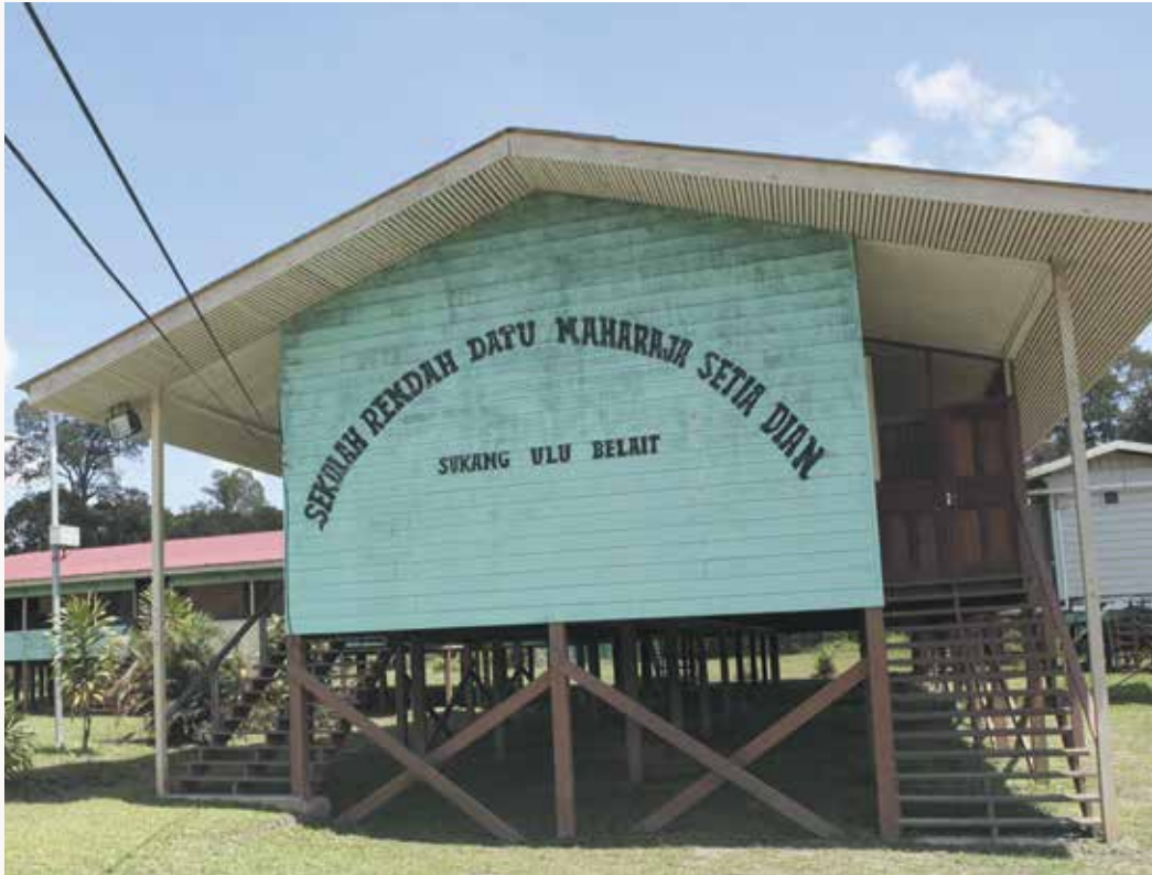
SEBUAH sekolah rendah yang dinamakan Sekolah Rendah Datu Maharaja Setia Dian, Sukang.

Di kampung ini juga mempunyai sebuah sekolah rendah yang dinamakan Sekolah Rendah Datu Maharaja Setia Dian, Sukang dan tiga buah rumah guru-guru berdekatan dengan sekolah berkenaan. Terdapat sebuah Klinik Kesihatan untuk memberikan perkhidmatan kesihatan kepada penduduk-penduduk di mukim ini untuk menerima pemeriksaan kesihatan.