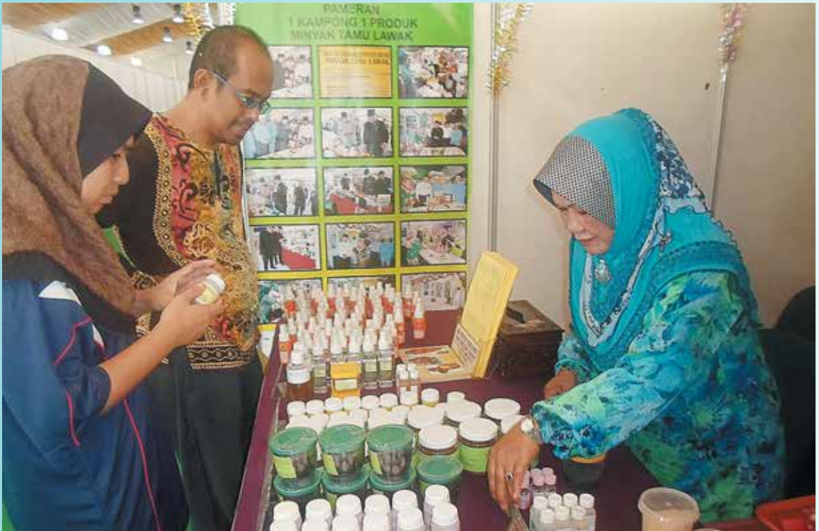
PARA pengunjung tertarik dengan produk yang dijual.