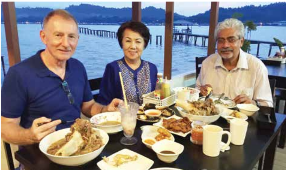
KAFE De Hayat bukan hanya berjaya menambat hati para pengunjung tempatan malahan juga berjaya mencuri hati para pengunjung dari luar negara.