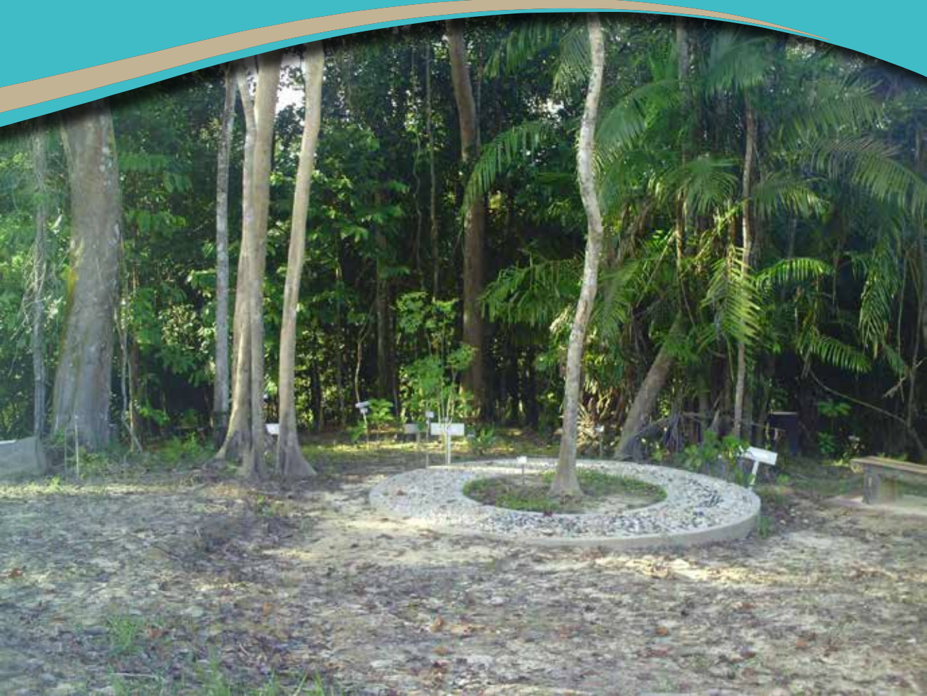
PEMANDANGAN di Taman Herba yang mempunyai lebih 60 spesies herba.

SEPANJANG perjalanan lebih kurang 45 minit dari Bandar Seri Begawan, sampailah ke destinasi yang dituju, iaitu Kampung Putat, Mukim Lumapas, kampung yang aman dan tenteram, jauh daripada kesibukan hiruk-pikuk pembangunan dan pencemaran alam dan memang terkenal dengan taman herbanya.