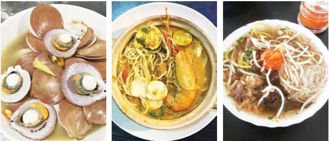
ANTARA menu yang menggamit selera para pengunjung di Kafe De Hayat, Kampung Pintu Malim.

Beliau juga berharap agar perniagaannya akan terus berjaya bukan hanya di dalam negara malahan juga dikenali ke luar negara.