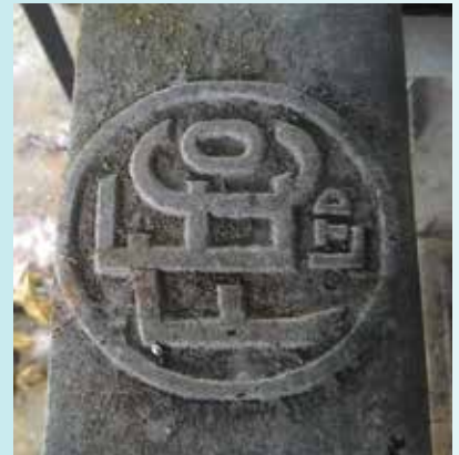
ANTARA artifak-artifak bersejarah yang terdapat di tapak Industri Getah Labu Estate.

Tapak Industri Getah Labu Estate merupakan bukti peninggalan industri pertanian yang paling awal dan mengingatkan kita kepada perladangan komersial di negara ini yang merupakan industri pertanian komersial pertama di Brunei pada awal Abad Ke-20.