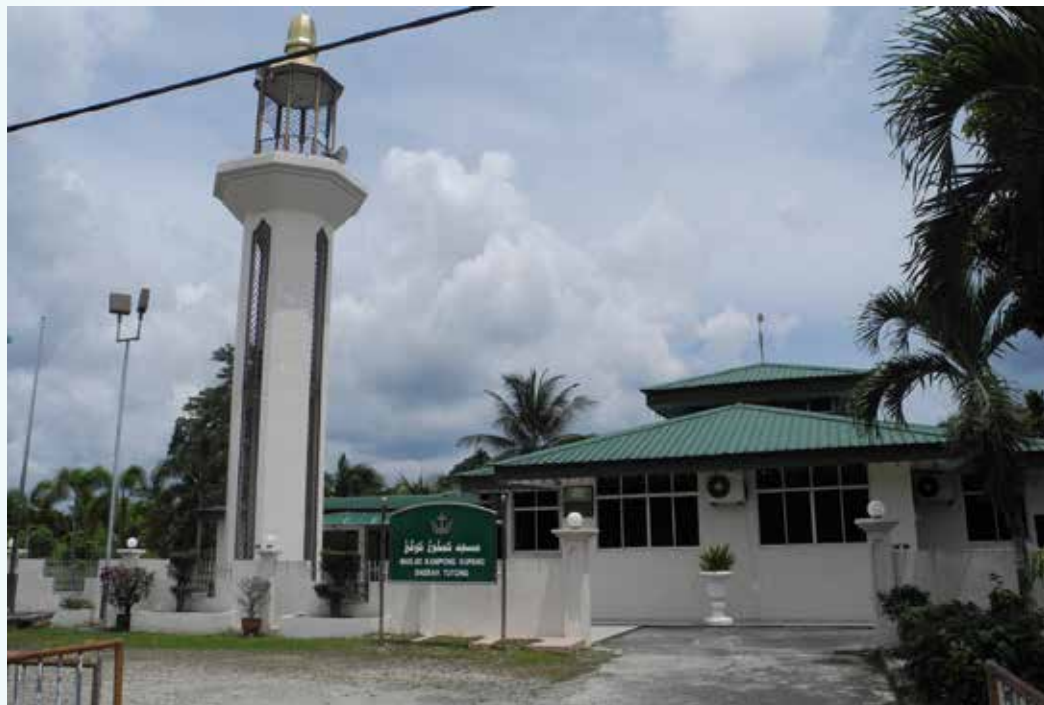
MASJID Kampung Kupang, Daerah Tutong.