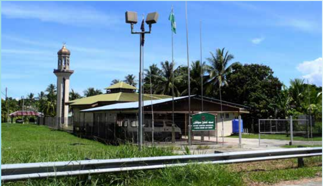
MASJID antara prasarana yang disediakan oleh pihak kerajaan di Kampung Menunggol, Mukim Kota Batu.

Kampung Menunggol adalah sebuah perkampungan kecil yang terletak di kawasan perairan tepi Sungai Brunei dan untuk sampai ke sana menggunakan motor sangkut. Walaupun begitu, kampung ini tidak terpinggir daripada menerima kemudahan-kemudahan asas dan prasarana yang disediakan oleh pihak kerajaan seperti sekolah, jalan raya, bekalan air bersih, bekalan elektrik, masjid dan jeti jambatan.