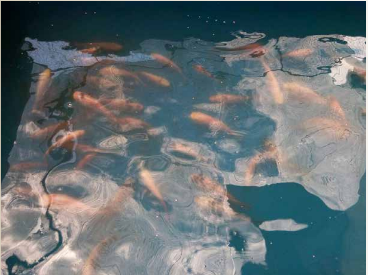
ANTARA pemeliharaan ternakan ikan yang terdapat di mukim tersebut.

Menyentuh mengenai pemeliharaan ikan dalam kontena, Ketua Kampung Mumong, Awang Haji Yusof menjelaskan bahawa perusahaan ini mempunyai potensi yang cerah jika diusahakan. Contohnya jika ia diusahakan oleh 50 ke 100 orang, setentunya akan menghasilkan keuntungan yang berbaloi, di mana satu kontena, jelas beliau berkeupayaan menghasilkan 30 kilogram ikan tilapia dan ini sudah tentu dapat membantu menjana sara hidup penduduk kampung.