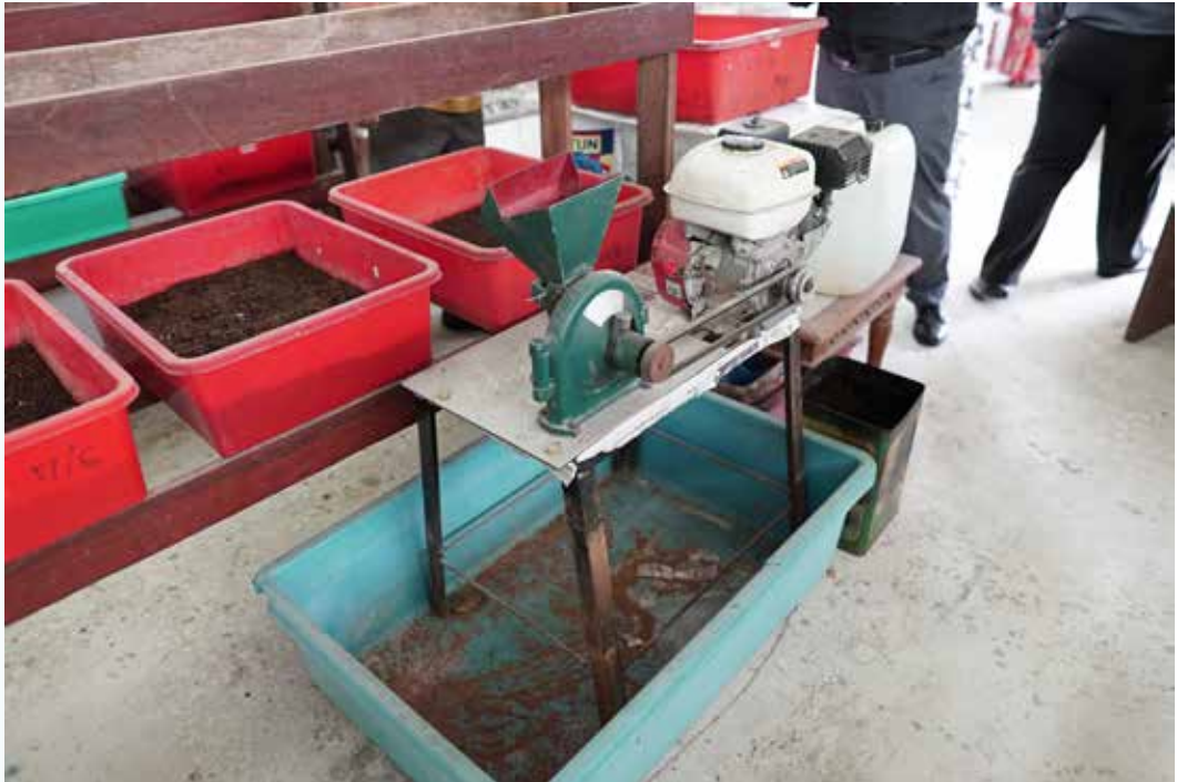
SALAH satu alat yang digunakan untuk pemprosesan.

Memelihara cacing-cacing ini jelasnya, memerlukan kerajinan dan tidak boleh dilakukan dengan hanya sambil lewa sahaja. Beliau menjelaskan, cacing-cacing peliharaannya akan diberi minum air gula seminggu sekali, malahan dimandikan setiap pagi. Dalam menjayakan projek tersebut, mereka memelihara cacing-cacing pelbagai jenis antaranya Blue Worm, African Worm dan Red Ridgleer yang mana cacing-cacing tersebut memakan bahan-bahan buangan seperti daun-daun, tray telur dan mukah kulat.