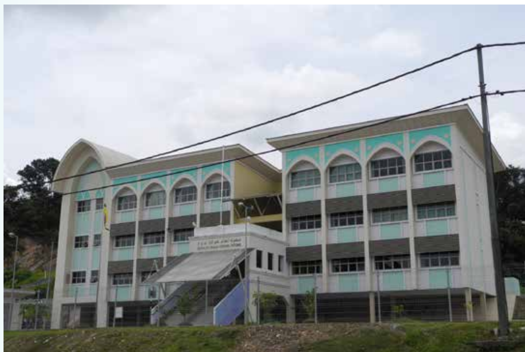
ANTARA prasarana yang terdapat di kampung ini ialah Sekolah Agama Kupang.