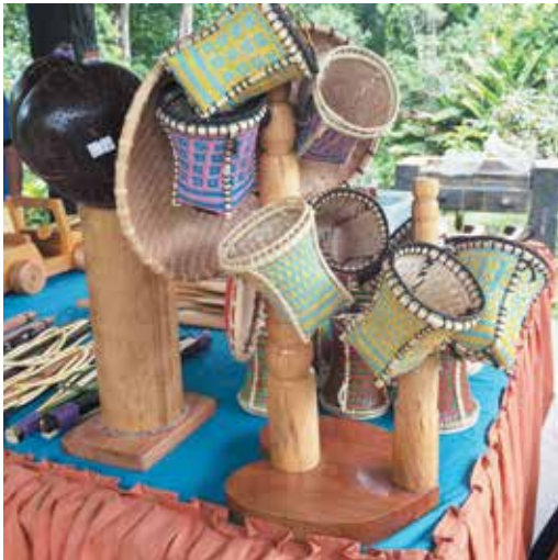
PELBAGAI jenis kraf tangan seperti takiding dan nyiru dihasilkan oleh penduduk Kampung Putat.

Apa yang membanggakan penduduk-penduduknya yang dipimpin oleh Ketua Kampungnya, Awang Haji Jumat bin Akim, dapat mengekalkan hubungan kekeluargaan yang tulen yang sudah sekian lama terjalin dalam semua peringkat usia, di samping kerjasama gotong-royong, bantu-membantu di antara satu dengan yang lain sudah sememangnya menjadi keutamaan dalam hidup bermasyarakat di Kampung Putat.