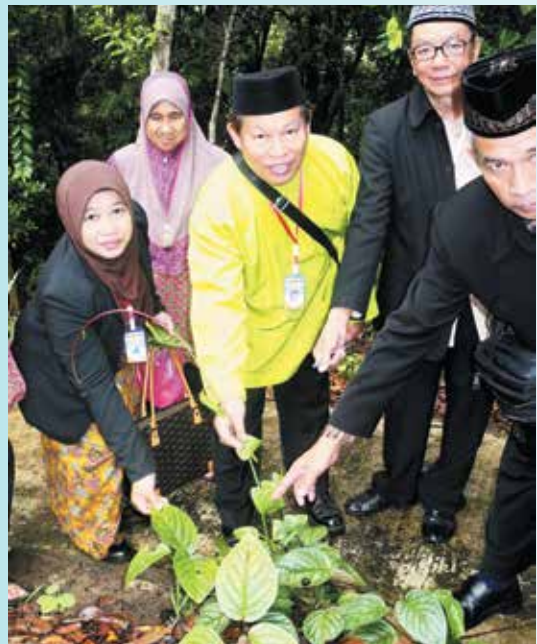
SALAH satu jenis daun dipanggil buas-buas panalan (sinaran bulan) dapat menyembuhkan pelbagai penyakit seperti kanser.

Daripada namanya juga awda dapat mengetahui bahawa taman ini memiliki pelbagai tumbuhan herba yang banyak memberikan pengetahuan dan khasiat yang berguna bagi para pengamal perubatan kampung dan tradisi, kita jua akan dapat mengenali nama dan jenis-jenis pohon herba yang didapati di tempat ini.