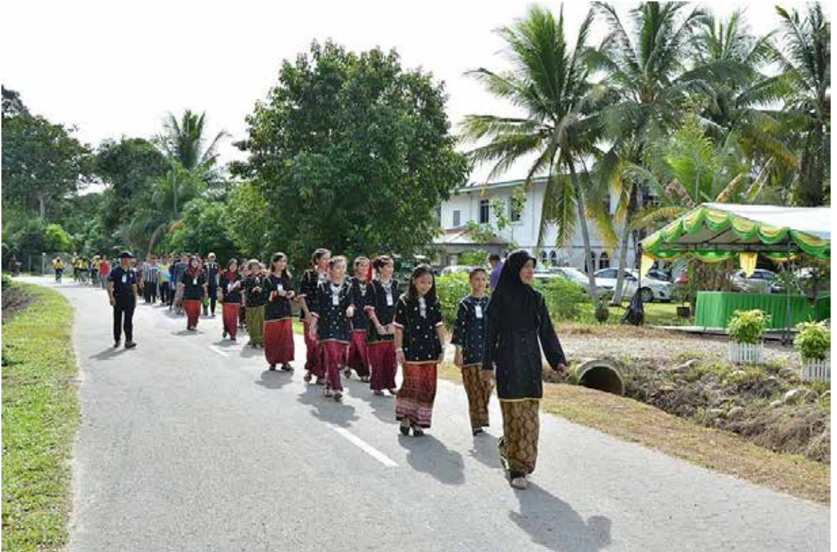
PENGLIBATAN masyarakat kampung di Festival Kiudang 2016.