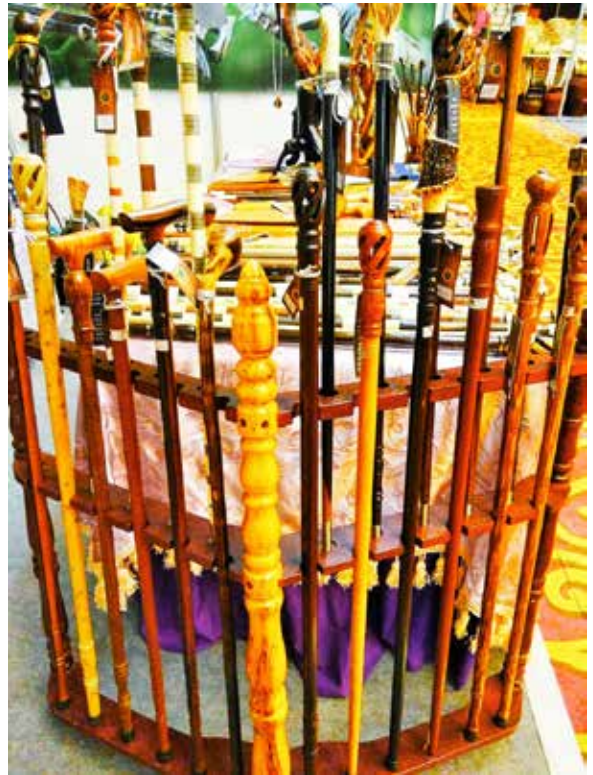
KRAF tangan berupa tongkat pelbagai bentuk dan ukiran hasil sentuhan Awang Haji Ishak sendiri yang juga merupakan produk bagi Kampung Lumut II.

“Sejak melibatkan diri dalam hasil kraf tangan hingga kini sudah banyak hasil koleksi yang saya hasilkan, memandangkan dalam setahun sahaja saya berupaya menghasilkan kira-kira 600 batang tongkat,” ujar Awang Haji Ishak.