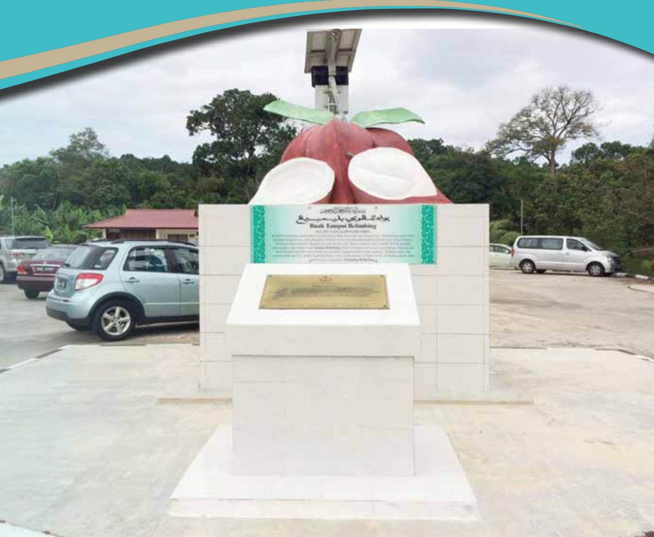
MERCU tanda Kampung Belimbing.