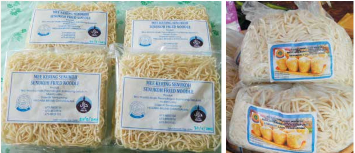
MEE Kering Senukoh dan Mee Kuning Biro Wanita Majlis Perundingan Kampung Senukoh (kiri dan kanan).