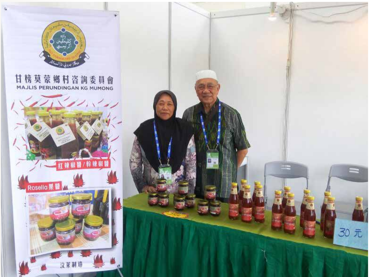
PRODUK-PRODUK Kampung Mumong di Ekspo China - ASEAN (CAEXPO) Ke-14 di Nanning, Republik Rakyat China pada 8 - 15 September 2017.

Dalam memasarkan dan mempromosikan produk-produk kampung berkenaan, MPK Mumong giat mengikuti pameran dan ekspo bukan sahaja di Daerah Belait sendiri, tetapi juga di Bandar Seri Begawan, bahkan mereka sudah melangkah keluar negara. Baru-baru ini MPK Mumong adalah antara lebih 100 syarikat dari Negara Brunei Darussalam yang terdiri daripada Perusahaan Mikro, Kecil dan Sederhana (MSME), yang mempamerkan produk mereka di Pavilion Komoditi Negara Brunei Darussalam bagi Ekspo China - ASEAN (CAEXPO) Ke-14 bertempat di Pusat Persidangan dan Pameran Antarabangsa Nanning (NICEC), di Nanning Republik Rakyat China pada 8 hingga 15 September 2017.