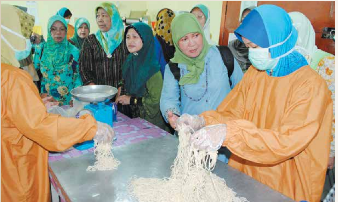
TUNJUK cara proses pembuatan Mee Kuning Basah Kampung Senukoh semasa lawatan dari pelbagai agensi ke kampung berkenaan (atas dan bawah).