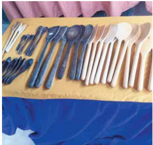
PRODUK-PRODUK dari jenis kayu yang diperolehi dari Taman Herba Kampung Putat berjaya dihasilkan terdiri daripada sudu dan gagawi.