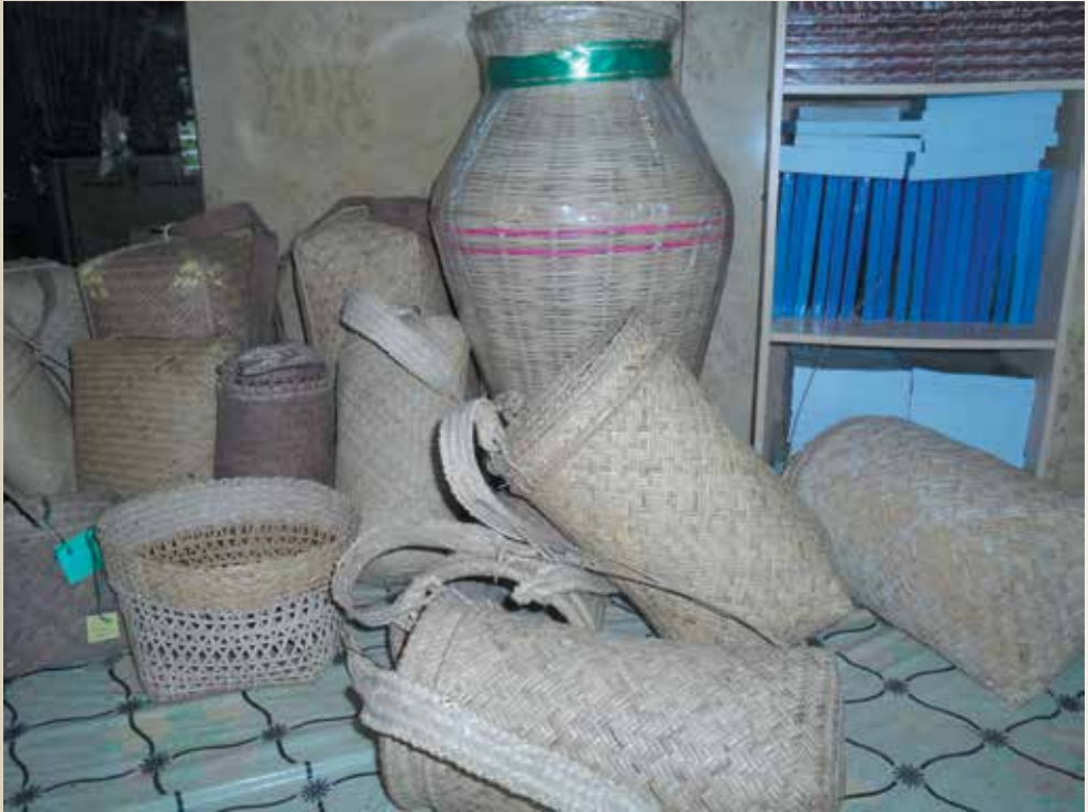
DI ANTARA kraf tangan yang dihasilkan oleh penduduk Mukim Sukang (atas dan bawah).