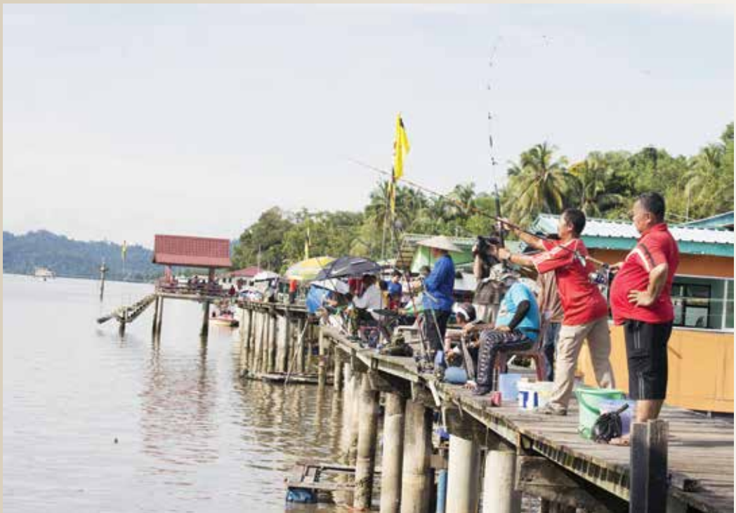
CABARAN Pancing Kampung Sungai Matan yang diadakan pada tahun 2014.