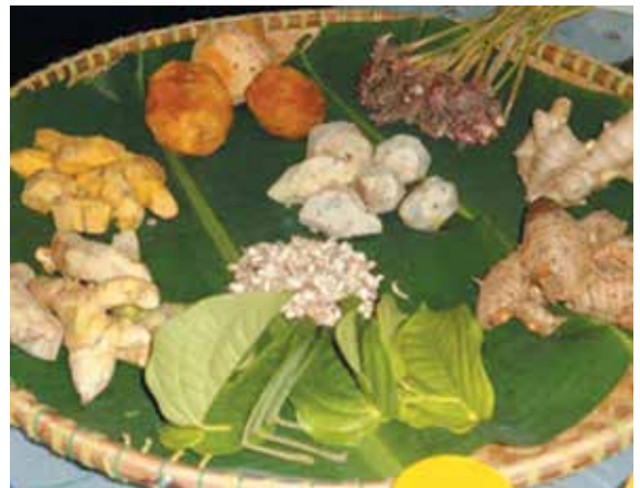
PENGUNJUNG luar negara juga turut tertarik dengan produk-produk tempatan yang dijual (kiri), sementara gambar kanan, antara ramuan yang digunakan untuk membuat Minyak Temulawak.