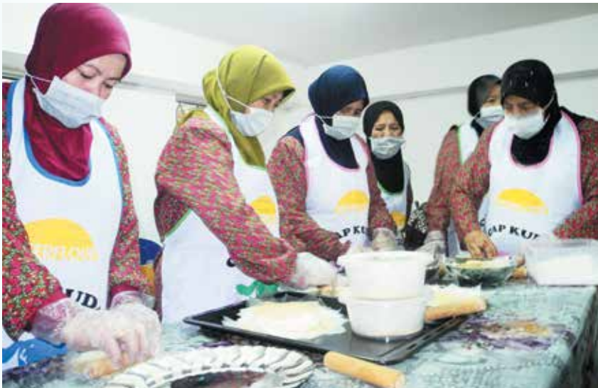
KAUM wanita juga aktif membuat kuih-muih untuk sumber pendapatan.

Kita amat kagum dengan semangat usaha penduduk-penduduk dalam bidang seni kreatif juga menyediakan kuih-muih yang mampu menjadi sumber pendapatan, dan ruang untuk meningkatkan lagi produk-produk kampung ini supaya ia dapat dimajukan lagi bagi menembusi pasaran dalam dan luar negara.