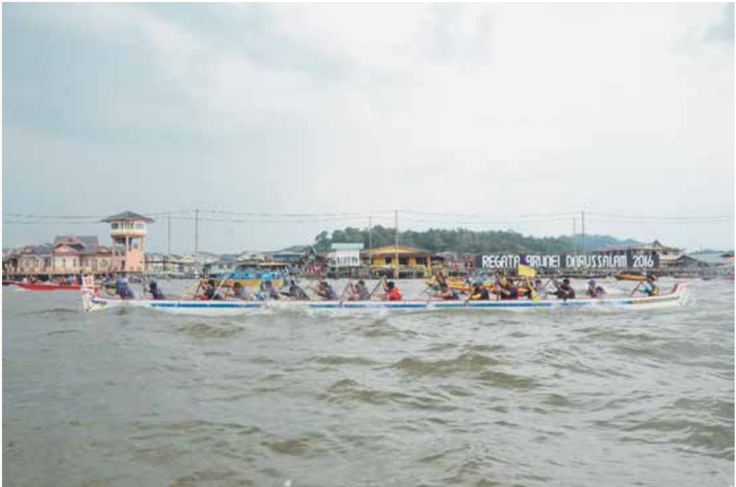
ANTARA aksi-aksi Pasukan Lela Cheteria ketika menyertai Lumba Perahu di negara ini.