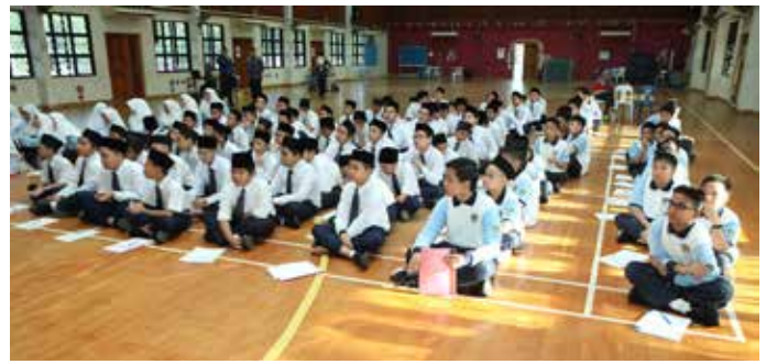
PENUNTUT Sekolah Menengah Berakas semasa mendengarkan Taklimat Kenegaraan pada 13 Februari 2019.