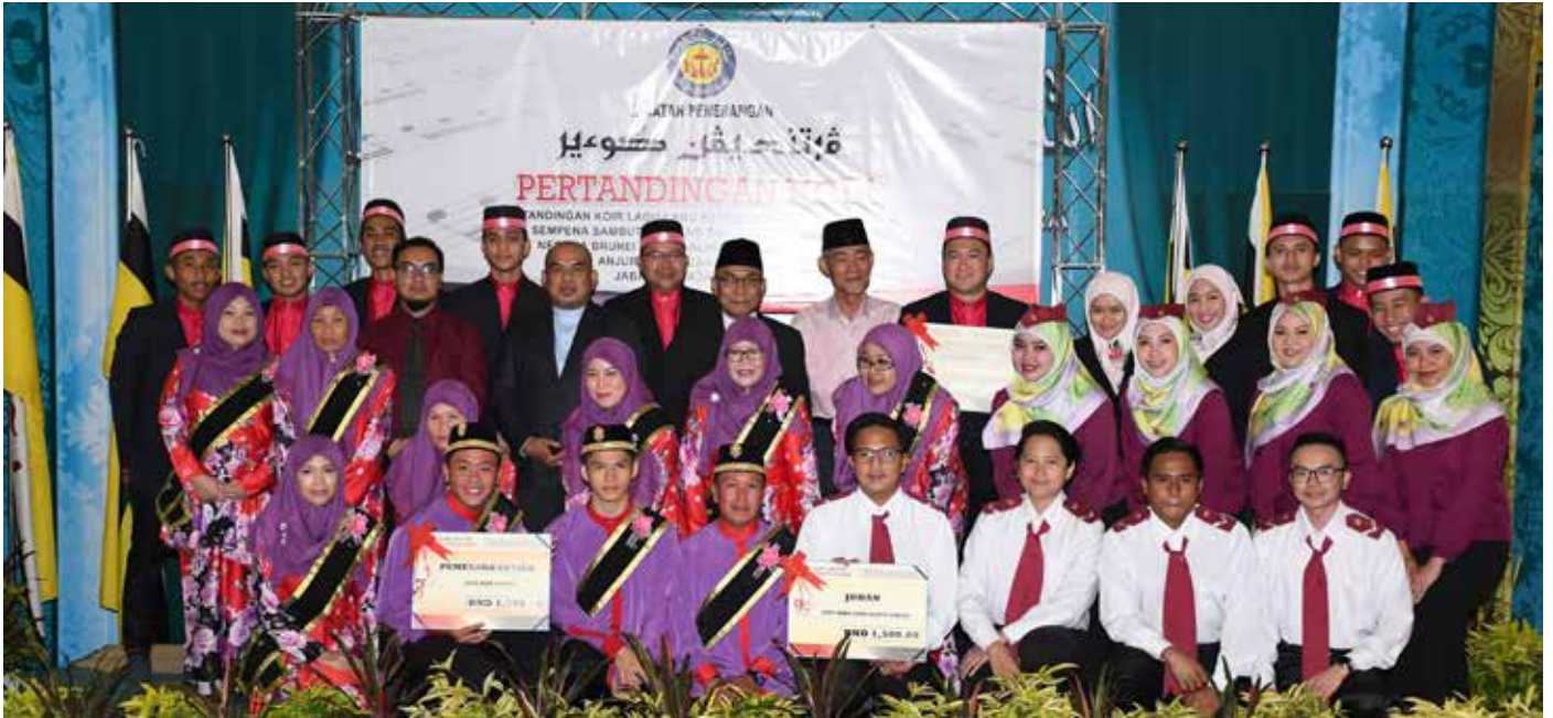
Kumpulan Telisai Harmonics, Mukim Telisai, juara bergambar ramai bersama tetamu kehormat majlis.

Bagi Daerah Belait, pertandingan diadakan pada hari Sabtu, 9 Februari yang mana juara disandang oleh Kumpulan Koir PERMATA 2.0 dari Mukim Seria dengan lagu 'Tanah Airku'. Sementara naib juara pula dimenangi oleh Kumpulan Koir RAWDAH dari Mukim Belait dengan lagu 'Tekad Kemerdekaan'. Kumpulan Koir MPK LABI1 dari Mukim Labi 'Berkibarlah Bendera' menduduki tempat ketiga.