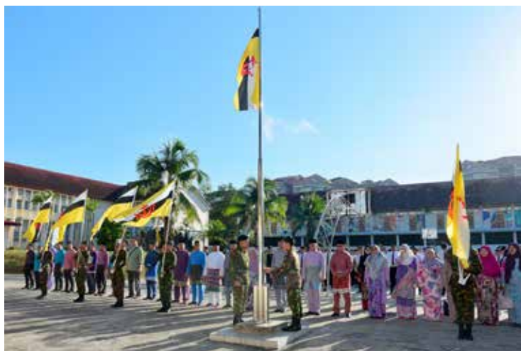
MENYANYIKAN Lagu Kebangsaan Negara Brunei Darussalam 'Allah Peliharakan Sultan'.