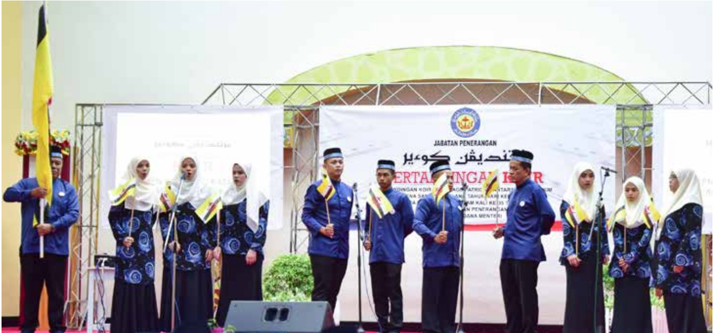
KUMPULAN RPN Kampung Rataie dari Mukim Bokok muncul johan bagi Pertandingan Koir Lagu-Lagu Patriotik Antara Mukim-Mukim Bagi Program Semarak Pengibaran Bendera Negara Sempena Sambutan Ulang Tahun Hari Kebangsaan Negara Brunei Darussalam Kali Ke-35 Tahun 2019.

Sementara Kumpulan Koir Harmonika dari Mukim Batu Apoi dan Kumpulan Mukim Amo masing-masing menerima hadiah sagu hati wang tunai berjumlah BND500.00 berserta sijil penyertaan.