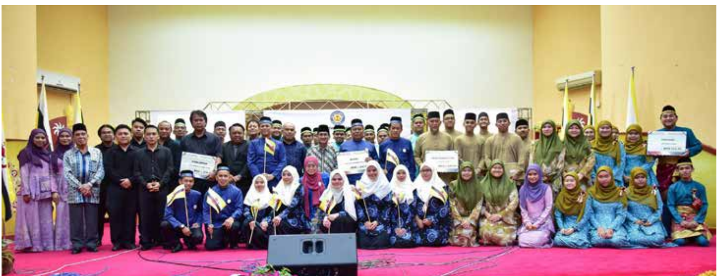
TETAMU kehormat bergambar ramai bersama para pemenang pertandingan bagi Daerah Temburong.