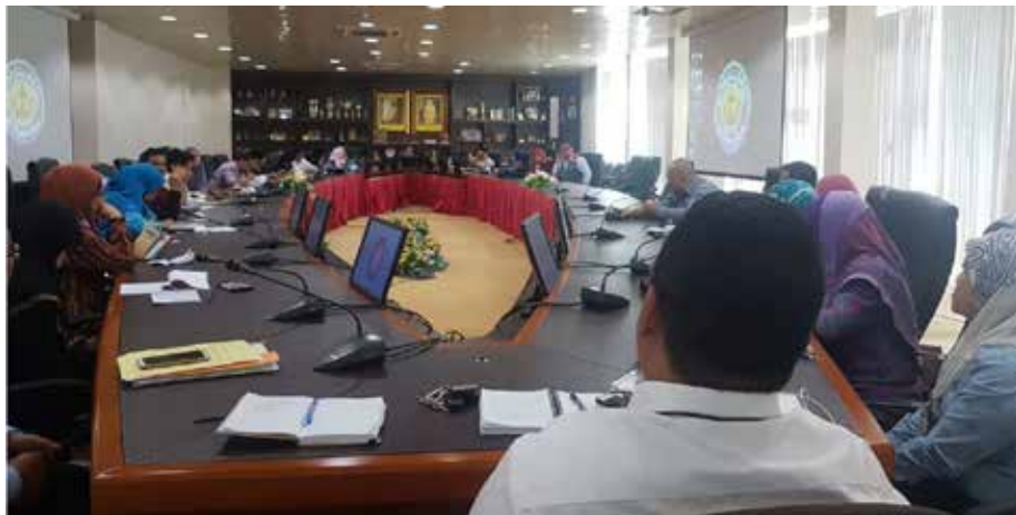
PERJUMPAAN Hari Khamis (PHK) yang dikendalikan oleh Bahagian Pengurusan.

Di samping itu, bahagian ini juga menyelaras jadual liputan dan jurugambar bagi Pelita Brunei, akhbar rasmi kerajaan.