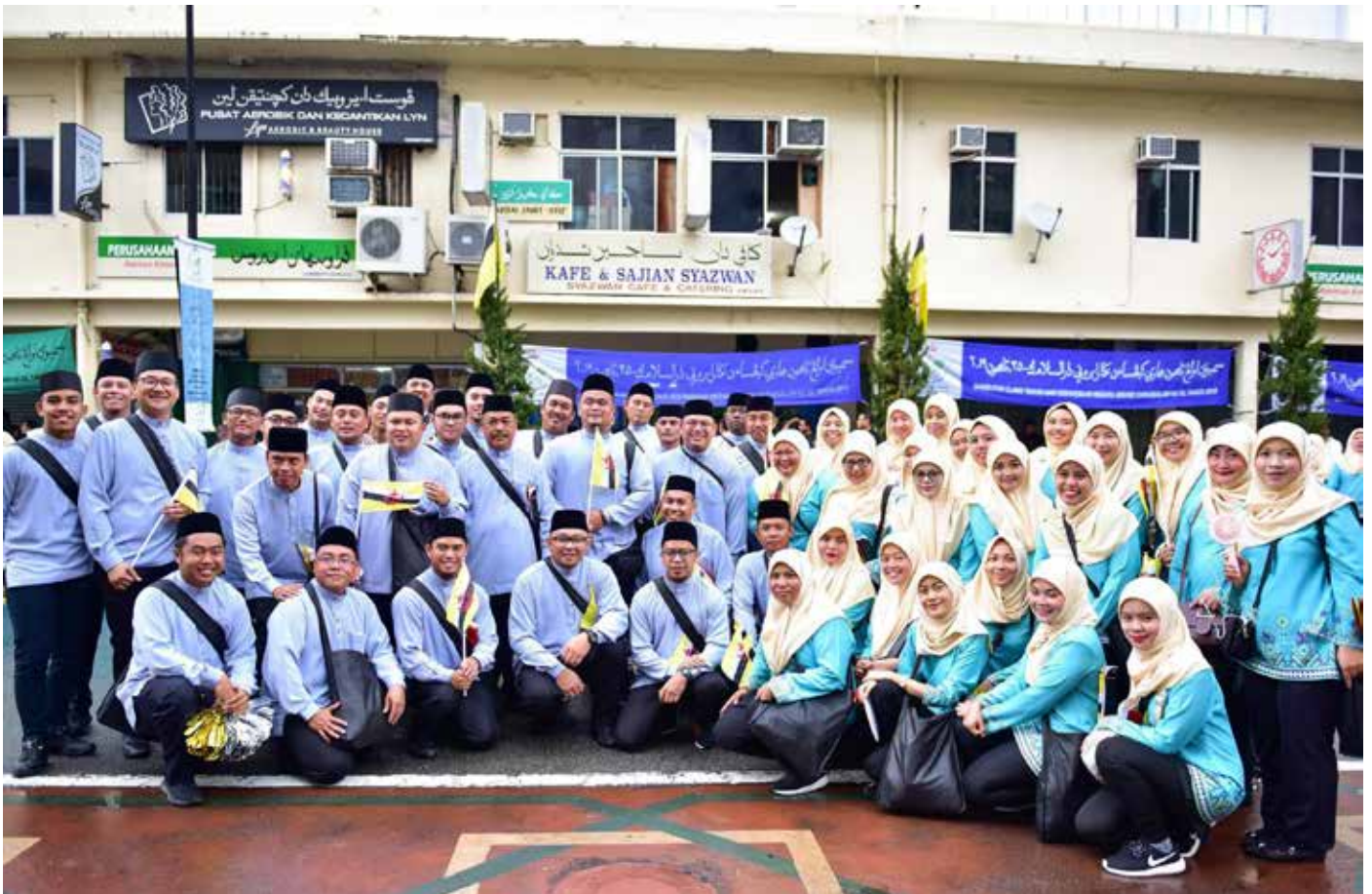
WARGA Jabatan Penerangan bersama-sama warga dalam jabatan lain di bawah Jabatan Perdana Menteri bergambar ramai semasa Sambutan Ulang Tahun Hari Kebangsaan Negara Brunei Darussalam Ke-35, Tahun 2019.