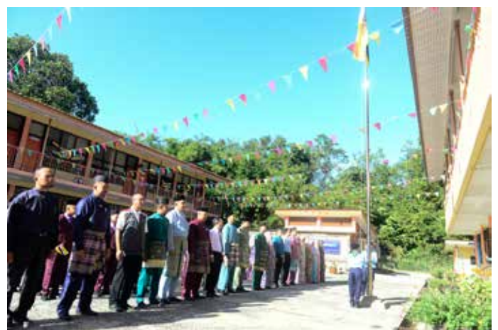
TETAMU kehormat bersama warga sekolah menyanyikan Lagu Kebangsaan Allah Peliharakan Sultan.