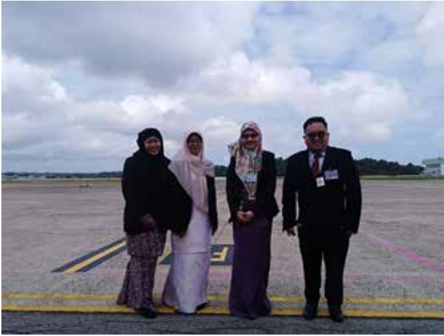
MRO ketika bertugas semasa Lawatan Rasmi Presiden Lao pada 16 Februari 2019.