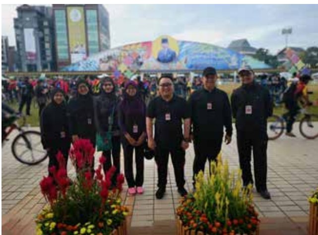
BERTUGAS semasa Riadah Berbasikal yang diadakan pada 24 Februari 2019 di Taman Haji Sir Muda Omar 'Ali Saifuddien.