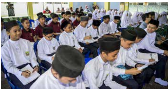
PELAJAR Tahun 7, Ma' had Islam Brunei yang mengikuti Taklimat Kenegaraan pada 26 Februari 2019.