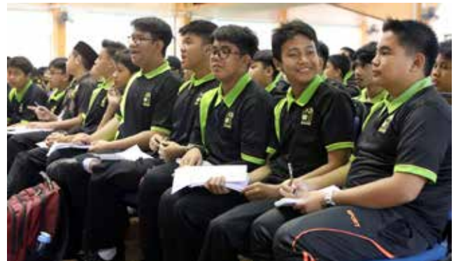
SEBAGIAN daripada penuntut Maktab SOAS yang hadir semasa jerayawara pada 26 Februari 2019.