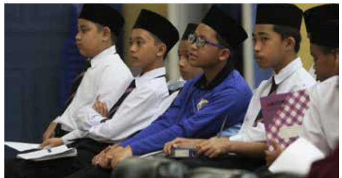
SEBAHAGIAN daripada penuntut Sekolah Menengah Raja Isteri Pengiran Anak Saleha (SM RIPAS), Kampung Birau, Mukim Kiudang, Tutong yang hadir dalam Taklimat Kenegaraan pada 28 Februari 2019.