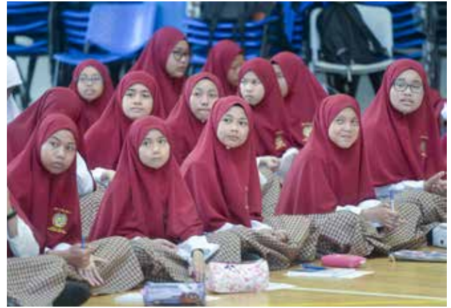
PENUNTUT yang menghadiri Jerayawara Kenali ASEAN di Dewan Serbaguna, Sekolah Menengah Katok pada 6 Februari 2019.