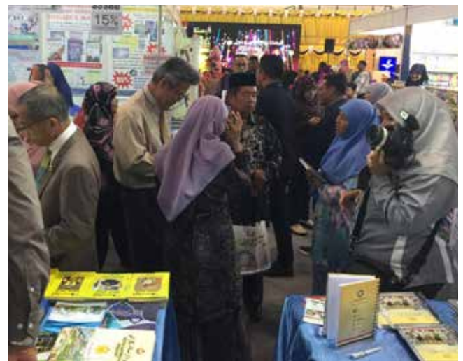
ANTARA warga Jabatan Penerangan yang terlibat dalam jualan buku semasa Pesta Buku 2019.