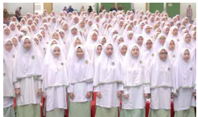
PARA penuntut STPRI yang hadir pada jerayawara yang diadakan pada 27 Februari 2019.