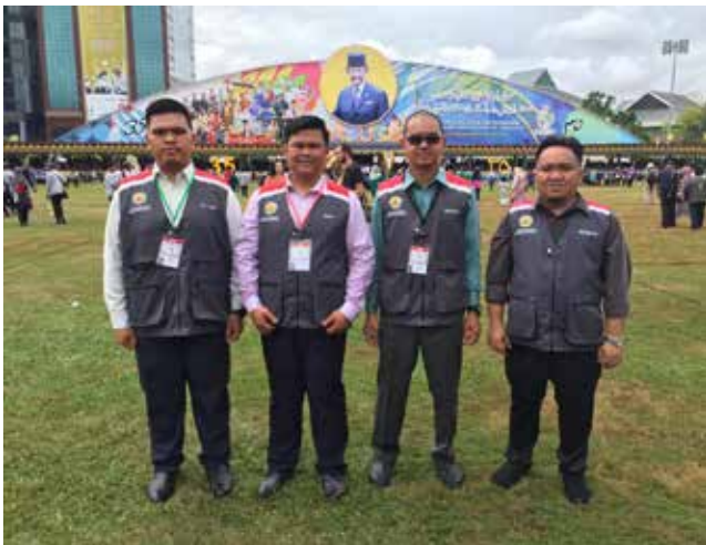
BERTUGAS semasa Sambutan Ulang Tahun Hari Kebangsaan Negara Brunei Darussalam Ke-35, Tahun 2019 pada 23 Februari 2019.