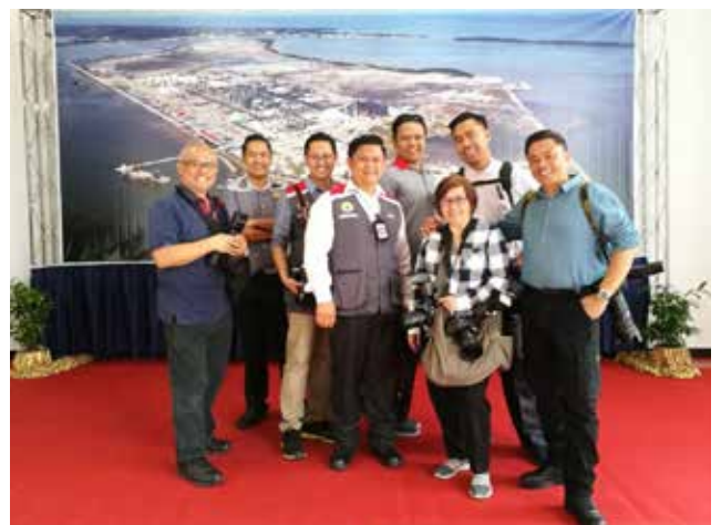
BERSAMA rakan media semasa lawatan Duli Yang Teramat Mulia Paduka Seri Pengiran Muda Mahkota Pengiran Muda Haji Al-Muhtadee Billah ke Pulau Muara Besar pada 28 Februari 2019.