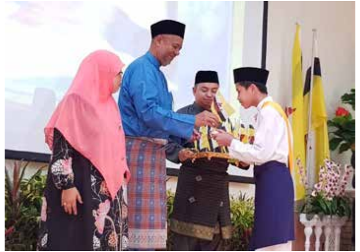
TETAMU kehormat semasa mengagihkan bendera kecil kepada pelajar-pelajar sekolah di Sekolah Ugama Pengiran Anak Puteri Fadzillah Lubabul Bolkiah, Kampung Kupang bagi Daerah Tutong.