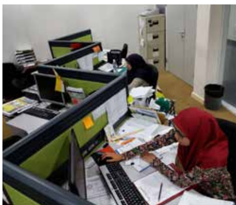
PEGAWAI dan kakitangan di Bahagian Pengurusan semasa menjalankan tugas yang diamanahkan.