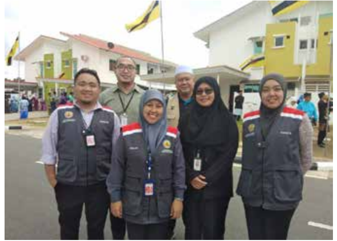
BERSAMA jurufoto dan pemberita Jabatan Penerangan ketika pengurniaan anak kunci pada 18 Februari 2019.