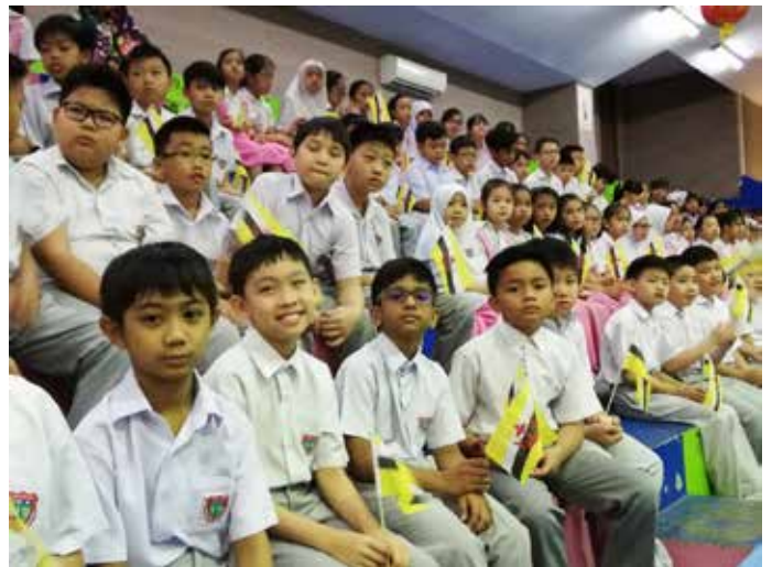
PENYERTAAN seramai 200 orang penuntut pada Program Majlis Pengagihan Bendera Kecil Meja dan Program Semarak Pengibaran Bendera berlangsung di Sekolah Chung Hua, Kuala Belait.