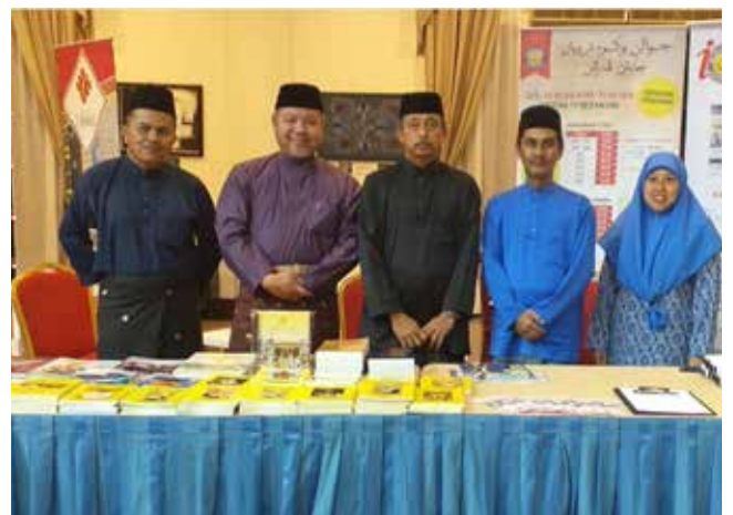
SUASANA jualan buku semasa Majlis Musabaqah Membaca Al-Quran Bahagian Dewasa Peringkat Akhir Kebangsaan Tahun 1440 Hijrah/2019 Masihi yang berlangsung di Dewan Plenary, Pusat Persidangan Antarabangsa, Berakas.