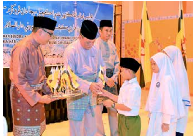
TETAMU kehormat semasa mengagihkan bendera kecil kepada pelajar-pelajar sekolah di Maktab Sultan Omar 'Ali Saifuddin, Bandar Seri Begawan bagi Daerah Brunei dan Muara.