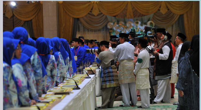
SUASANA semasa pegawai dan kakitangan Jabatan Penerangan bertugas di Istana Nurul Iman.