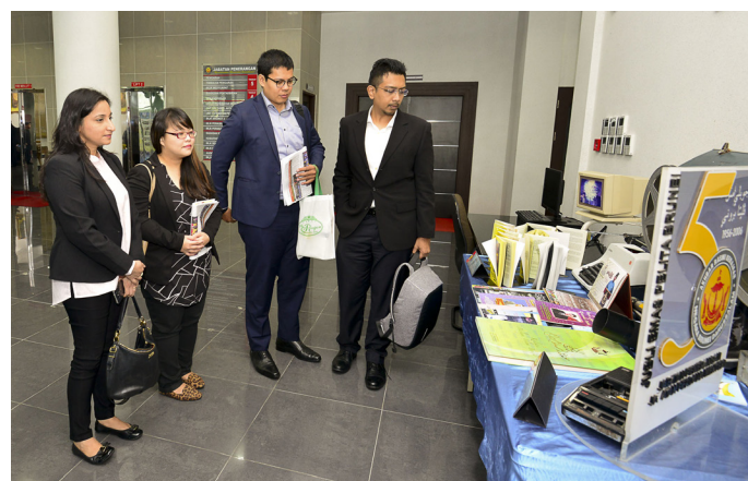
PARA pegawai daripada Republik Singapura yang mengikuti Program Pertukaran tersebut dibawa melawat pameran di Ruang Lobi Bangunan Baharu, Jabatan Penerangan.