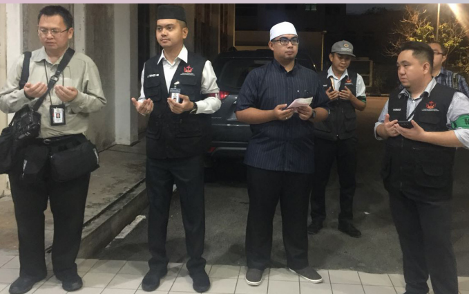
DOA selamat dibacakan sebelum menjalankan tugas supaya dipermudahkan segala urusan.