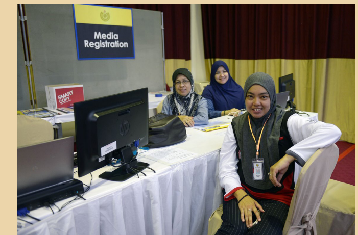
SUASANA di Pusat Media semasa Sambutan Jubli Emas Kebawah Duli Yang Maha Mulia Paduka Seri Baginda Sultan dan Yang Di-Pertuan Negara Brunei Darussalam Menaiki Takhta.