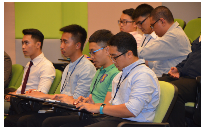
PESERTA-PESERTA yang menyertai Program Perkampungan Sivik Lepas Ijazah Negara Brunei Darussalam yang menghadiri taklimat berkenaan.

Para peserta perkampungan sivik juga berpeluang melawat 'Business Helpdesk' yang terletak di Bangunan D&T.