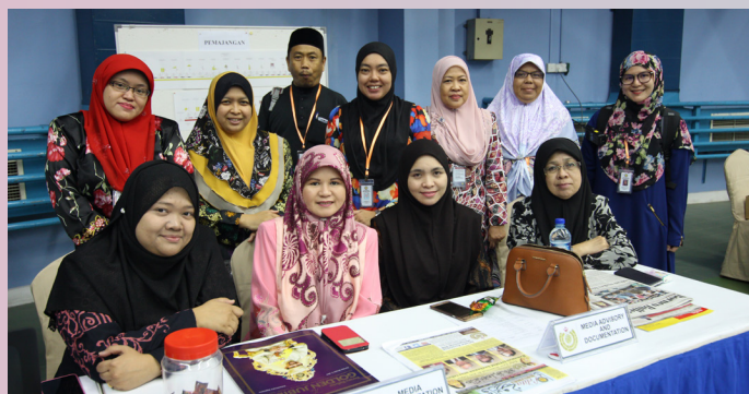
SEBAHAGIAN AJK yang terlibat semasa sambutan tersebut.