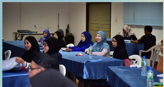
LEPASAN Ijazah Negara Brunei Darussalam yang mengikuti Program Perkampungan Sivik bagi sesi 12.

Para peserta kemudian mengadakan sesi 'brainstorming' dan perbincangan secara berkumpulan mengenai penggambaran yang akan mereka mulakan mengenai aktiviti-aktiviti yang telah mereka jalani sepanjang program perkampungan sivik berkenaan.