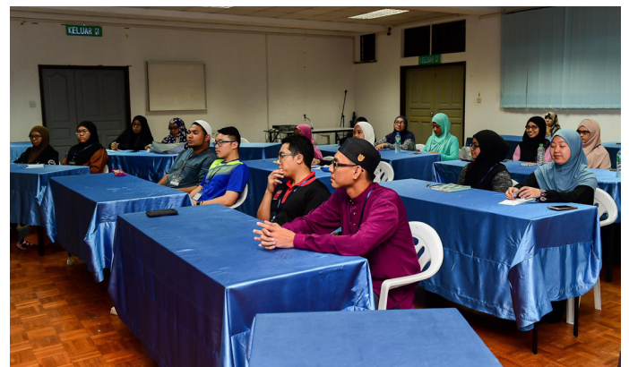
SEBAHAGIAN peserta Program Perkampungan Sivik yang hadir.

Para peserta juga mengikuti aktiviti permainan dengan meneka pasangan masing-masing secara berkumpulan.