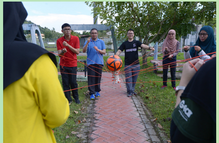
ANTARA aktiviti yang berkonsepkan membina semangat berpasukan yang dikendalikan oleh Outward Bound Brunei Darussalam.

Beliau yang meminati sektor perusahaan juga berharap dengan adanya lawatan-lawatan ke tempat-tempat yang telah diaturkan seperti ladang lada di Pusat Latihan Pertanian Sinaut akan membolehkan beliau berinteraksi bersama pengusaha mengenai cabaran-cabaran dalam perusahaan dan cara-cara mengatasinya.