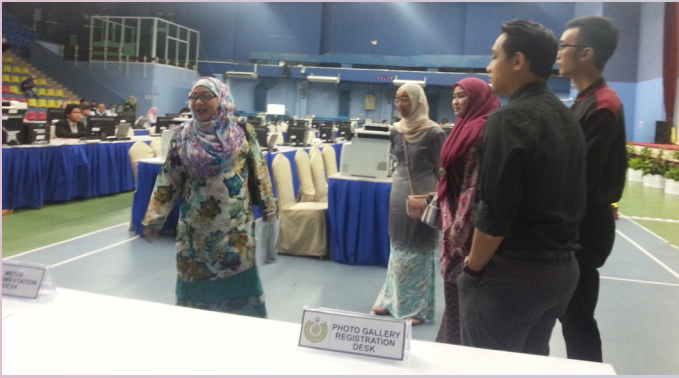
KETUA-KETUA AJK semasa memberikan penjelasan kepada para sukarelawan mengenai tugas dan tanggungjawab mereka sepanjang sambutan ini berlangsung.