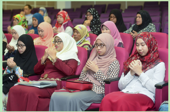
ANTARA peserta Program Perkampungan Sivik.