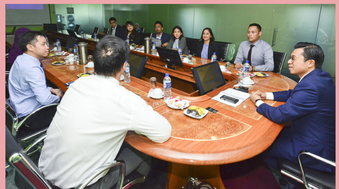
SEMASA mengadakan lawatan ke Pusat Promosi Kesihatan, Kementerian Kesihatan.