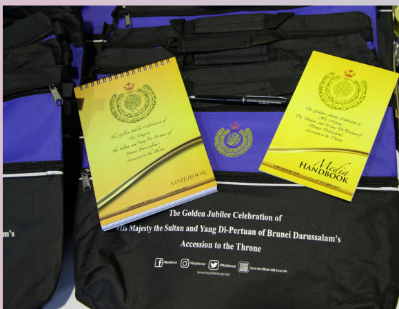
PRESS Kit Jubli Emas yang diagihkan kepada media dalam dan luar negara serta ahli jawatankuasa yang bertugas.