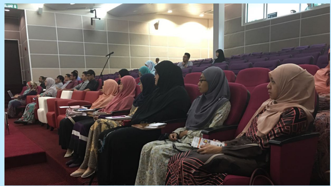
ANTARA peserta Program Perkampungan Sivik yang mendengarkan taklimat tersebut.