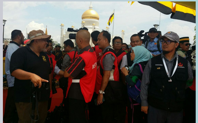
PEGAWAI dan kakitangan Jabatan Penerangan bertugas semasa Perarakan Kenderaan Berhias, Perasmian Eko Koridor dan Majlis Junjung Kasih dan Kesyukuran. (atas dan bawah).