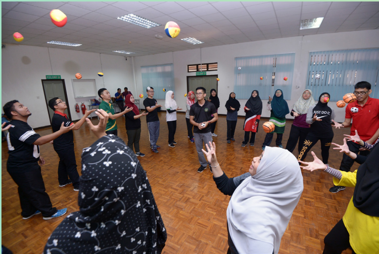
SESI Suai Kenal para peserta Perkampungan Sivik Lepasn Ijazah Negara Brunei Darussalam Ke-2 Tahun 2017 dikendalikan oleh Outward Bound Brunei Darussalam.

Para peserta akan berkampung selama enam hari lima malam di Dewan Kompleks Sukan Sungai Kebun dan menjalani pelbagai aktiviti taklimat dan sesi dialog, aktiviti riadah, keagamaan dan juga lawatan.