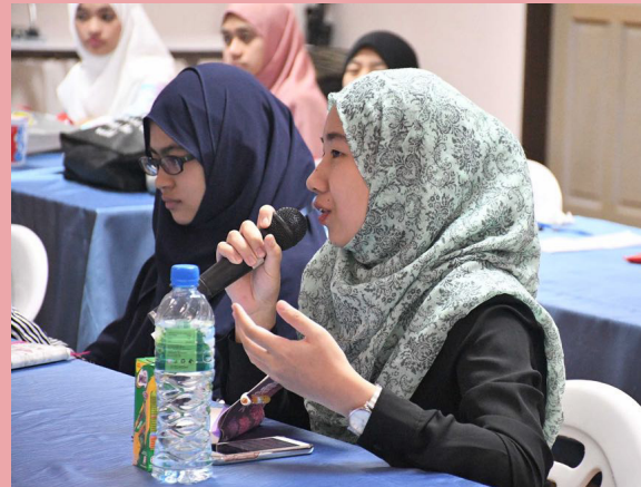
ANTARA peserta yang mengajukan soalan.

Ia juga diisikan dengan sesi soal jawab yang dibukakan kepada para peserta untuk mengajukan soalan pada penghujung kedua-dua taklimat tersebut.