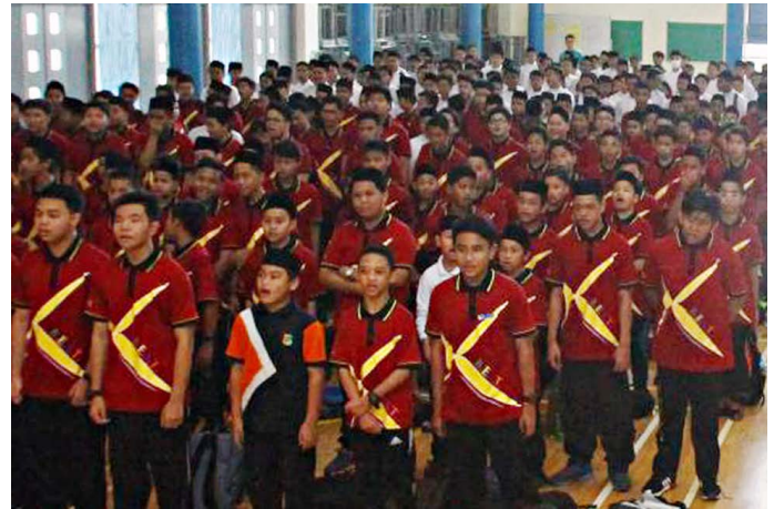
SEBAHAGIAN daripada penuntut-penuntut berdiri tegak semasa menyanyikan lagu kebangsaan di jerayawara tersebut. (atas, bawah)

Turut diadakan ialah Kuiz Kenali ASEAN dan penyampaian hadiah kepada 10 penuntut yang berjaya menjawab kuiz tersebut.