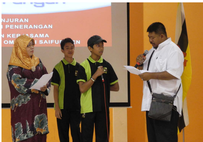
DUA orang artis tempatan semasa mengajukan soalan kepada salah seorang pelajar yang mengikuti kuiz.