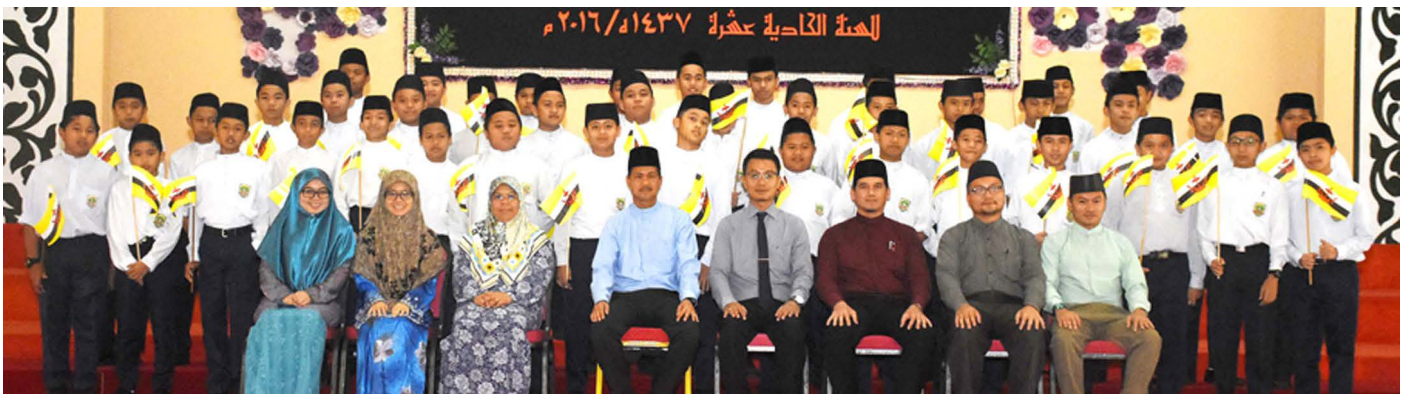
PARA Pegawai Jabatan Penerangan berserta Timbalan Pengetua, guru-gu dan penuntut tahun 7 Ma'had Islam Brunei bergambar ramai selepas program Taklimat Kenegaraan diadakan.

Berita dan Foto : Ak. Syi'aruddin Pg. Dauddin