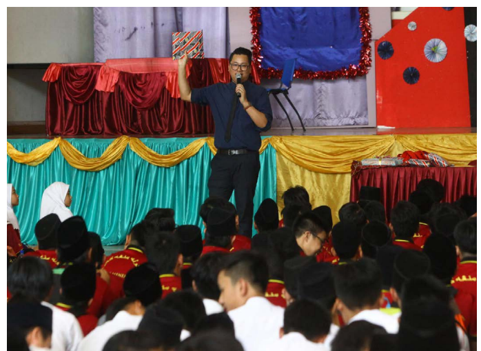
PEGAWAI dari Unit Hal Ehwal Antarabangsa, Jabatan Penerangan semasa mengajukan soalan dalam ruangan Kuiz Kenali ASEAN.