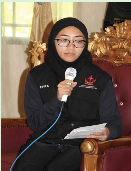
PEGAWAI dari Jabatan Penerangan semasa memberi penerangan mengenai tatacara memasukkan ikon pintas e-Paper Pelita Brunei.

Turut disampaikan ialah memperkenalkan dan membarigakan versi digital Pelita Brunei, iaitu e-Paper Pelita Brunei dan Pelita Brunei Online termasuk tatacara untuk memuat turun e-Paper Pelita Brunei serta mengenai penggunaan bendera, 'banner' dan bahan-bahan yang mempunyai kepentingan nasional serta bahan-bahan bacaan mengenai Wawasan Brunei 2035 dan Perintah Kanun Hukuman Jenayah Syar'iah 2013.