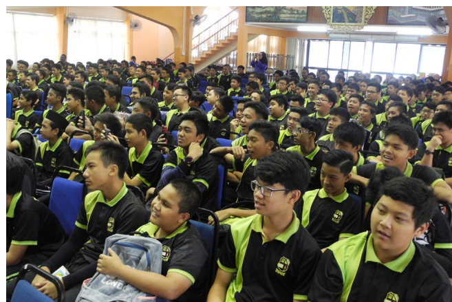
SEBAHAGIAN penuntut Tahun 9 dan 10 Maktab SOAS yang mengikuti Program Rakan Remaja Penerangan.