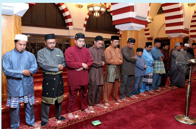
SEBAHAGIAN daripada Pegawai dan Kakitangan Lelaki Jabatan Penerangan semasa menunaikan Sembahyang Fardhu Maghrib, Isyak dan Sunat Hajat Berjemaah sempena memperingati Penubuhan Jabatan Penerangan Ke-65 Tahun, 2017.