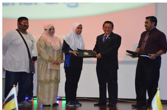
TETAMU Kehormat semasa menyampaikan hadiah kepada penuntut yang berjaya menjawab soalan Kuiz Kenegaraan.