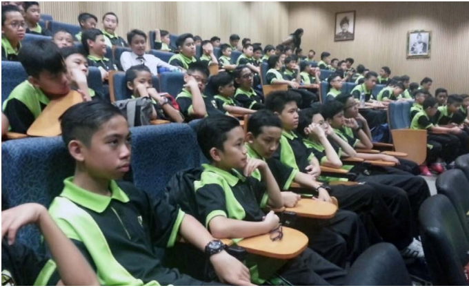
PELAJAR -pelajar Maktab SOAS yang menghadiri Taklimat Kenegaraan "Menghayati Bendera dan Lagu Kebangsaan Negara Brunei Darussalam" anjuran Jabatan Penerangan.