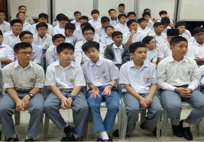
ANTARA pelajar Tahun 7 Sekolah Menengah St. George yang menghadiri Taklimat Kenegaraan.