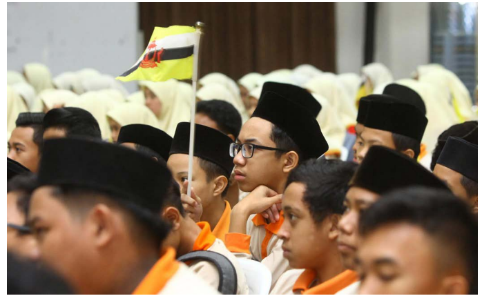
Sebahagian pelajar lelaki dan perempuan Tahun 9 dan Tahun 10 semasa menghadiri program tersebut.

Oleh : Nooratini Haji Abas