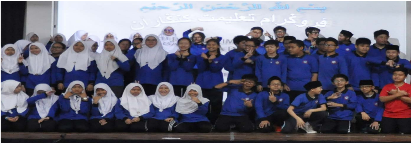
PENUNTUT Tahun 7 Sekolah Saint John, Kuala Belait ketika bergambar ramai pada program tersebut.