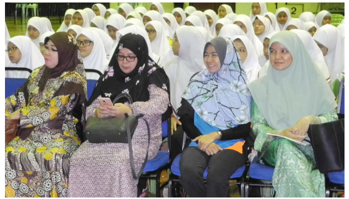
SEBAHAGIAN daripada para pegawai, guru dan penuntut Sekolah Menengah Sayyidina Hasan hadir pada taklimat tersebut.