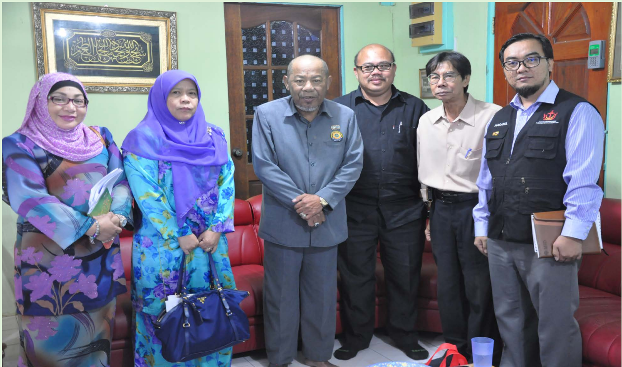
SESI bergambar ramai rombongan dari Jabatan Penerangan bersama Ketua Kampung Sungai Teraban semasa Program Sua Muka.

Oleh : Noraisah Muhammed