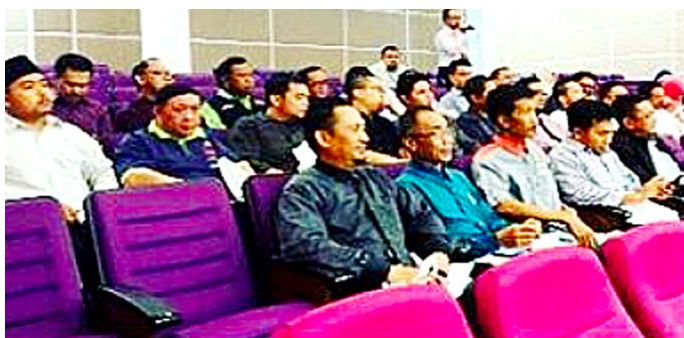
PARA pegawai dan kakitangan Jabatan Penerangan semasa menghadiri Taklimat Perancangan Kewangan tersebut.

B ANDAR SERI BEGAWAN, Rabu, 22 Mac.- Pegawai dan Kakitangan Jabatan Penerangan hari ini berpeluang untuk mendengarkan Taklimat Perancangan Kewangan anjuran Bank Islam Brunei Berhad yang di adakan Dewan Auditorium, Bangunan Tambahan Jabatan Penerangan di sini.