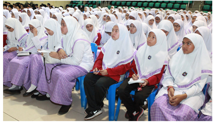
SEBAHAGIAN daripada pelajar Maktab Sains Paduka Seri Begawan Sultan ketika mendengarkan taklimat pada siri Program Taklimat Kenegaraan 'Menghayati Lagu Kebangsaan dan Bendera Negara' pada 17 Mei 2017.