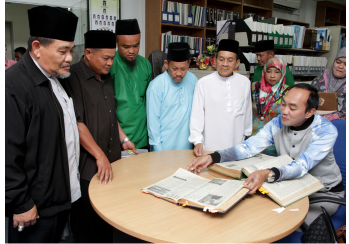
ROMBONGAN pelawat berkesempatan melihat secara lebih dekat mengenai penerbitan Pelita Brunei (kiri) manakala gambar (kanan) pelawat juga diperlihatkan terbitan-terbitan lama Jabatan Penerangan.

Oleh : Hajah Siti Zuraihah Haji Awang Sulaiman