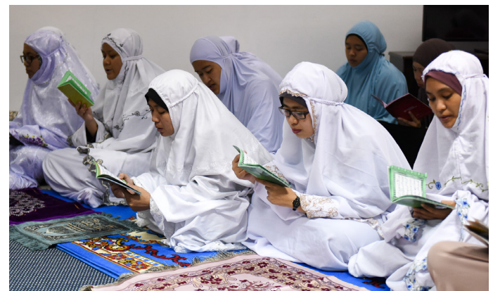
ANTARA aktiviti keagamaan yang diunkayahkan pada program tersebut.