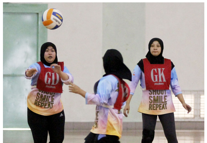
PASUKAN InfoNet (tuan rumah) semasa beraksi di kejohanan tersebut.