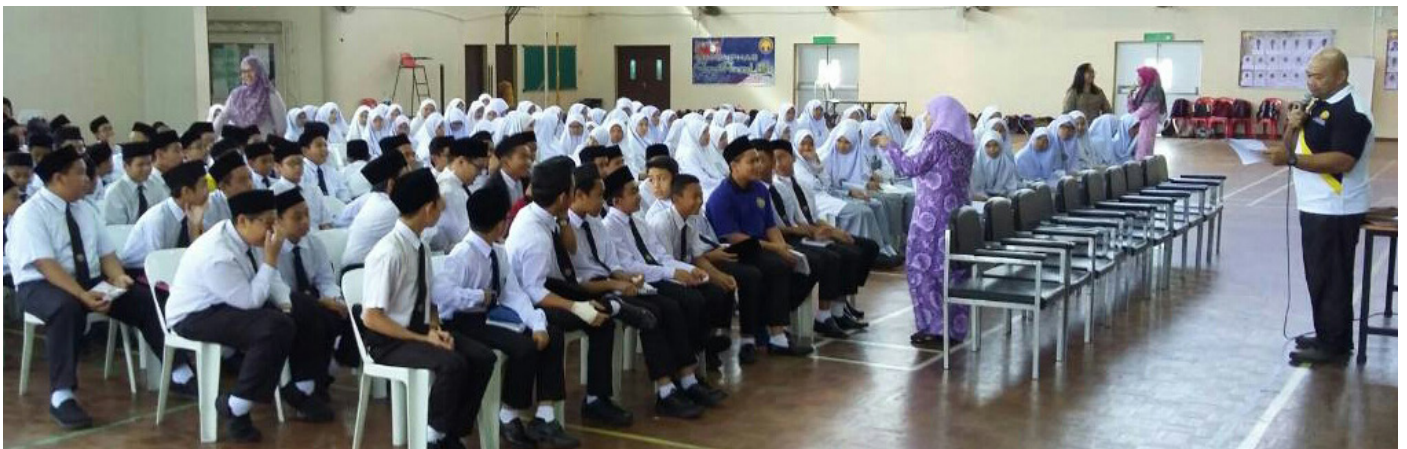
PROGRAM Taklimat Kenegaraan 'Menghayati Lagu Kebangsaan dan Bendera Negara' semasa diadakan di Sekolah Menengah Pengiran Jaya Negara Pengiran Haji Abu Bakar, Kuala Belait pada 30 Mei 2017.