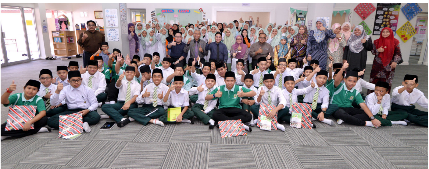
PARA pelajar Sekolah Menengah Rimba semasa bergambar ramai sempena Program Taklimat Kenegaraan ‘Menghayati Lagu Kebangsaan dan Bendera Negara pada 17 Mei 2017.