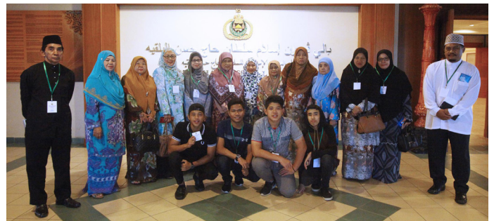
SEBAHAGIAN daripada peserta PMB semasa di bawa melawat ke Jabatan Mufti Kerajaan.

Selain taklimat, para peserta juga berpeluang mengikuti lawatan ke dua buah tempat, iaitu ke Riza Group dan Jabatan Mufti Kerajaan.