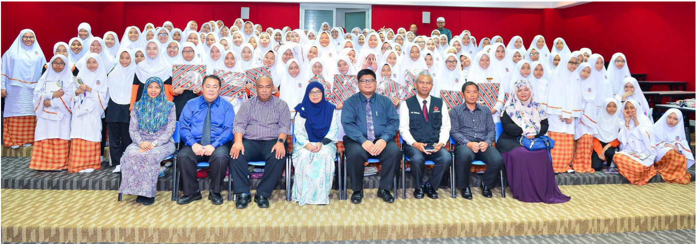
PROGRAM Taklimat Kenegaraan ‘Menghayati Lagu Kebangsaan dan Bendera Negara’ yang diadakan pada 8 Mei 2017 di Sekolah Menengah Pengiran Anak Puteri Masna.