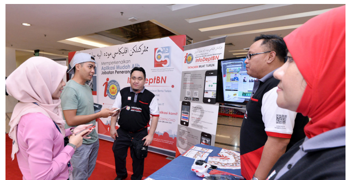
KELIHATAN orang ramai ketika berkunjung di jerayawara Aplikasi Mudah Alih Jabatan Penerangan InfoDept.Bn di Times Square.