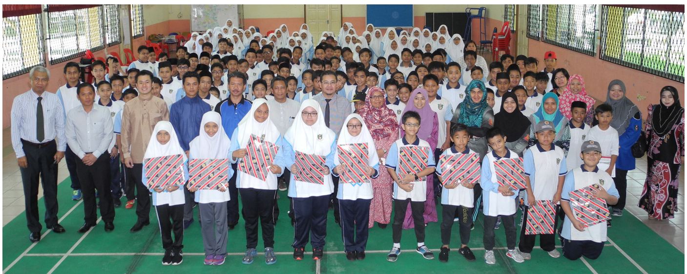
PROGRAM Taklimat Kenegaraan ‘Menghayati Lagu Kebangsaan dan Bendera Negara ketika diadakan di Sekolah Menengah Berakas pada 11 Mei 2017.