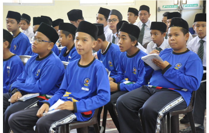
PROGRAM Taklimat Kenegaraan 'Menghayati Lagu Kebangsaan dan Bendera Negara' semasa diadakan di Sekolah Menengah Perdana Wazir, Kuala Belait pada 24 Mei 2017.