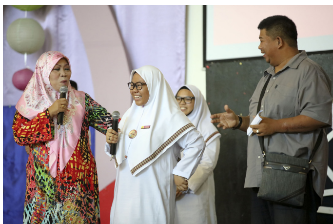
PERSEMBAHAN lawak jenaka dan Kuiz kenegaraan oleh pelawak-pelawak undangan tanah air.