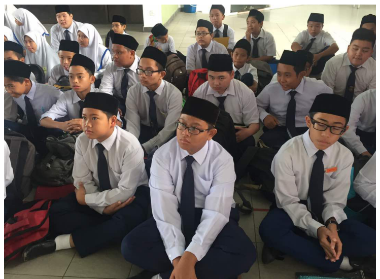
ANTARA pelajar lelaki yang menghadiri Taklimat Kenegaraan 'Menghayati Bendera dan Lagu Kebangsaan Negara Brunei Darussalam' bertempat di Sekolah Menengah Sayyidina Ali, Kuala Belait.