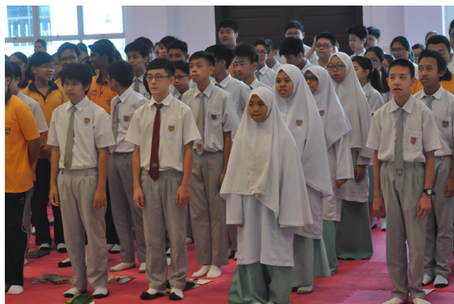
PENUNTUT-PENUNTUT Tahun 7, 8 dan 9 Sekolah Chung Hwa Middle School.