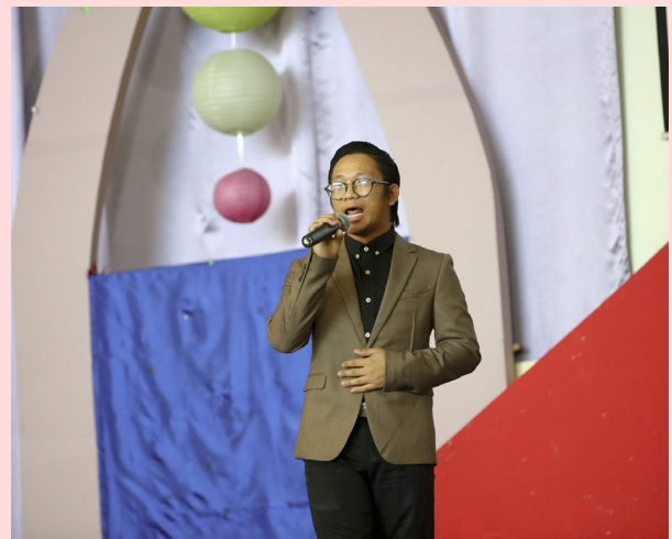
LAGU "Bulan Kerinduan" persembahan dari kakitangan Jabatan Penerangan.

Tetamu kehormat kemudian menyampaikan sijil dan hadiah kepada lima penuntut yang berjaya menjawab Kuiz Kenegaraan.