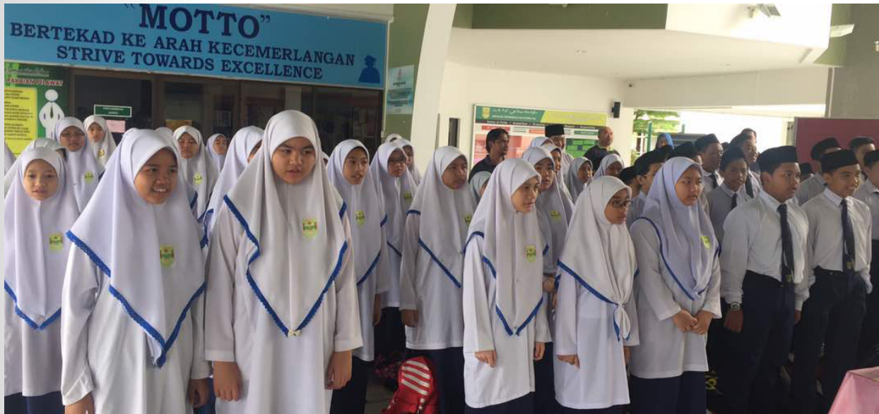
ANTARA pelajar perempuan yang menghadiri Taklimat Kenegaraan 'Menghayati Bendera dan Lagu Kebangsaan Negara Brunei Darussalam' bertempat di Sekolah Menengah Sayyidina Ali, Kuala Belait.