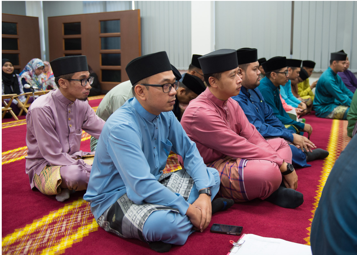
ANTARA pegawai dan kakitangan Jabatan Penerangan yang hadir dalam Majlis Sambutan Nuzul Al-Quran dan Khatam Al-Quran serta Penyampaian Derma Kepada Anak Yatim Jabatan Penerangan 1438 Hijrah/2017 Masihi.