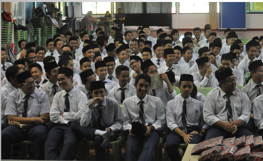
SERAMAI lebih 300 orang penuntut Sekolah Menengah Sayyidina Ali menghadiri Jerayawara Kenali ASEAN yang dikendalikan oleh Jabatan Penerangan.

“Saya mendapat ilmu pengetahuan dan sekali gus mengetahui beberapa maklumat mengenai negara ASEAN dan membuat saya berhasrat untuk mengunjungi dan melancong ke salah sebuah negara anggota ASEAN bersama kedua ibu bapa dan adik-beradik saya nanti.”