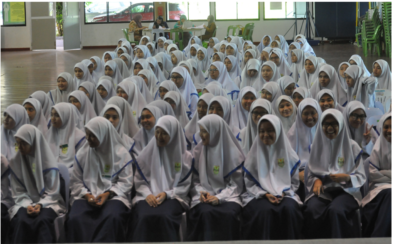
PENUNTUT perempuan Sekolah Menengah Sayyidina Ali menghadiri Jerayawara Kenali ASEAN yang dikendalikan oleh Jabatan Penerangan.

Program diakhiri dengan penyampaian hadiah kepada para penuntut yang berjaya menjawab kuiz dan diteruskan dengan penyampaian cenderahati kepada pihak sekolah.