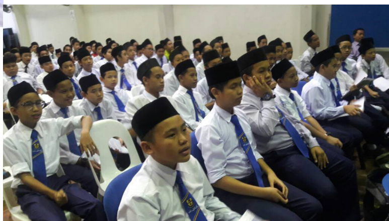
TAKLIMAT dihadiri oleh lebih 250 penuntut Maktab Anthony Abell.