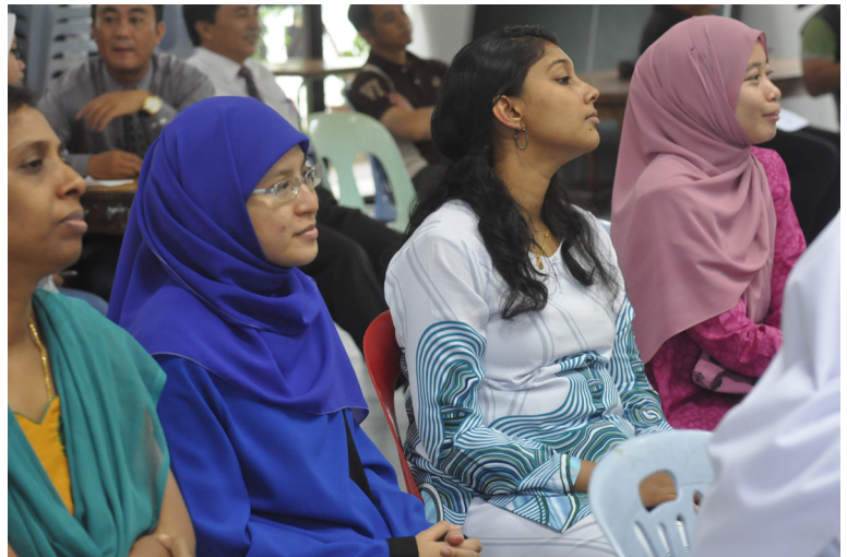
ANTARA guru-guru Sekolah Saint Margaret's yang hadir pada taklimat tersebut.