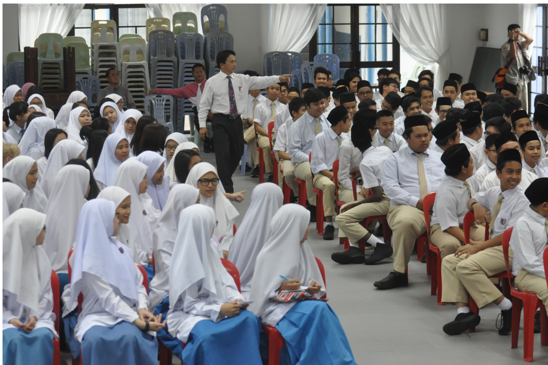
TAKLIMAT dihadiri oleh hampir 200 penuntut Sekolah Saint Margaret's.