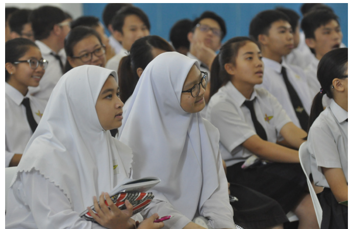
SEKITAR Taklimat Jerayawara ASEAN di Chung Ching Middle School, Seria.