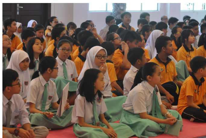
ANTARA 200 orang penuntut Chung Hwa Middle School yang menghadiri Jerayawara Kenali ASEAN anjuran Jabatan Penerangan, JPM.

Hadir sama ialah timbalan pengetua serta guru-guru dari sekolah berkenaan dan seramai hampir 200 penuntut-penuntut Tahun 7, 8 dan 9 di sekolah berkenaan.