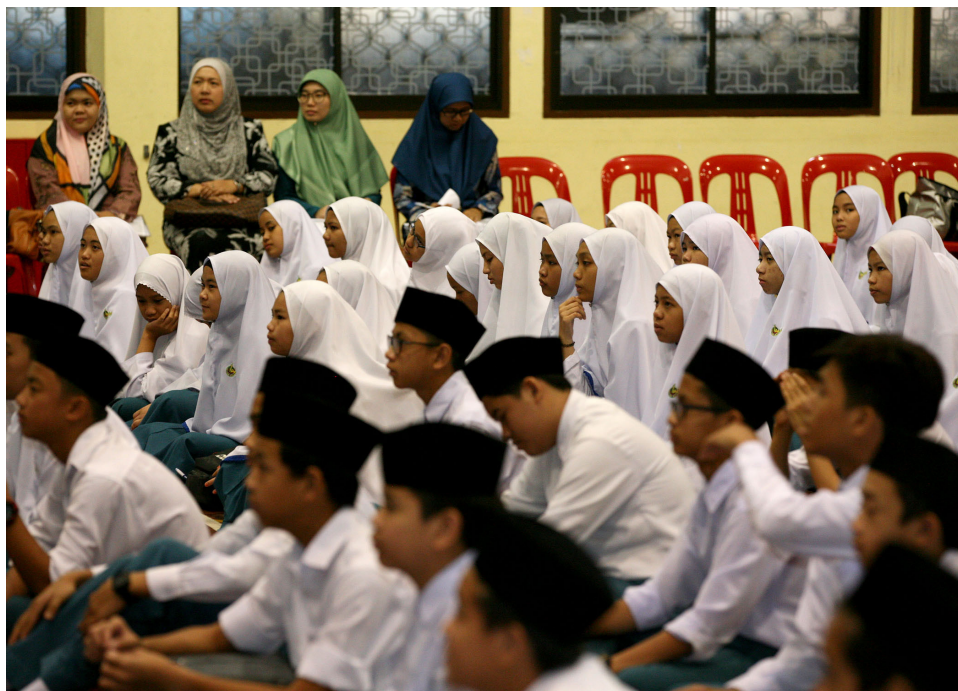
ANTARA pelajar Tahun 7 dan tenaga pengajar Sekolah Menengah Sayyidina Abu Bakar, Lambak Kanan hadir pada taklimat yang dianjurkan oleh Jabatan Penerangan.