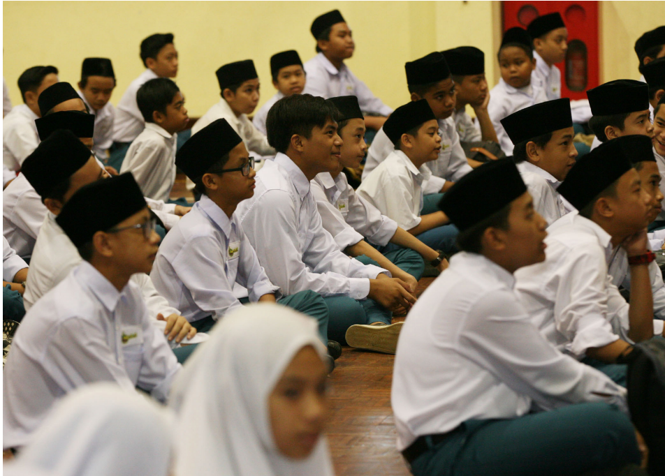
SEBAHAGIAN dari 240 pelajar Tahun 7 semasa mendengar taklimat tersebut.

Selain itu jelasnya, para pelajar juga boleh memahami pentingnya menghormati bendera negara dan dapat menanamkan semangat patriotisme di dalam diri pelajar dengan mengetahui kepentingan bendera serta mengetahui cara-cara atau langkah yang betul untuk mengibarkan bendera.