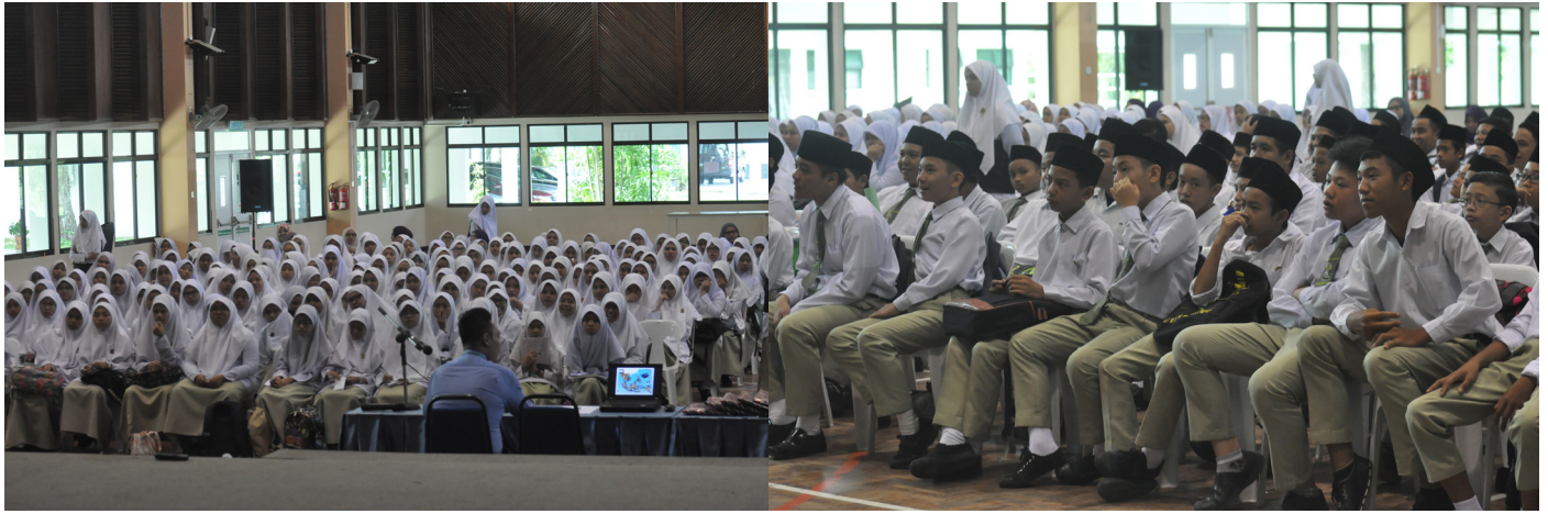
PENUNTUT-PENUNTUT Sekolah Menengah Pengiran Anak Puteri Hajah Rashidah Sa'adatul Bolkihah yang hadir pada Jerayawara Kenali ASEAN bertempat di dewan sekolah berkenaan.