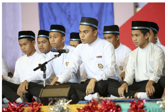
PENUNTUT Sekolah Menengah Katolik semasa membuat persembahan Qusidah dan Doa Taubat.