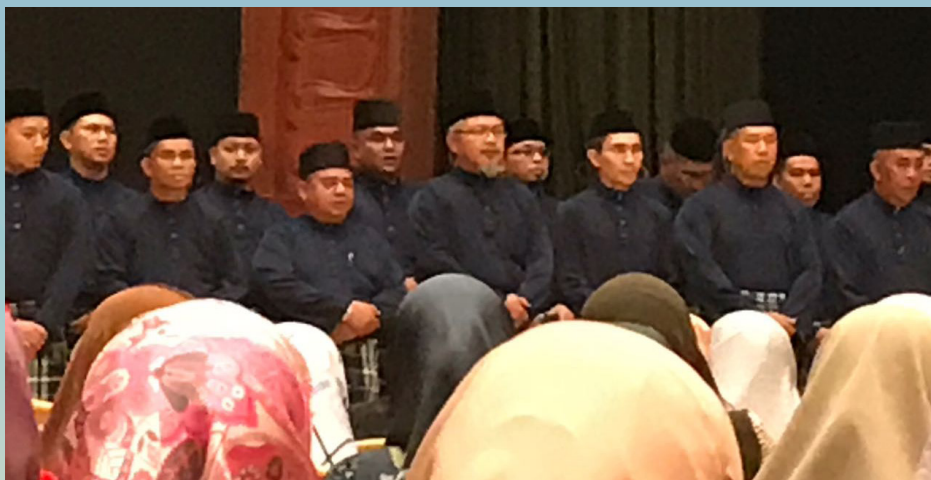
PENGLIBATAN warga Jabatan Penerangan semasa Majlis Sambutan Maulud Nabi Muhammad Sallallahu Alaihi Wasallam bagi tahun 1439 Hijrah/2017 Masihi.