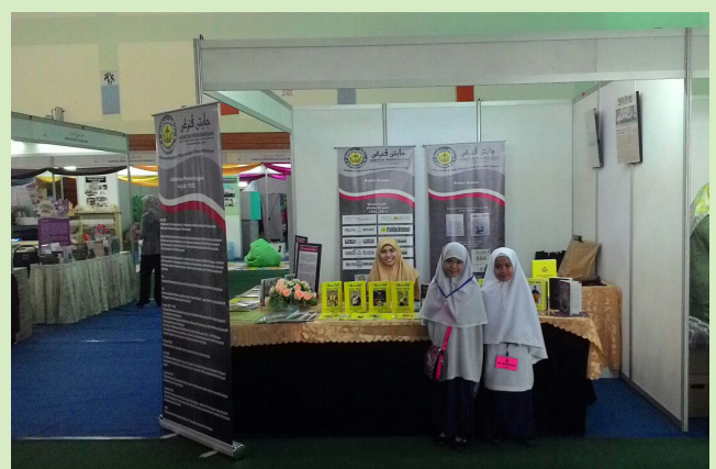
PENYERTAAN warga Jabatan Penerangan dalam Pesta Buku 2017 pada 26 Februari hingga 7 Mac 2017.