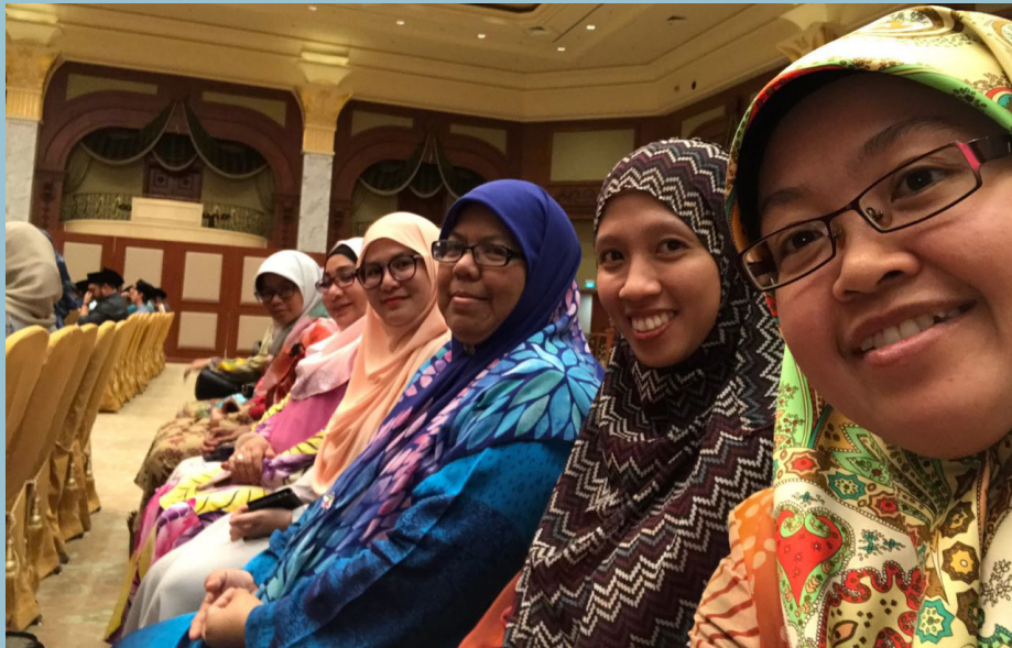
WARGA Jabatan Penerangan turut hadir dalam majlis tersebut.

Dalam ceramahnya juga menyentuh mengenai sunnah Rasulullah Sallallahu Alaihi Wasallam yang perlu diamalkan dalam kehidupan harian kita.