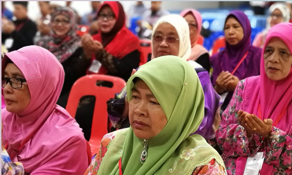
ANTARA peserta program yang hadir.

Semasa program itu, para peserta turut berpeluang membuat lawatan ke Mahkamah Syariah di ibu negara.