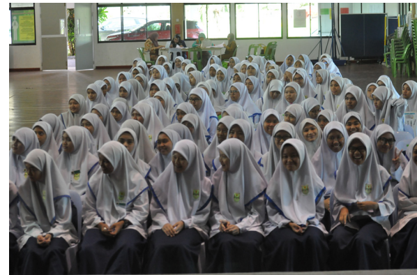
PROGRAM Jerayawara Kenali ASEAN bagi penuntut-penuntut sekolah di Negara Brunei Darussalam.