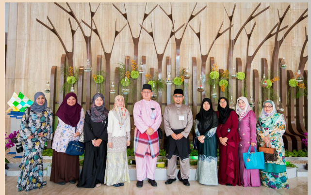
WARGA Jabatan Penerangan yang bertugas semasa Sambutan Hari Raya Aidilfitri di Istana Nurul Iman.