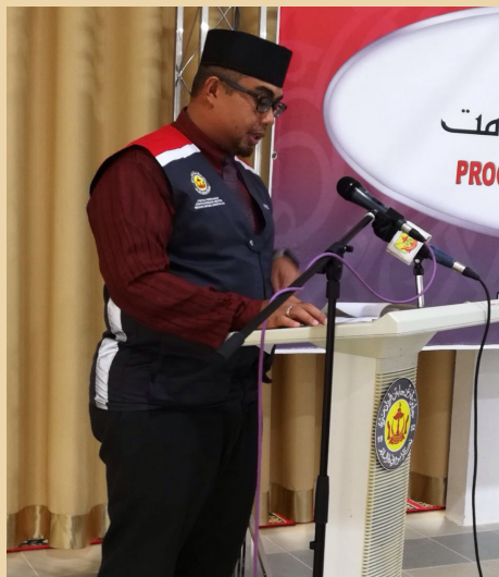
PENGERUSI Majlis, Ketua Cawangan Penerangan Seria semasa menyampaikan ucapan alu-aluan.