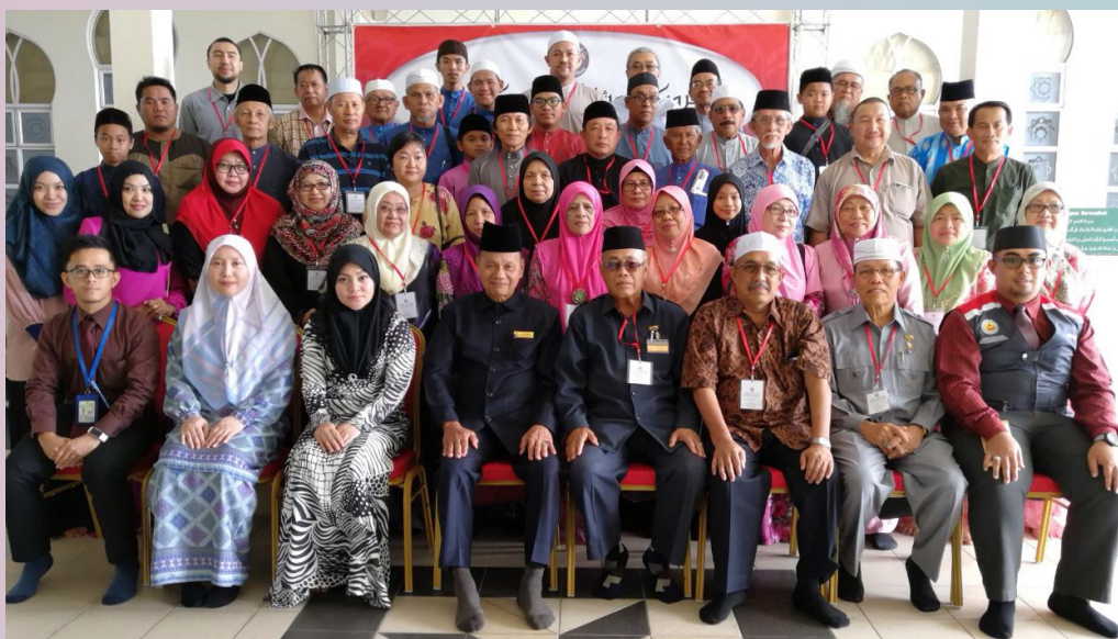
SESI bergambar ramai.