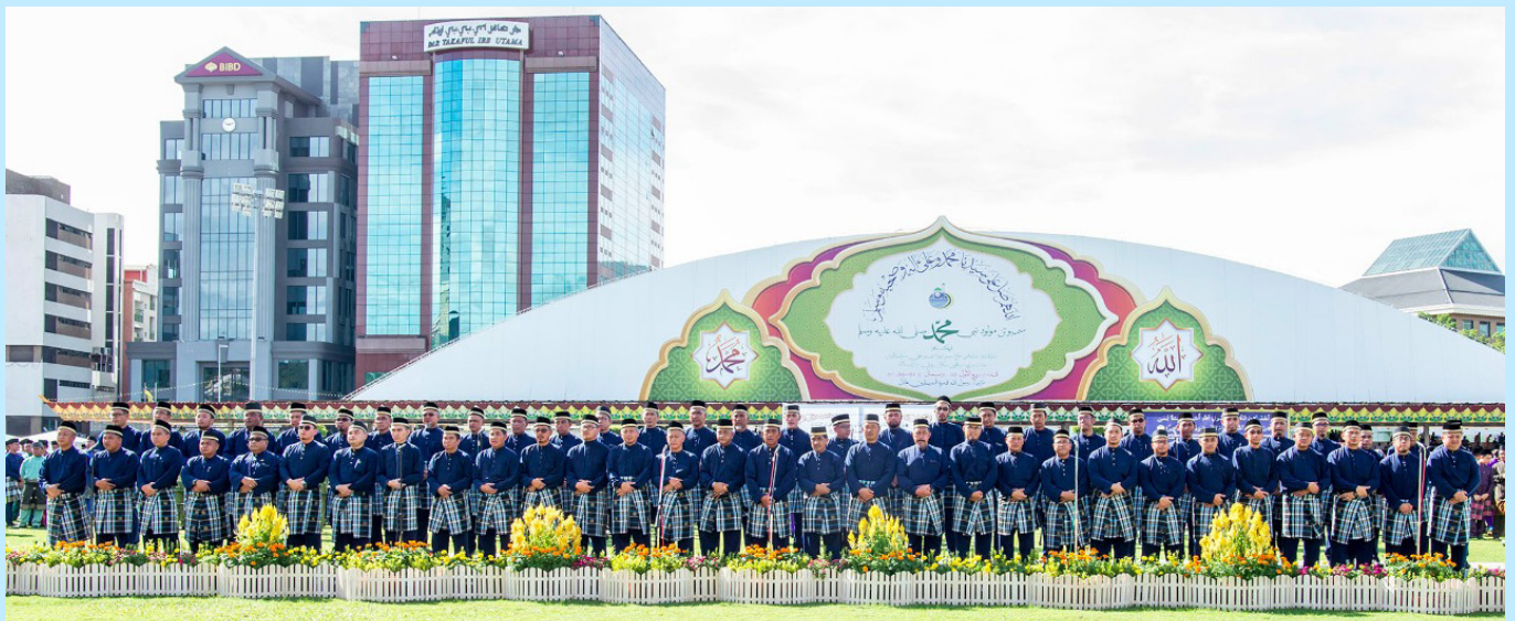
PENGLIBATAN warga Jabatan Penerangan sempena Sambutan Maulud Nabi Muhammad Sallallahu Alaihi Wasallam bagi tahun 1439 Hijrah/2017 Masihi di Taman Haji Sir Muda Omar 'Ali Saifuddien.