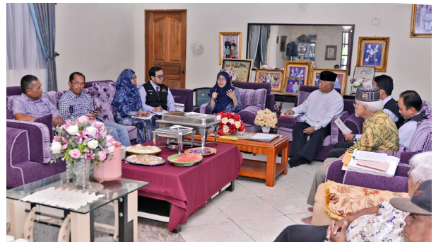
PROGRAM Sua Muka yang diadakan di beberapa buah kampung.