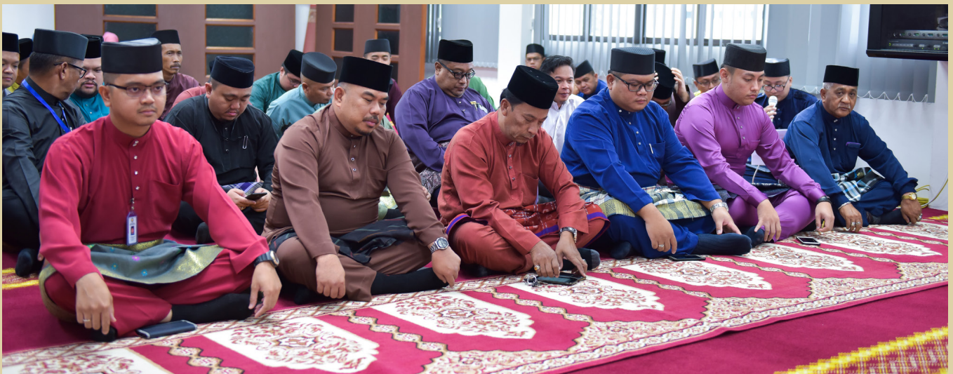
PEGAWAI dan kakitangan Jabatan Penerangan yang hadir dalam Majlis Sambutan Maulidur Rasul yang diadakan di surau jabatan tersebut.