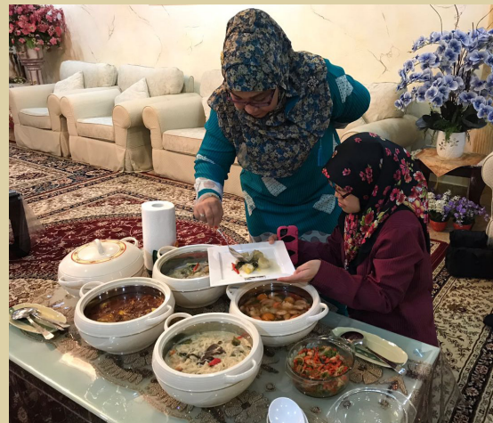
BEBERAPA orang pegawai dan AJK program tersebut berkunjung ke rumah Penghulu Mukim Sengkurong pada 22 Disember 2017 untuk membuat sesi penggambaran dan mencatat resepi hidangan.