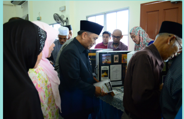
PROGRAM Awasi Anak Kitani yang diadakan di beberapa buah kampung tingkatkan kesedaran ibu bapa mengenai pencegahan dan mengawal anak masing-masing daripada penyalahgunaan dadah dan isu-isu keselamatan dalam negara.