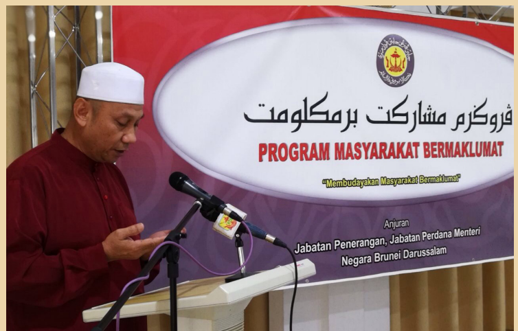
BACAAN Surah Al-Fatihah dan Doa Selamat oleh Imam Masjid Muhammad Jamalul Alam, Kuala Belait.