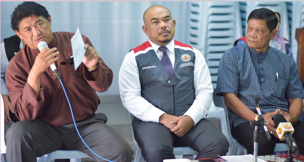
WAKIL pegawai dari Jabatan Radio Televisyen Brunei turut memberikan penerangan.

Dengan adanya program sebegini ia akan dapat memupuk semangat kekitaan dan bertanggungjawab terhadap negara serta menyemai hubungan yang erat di antara kerajaan dengan rakyat.