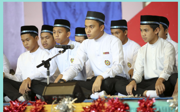
PROGRAM Rakan Remaja Penerangan yang diadakan di beberapa buah sekolah dihasrat untuk mendekati para remaja di sekolah-sekolah supaya mereka peka dengan perkembangan semasa serta menanamkan semangat kenegaraan dan tanggungjawab sosial dalam kalangan remaja.