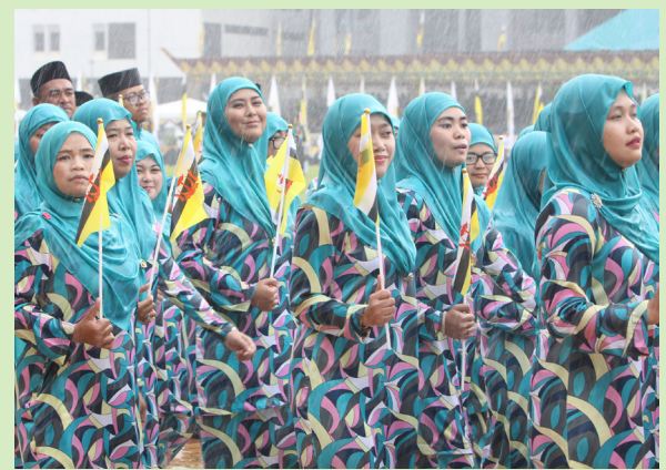
PENGLIBATAN warga Jabatan Penerangan dalam Sambutan Hari Kebangsaan Ke-33.