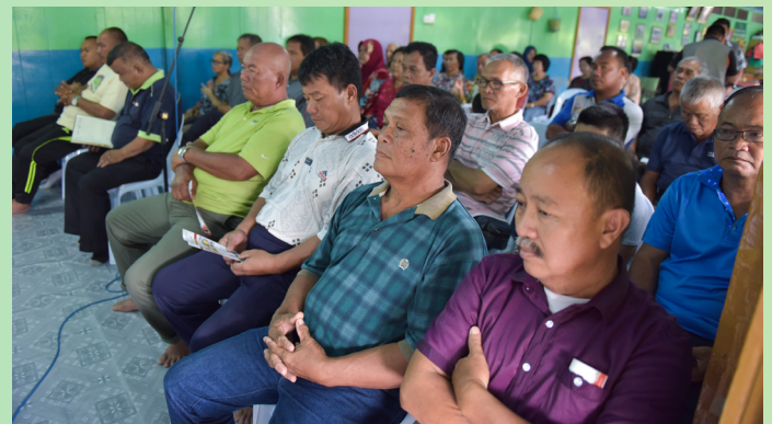
PENDUDUK Kampung Tanjung Bungar, Mukim Batu Apoi, Temburong yang hadir dalam program tersebut.