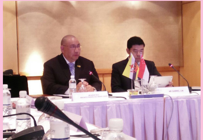
SEMASA Mesyuarat Jawatankuasa Teknikal Bersama Mengenai Kerjasama Dalam Bidang Penyiaran dan Penerangan Kali Ke-27.