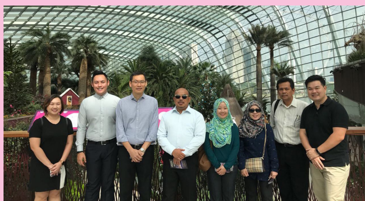
ROMBONGAN semasa mengadakan lawatan ke Gardens by the Bay.