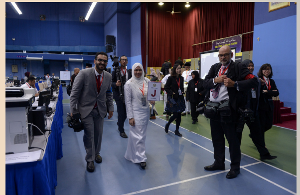
SUASANA di Pusat Media semasa Sambutan Jubli Emas Kebawah Duli Yang Maha Mulia Paduka Seri Baginda Sultan dan Yang Di-Pertuan Negara Brunei Darussalam Menaiki Takhta.