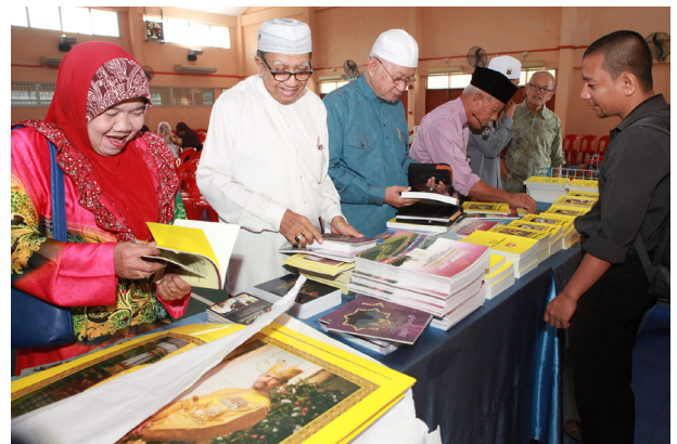
PROGRAM Muzakarah Penerangan menjadi perantaraan dua hala di antara kerajaan dengan rakyat serta penduduk mukim dan kampung di samping dapat meningkatkan komitmen, keprihatinan dan pemedulian pihak Kerajaan Kebawah Duli Yang Maha Mulia Paduka Seri Baginda Sultan dan Yang Di-Pertuan Negara Brunei Darussalam kepada rakyat dan penduduk di negara ini.