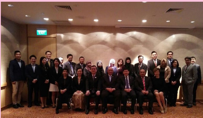
BERGAMBAR ramai semasa menghadiri Mesyuarat Jawatankuasa Teknikal Bersama Mengenai Kerjasama Dalam Bidang Penyiaran dan Penerangan Kali Ke-27.