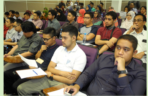
PROGRAM Perkampungan Sivik memberikan peluang kepada para peserta menimba ilmu pengetahuan, pengalaman, berdaya saing dan berdikari untuk menjadi individu yang berjaya.