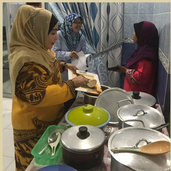
KUNJUNGAN kedua diadakan di rumah Ketua Kampung Bengkurong pada 28 Disember 2017 untuk membuat sesi penggambaran dan mencatat resepi hidangan.