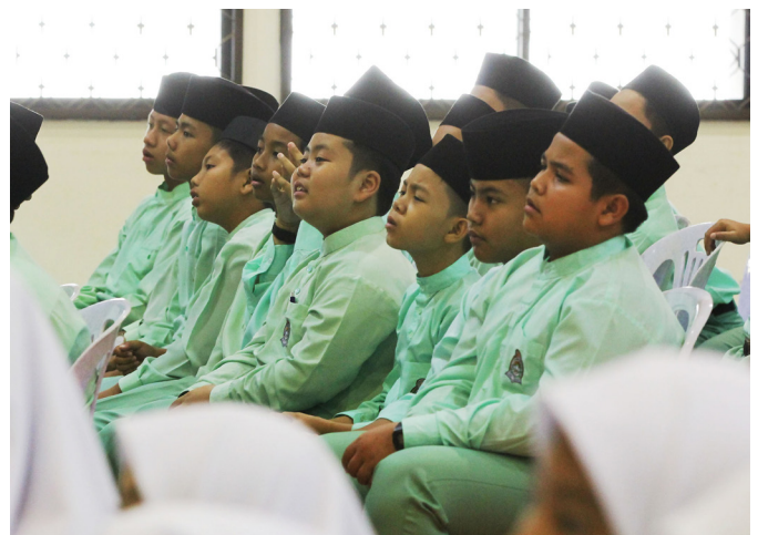
SEBAHAGIAN pelajar Tahun 7 Sekolah Menengah Pehin Datu Seri Maharaja Mentiri semasa menghadiri Program Taklimat Kenegaraan, 'Menghayati Lagu Kebangsaan dan Bendera Negara'.