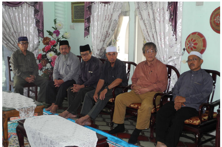
SEBAHAGIAN ahli-ahli MPK Kupang yang hadir pada program berkenaan.