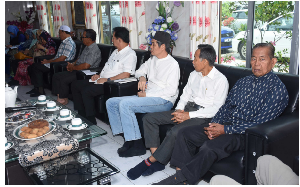
ANTARA Majlis Perundingan Kampung dan penduduk kampung yang hadir dalam program tersebut.