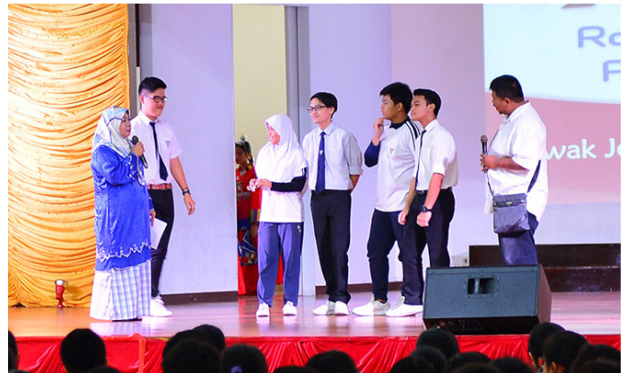
PERSEMBAHAN sketsa daripada pelakon tempatan dan menyampaikan kuiz untuk pelajar Sekolah Menengah Chung Hwa.