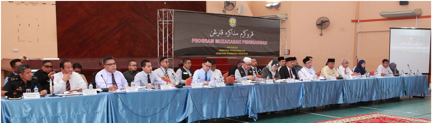
AHLI-AHLI panel Program Muzakarah Penerangan (PMP) yang terdiri daripada wakil dari jabatan-jabatan kerajaan.