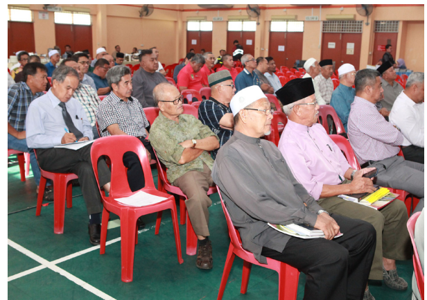
SEBAHAGIAN daripada penduduk kampung di bawah Mukim Kilanas yang hadir pada muzakarah tersebut.