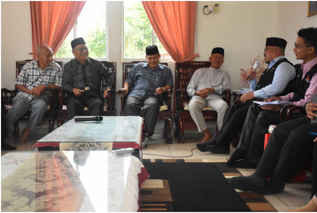
PIHAK Majlis Perundingan Kampung (MPK) Rambai mengongsikan isu-isu yang dihadapi di kampung berkenaan manakala pihak Jabatan Penerangan mengongsikan maklumat-maklumat penting dengan lebih terperinci seperti Wawasan Brunei 2035.