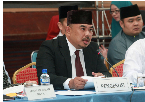
PEMANGKU Pengarah Penerangan, Awang Mawardi bin Haji Mohammad semasa mempengerusikan Program Muzakarah Penerangan (PMP) bersama para penduduk Mukim Kilanas.

PMP diharap akan dapat merapatkan lagi hubungan mesra yang terjalin di antara kerajaan amnya dan Jabatan Penerangan khususnya dengan penduduk mukim. Menerusi program tersebut, ia memberi peluang kepada penduduk mukim untuk mengutarakan isu-isu permasalahan yang dihadapi bagi pertimbangan pihak agensi-agensi kerajaan. Dalam masa yang sama, pihak berkenaan juga dapat memberikan penerangan dan penjelasan kepada penduduk mukim mengenai isu-isu yang dibangkitkan.