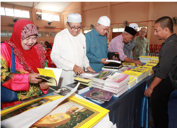
PARA penduduk kampung berminat dengan bahan-bahan terbitan Jabatan Penerangan.