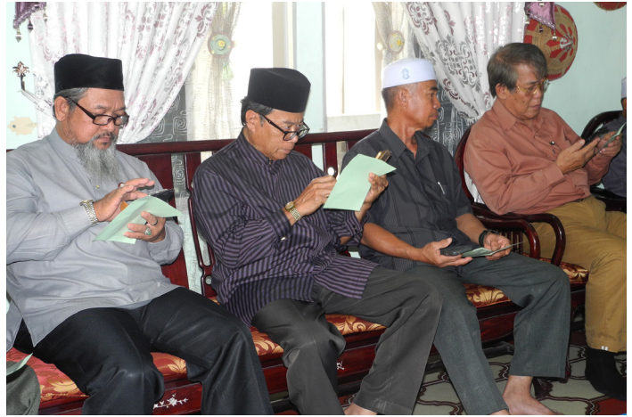
SEBAHAGIAN ahli-ahli MPK Kupang cuba melayari e-Paper Jabatan Penerangan.

Pembarigaan maklumat secara atas talian ( online ), di mana rakyat dan penduduk boleh mengikuti perkembangan semasa melalui akaun Facebook Jabatan Penerangan, iaitu Jabatan Penerangan Jabatan Perdana Menteri, akaun Twitter : @infodept_bn dan akaun Instagram : @infodept.bn yang dikemas kini setiap hari.