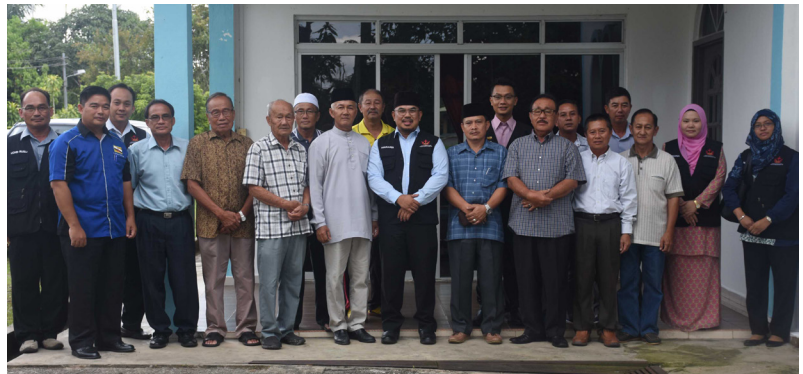
SESI bergambar ramai.