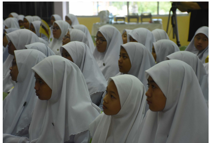
SERAMAI 130 penuntut-penuntut Tahun 7 Sekolah Menengah Sufri Bolkiah hadir mengikuti taklimat tersebut.