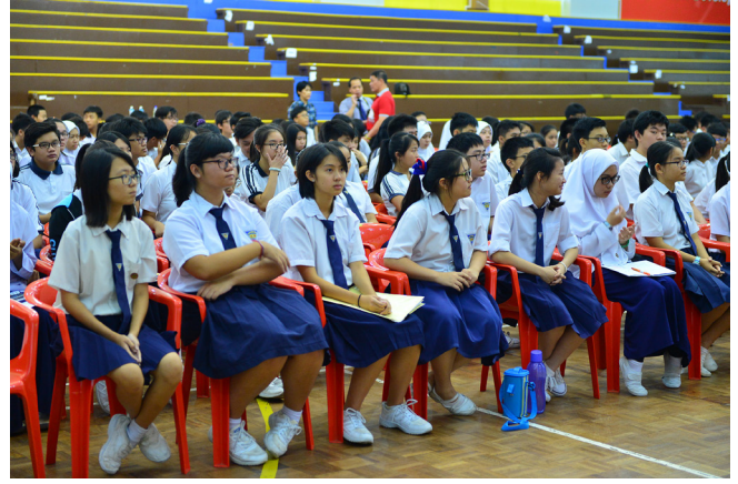
SEBAHAGIAN pelajar Sekolah Menengah Chung Hwa, Bandar Seri Begawan semasa menghadiri Program Rakan Remaja Penerangan.