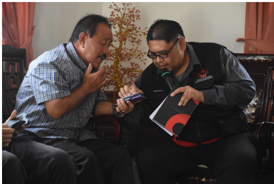
KAKITANGAN daripada Jabatan Penerangan memperkenalkan dan membarigakan versi digital Pelita Brunei iaitu e-Pelita Brunei dan Pelita Brunei Online termasuk tatacara untuk memuat turun e-Pelita Brunei.