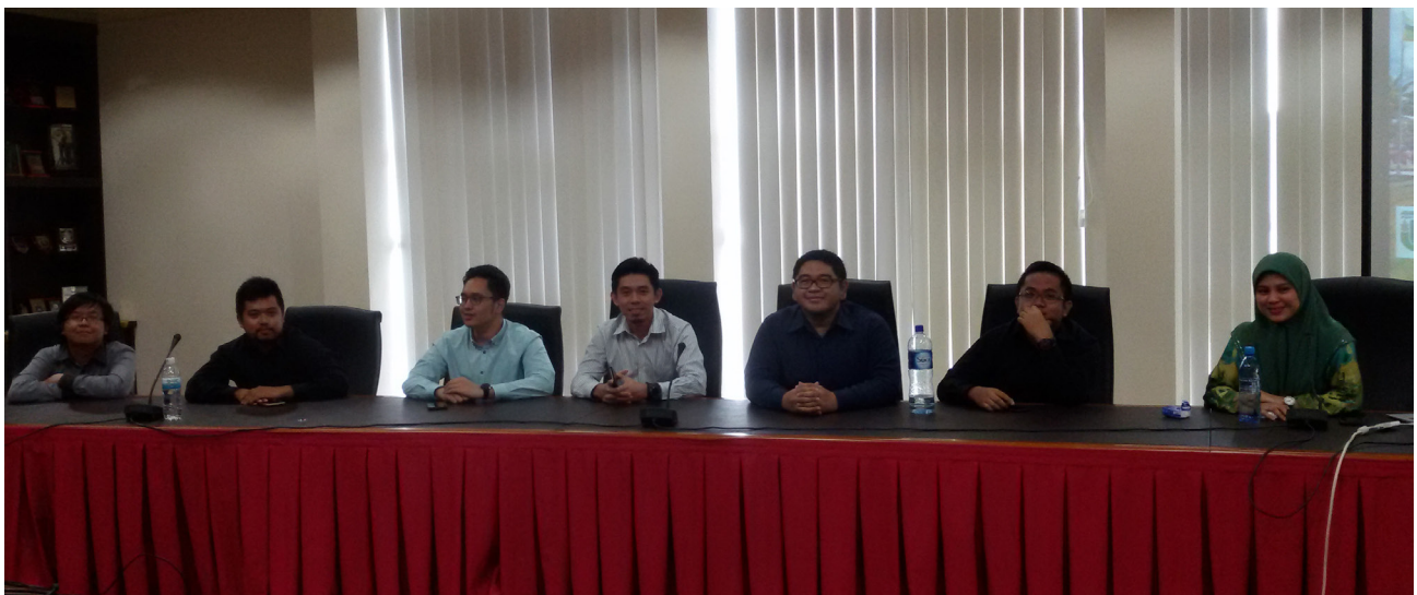
PARA mahasiswa Universiti Brunei Darussalam sebelum membentangkan hasil penempatan kerja mereka.