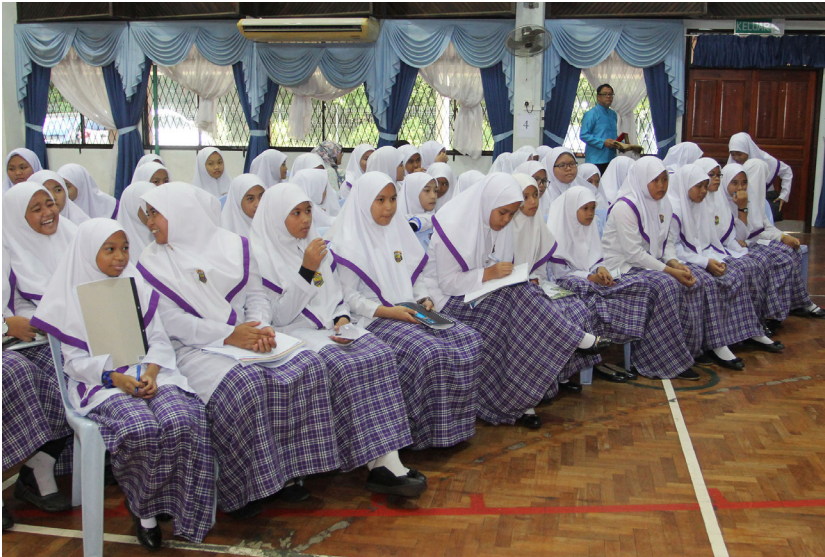
SEBAHAGIAN dari penuntut Tahun 7 hadir mendengar Taklimat Kenegaraan 'Menghayati Bendera Negara dan Lagu Kebangsaan Negara Brunei Darussalam' yang telah diadakan di Dewan Serbaguna, Sekolah Menengah Sayyidina Umar Al-Khattab.