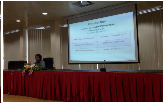
PARA mahasiswa Universiti Brunei Darussalam semasa membentangkan hasil penempatan kerja di Jabatan Penerangan.