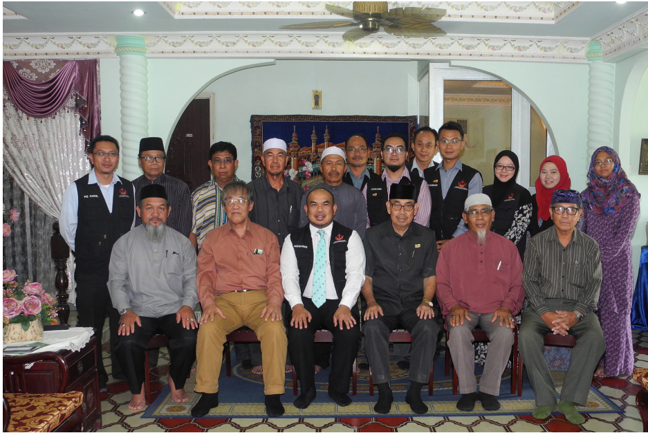
PEMANGKU Pengarah Penerangan (tiga dari kiri, duduk) dan rombongan bersama-sama dengan Ketua Kampung dan ahli MPK dalam sesi bergambar ramai.

Berita dan Foto : Haji Ariffin Mohd. Noor / Morshidi