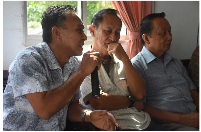
DI ANTARA Ahli-ahli MPK Rambai yang mengongsikan isu-isu yang berkaitan dengan keselamatan, kesejahteraan, kemudahan asas yang disediakan di mukim dan kampung.