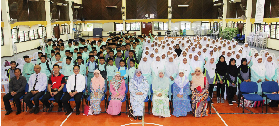
PARA pegawai dan kakitangan Jabatan Penerangan bergambar ramai bersama warga Sekolah Menengah Pehin Datu Seri Maharaja Mentiri.