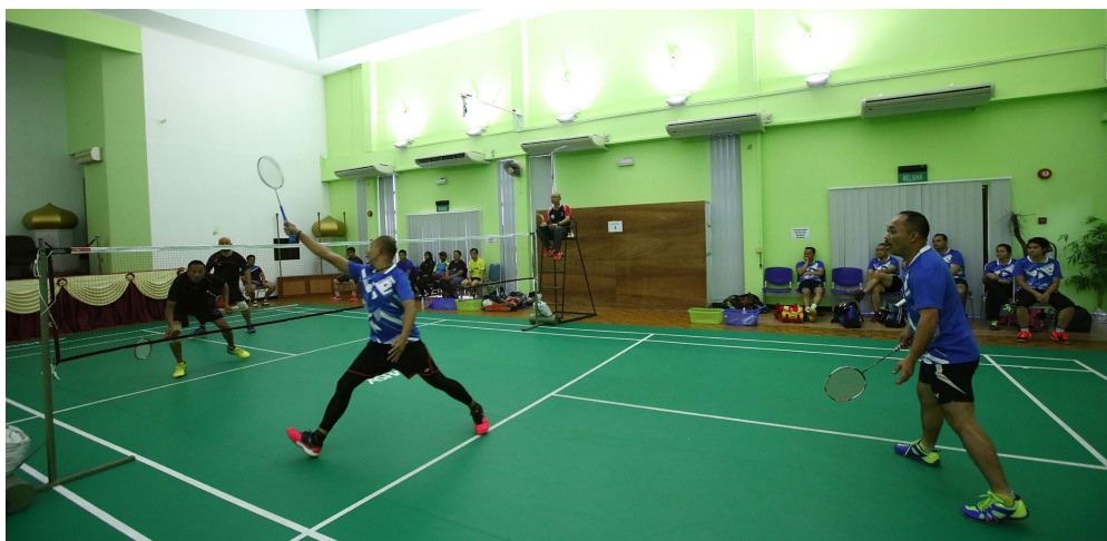
ANTARA aksi pada perlawanan berkenaan.

Perlawanan tersebut dihasratkan dapat mengeratkan lagi hubungan silaturahim di antara jabatan-jabatan di bawah JPM, selain turut mempromosi cara hidup sihat dalam kalangan para pegawai dan kakitangan.