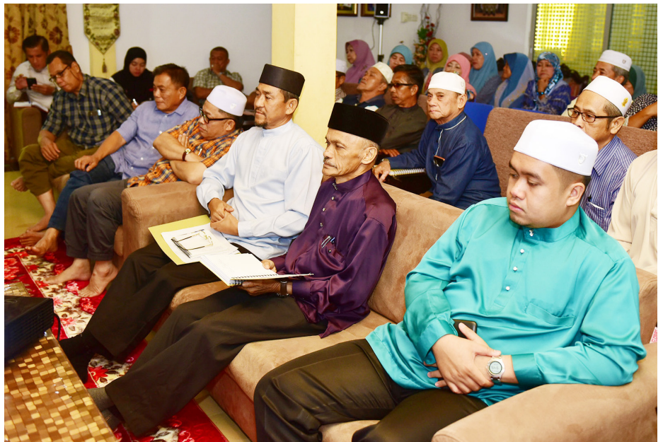
SEBAHAGIAN penduduk Kampung Penapar yang hadir pada program tersebut.

Program juga memperkenalkan dan membarigakan aplikasi mudah alih Jabatan Penerangan, iaitu 'InfoDeptBN' serta tatacara untuk memuat turun aplikasi berkenaan melalui Google Playstore bagi pengguna Android dan App Store bagi pengguna iOS yang mana menerusi aplikasi mudah alih tersebut para pengguna boleh mengakses dan memperoleh beberapa maklumat seperti e-paper Pelita Brunei, Penerbitan, Waktu Sembahyang, Iklan Jawatan Kosong dan banyak lagi.