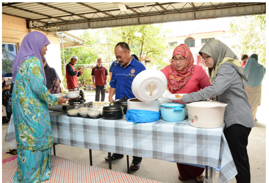
ANTARA kampung-kampung yang menyertai Program SKK.

Setiap kampung hanya dibenarkan menyertai SKK sekali sahaja, di mana resipi-resipi tradisi yang dikongsikan akan dikeluarkan dan dicetak di Pelita Brunei setiap hari Rabu. Bukan itu sahaja, resepi-