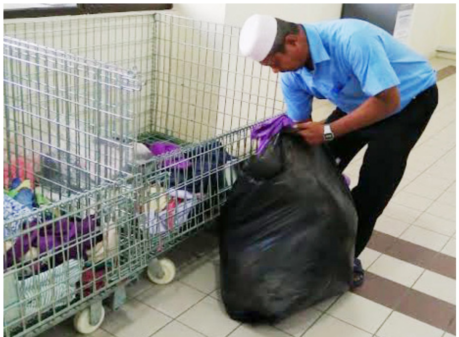
KOTAK Derma Amal Jabatan Penerangan turut mendapat sambutan dari orang ramai.

Strategi bagi mempromosikan kotak derma amal berkenaan