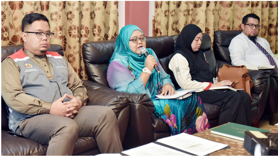
PEMANGKU Timbalan Pengarah Penerangan semasa Program Sua Muka yang diadakan di kediaman Pemangku Ketua Kampung Penapar.