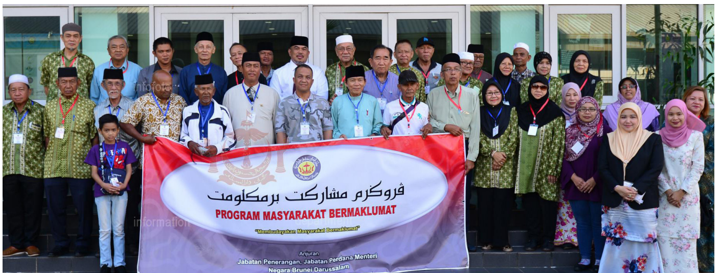
PARA peserta PMB bagi Kampung Mumong 'A', Kampung Mumong 'B' dan Kampung Pandan 'C', Mukim Kuala Belait ketika sesi bergambar ramai.