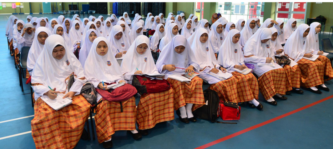
SEBAHAGIAN pelajar semasa mendengarkan Taklimat Kenegaraan dari Jabatan Penerangan.