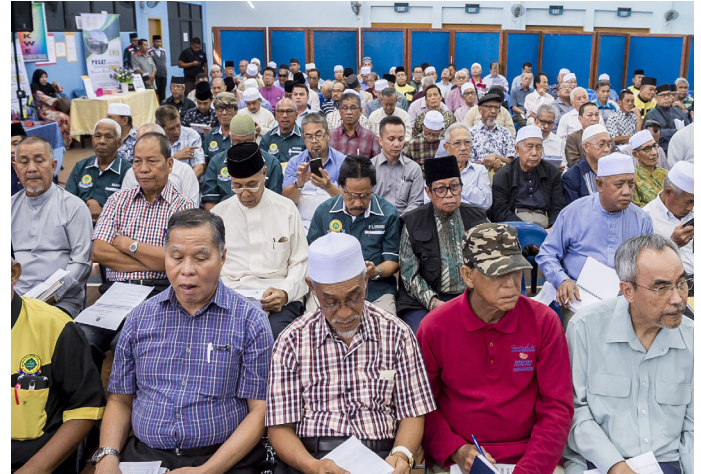
SEBAHAGIAN penduduk di Mukim Berakas 'B' hadir pada program berkenaan.

Di samping itu, ia juga sebagai platform kepada agensi-agensi kerajaan untuk menyampaikan mesej-mesej atau mengemas kini maklumat-maklumat yang hendak disampaikan kepada para penduduk.