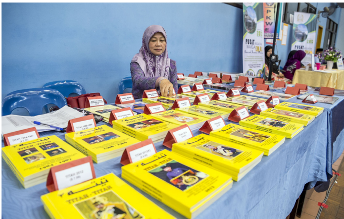
TURUT dipamerkan untuk dijual ialah buku-buku terbitan Jabatan Penerangan.