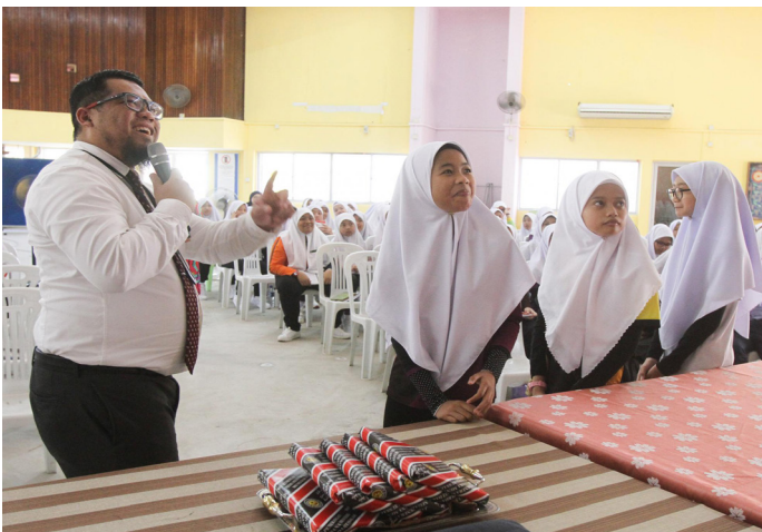
TAKLIMAT Kenegaraan turut dimeriahkan dengan Kuiz Kenegaraan.

Taklimat diteruskan kembali pada 13 Januari ke Sekolah Menengah Pengiran Isteri Hajjah Mariam, Serasa dan diikuti kemudian pada 14 Januari ke Sekolah Menengah Yayasan Sultan Haji Hassanal Bolkiah (SM YSHHB), Jalan Kebangsaan serta ke