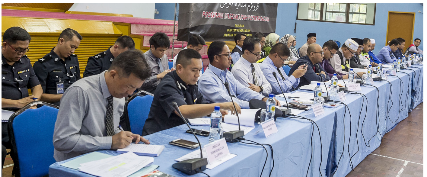
TURUT hadir pada program tersebut pegawai-pegawai dari berbagai agensi kerajaan.