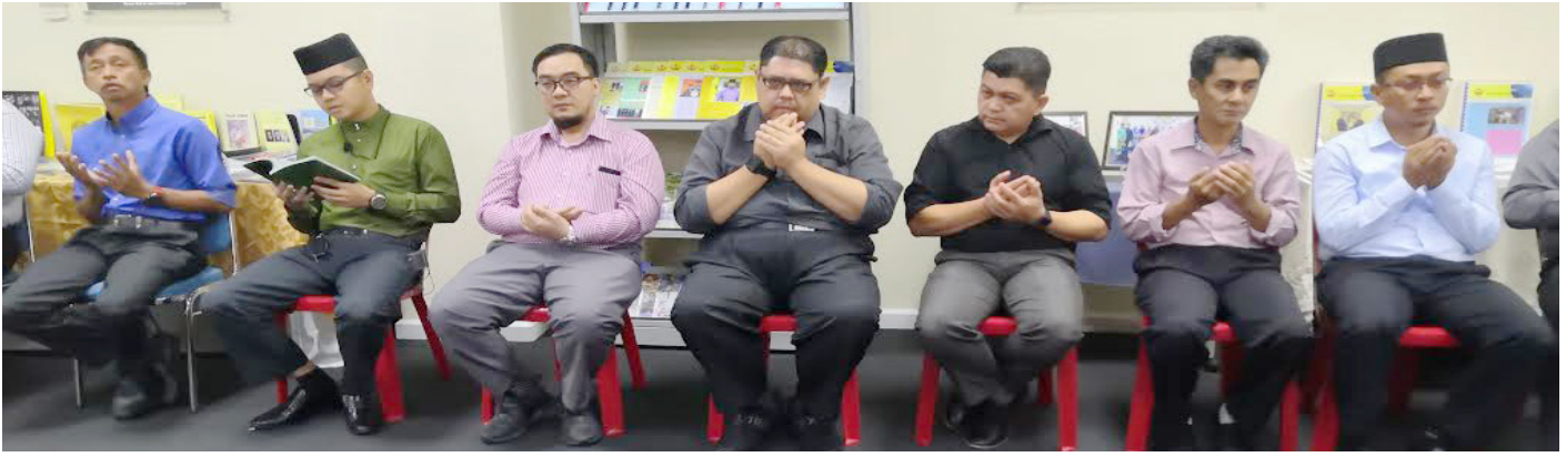
PEGAWAI dan kakitangan Jabatan Penerangan semasa hadir pada majlis Tahlil dan Doa Arwah.

Majlis Tahlil dan Doa Arwah ini juga akan diteruskan dengan membaca ayat-ayat pilihan suci Al-quran pada minggu pertama setiap bulan.