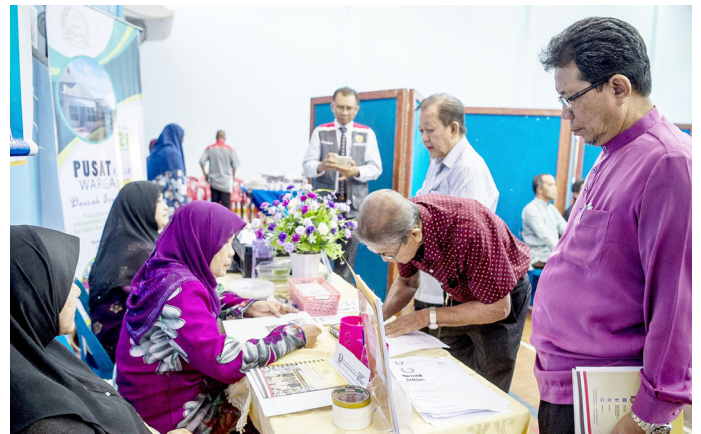
PARA penduduk mendaftarkan nama sebelum program bermula.