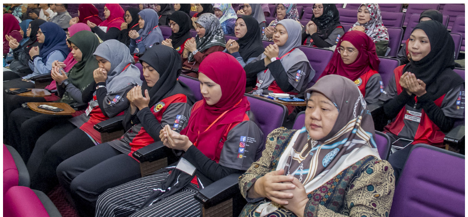
SEBAHAGIAN peserta semasa mengikuti program tersebut.

yang disediakan tersebut akan menjadikan mereka warga yang dinamik, berkualiti tinggi, inovatif dan mapan di samping membuka ruang yang luas kepada para peserta dalam mencari pekerjaan yang bersesuaian mengikut kelulusan masing-masing di samping menyumbang sebagai pertambahan nilai (value added) kepada mereka.