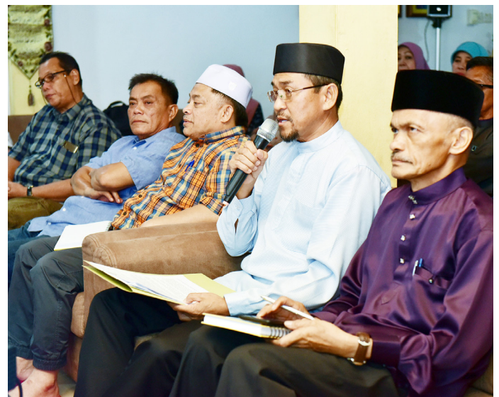
ANTARA penduduk kampung semasa mengajukan pendapat pada program berkenaan.