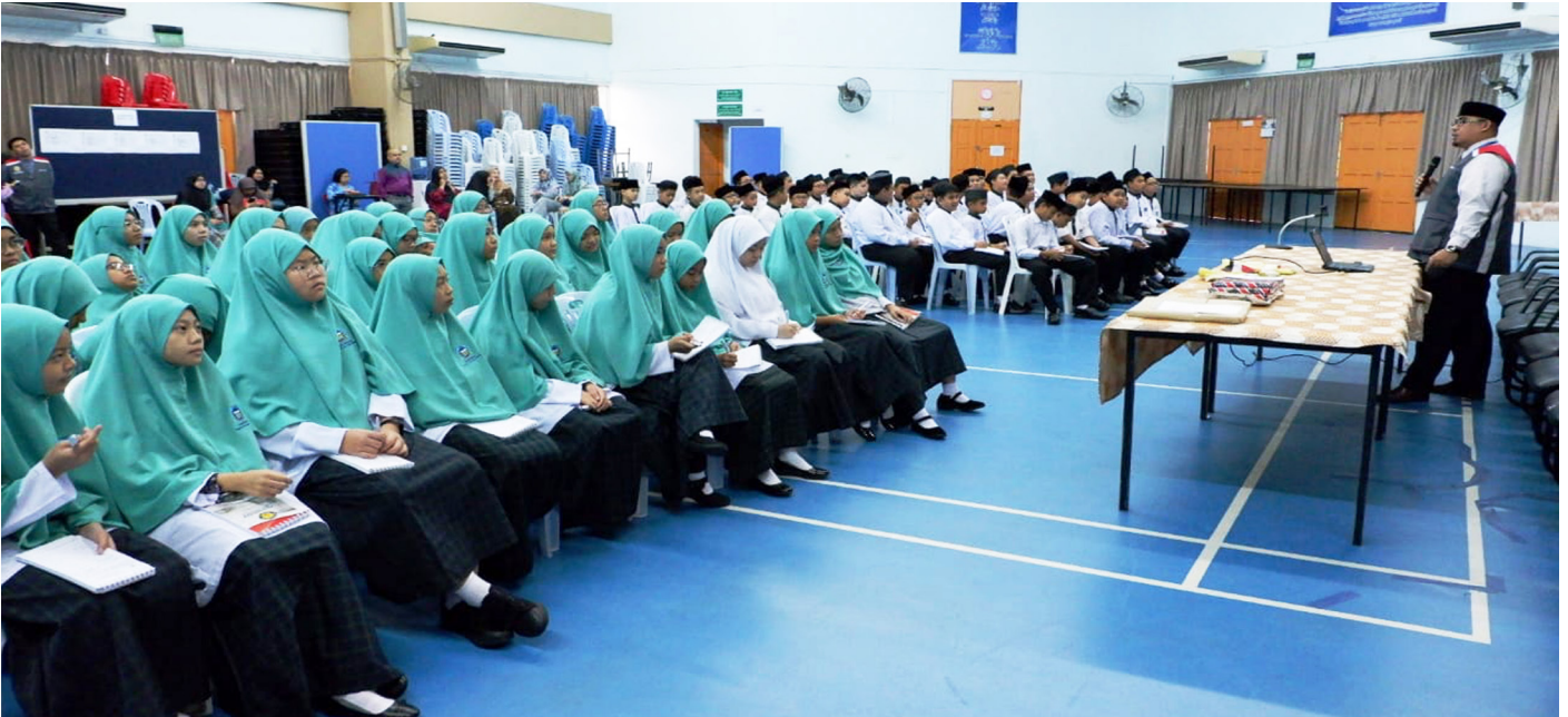
SERAMAI 96 pelajar dari Tahun 7 Sekolah Menengah Pengiran Isteri Hajjah Mariam, Serasa menghadiri Taklimat Kenegaraan Raja Kita, Menghayati Bendera dan Lagu Kebangsaan Negara Brunei Darussalam.

diikuti pada 7 Januari di Sekolah Menengah Rimba I dan sehari selepas itu di Sekolah Menengah Pengiran Anak Puteri (SM PAP) Hajjah Masna, Sungai Akar dan disusuli ke Maktab Sultan Omar 'Ali Saifuddin pada 9 Januari.