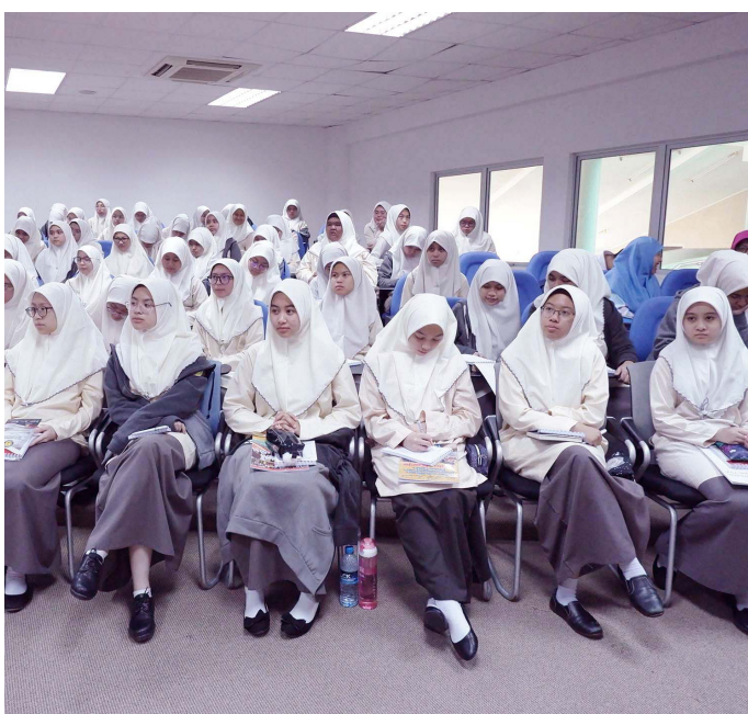
SEBAHAGIAN pelajar Sekolah Menengah Yayasan Sultan Haji Hassanal Bolkiah hadir pada program tersebut.