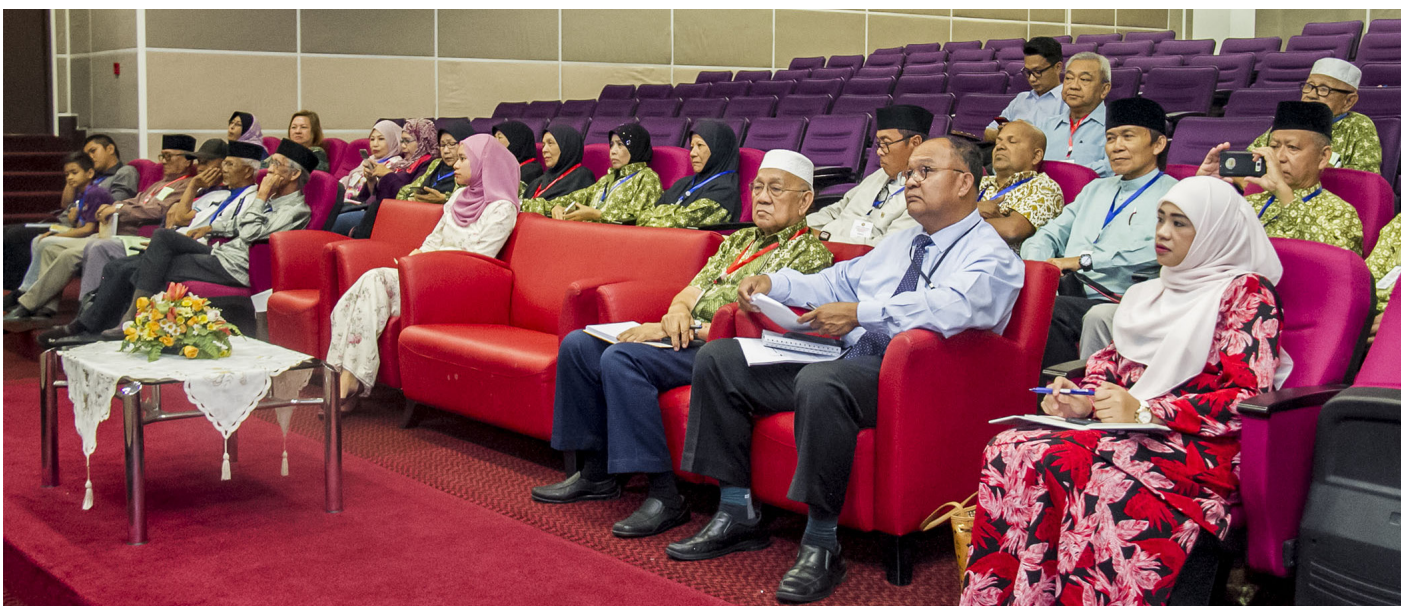
PARA peserta Program Masyarakat Bermaklumat bagi Kampung Mumong 'A', Kampung Mumong 'B' dan Kampung Pandan 'C', Mukim Kuala Belait semasa mendengarkan taklimat yang diadakan di Dewan Auditorium, Bangunan Tambahan, Ibu Pejabat Jabatan Penerangan.

Turut dikongsikan ialah mengenai satu sistem baharu iaitu Sistem Kebajikan Negara (SKN) yang mana ia akan mula beroperasi pada bulan Februari 2020. Ia merupakan sebuah sistem integrasi dari empat agensi iaitu Kementerian Pendidikan, Yayasan Sultan Haji Hassanal Bolkiah, MUIB dan JAPEM.