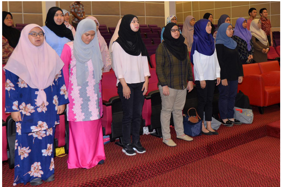
PARA peserta Program Perkampungan Sivik semasa menyanyikan lagu kebangsaan Negara Brunei Darussalam dalam salah satu acara yang pernah diadakan.

Sejajar dengan perkembangan semasa di mana peluang pekerjaan