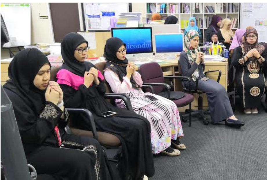
MAJLIS Tahlil dan Doa Arwah yang diadakan setiap Khamis di Jabatan Penerangan.