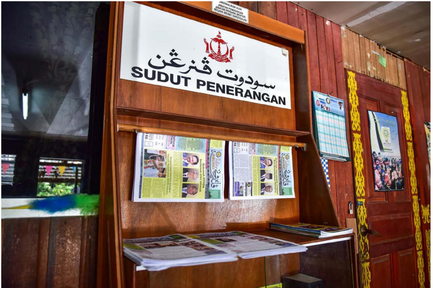
SALAH sebuah Sudut Penerangan yang terdapat di rumah panjang Ulu Belait bagi kemudahan penduduk kampung mendapatkan maklumat semasa.

Teks: Unit Penerbitan Melayu