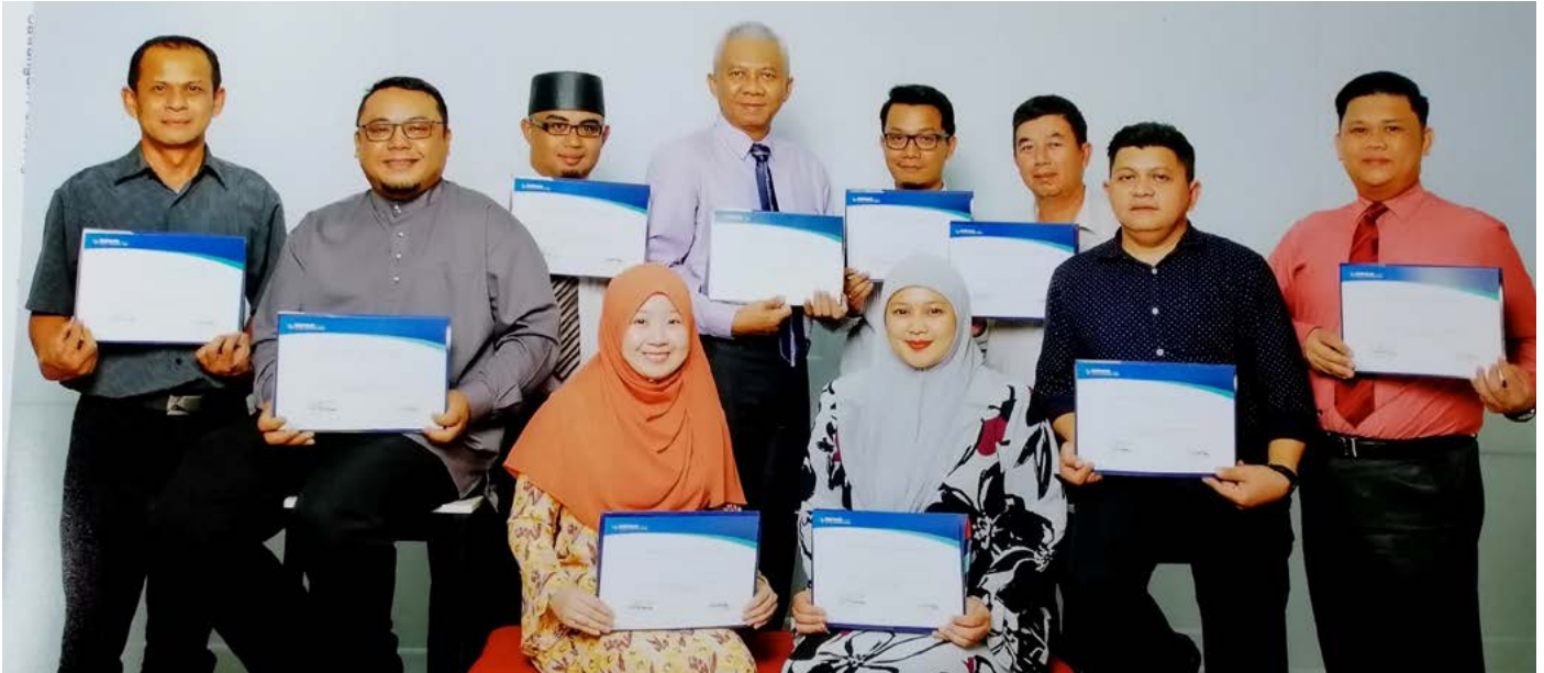
GAMBAR ramai para peserta Kumpulan 3 yang mengikuti bengkel bermula 31 Ogos dan 1 hingga 2 September 2020.

Para peserta bengkel dibahagikan kepada enam kumpulan di mana setiap kumpulan dihadiri oleh seramai 10 peserta yang melibatkan pegawai dan kakitangan Bahagian II ke bawah.