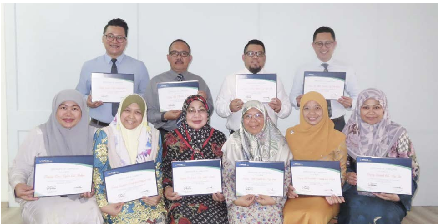
PESERTA Kumpulan 2 mengabadikan gambar kenangan bersama sijil masing-masing setelah mengikuti bengkel tersebut bermula 24 hingga 26 Ogos 2020.

Sebagai usaha untuk meningkatkan kefahaman dan pengetahuan mengenai fungsi serta manfaat dalam penggunaan Microsoft Excel, seramai 78 pegawai dan kakitangan jabatan ini menghadiri Bengkel Microsoft Excel secara berkumpulan sejak 4 Mac 2020.