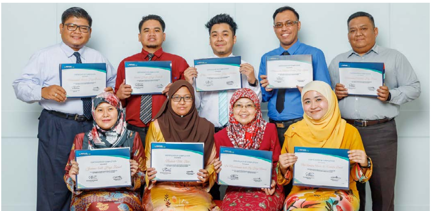
PARA peserta Kumpulan 4 bergambar kenangan setelah mengikuti bengkel berkenaan bermula 24 hingga 26 Ogos, 28 hingga 30 September dan 1 Oktober 2020.

Hingga ke penghujung tahun ini, beberapa buah kursus disusun akan diikuti oleh pegawai dan kakitangan jabatan ini iaitu antaranya Kursus Penyampaian