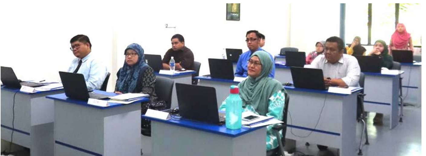
PARA peserta mendengarkan penerangan daripada pengendali Bengkel Microsoft Excel.