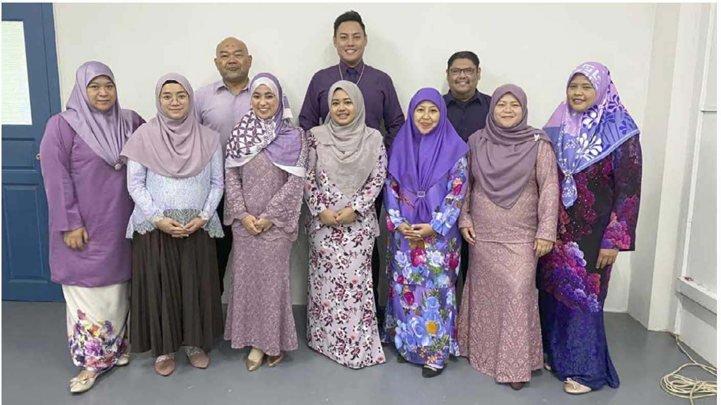
KUMPULAN 5 yang menghadiri Bengkel Microsoft Excel bermula 7 hingga 9 September 2020.

Penggunaannya banyak membantu mempermudah tugas-tugas seharian antaranya bagi kegunaan menyunting, menganalisis, meringkas dan membuat data, grafik, catatan, laporan kewangan, jadual, dan sebagainya.