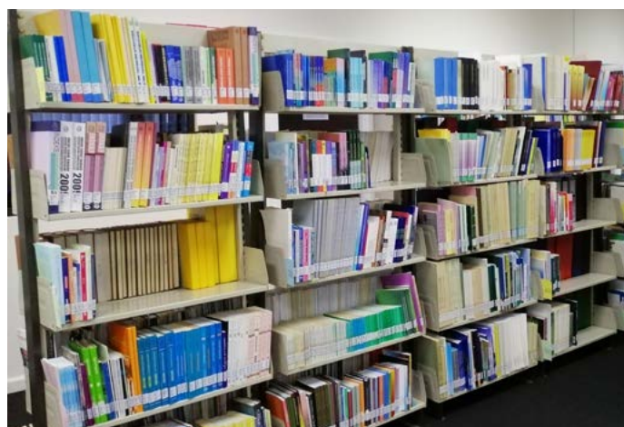
BAHAN-BAHAN perpustakaan hingga ke hari ini masih relevan untuk diguna pakai.

Pustakawan merupakan kerjaya yang memberikan peluang kepada individu untuk berinteraksi dengan pelbagai peringkat umur masyarakat pengguna perpustakaan.