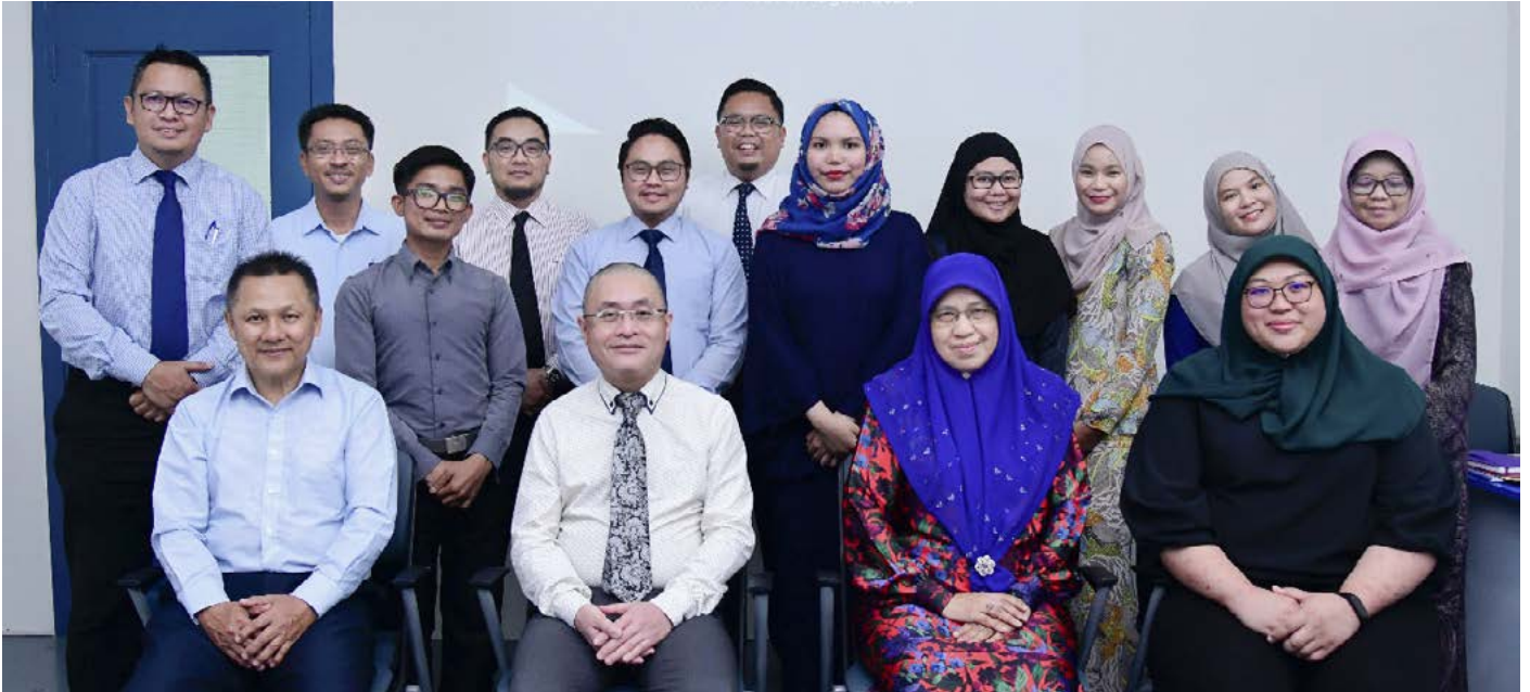
PARA pegawai dan kakitangan yang mengikuti Bengkel Microsoft Excel bagi Kumpulan 1 bermula 17 hingga 19 Ogos 2020.

Teks: Unit Penerbitan Melayu