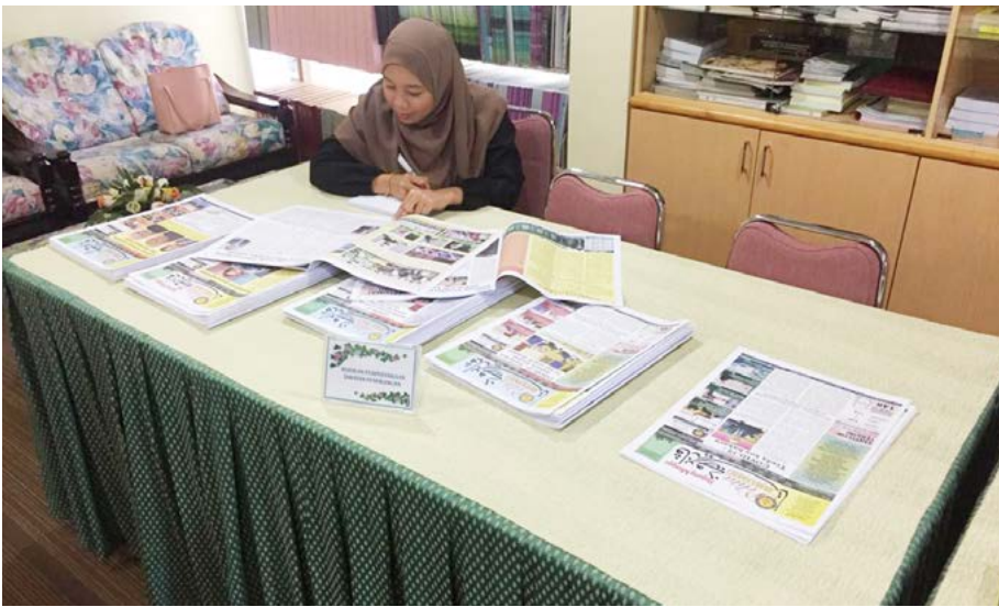
BILIK Rujukan Jabatan Penerangan Cawangan Tutong menempatkan buku-buku terbitan Jabatan Penerangan. Bagaimanapun semasa wabak COVID-19 ketika ini, bilik ini ditutup sementara sehingga ke satu tarikh yang akan dimaklumkan kemudian (atas dan bawah).

Oleh: Unit Penerbitan Melayu