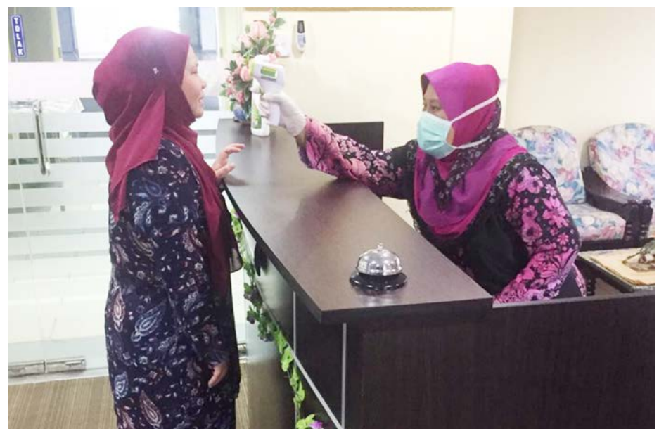
SARANAN Kementerian Kesihatan sentiasa dipatuhi dengan mempraktikkan pemeriksaan suhu badan di samping menggunakan hand sanitizer di pintu masuk utama cawangan pejabat di daerah ini.