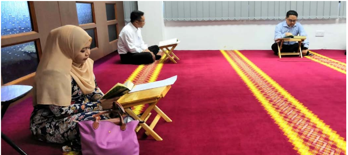
WARGA Jabatan Penerangan mengadakan bertadurus Al-Quran di surau jabatan dengan mematuhi arahan penjarakan sosial (atas dan bawah).

Berita: Unit Penerbitan Melayu