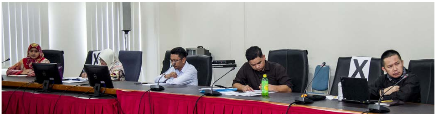
MESYUARAT Jawatankuasa Kecil Penerangan, Jawatankuasa Kerja Media dan Publisiti Sidang Kemuncak ASEAN dan Mesyuarat-mesyuarat Berkaitan Tahun 2021 diadakan seperti biasa dengan mengutamakan kebersihan dan penjarakan sosial.