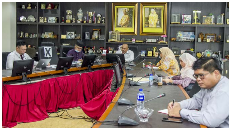
DI Jabatan Penerangan, langkah waspada sentiasa ditekankan dalam kalangan warga jabatan seluruh cawangan dengan mengamalkan kebersihan dan penjarakan sosial termasuk semasa mengadakan pelbagai mesyuarat.

Komplikasinya termasuk radang paru-paru dan sindrom kesukaran pernafasan akut. Pada masa ini tiada vaksin atau rawatan antiviral tertentu untuk merawat virus ini selain usaha mengurangkan simptom dan terapi sokongan. Langkah-langkah pencegahan yang disyorkan termasuk membasuh tangan, menutup mulut apabila batuk, mengekalkan jarak dari orang lain (terutamanya mereka yang tidak sihat) serta pemantauan dan pengasingan diri selama 14 hari untuk orang yang mengesyaki mereka dijangkiti.