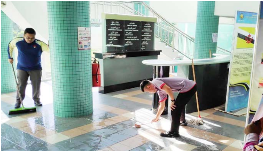
ANTARA langkah yang diambil oleh Cawangan Penerangan Daerah Tutong ialah melaksanakan kempen kebersihan secara intensif dengan membersihkan ruangan pejabat.