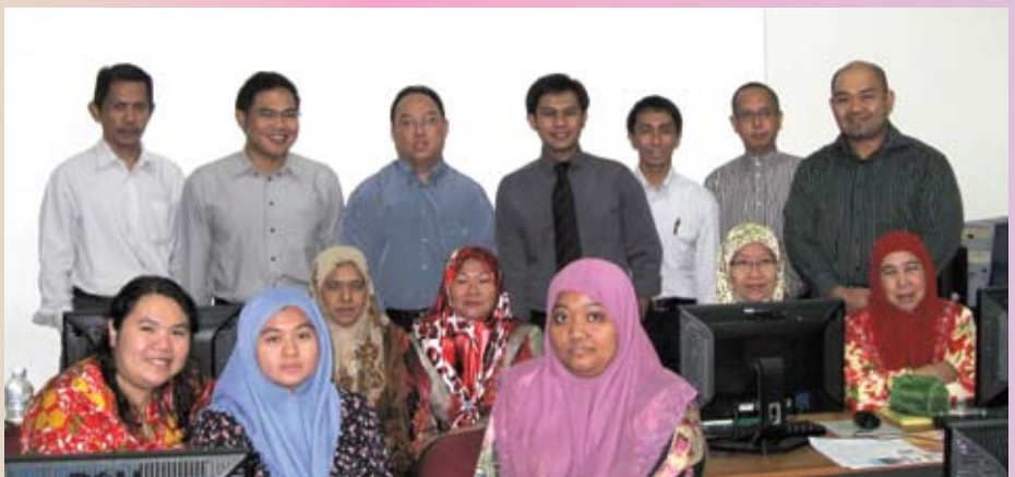
Para peserta yang menyertai Kursus Penerbitan Atas Meja.

Beliau banyak memberikan latihan secara praktikal sepanjang kursus kepada para peserta selain menerangkan definisi sebenar