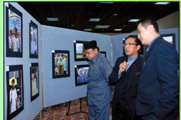
Pengarah Penerangan ketika menyaksikan pameran mengenai penerbitan dan perisian.

Brunei di seluruh negara bagi tahun 2008 dan 2009 dengan menempatkan peti-peti penyimpanan akhbar tersebut di lokasi yang telah ditentukan di keempat daerah iaitu 247 di Daerah Brunei dan Muara, 37 di Daerah Tutong, 33 di Daerah Belait dan sembilan di Daerah Temburong