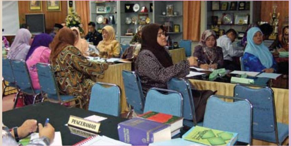
Sebahagian para peserta yang menghadiri bengkel tersebut.

Sepanjang bengkel para peserta telah mendengar ceramah mengenai Penulisan Huruf, Tanda Baca, Penggunaan Kata Pemeri, Kelewahan Bahasa, Terjemahan dan Penggunaan Terasul dan Bahasa Dalam, di samping latihan praktikal mengenai ejaan rumi baru.