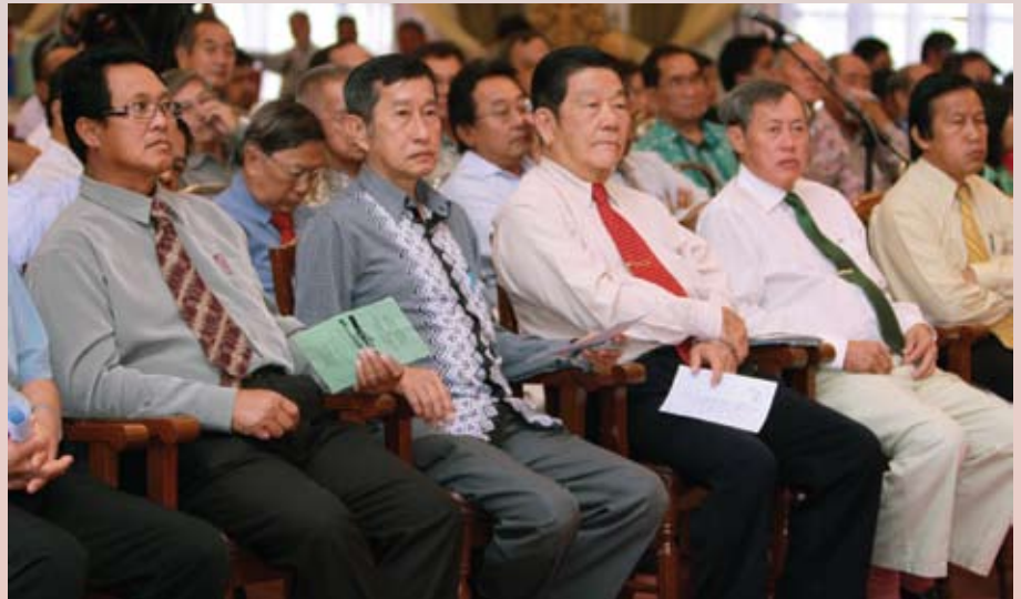
Sebahagian para hadirin dan peserta Taklimat MIB anjuran Jabatan Penerangan.

Taklimat tersebut bertujuan untuk memberi kefahaman mengenai