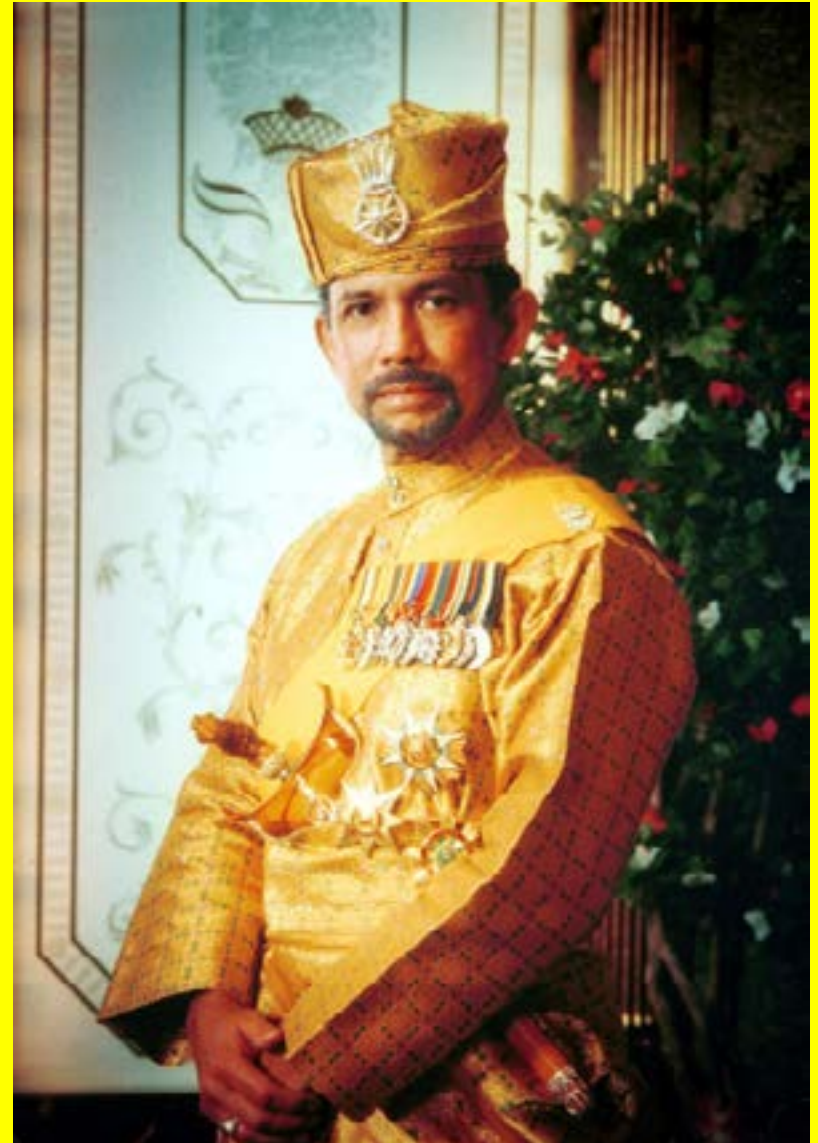
Kebawah Duli Yang Maha Mulia Paduka Seri Baginda Sultan Haji Hassanal Bolkiah Mu'izzaddin Waddaulah ibni Al-Marhum Sultan Haji Omar 'Ali Saifuddien Sa'adul Khairi Waddien Sultan dan Yang Di-Pertuan Negara Brunei Darussalam