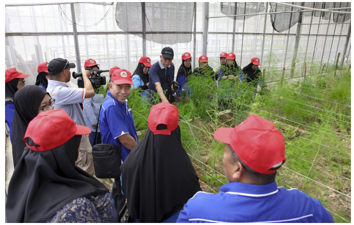
PESERTA Program Masyarakat Bermaklumat semasa melawat ke Perusahaan RZ Prisma Enterprise di Kawasan Kemajuan Pertanian (KKP) Kilanas, Pusat Penyelidikan Pertanian, Brunei pada 5 September.