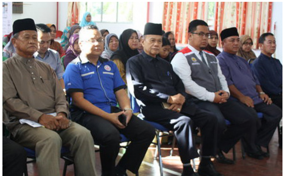
SALAH satu program Awasi Anak Kitani yang pernah diadakan dengan menghususkan kehadiran orangtua atau penjaga kanak-kanak.

Program yang dikendalikan oleh Unit Hubungan Masyarakat, Bahagian Kenegaraan dan Kemasyarakatan, Jabatan Penerangan ini turut mendapat kerjasama dari berbagai agensi seperti Biro Kawalan Narkotik (BKN), Jabatan Keselamatan Dalam Negeri (JKDN), Syarikat IT Protective Security Services (ITPSS) Sendiri Berhad dan sebagainya.