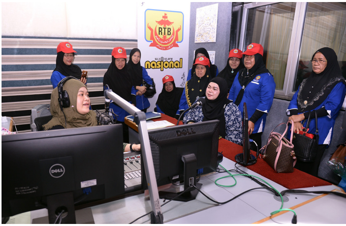
PESERTA Program Masyarakat Bermaklumat semasa mengadakan lawatan ke studio radio rangkaian nasional Radio Televisyen Brunei pada 5 September.