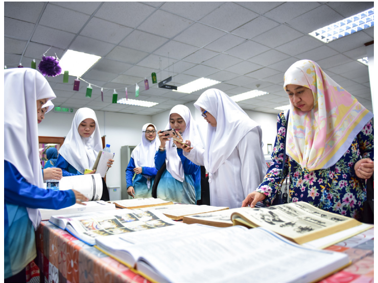
TENAGA pengajar serta pelajar dari Pusat Tingkatan Enam Sengkulong ketika menyaksikan pameran kompilasi Pelita Brunei.

Selain mendengarkan taklimat, rombongan juga menyaksikan tayangan video mengenai proses kerja penerbitan Pelita Brunei yang bermula daripada