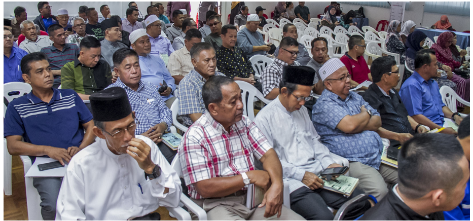
PARA penduduk terdiri daripada ibu bapa dan penjaga semasa hadir pada program tersebut bagi sama-sama mendengarkan maklumat yang diberikan dari berbagai agensi.

Dengan adanya program ini diharap akan dapat meningkatkan lagi pengawasan anak-anak di mukim dan kampung dan bekerjasama dengan agensi-agensinya yang sentiasa bekerja keras