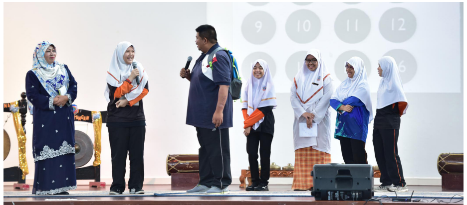
PERSEMBAHAN lawak jenaka merupakan salah satu segmen yang ada pada Program Rakan Remaja Penerangan yang dikendalikan secara terpinpin dengan menyelitkan nilai-nilai positif.

Bagi memenuhi matlamat yang dihasratkan, Jabatan Penerangan selaku pihak penganjur dan penyelaras memerlukan kerjasama pihak sekolah, agensi-agensi kerajaan dan swasta serta artis-artis tempatan bagi menjayakan RRP. Antara acara perisian program ini dimulakan dengan nyanyian Lagu Kebangsaan 'Allah Peliharakan Sultan' dan Lagu Patriotik 'Bendera Negara'. Mesej dan info semasa