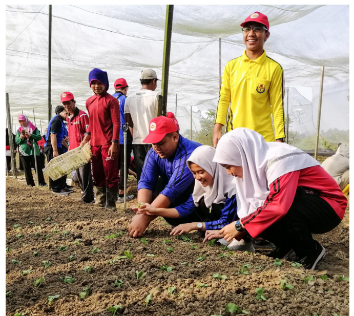
PESERTA Program Masyarakat Bermaklumat (PMB) bagi Kampung Skim Tanah Kurnia Rakyat Jati (STKRJ) Lorong Tiga Selatan, Seria dan Kampung Pekan Seria semasa mengunjungi Wan Chin Agricultural Farm Sdn. Bhd. pada 12 September yang terletak di Kampung Pad Nunok.