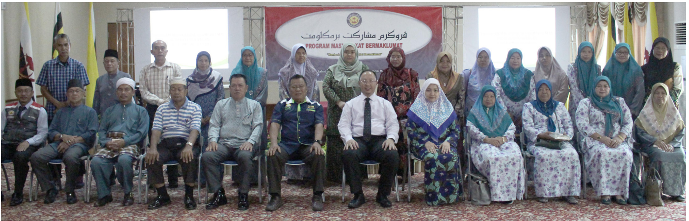
PARA peserta program semasa bergambar ramai bersama rombongan Jabatan Penerangan.

Berita dan Foto: Muhammad Akmal Bin Haji Ali