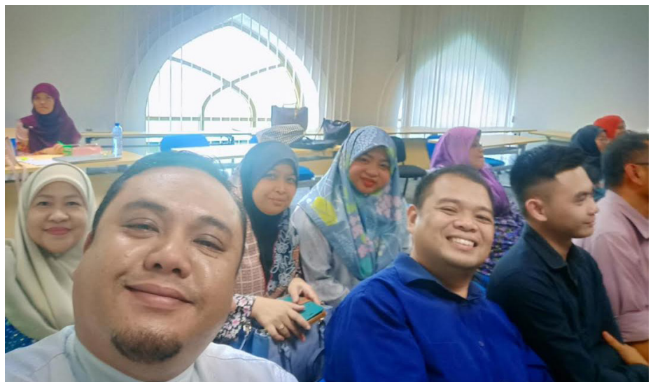
SEBAHAGIAN daripada pegawai dan kakitangan Jabatan Penerangan semasa menghadiri program tersebut.

Program yang merupakan sesi kedua bagi Jabatan Penerangan itu diadakan di Bilik Kuliah, Bangunan Tambahan Kementerian Hal Ehwal Ugama disini.