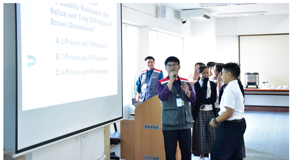
SESI Kuiz Kenegaraan pada Taklimat Raja Kita, Menghayati Bendera Negara dan Lagu Kebangsaan Negara Brunei Darussalam.

Program merupakan salah satu usaha berterusan Jabatan Penerangan dalam menyemai dan meningkatkan ketaatsetiaan terhadap raja, agama, bangsa dan negara, di samping mengukuhkan semangat solidariti, patriotik dan kenegaraan yang tinggi dalam diri penuntut melalui lagu kebangsaan dan bendera negara.