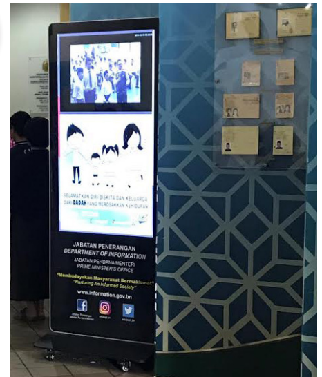
SALAH satu skrin bermaklumat yang di tempatkan di salah sebuah jabatan kerajaan.

Skrin bermaklumat ini diharapkan akan dapat memberikan maklumat terkini kepada orang ramai untuk mereka mengetahui info-info terkini.