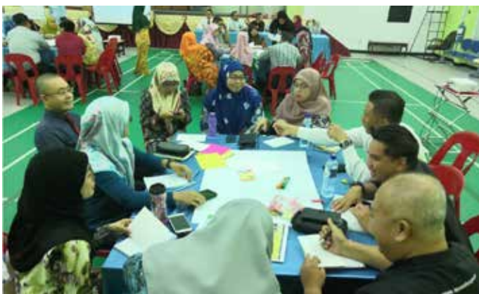
PESERTA bengkel mengadakan sesi perbincangan secara berkumpulan dalam bengkel tersebut.

Tujuan bengkel tersebut diadakan supaya pegawai dan kakitangan Jabatan Penerangan dapat mengenal pasti kekangan ( constraints ) dalam Pelaksanaan Program Penggredan Prestasi di Sektor Awam (3PSA), mewujudkan satu mekanisme penilaian prestasi yang sejajar dengan keperluan jabatan dan komitmen-komitmen jabatan dan sebagainya.