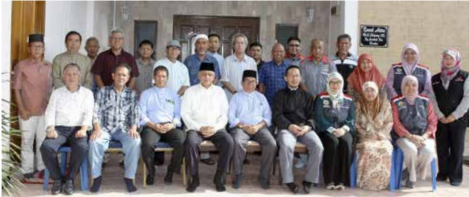
SESI bergambar ramai pada Program Sua Muka atau lebih dikenali Personal Contact yang dikendalikan oleh Jabatan Penerangan, Jabatan Perdana Menteri melalui Unit Hubungan Masyarakat, Bahagian Kenegaraan dan Kemasyarakatan bagi Kampung Lambak 'A'.

Ia juga bertujuan bagi membarigakan maklumat dan program juga perkembangan dan kemajuan mukim melalui akhbar Pelita Brunei.