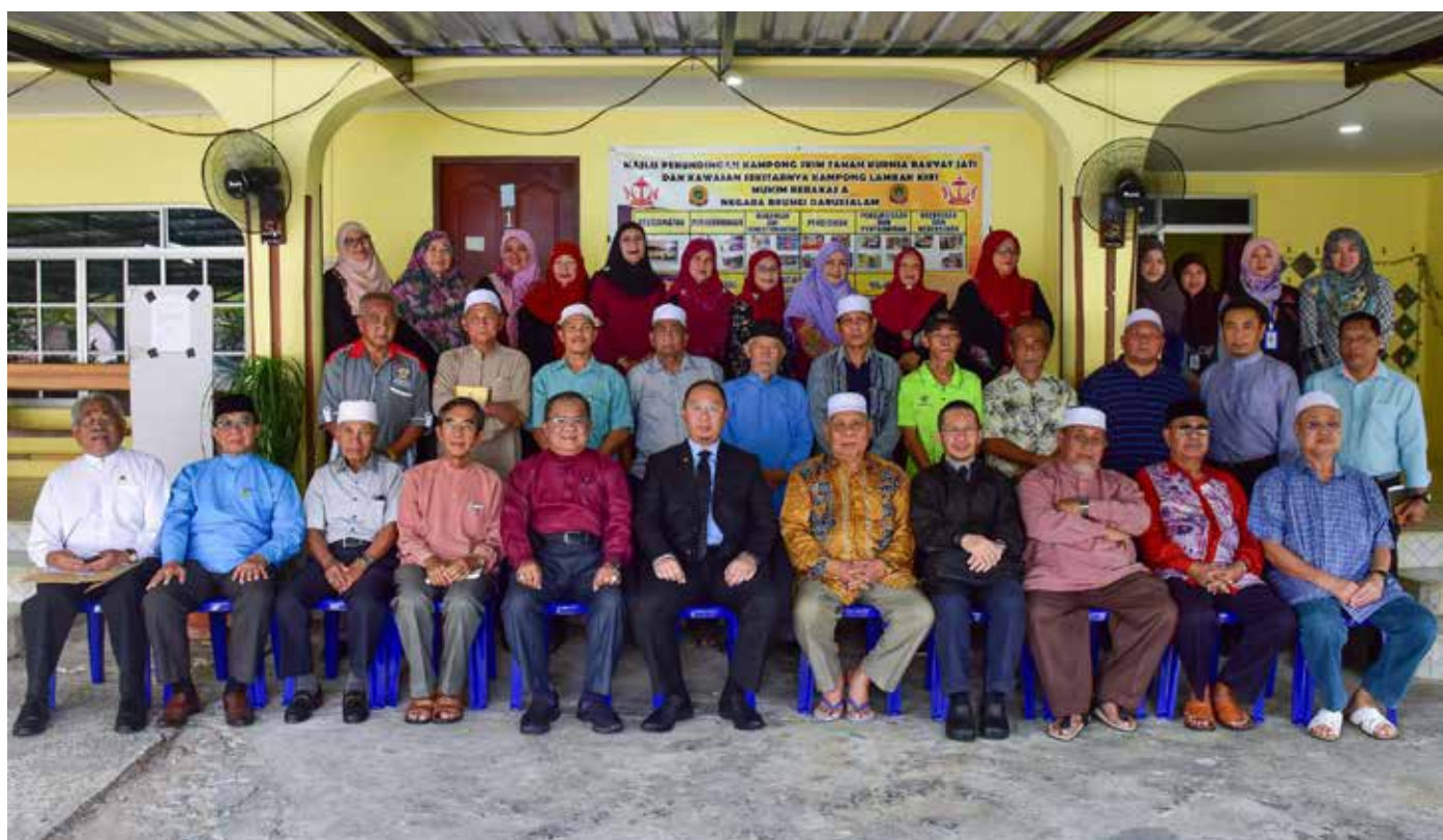
SESI bergambar ramai semasa berlangsungnya Program Sua Muka bagi Kampung Skim Tanah Kurnia Rakyat Jati (STKRJ) Lambak Kiri dan kawasan sekitarnya.

Sua Muka jelasnya, program Jabatan Penerangan dan berkenaan dikelolakan oleh Unit merupakan salah satu program di Hubungan Masyarakat, Bahagian bawah strategi kerja 'komunikasi Kenegaraan dan Kemasyarakatan, bersemuka' yang bersifat personal.