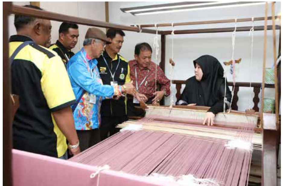
PARA peserta PMB ketika membuat lawatan ke Pusat Latihan Kesenian dan Pertukangan Tangan Brunei.

Pada sebelah petang, para peserta mengadakan lawatan ke Jabatan Adat Istiadat Negara