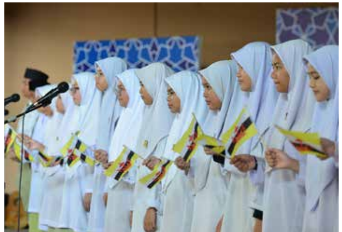
KUMPULAN Koir SM PAPHRSB Lumut menyanyikan lagu kebangsaan dan lagu bendera negara bagi memulakan Program RRP.