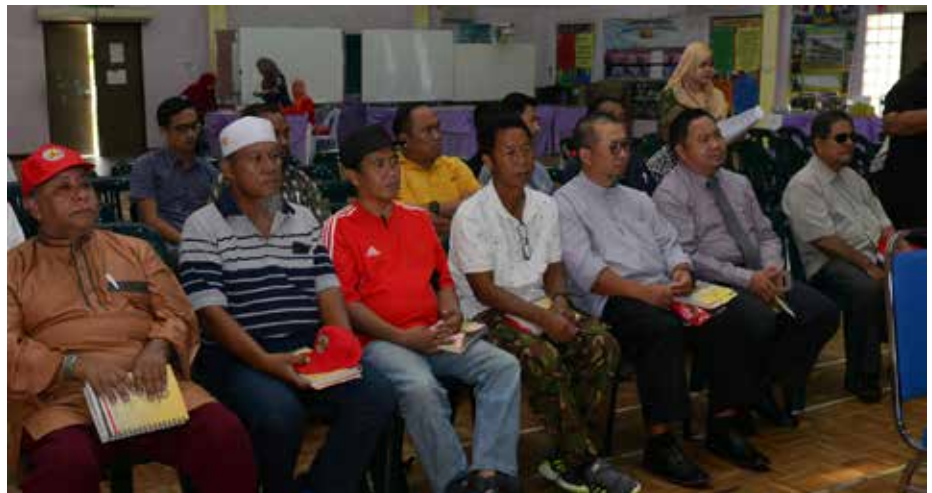
SEBAHAGIAN daripada peserta lelaki yang menyertai Program Masyarakat Bermaklumat bagi Kampung RPN Lumut, Mukim Liang.

Dengan adanya program itu diharap akan dapat mengukuhkan jati diri dan menyuntik semangat untuk terus memberikan kerjasama dalam mendukung aspirasi negara.