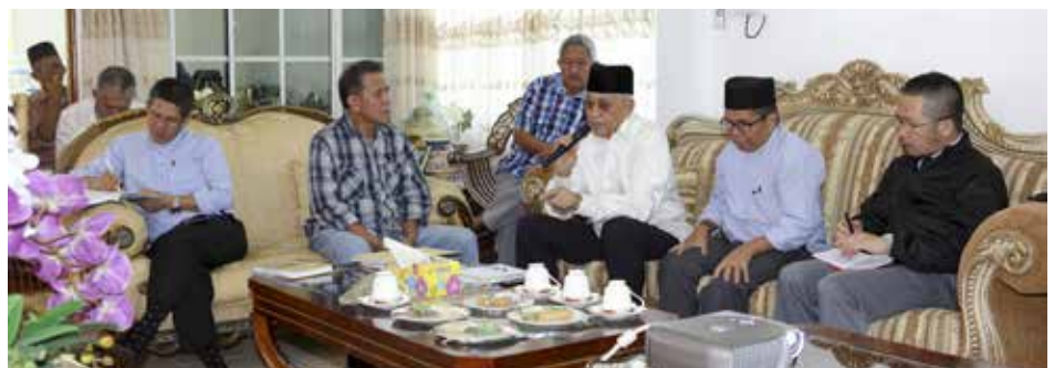
PROGRAM Sua Muka bagi Kampung Lambak 'A'.

P ROGRAM Sua Muka atau lebih dikenali Personal Contact yang dikendalikan oleh Jabatan Penerangan, Jabatan Perdana Menteri melalui Unit Hubungan Masyarakat, Bahagian Kenegaraan dan Kemasyarakatan diteruskan lagi pada hari Sabtu, 17 Ogos bagi Kampung Lambak 'A'.