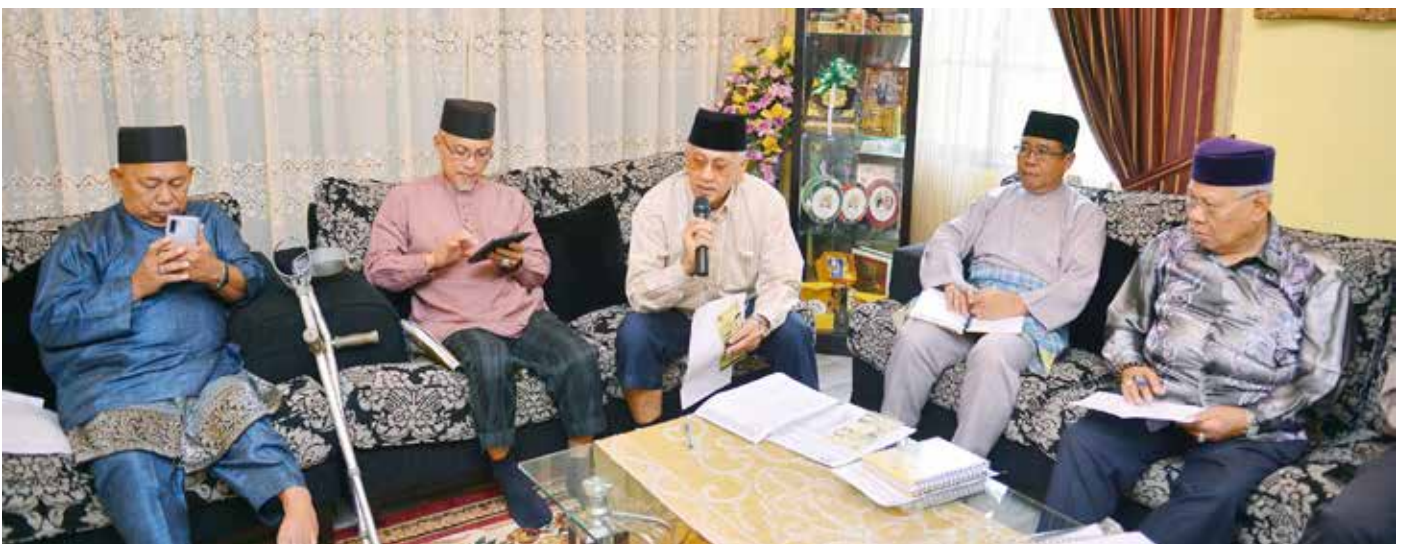
SUASANA pada Program Sua Muka.