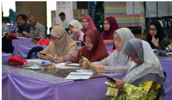
SUASANA penyampaian taklimat bagi peserta-peserta Program Masyarakat Bermaklumat bagi Kampung RPN Lumut, diadakan di Dewan Sekolah Rendah Sungai Tali, Lumut.

Antara isi taklimat yang dikongsikan dapat membantu para pencari pekerjaan untuk membuat permohonan dengan betul dan teratur.