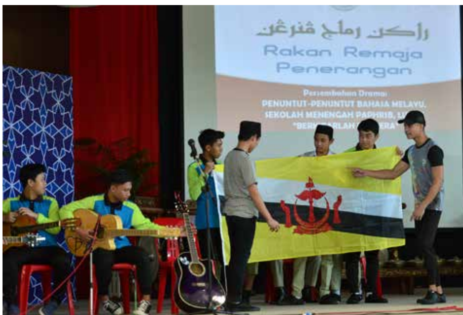
PERSEMBAHAN drama daripada para penuntut Bahasa Melayu, SM PAPHRSB Lumut.