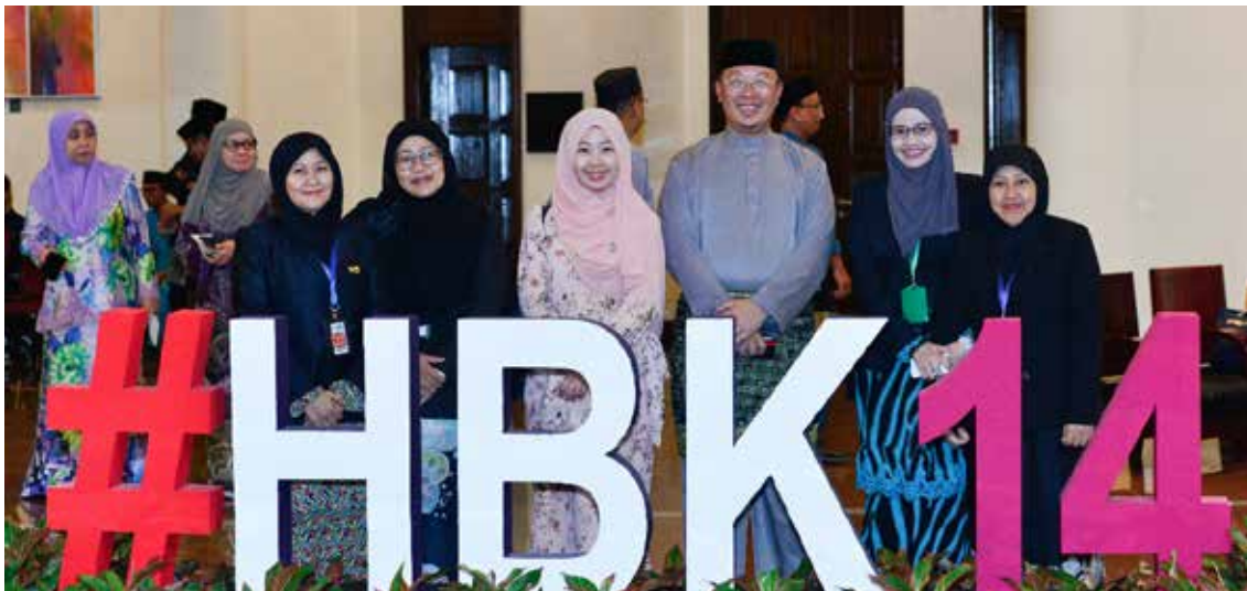
BERGAMBAR ramai semasa bertugas sempena Majlis Sambutan Hari Belia Kebangsaan di Dewan Persidangan Utama, Pusat Persidangan Antarabangsa, Berakas.