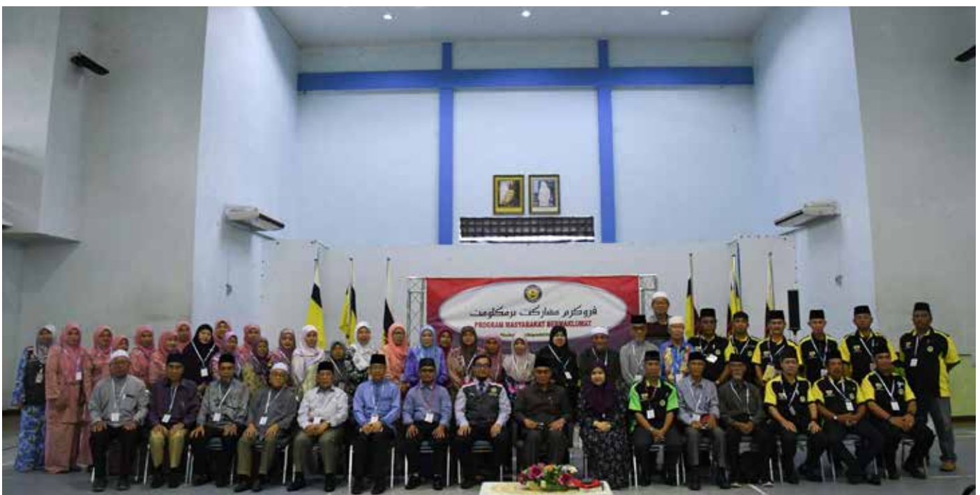
SESI bergambar ramai.