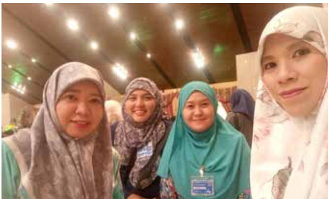
SUASANA di Istana Nurul Iman semasa kakitangan daripada Jabatan Penerangan terdiri daripada pemberita (sebelah kanan hujung dan kiri hujung) semasa membuat liputan sempena Sambutan Hari Raya Aidilfitri 1440H/2019M.

tertentu. Setiap pemberita dibahagikan kepada beberapa meja iaitu Meja A, Meja B dan Meja C. Penulisan mereka akan disemak dan disunting terlebih dahulu oleh penyemak dan penyunting dan seterusnya ketua meja akan menghalusi penulisan mereka mengikut meja yang telah ditetapkan sebelum dicetak.