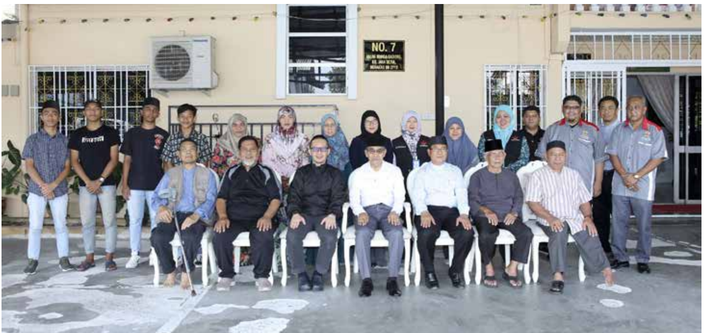
SESI bergambar ramai.

Pelbagai isu berkaitan mengenai penyediaan prasarana, kemudahan, hal ehwal keselamatan dan kebajikan awam turut dibangkitkan menerusi program berkenaan.