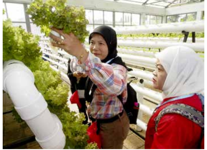
PARA peserta Program Masyarakat Bermaklumat bagi Kampung Sengkarai dan Kampung Penabai Kuala Tutong ketika mengunjungi RGC.