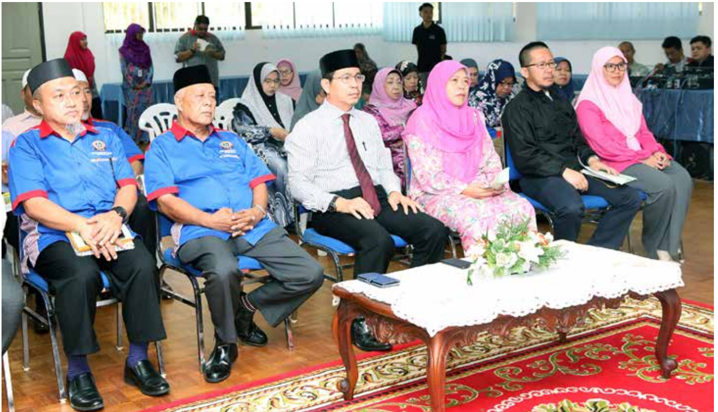
PROGRAM Masyarakat Bermaklumat bagi Kampung Lupak Luas/Kampung Turap Bau diadakan pada pada hari Selasa, 26 Mac 2019 di Bilik Serbaguna No. 1, Kompleks Sukan Sungai Kebun.

PMB ini diadakan di semua daerah dan dikendalikan oleh cawangan-cawangan Penerangan.