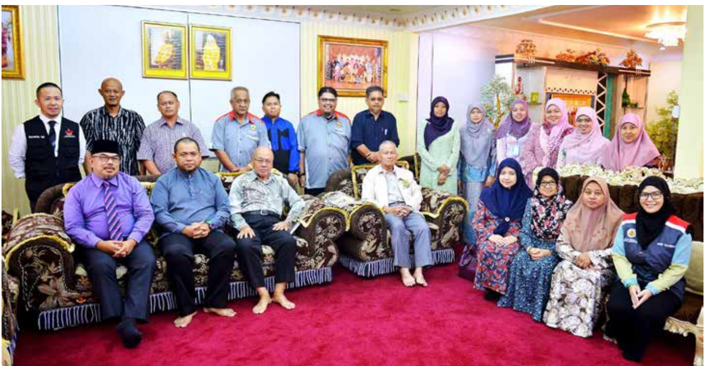
SESI bergambar ramai pada Program Sua Muka bagi Kampung Lambak 'B', Mukim Berakas 'A'.

Juga hadir, Ahli-ahli Majlis Perundingan Kampung (MPK) dan penduduk-penduduk kampung berkenaan.