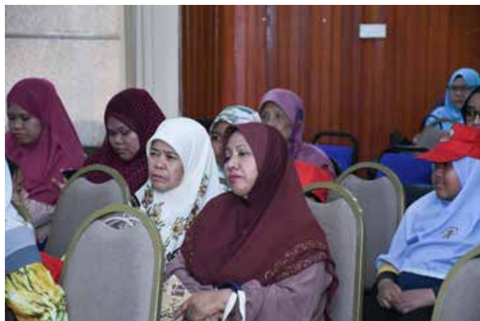
PARA peserta Program Masyarakat Bermaklumat (PMB) bagi Kampung Rancangan Perumahan Negara (RPN) Lumut, Mukim Liang ketika mendengarkan taklimat.

Seterusnya para peserta bertolak ke Kawasan Kemajuan Pertanian (KKP) Kampung Sinaut, di mana mendengarkan taklimat ringkas mengenai Industri