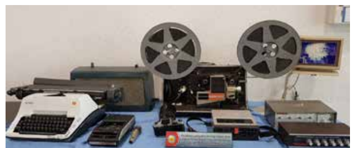
PERALATAN yang pernah digunakan oleh Jabatan Penerangan suatu ketika dahulu.

Penerangan, garis panduan menggunakan bendera dan logo-logo Sambutan Hari Kebangsaan Negara Brunei Darussalam dan sebagainya.