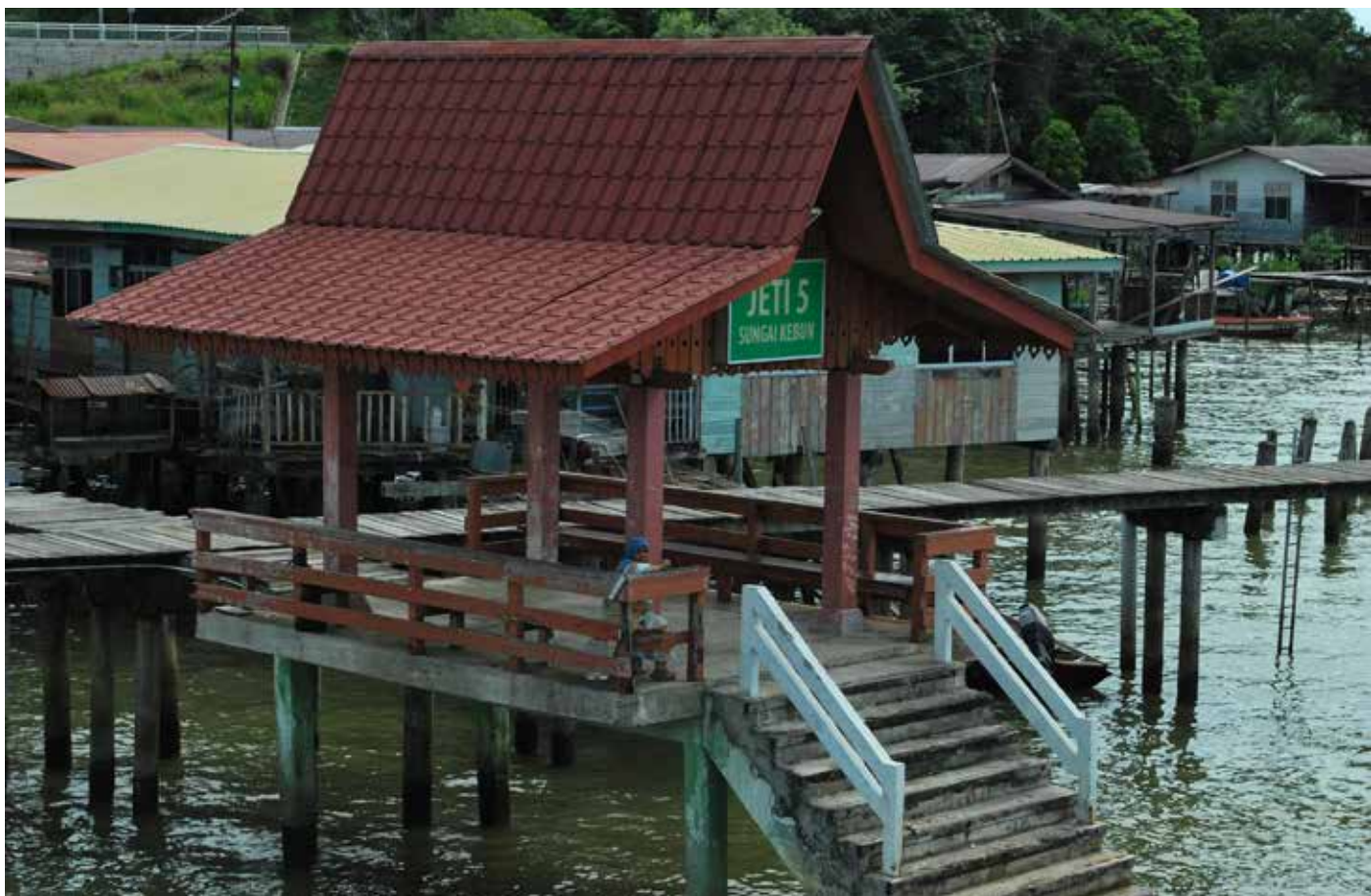
JETI merupakan salah satu kemudahan bagi penduduk Kampung Sungai Kebun untuk meneruskan perjalanan bagi mendapatkan perkhidmatan penambang.