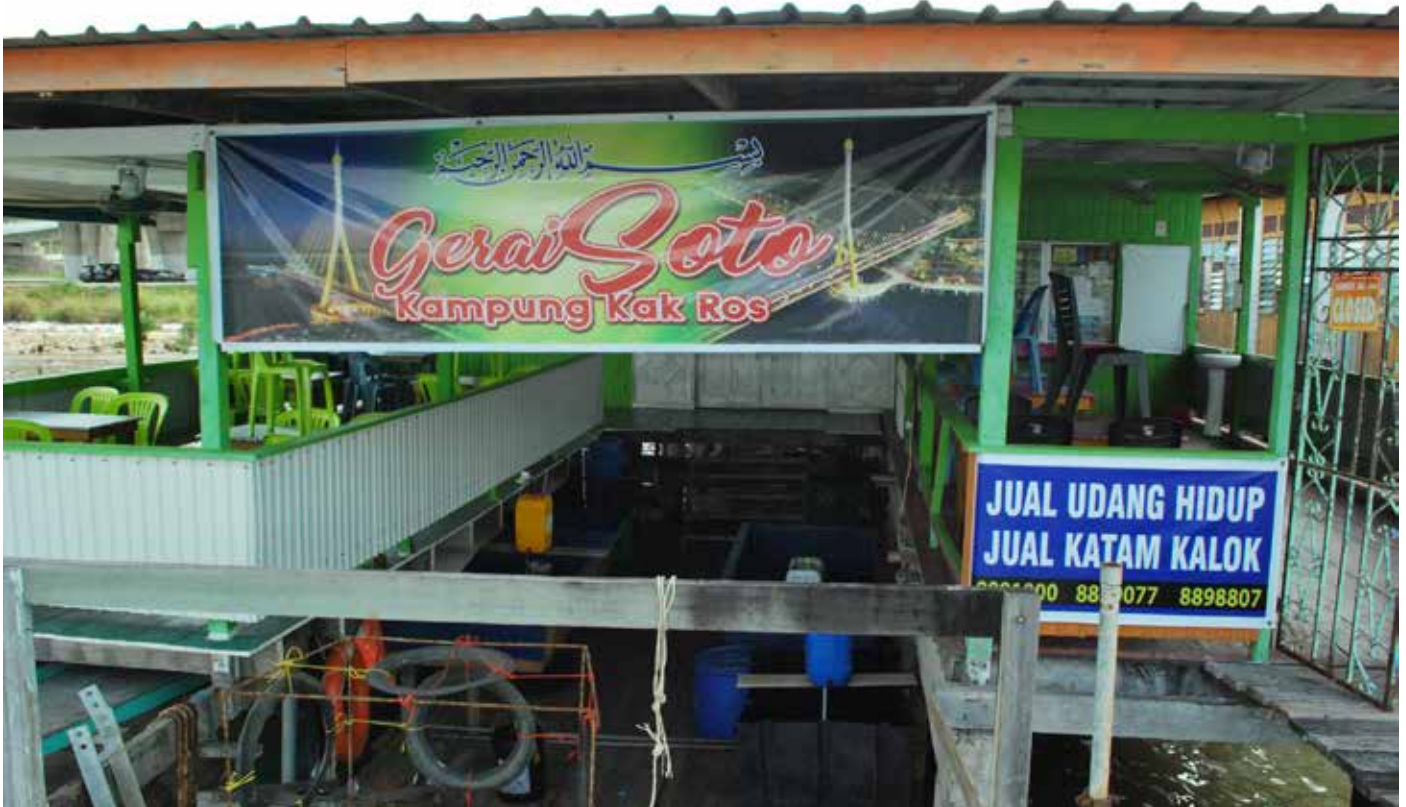
SALAH satu aktiviti perniagaan yang dilakukan oleh penduduk Kampung Sungai Siamas.

Namun dengan arus pembangunan maka sebahagian rumah yang ada di kampung tersebut terpaksa dirobohkan dan sebahagian penduduk dipindahkan ke perumahan kerajaan bagi pembinaan jambatan Sungai Kebun.