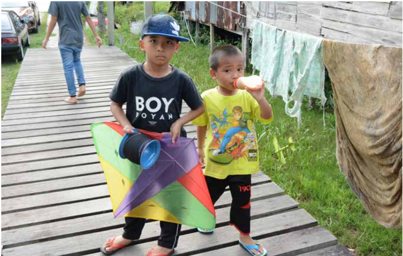
TRADISI permainan kikir atau layang-layang masih lagi diwarisi oleh penduduk Kampung Setia 'A' hingga ke saat ini.

Tidak sah jika kanak-kanak dahulu tidak bermain. Walaupun tidak ada teknologi canggih ketika itu, tetapi permainan dulu-dulu tetap menyeronokkan. Permainan dulu-dulu termasuklah gasing, kuit, kikir dan lain-lain lagi. Tetapi tidak dinafikan permainan ini semakin pupus kerana tidak diturunkan kepada kanak-kanak pada masa ini. Perasaan bangga terhadap permainan warisan ini tidak diwarisi dan dikhuatiri akan hilang ditelan arus zaman.