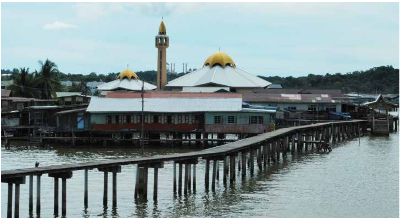
PEMANDANGAN Kampung Sungai Kebun pada masa ini yang dulunya dipadati oleh rumah-rumah penduduk.