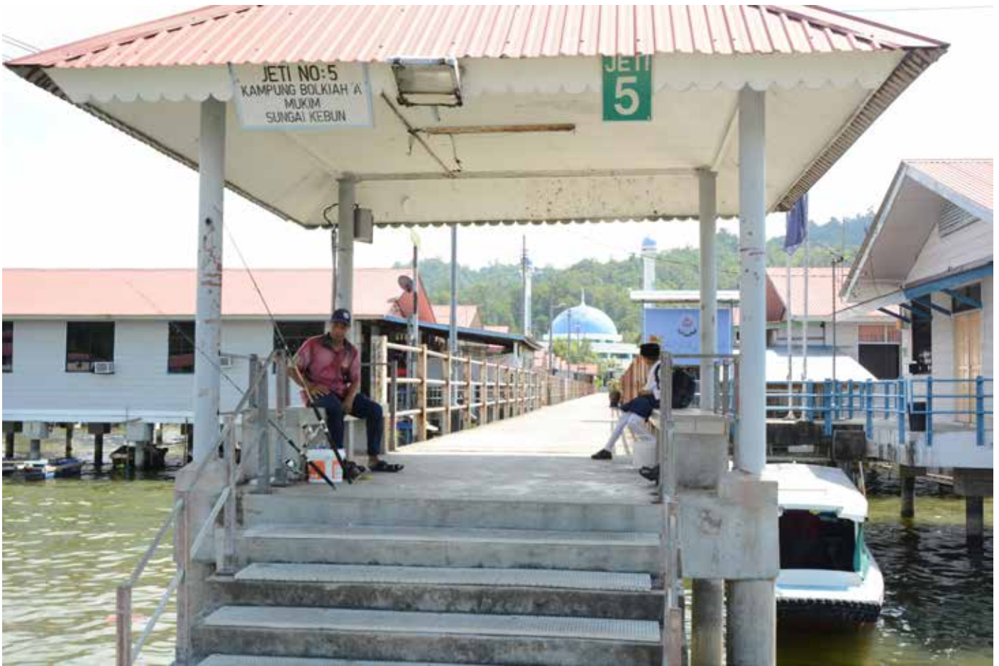
SALAH satu kemudahan penduduk Kampung Bolkiah 'A' ialah jeti tempat penurunan dan naik penumpang moto bot.

Pada kampung tersebut beberapa buah rumah telah digunakan sebagai Cawangan Pejabat Yayasan untuk kegunaan bengkel tenunan selain sebagai cawangan pos polis dan surau (pada masa ini digunakan sebagai tempat kelas dewasa wanita).