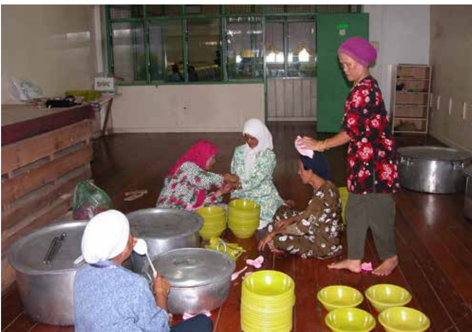
BERGOTONG-ROYONG , para wanita Kampung Setia suatu ketika dulu sedang sibuk bagi menyediakan makanan bagi Majlis Makan Sekampung (bertahlil).

Antara aktiviti yang sering diadakan setiap tahun ialah Majlis Makan Sekampung (majlis tahlil). Menurut Awang Haji Asli dulunya majlis tahlil tersebut diadakan di setiap rumah masing-masing akan tetapi, sekarang majlis tersebut telah diambil alih oleh pihak Masjid Perdana Wangsa Haji Mohammad untuk Majlis Makan Sekampung.