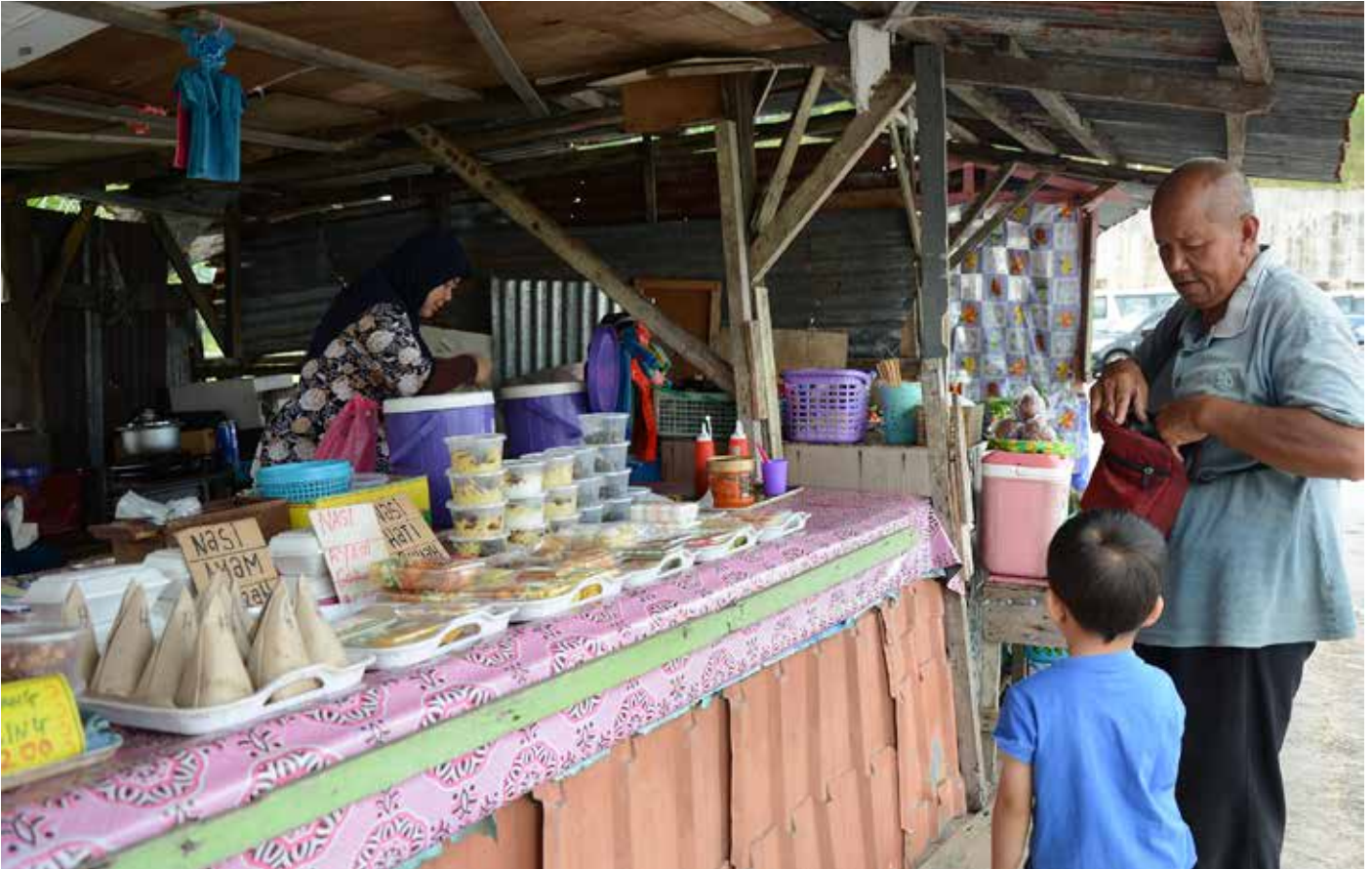
SEBAHAGIAN dari penduduk Kampung Sungai Kebun dan sekitarnya masih lagi aktif sehingga kini berjualan di hujung jalan Kampung Sungai Kebun (atas dan bawah).

H ujung jalan merupakan penghujung jalan raya di Kampung Sungai Kebun dari Jalan Lumapas. Ianya dijadikan sebagai tempat persinggahan dan tempat perhentian (pertemuan) untuk meneruskan perjalanan menuju ke pusat Bandar Seri Begawan melalui pengangkutan air (penambang) terutama bagi penduduk-penduduk dari kawasan Kampung Lupak Luas, Lumapas termasuk penduduk-penduduk dari Kampung Pengkalan Batu.