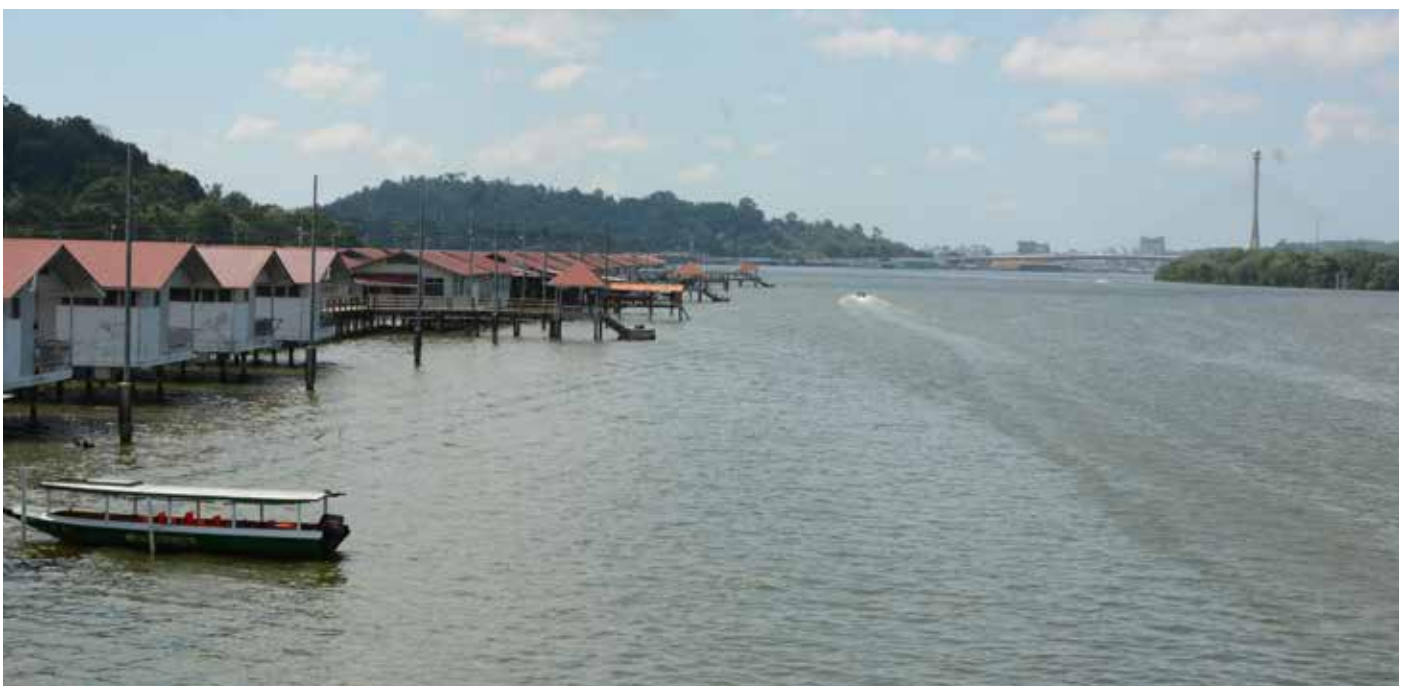
PEMANDANGAN Kampung Bolkiah 'A' di sepanjang Sungai Brunei dan berlatarbelakangkan Jambatan Raja Isteri Pengiran Anak Hajah Saleha di Kampung Sungai Kebun.

“Tujuan asal pembinaan rumah ini adalah bagi menyediakan perumahan kepada penduduk yang terlibat dalam kebakaran besar di Kampong Ayer pada tahun 1993 seperti di Kampong Peramu, Setia Pahlawan, Saba dan Lurong Sikuna termasuk Petagian, Kota Batu dan Sungai Matan.”