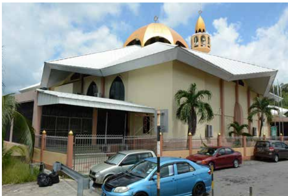
MASJID Al-Muhtadee Billah merupakan salah satu kemudahan bagi melakukan aktiviti keagamaan selain dulunya menjadi mercu tanda Kampung Sungai Kebun.

Masjid tersebut telah dibuka rasmi oleh Kebawah Duli Yang Maha Mulia Paduka Seri Baginda Sultan Haji Hassanal Bolkiah Mu'izzaddin Waddaulah, Sultan dan Yang Di-Pertuan Negara Brunei Darussalam pada hari Jumaat, 20 Zulkaedah 1407H bersamaan dengan 17 Julai 1987M bersempena