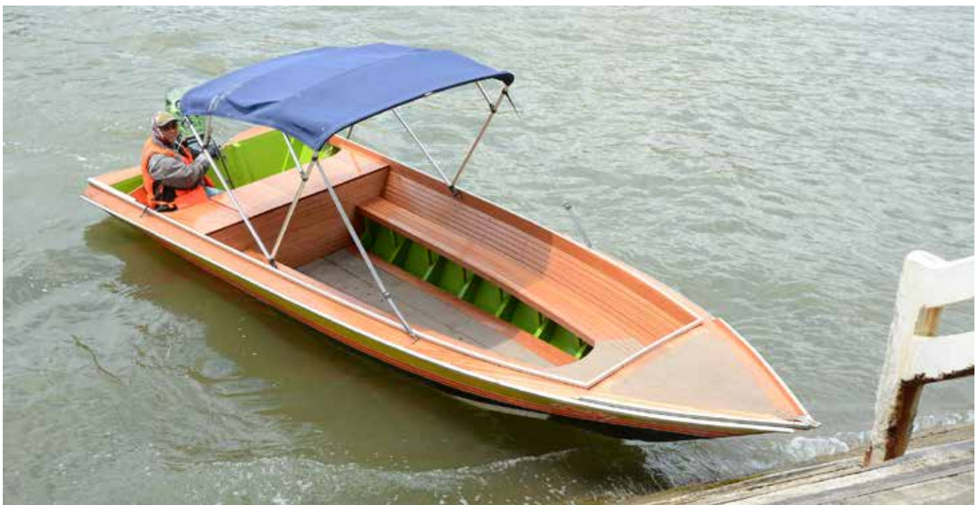
SALAH seorang penambang cuba untuk merapatkan perahunya ke salah sebuah jeti untuk mendapatkan penumpang.

Katanya, penambang dahulu tidak menggunakan sebarang permotoran moden untuk mengangkut penumpang. Penambang dahulu hanya menggunakan gubang atau sampan dan berkayuh dan berdayung sahaja untuk menyeberangkan penumpang. Dengan perubahan semasa, kemudiannya barulah penambang menggunakan perahu bermotor.