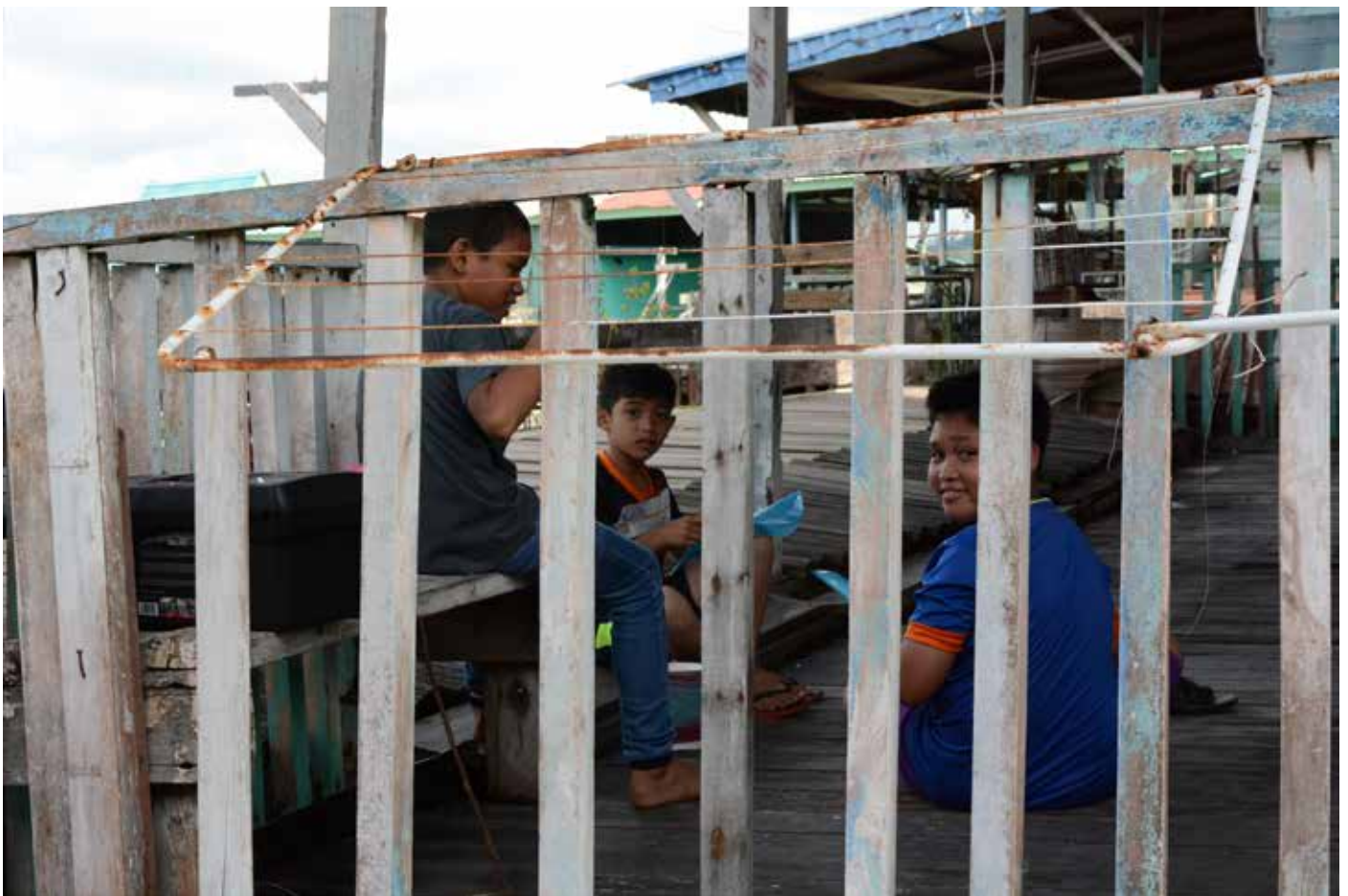
KANAK-KANAK bermain di pantaran rumah merupakan suatu pemandangan yang lazim dilihat di Kampong Ayer suatu masa dulu.

Tempat ini dipilih kerana kedudukannya yang baik kerana mengadap matahari dan dipercayai rezeki pun murah. Apabila diperkenankan maka kawasan tersebut yang dipenuhi hutan bakau pun dibersihkan dan ditebas oleh orang kampung yang berhajat untuk membuat rumah di sana. Setelah selesai, masing-masing memilih tempat untuk membangun rumah yang diperbuat dari kayu. Rumah yang mula-mula dibina menggunakan tiang bulian, kulimpapa dan atapnya menggunakan daun.