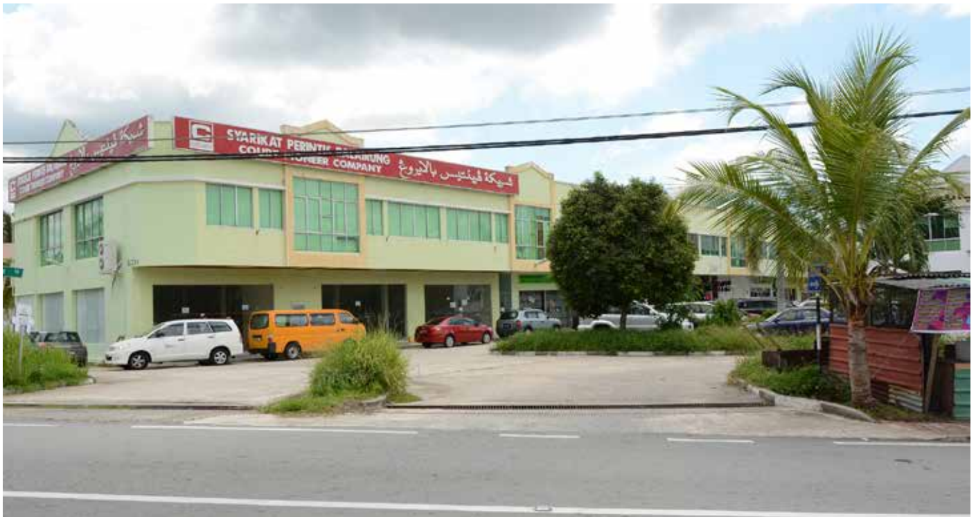
PUSAT komersial Kampung Sungai Kebun yang mana tapak asalnya dipercayai tempat permulaan asalnya Kampung Sungai Kebun.

Namun penduduk awal yang tinggal di kampung tersebut tinggal di tebing-tebing sungai yang mana sungai kebun pada masa tersebut belum mempunyai nama.