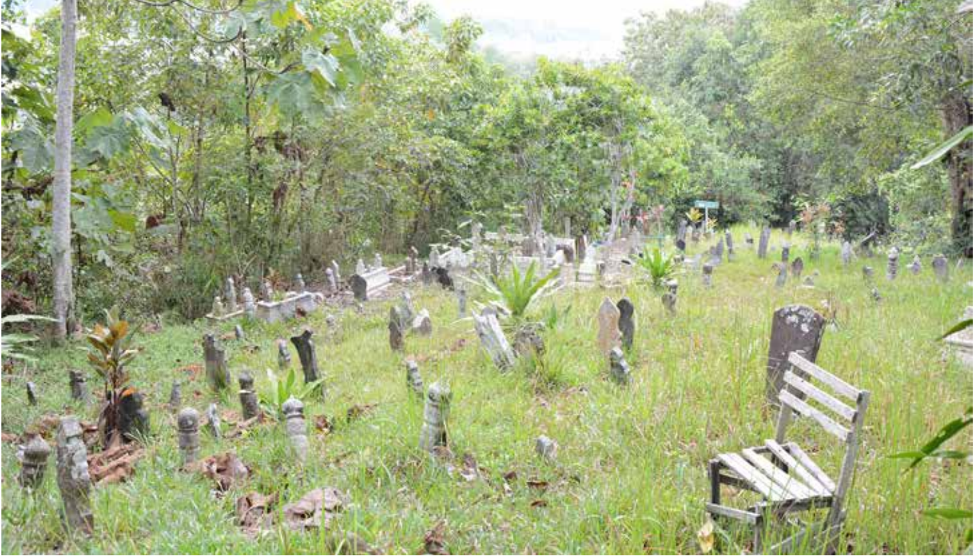
PERKUBURAN orang-orang Islam di tanah perkuburan Sungai Panga.