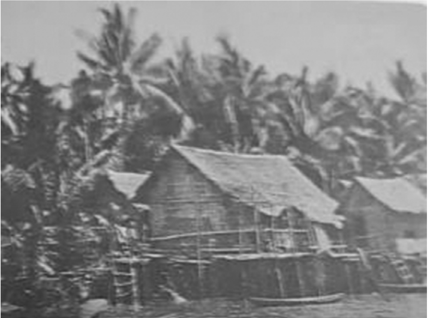
KAMPONG Ayer pada akhir tahun 1940-an. 3

Setiap nama sesuatu pasti ada sebab di sebaliknya mengapa nama itu wujud. Begitulah juga dengan nama-nama kampung yang terdapat di Negara Brunei Darussalam. Pelbagai kisah yang dapat kita dengari mengenai sejarah tertubuhnya sesebuah tempat tersebut. Pada lazimnya panggilan nama-nama untuk sesebuah tempat mempunyai peristiwa dan kejadiannya yang tersendiri dan berbeza-beza.