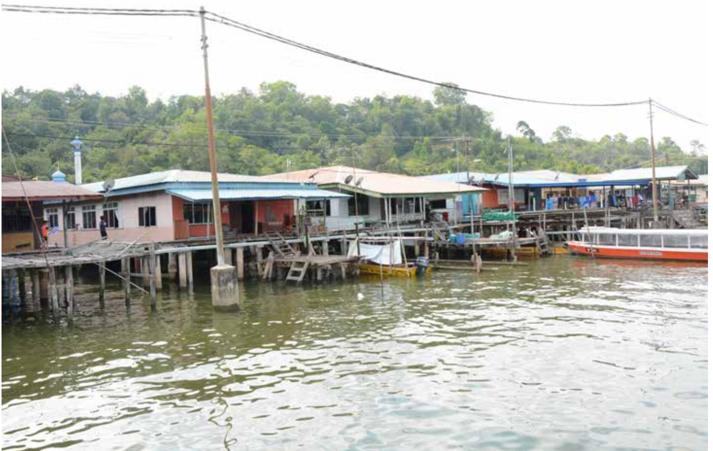
DERETAN perumahan yang masih kekal di Kampung Setia 'A'.