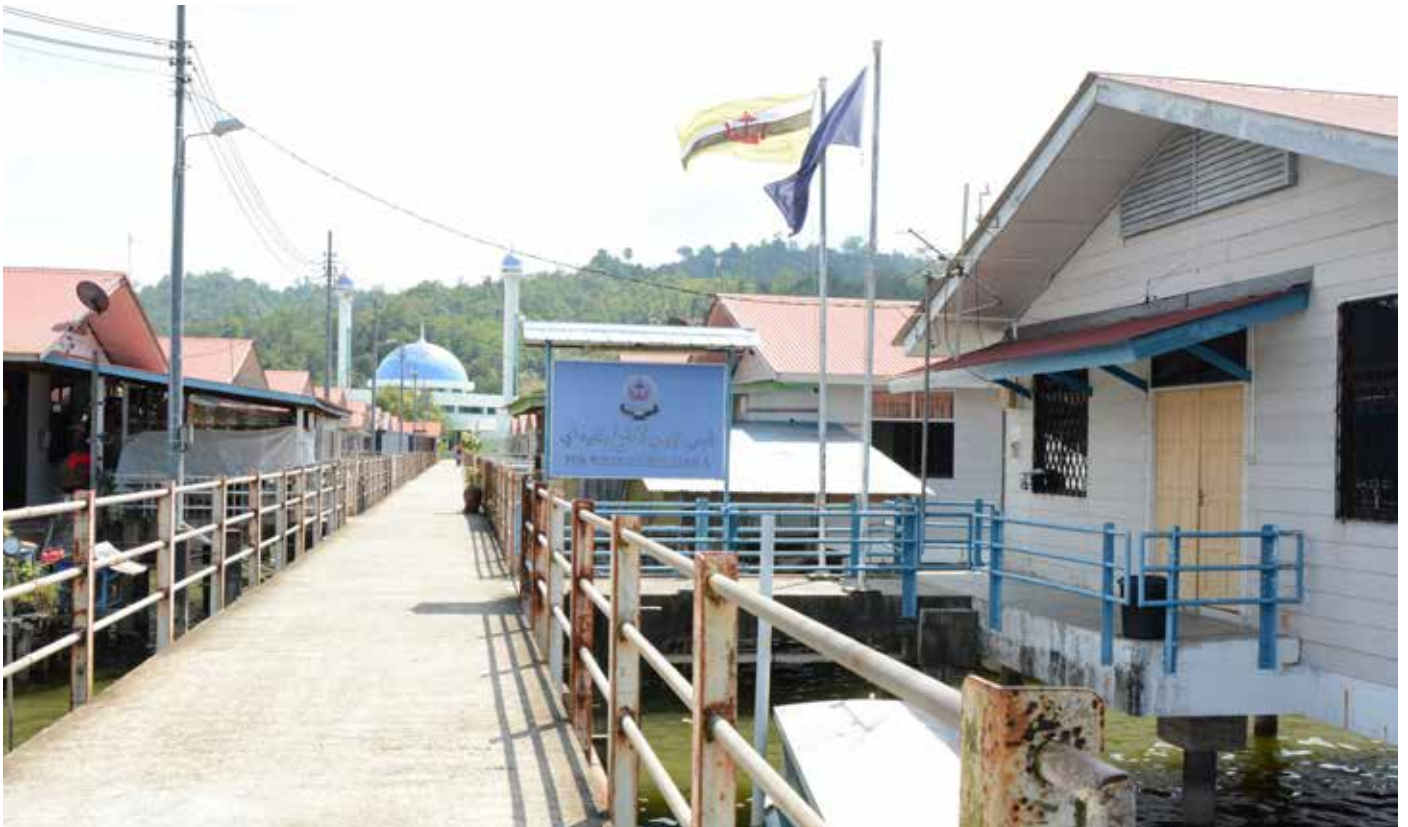
POS Polis turut dibina menjamin keharmonian dan keselamatan penduduk di sekitar Kampung Bolkiah 'A' dan Bolkiah 'B'.

Pada kampung tersebut beberapa buah rumah telah digunakan sebagai Cawangan Pejabat Yayasan untuk kegunaan bengkel tenunan selain sebagai cawangan pos polis dan surau (pada masa ini digunakan sebagai tempat kelas dewasa wanita).