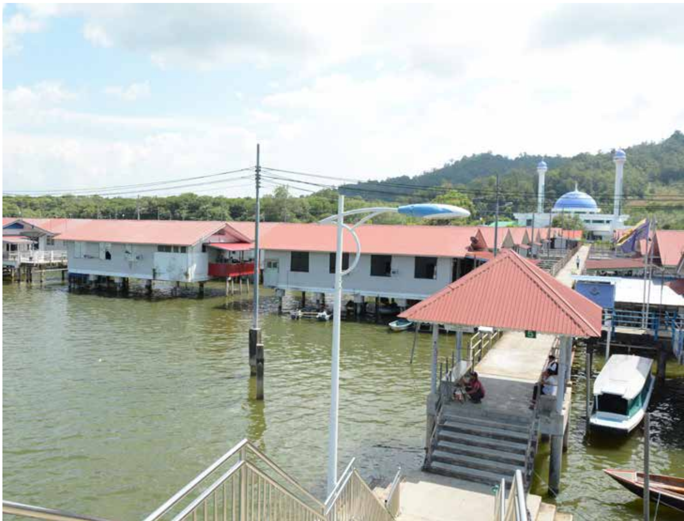
RUMAH-RUMAH di Kampung Bolkiah 'A' tersusun indah dengan berlatarbelakangkan Masjid Yayasan Sultan Haji Hassanah Bolkiah.

Terdapat dua jenis perumahan telah disediakan oleh pihak Yayasan iaitu kelas 'A' dan 'B' yang berjumlah 226 buah rumah keseluruhannya dengan keramaian penduduk lebih seribu orang.