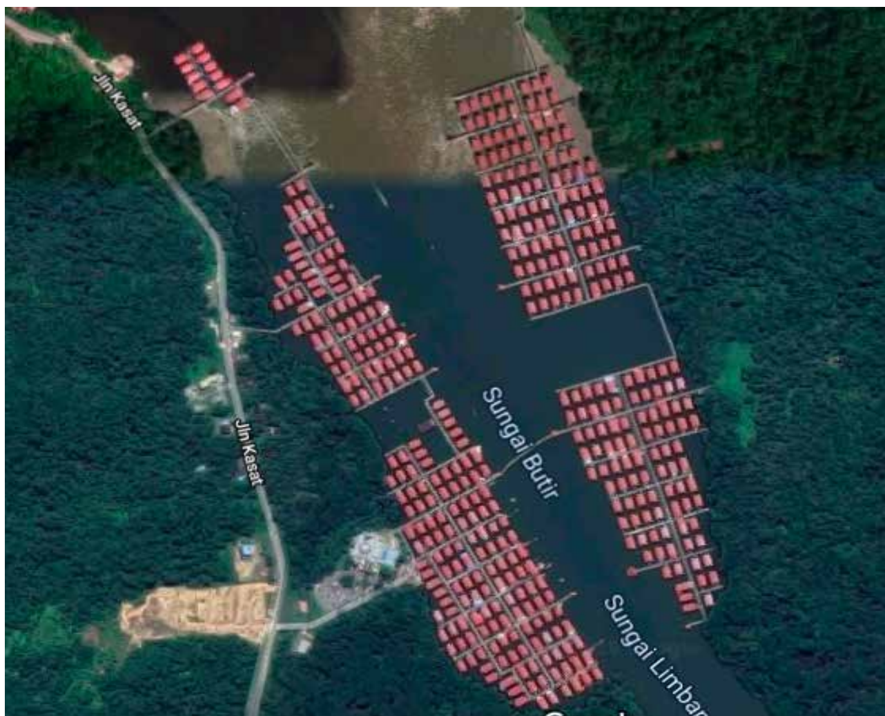
DERETAN rumah-rumah yang teratur di Kampung Bolkiah 'A' dan Bolkiah 'B' dari pandangan atas.

Kedua-dua kampung tersebut terkandung dalam pentadbiran Mukim Sungai Kebun.