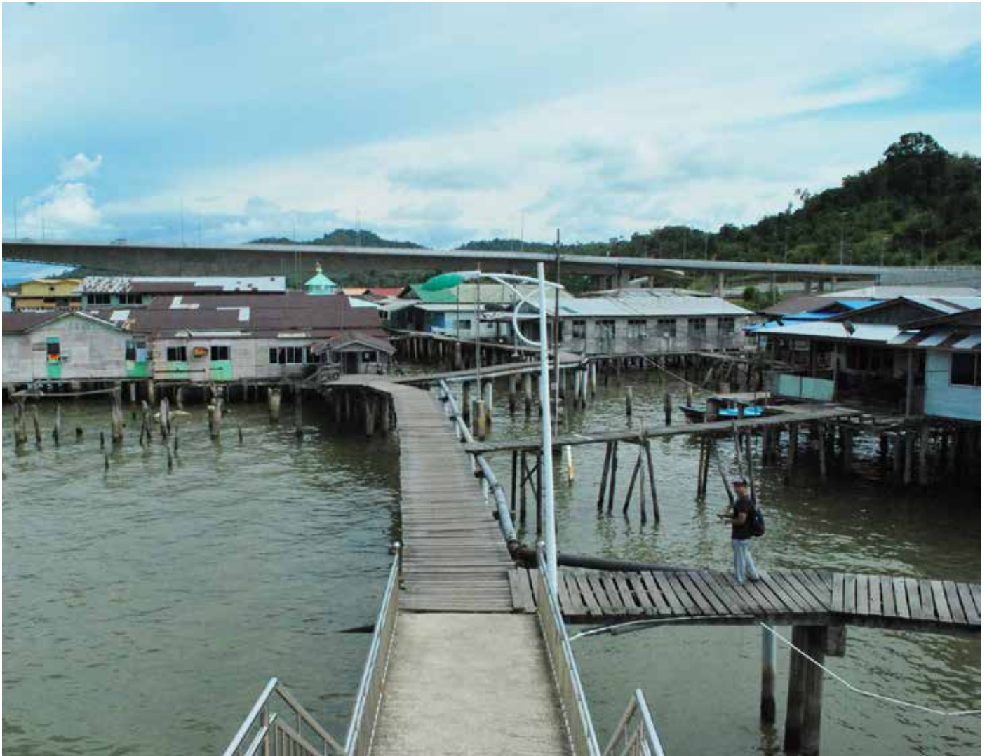
PEMANDANGAN rumah-rumah yang masih ada di dua buah kampung iaitu Kampung Ujong Klinik (kiri) dan Kampung Sungai Siamas (kanan).