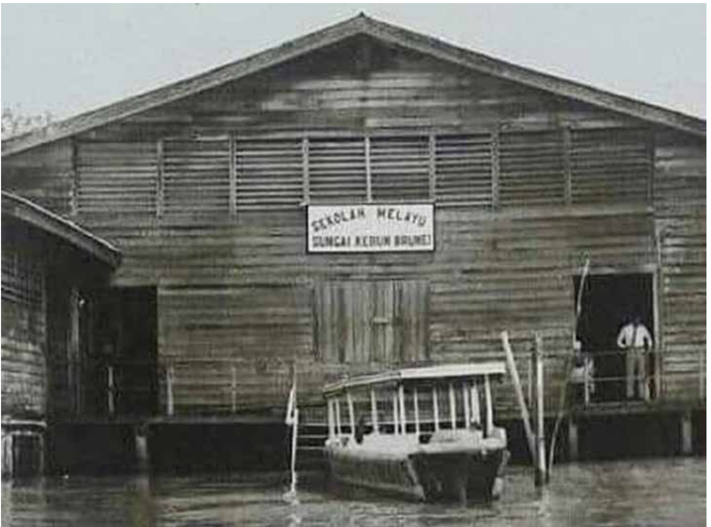
SEKOLAH Melayu Sungai Kebun pada suatu ketika dahulu.