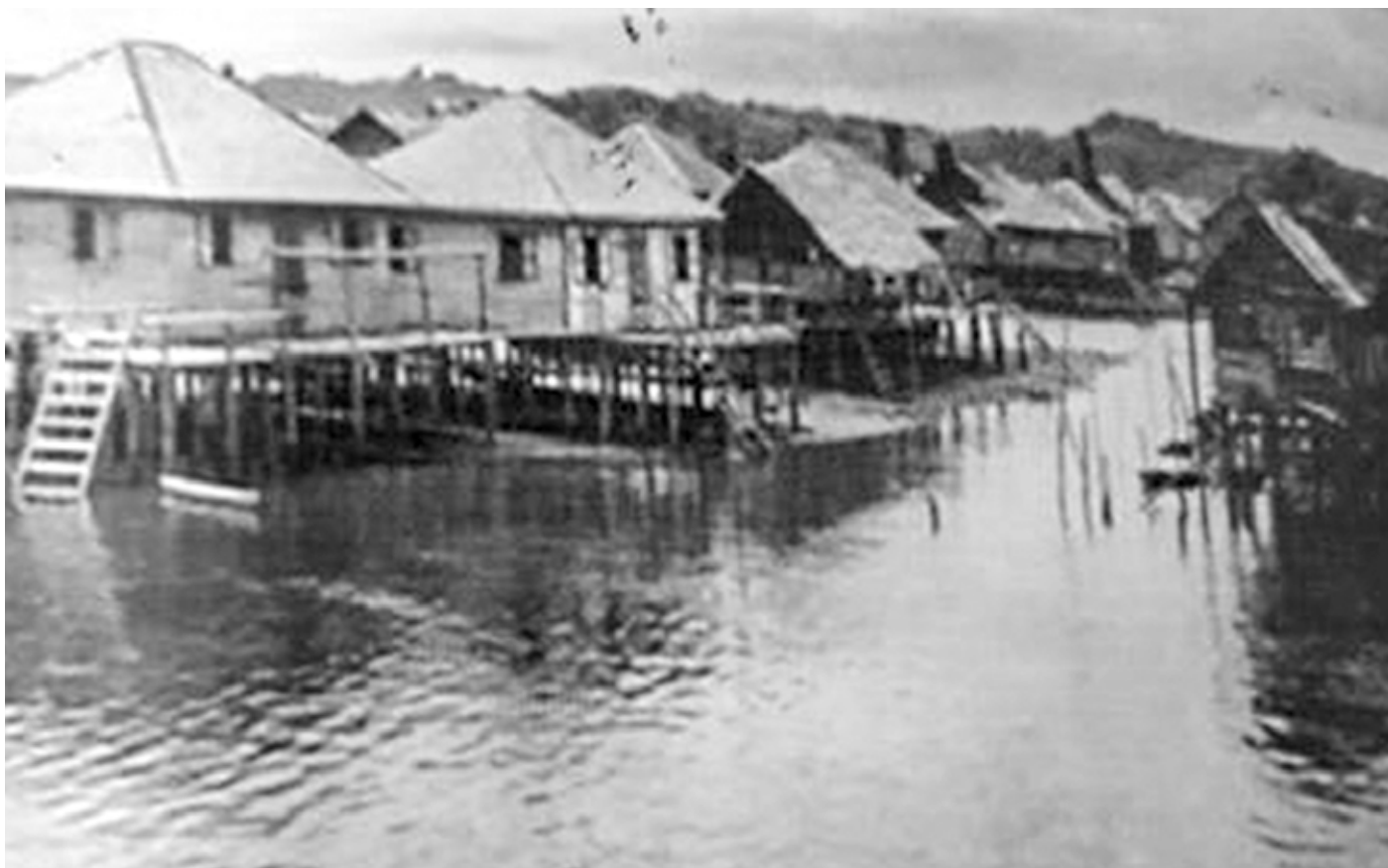
PEMANDANGAN Kampong Ayer pada tahun 1920-an. 2