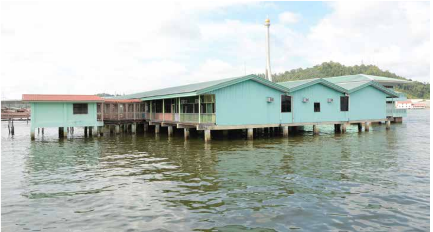
SEKOLAH Rendah Pehin Dato Jamil merupakan sekolah rendah yang terdapat di Kampung Setia 'A'.

Seperti kampung-kampung lain di Kampong Ayer, Kampung Setia tidak ketinggalan menerima kemudahan yang disediakan oleh Kerajaan Kebawah Duli Yang Maha Mulia Paduka Seri Baginda Sultan dan Yang Di-Pertuan Negara Brunei Darussalam seperti elektrik, air, telefon, masjid, sekolah, sekolah menengah, pail (jambatan) dan klinik (pada masa ini tidak lagi di bawah Sungai Kebun).