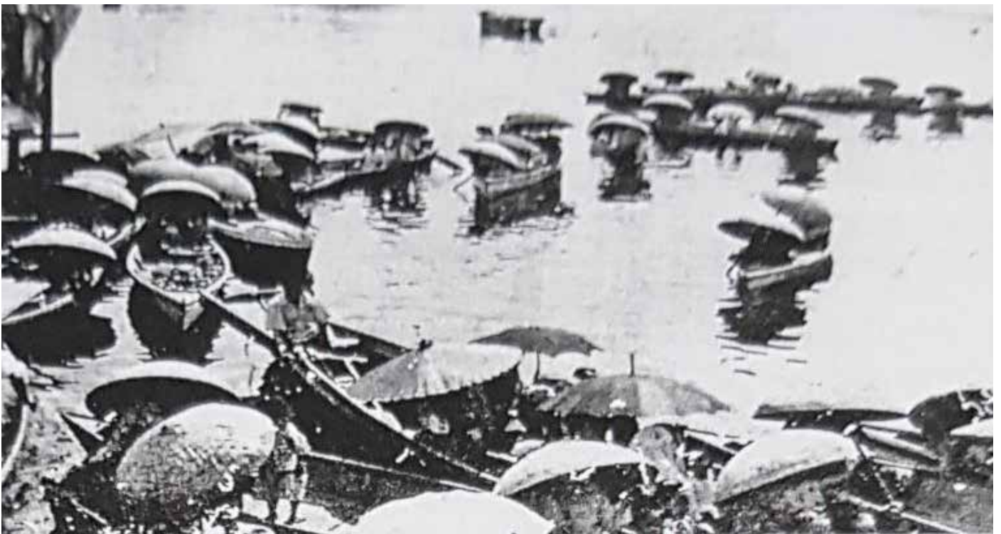
SUASANA semasa golongan padian menanti kepulangan para nelayan dari laut. 5

Manakala kaum wanita yang sudah berusia pada zaman dahulu pula hanya tinggal di rumah dengan melaksanakan pekerjaan-pekerjaan mengambil upah seperti membubul pukut, rambat dan bagi mereka yang mahir akan membubul tugu. Segelintirnya lagi akan menganyam tikar yang diperbuat daripada daun pandan, menuhur daun kajang untuk dijadikan dinding rumah dan menuhur daun atap. Kajang diperbuat daripada daun nipah yang sudah kering, menuhur atap daun nipah pula dilakukan menggunakan bamban yang kesemuanya boleh diperolehi dari hutan-hutan.