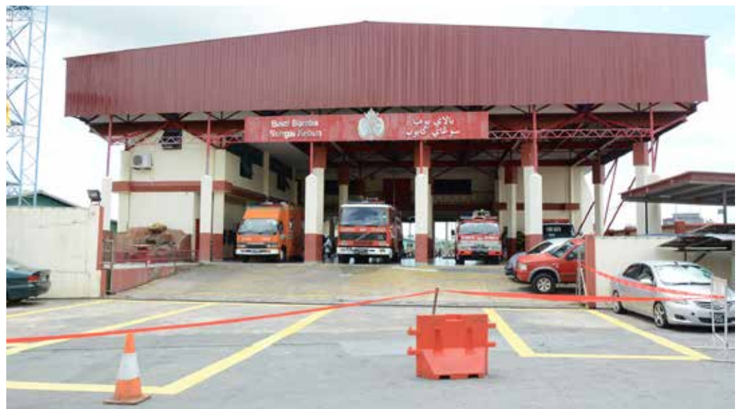
BALAI BOMBA Sungai Kebun merupakan antara kemudahan awam yang disediakan oleh pihak kerajaan di kawasan Mukim Sungai Kebun dan sekitarnya.

Seperti juga kampung-kampung lain, Kampung Sungai Kebun turut menikmati berbagai kemudahan awam yang disediakan oleh pihak Kerajaan Kebawah Duli Yang Maha Mulia Paduka Seri Baginda Sultan dan Yang Di-Pertuan Negara Brunei Darussalam seperti sekolah (menengah/rendah), masjid, klinik, balai bomba, telefon, elektrik, air, jambatan, jeti dan jalan raya.