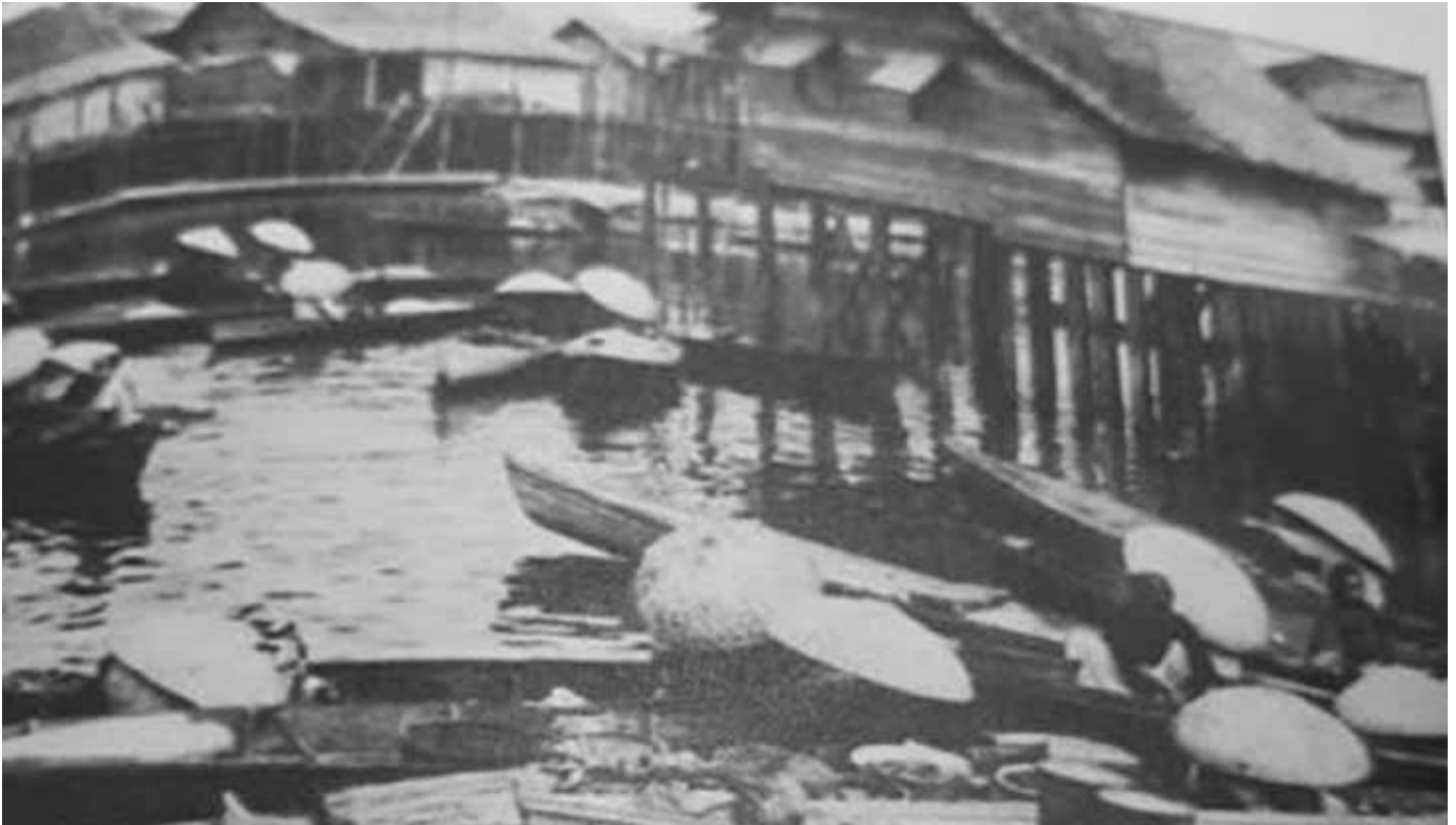
PADIAN merupakan pedagang wanita yang menjual berbagai barangan terutama berupa makanan seharian. 4