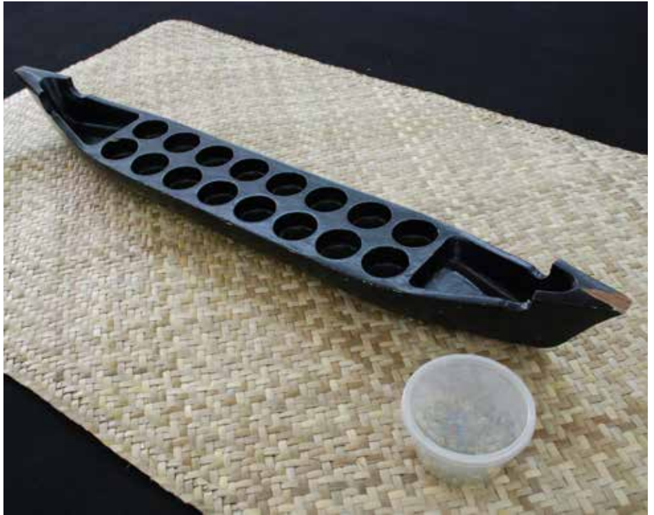
PERMAINAN congkak menjadi kesukaan bagi penduduk Kampong Ayer pada suatu ketika dahulu.

Di kalangan masyarakat Melayu Kampong Ayer dahulu, permainan tradisi bukan sahaja dimainkan oleh kanak-kanak malahan juga orang dewasa sebagai menguji kepintaran. Selain itu juga ia adalah sebagai hiburan serta untuk meraikan hari-hari penting seperti majlis perkahwinan dan pindah rumah. Permainan tradisi yang dimainkan adalah seperti carah, congkak, kikik, pasang, saluk-salukan dan simban. Permainan ini ada yang boleh dimainkan secara perseorangan dan ada yang mesti dimainkan secara berkumpulan. Pada zaman sekarang, permainan tersebut sudah jarang dimainkan sewaktu majlis-majlis perkahwinan mahupun pindah rumah.