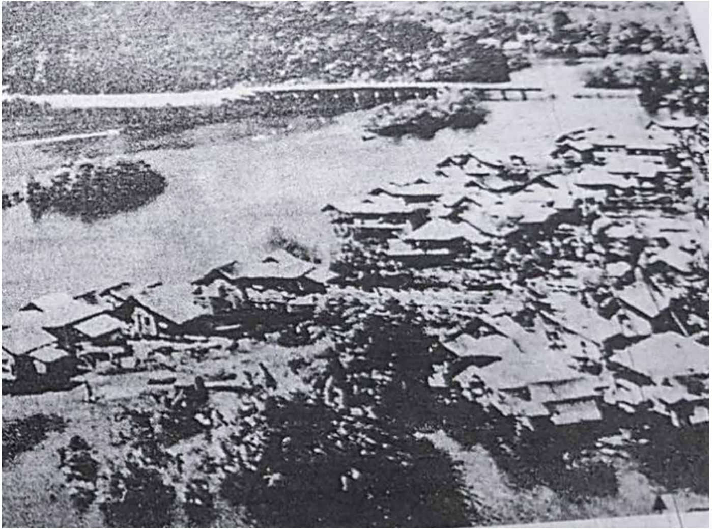
PEMANDANGAN Kampung Sumbiling Lama, Kampung Sumbiling Baru dan Jambatan Rangas pada tahun 1950. 1

K ampong Ayer merupakan kampung yang tidak asing lagi di Negara Brunei Darussalam. Apabila memperkatakan mengenai Kampong Ayer semua lapisan masyarakat mengetahuinya. Walaupun tidak mengetahui secara terperinci dan mendalam perihal sejarah Kampong Ayer, tetapi sedikit sebanyak mengetahui di mana kedudukan Kampong Ayer tersebut. Kampong Ayer adalah salah satu tempat yang bersejarah dan menjadi kebanggaan rakyat di Negara Brunei Darussalam. Mengenai Kampong Ayer sebelum ini juga pernah dijelaskan pada siri I dalam buku Mukim Tamoi Sejarah Kampung.