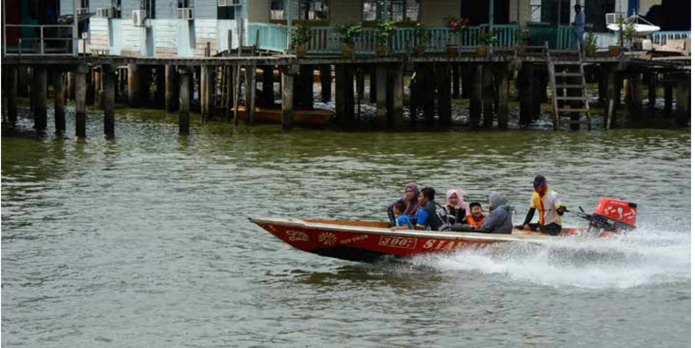
PERAHU tambang merupakan salah satu pengangkutan utama bagi penduduk di Kampong Ayer.