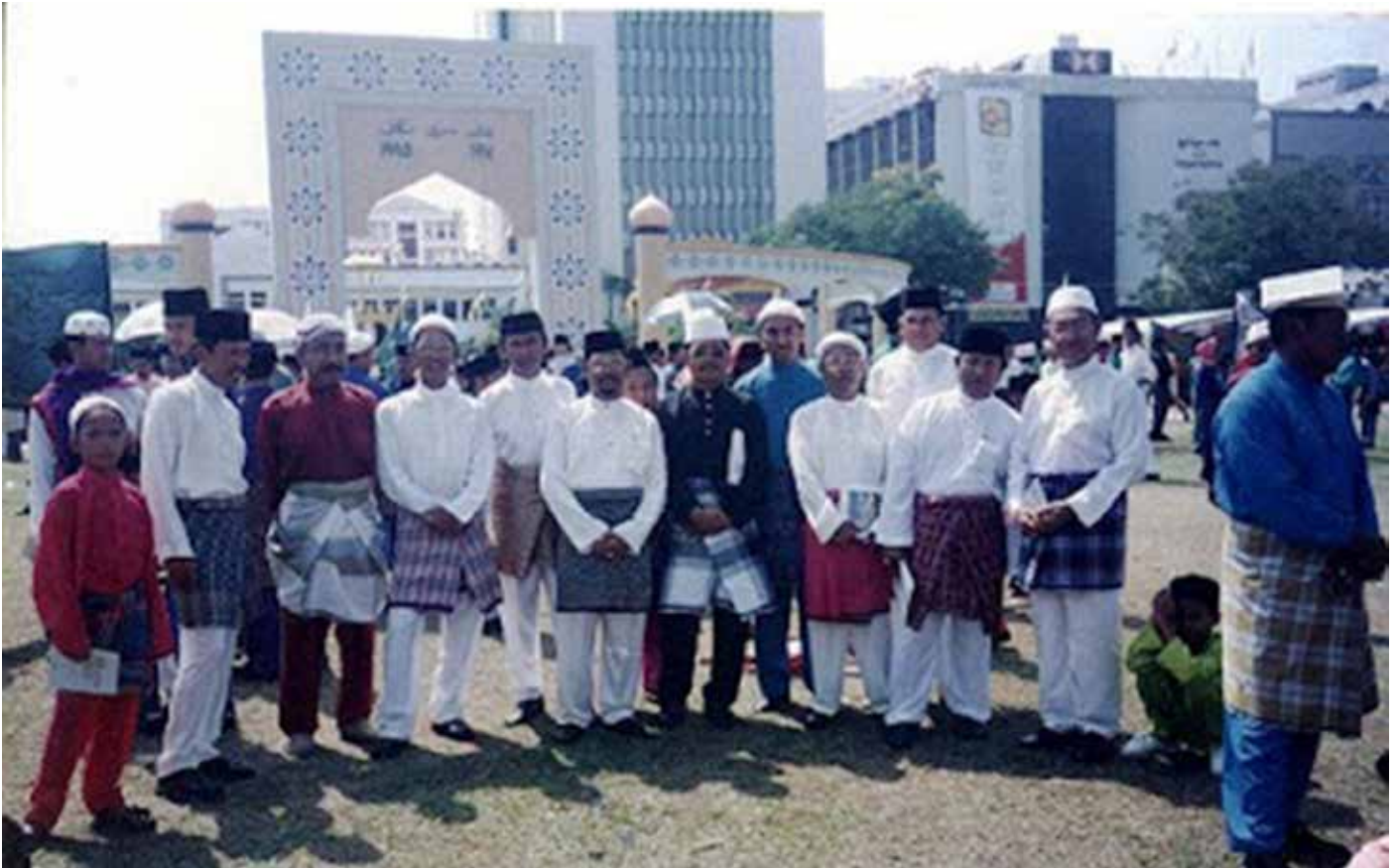
PENDUDUK Kampung Setia 'B' melalui Majlis Perundingan Kampung ketika giat menyertai Majlis Sambutan Maulud Nabi Muhammad Sallallahu Alaihi Wasallam suatu masa dulu.

D alam menggerakkan berbagai aktiviti, kedua-dua kampung iaitu Setia 'A' dan Setia B' tidak terlepas dari mempunyai Majlis Perundingan Kampung masing-masing.