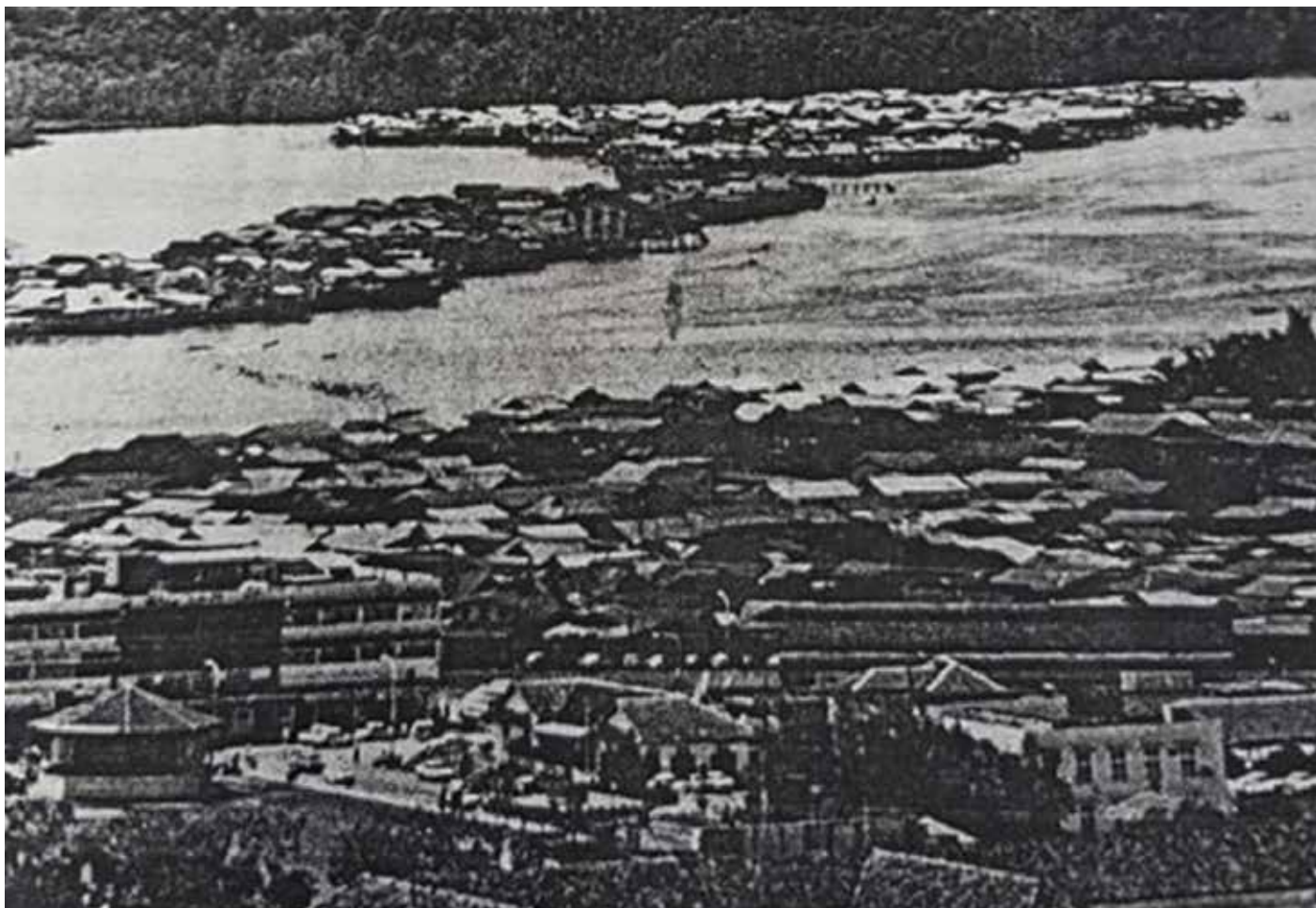
SEBAHAGIAN pemandangan Kampong Ayer suatu ketika dahulu.