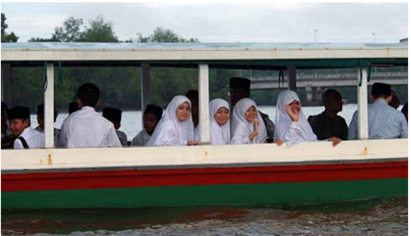
PEMANDANGAN sebegini merupakan kenangan nostalgia bagi sebahagian penduduk di Kampong Ayer yang kini semakin berkurangan.