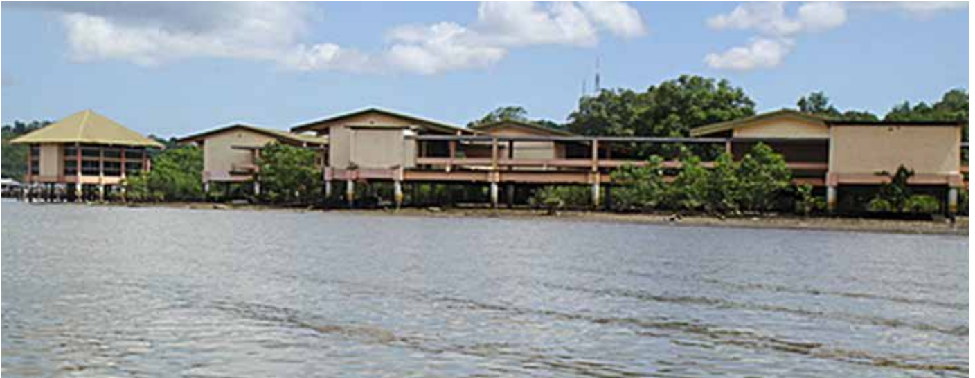
SEKOLAH Menengah Awang Semaun yang terletak di Kampung Sungai Kebun.