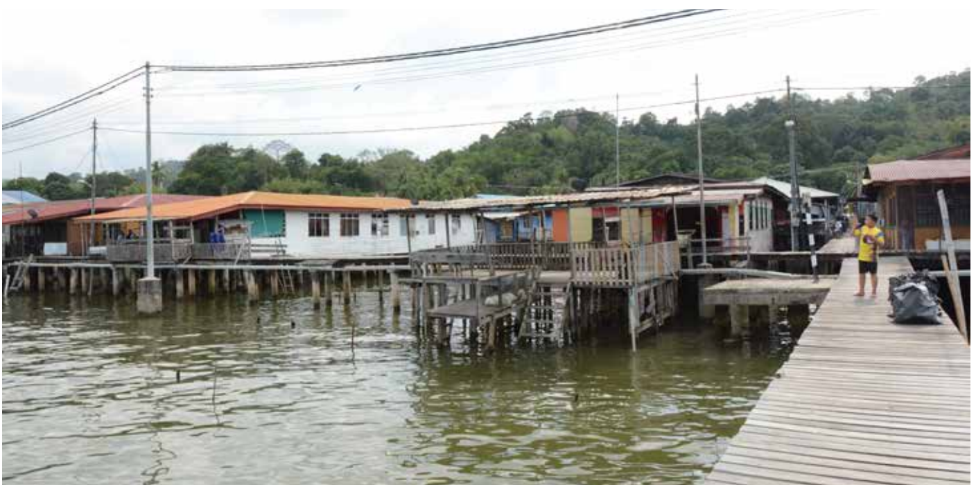
PEMANDANGAN seperti ini mengingatkan kepada masa-masa lalu di mana permainan kikir begitu meriah dimainkan di Kampung Ayer terutama pada tahun 70-an dan awal tahun 80-an.

Tidak sah jika kanak-kanak dahulu tidak bermain. Walaupun tidak ada teknologi canggih ketika itu, tetapi permainan dulu-dulu tetap menyeronokkan. Permainan dulu-dulu termasuklah gasing, kuit, kikir dan lain-lain lagi. Tetapi tidak dinafikan permainan ini semakin pupus kerana tidak diturunkan kepada kanak-kanak pada masa ini. Perasaan bangga terhadap permainan warisan ini tidak diwarisi dan dikhuatiri akan hilang ditelan arus zaman.