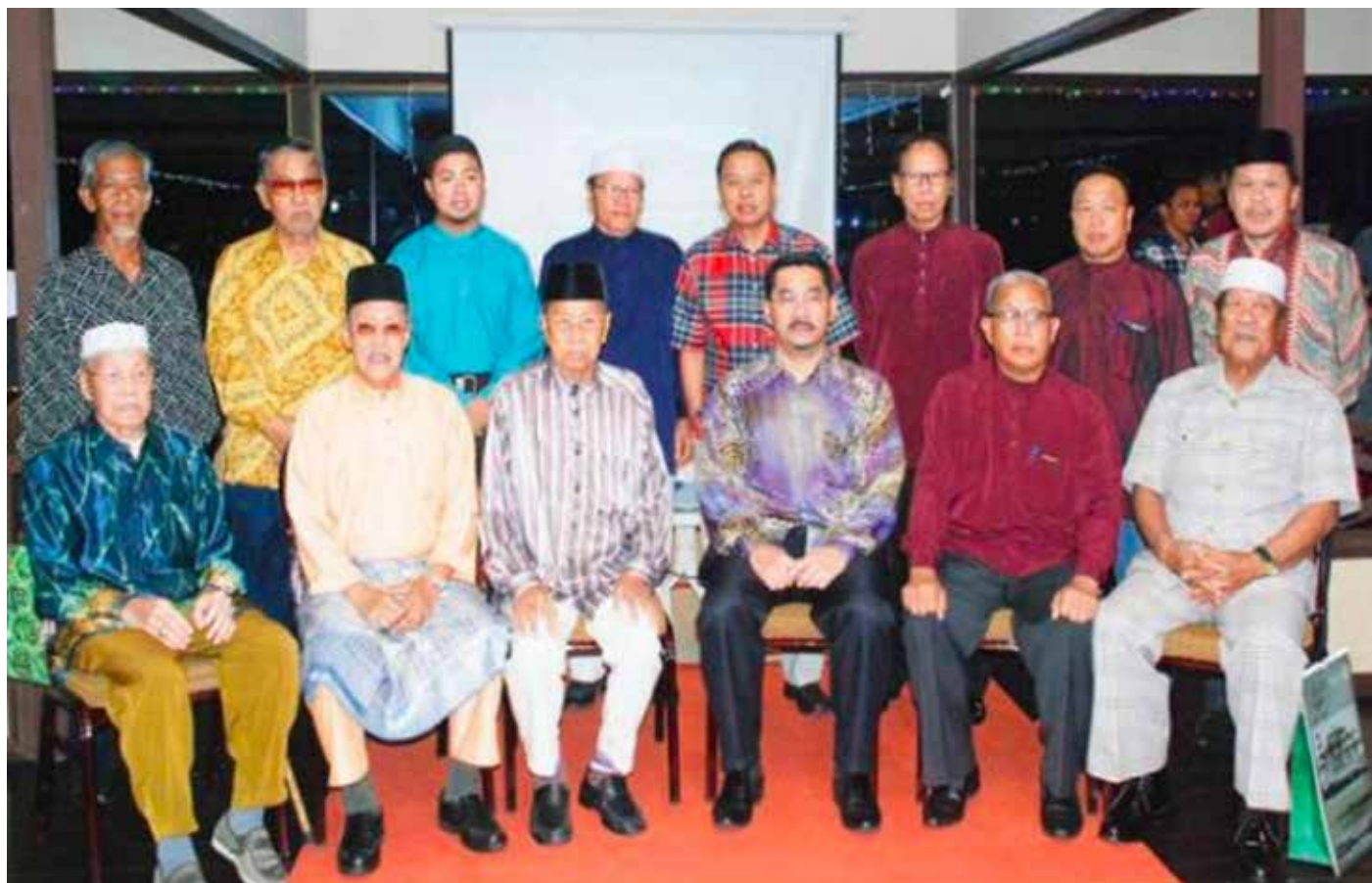
SALAH satu aktiviti yang pernah dikendalikan dalam mengenang dan menghargai orang-orang tua yang pernah berjasa selaku penerima Tokoh-tokoh Kampung Setia.

Mengikut cerita beliau lagi wujudnya Kampung Setia bermula di Kampung Saba. Pada masa itu, ramai yang mencari pekerjaan di Kampung Saba dengan mengabat, melintau ke Siarau dan Tubu-tubu. Pada awal tahun 60-an sudah ada orang-orang dari Saba menangkap ikan dan kemudiannya membangun rumah di Siarau. Apabila banyak rumah dibangunkan di sana maka penduduk ada pula yang membuat sulap di Kampung Rangau yang dulunya di bawah pemerintahan Brunei.