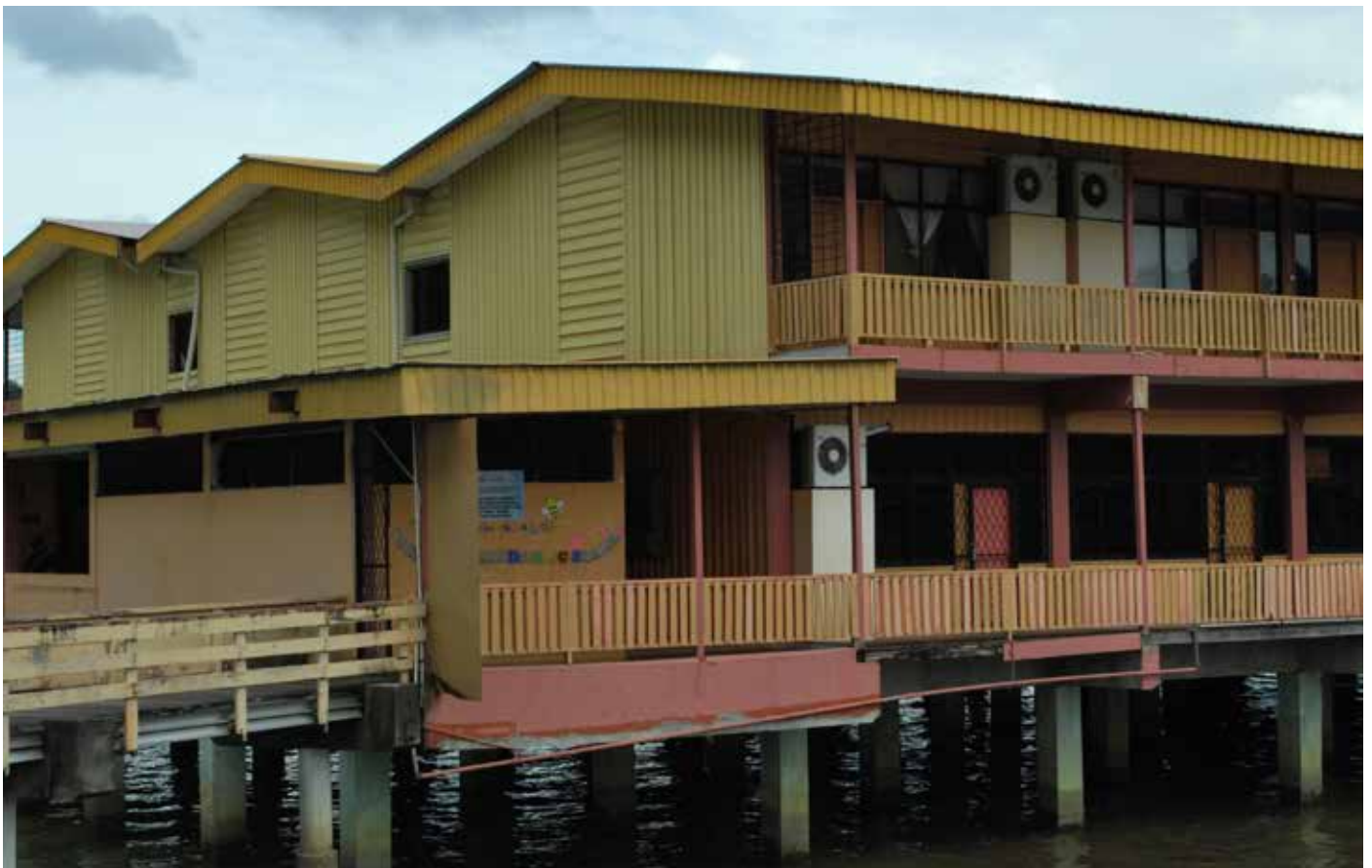
SEKOLAH Rendah Sungai Siamas.

S ekolah yang ada pada Kampung Sungai Siamas hingga kini ialah Sekolah Rendah Sungai Siamas yang bersempadan dengan Kampung Setia 'A'.